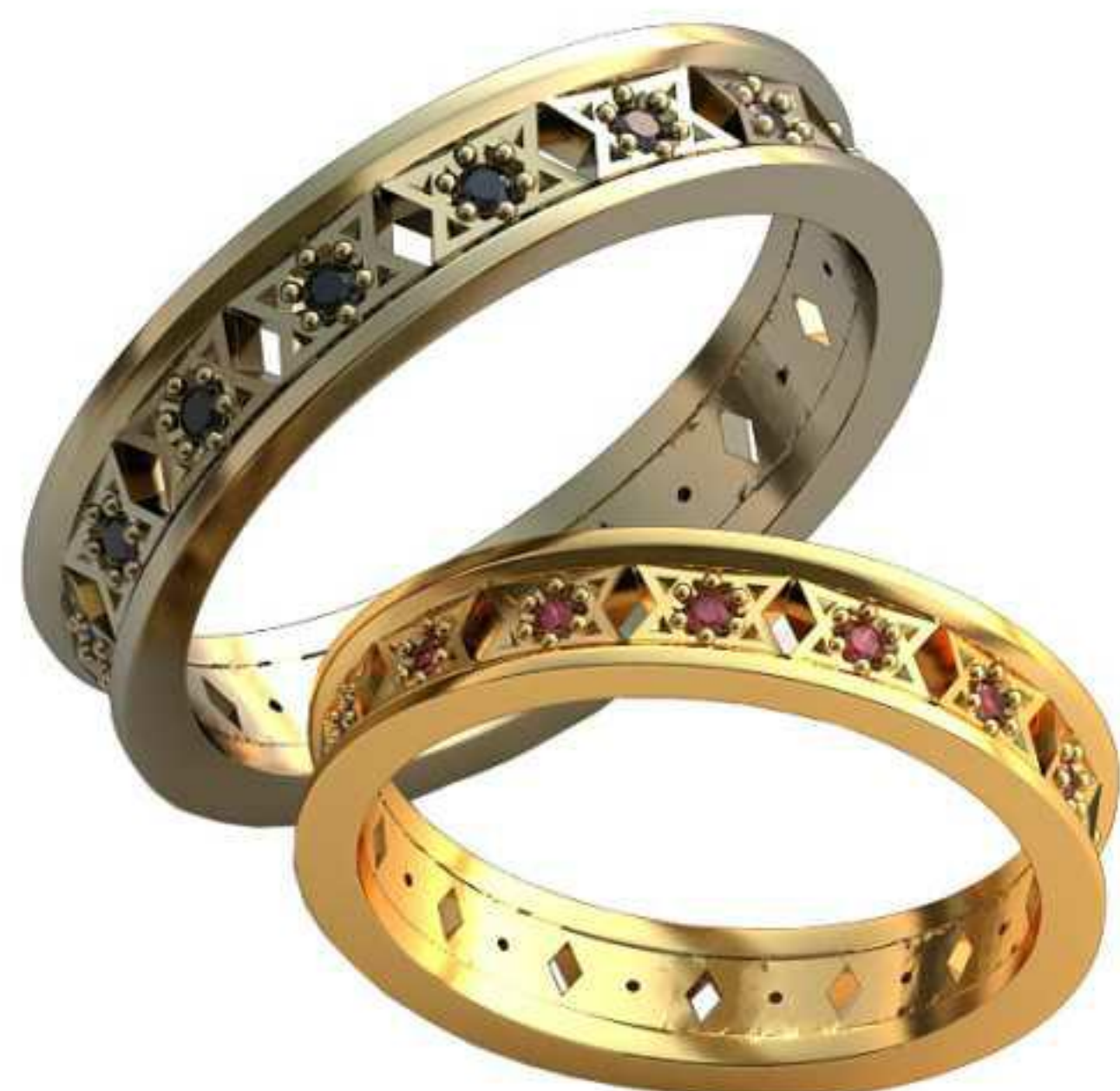
424ж/Р-17/Ш-4/Т-1,6/Кр 1.25-15шт./Вес-3,6 424м/Р-20,2/Ш-4,9/Т-1,9/Кр 1.45-15шт./Вес-5,9