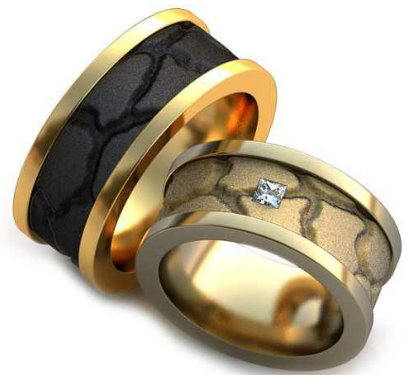
70ж/Р-17/Ш-9,3/Т-2,1/Пр 2.5x2.5-1шт./Вес-20,7 70м/Р-19,0/Ш-9,3/Т-2,4/Вес-26,3