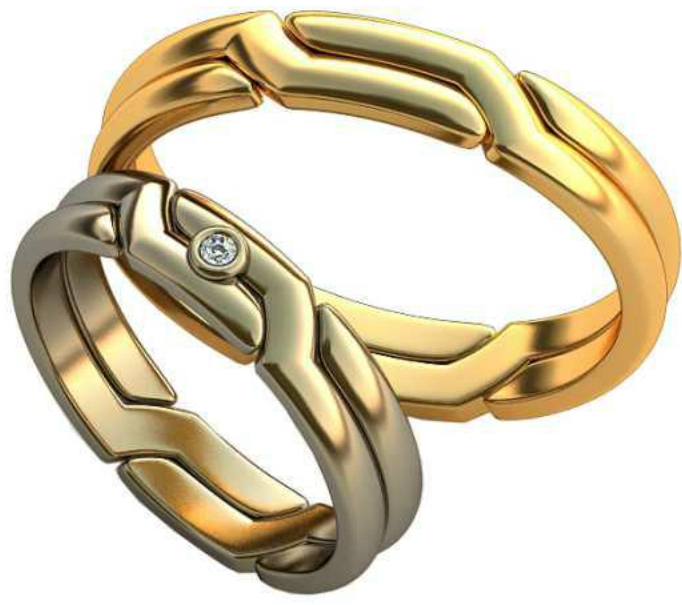
391ж/Р-18,5/Ш-4,7/Т-1,5/Кр 1.6-1шт./Вес-5,2 391м/Р-23,2/Ш-4,7/Т-1,9/Вес-7,9