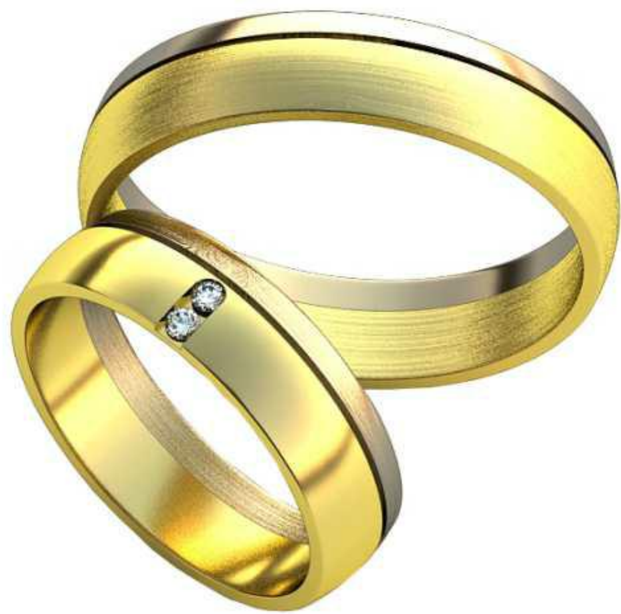
187ж/Р-16,2/Ш-5,0/Т-1,18/Кр 1.5-2шт./Вес-3,6 187м/Р-20,2/Ш-5,0/Т-1,3/Вес-4,8