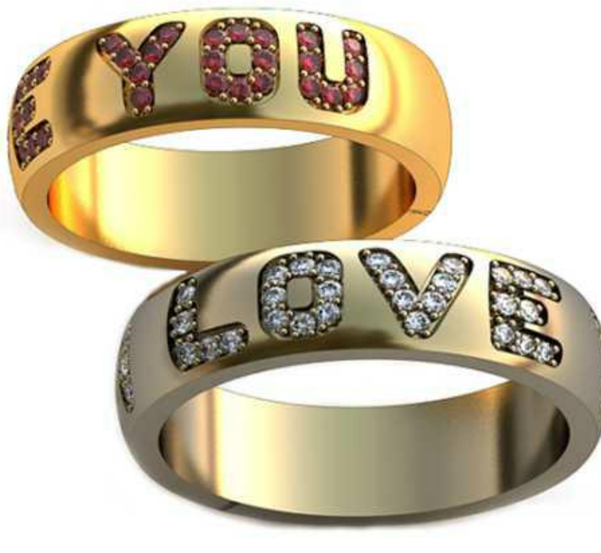
101ж/Р-19,0/Ш-5,5/Т-2,0/Кр 1.1-52шт./Вес-7,7 101м/Р-17,0/Ш-5,5/Т-1,7/Кр 1.1-52шт./Вес-6,2