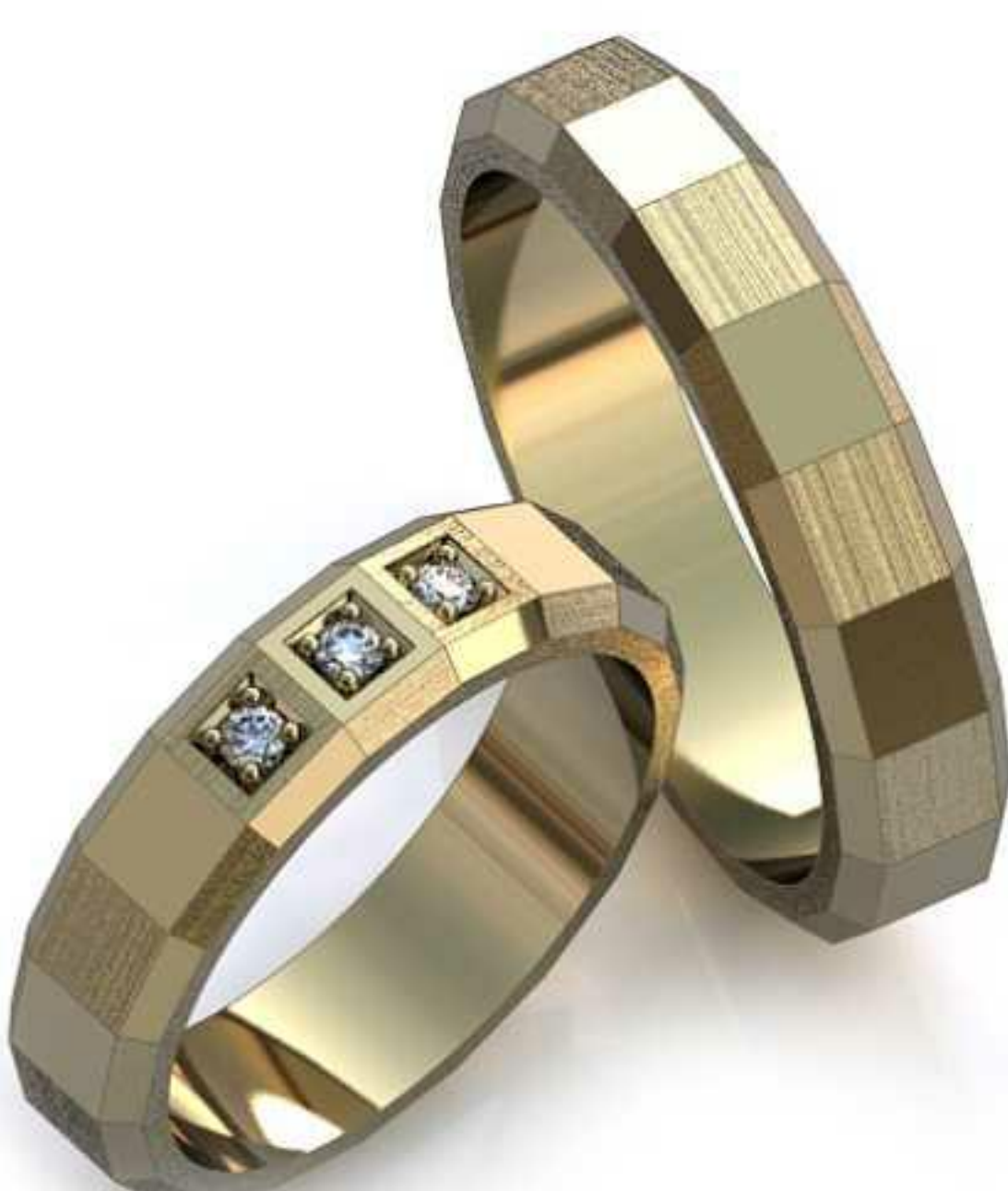
13ж/Р-17,3/Ш-5,0/Т-1,7/Кр 1.6-3шт./Вес-6,1 13м/Р-20,2/Ш-5,0/Т-2/Вес-8,5