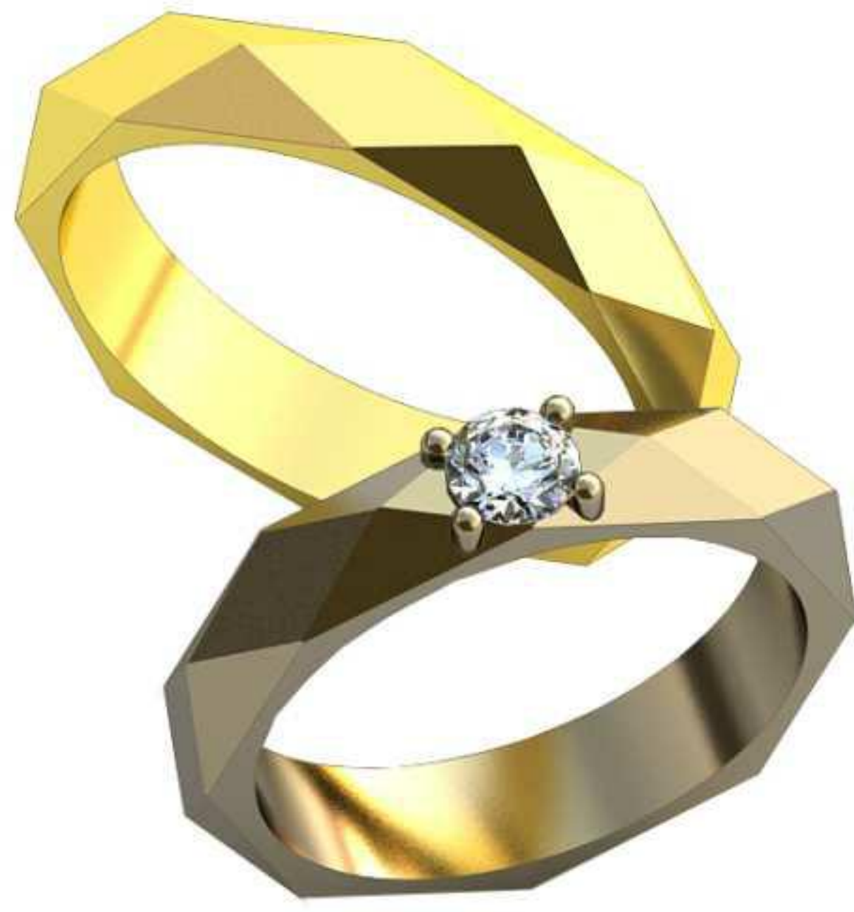
151ж/Р-16,7/Ш-4,0/Т-1,5/Кр 4.0-1шт./Вес-4,4 151м/Р-18,2/Ш-4,0/Т-1,4/Вес-4,5