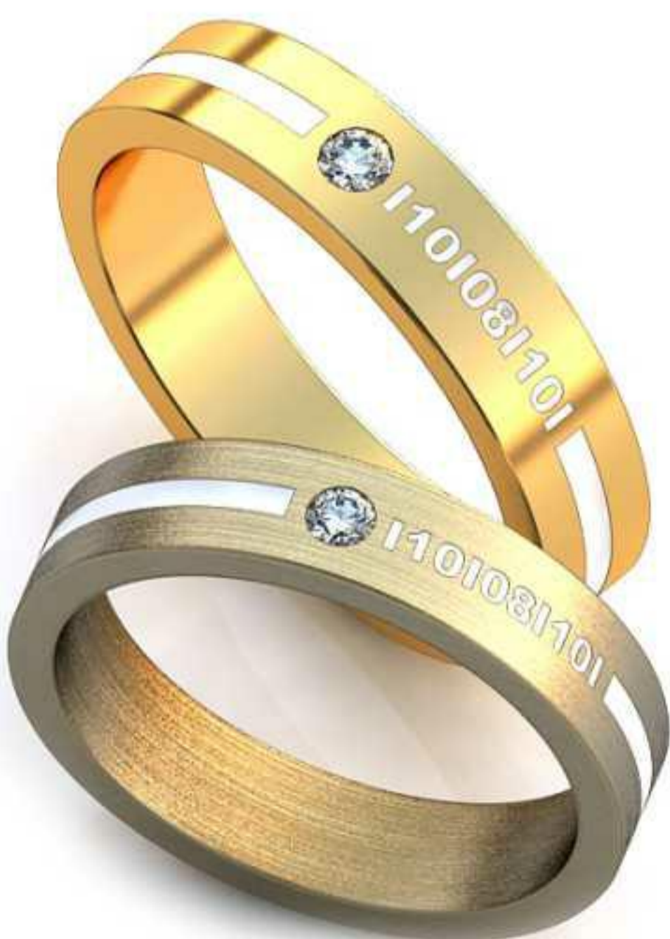
268ж/Р-16,0/Ш-4,0/Т-1,4/Кр 2.0-1шт./Вес-3,9 268м/Р-17,0/Ш-4,2/Т-1,5/Кр 2.2-1шт./Вес-4,7