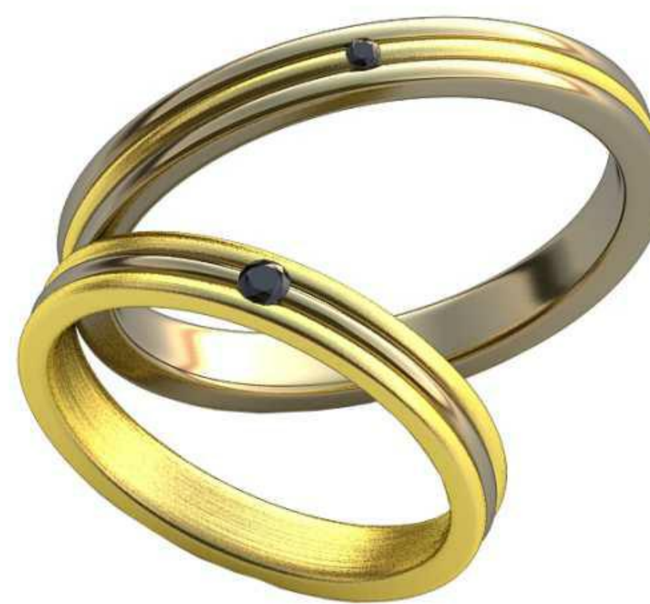
360ж/Р-17,0/Ш-3,0/Т-1,5/Кр 2.0-1шт./Вес-3,5 360м/Р-20,2/Ш-3,0/Т-1,8/Кр 1.4-1шт./Вес-5,1