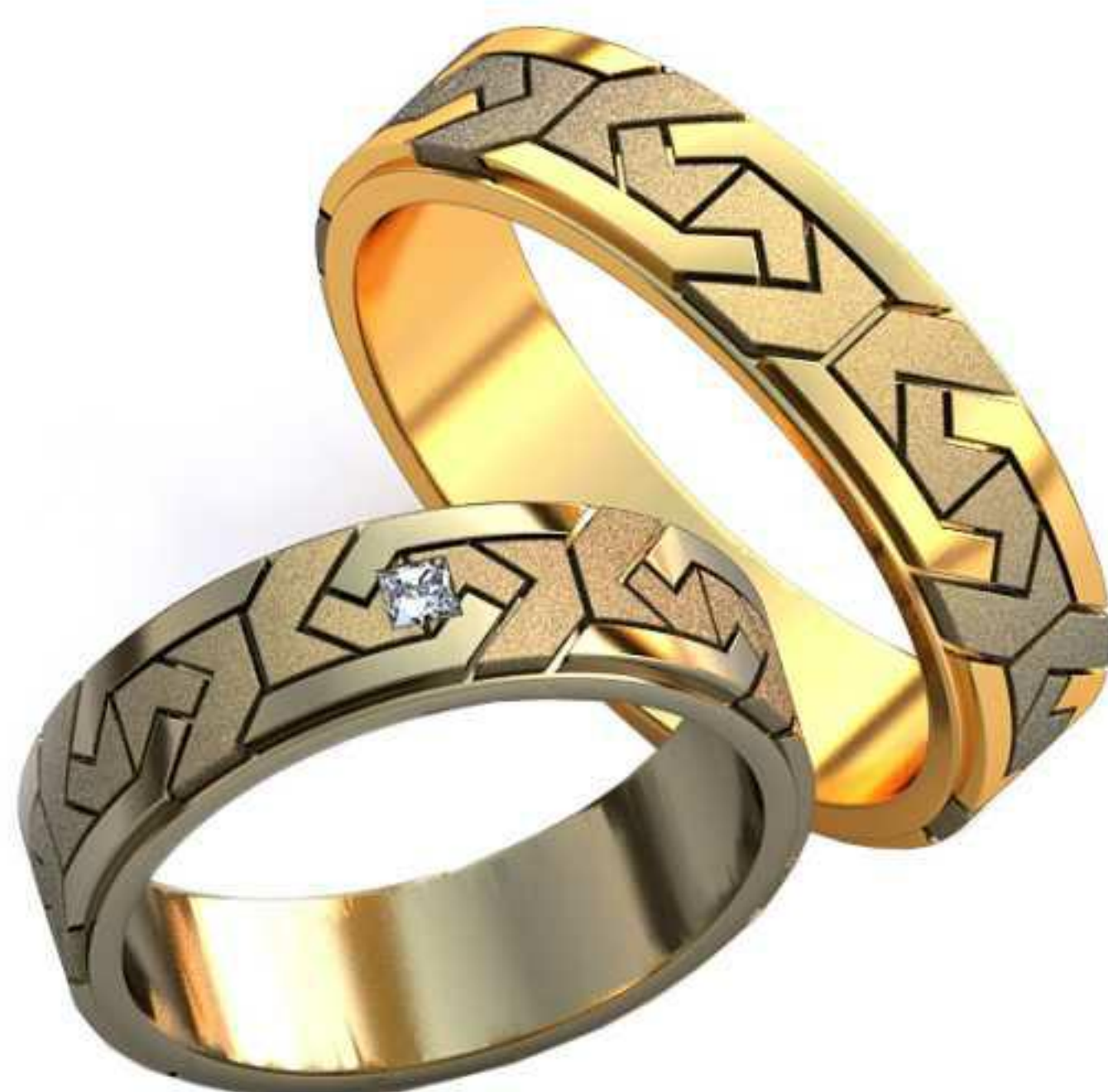
457ж/Р-18,2/Ш-6/Т-1,6/Пр 2.0x2.0-1шт./Вес-6,9 457м/Р-21,2/Ш-6/Т-1,8/Вес-9,5