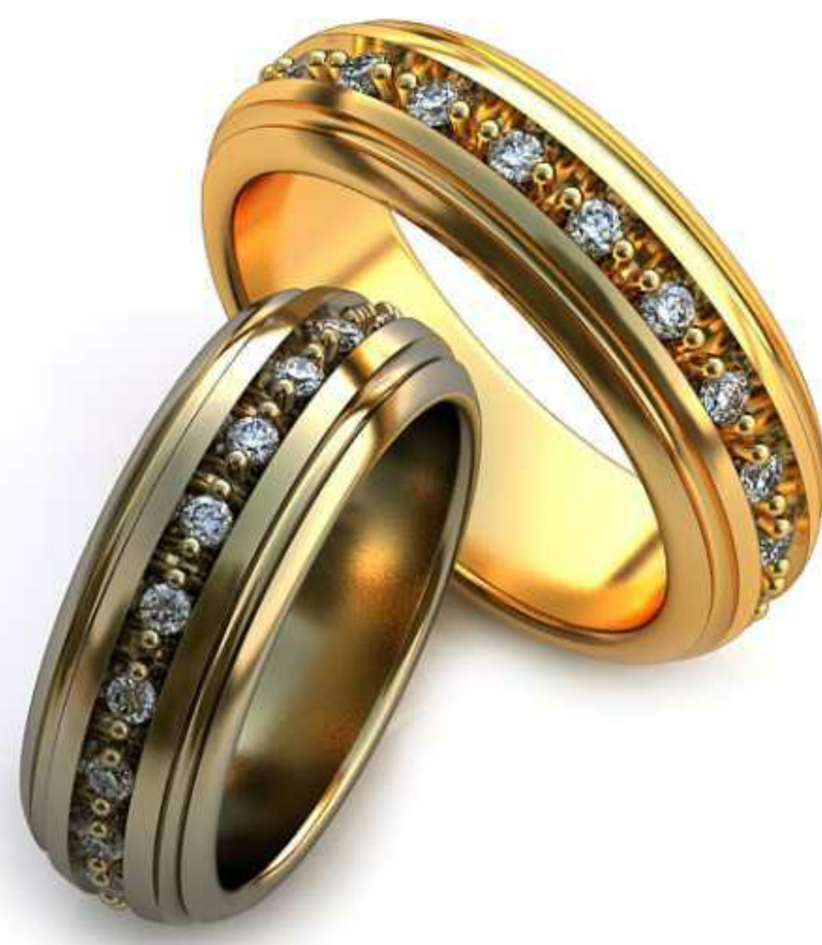
47ж/Р-17,5/Ш-7,2/Т-2,1/Кр 1.6-20шт./Вес-9,0 47м/Р-19,5/Ш-7,0/Т-2,4/Кр 1.6-20шт./Вес-10,9