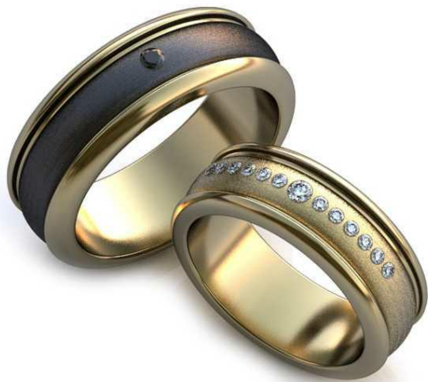
49ж/Р-17,0/Ш-7,0/Т-2,0/Кр 2.0-1шт.,1.3-12шт./Вес-9,8 49м/Р-19,5/Ш-8,0/Т-2,3/Кр 2.05-1шт./Вес-14,7