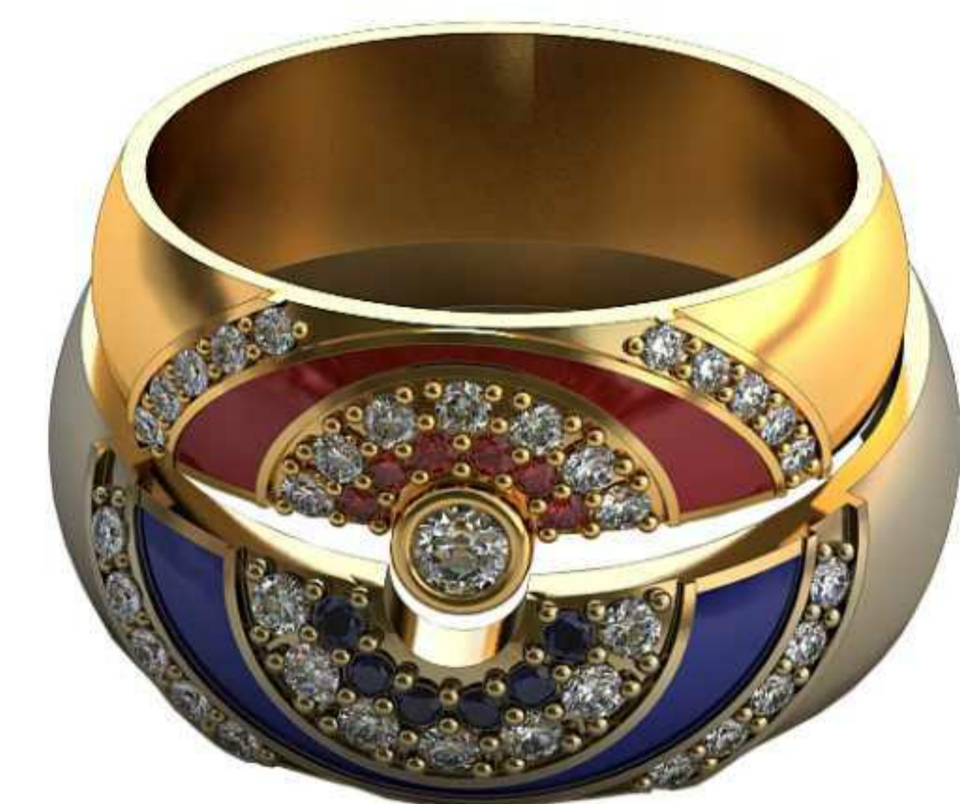
355ж/Р-18,7/Ш-6,0/Т-1,4/Кр 2.6-1,1.5-7,1.2-16шт./Вес-6,6 355м/Р-21,0/Ш-6,7/Т-1,5/Кр 1.5-7,1.2-16шт./Вес-8,1