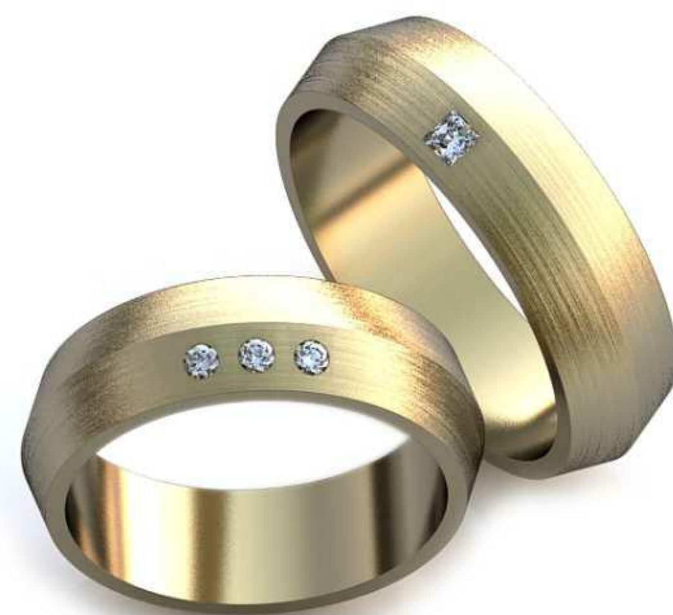
44ж/Р-16,5/Ш-5,9/Т-1,7/Кр 1.6-3шт./Вес-5,8 44м/Р-18,2/Ш-6,0/Т-2,0/Пр 1.6x1.6-1шт./Вес-7,1