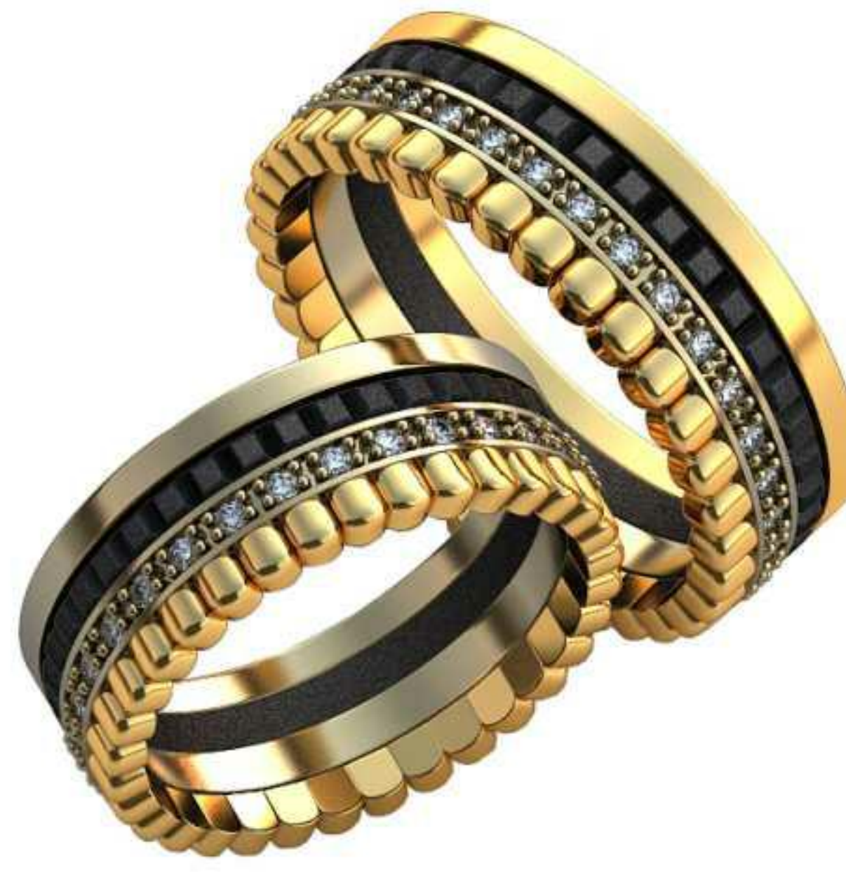
392ж/Р-17,5/Ш-7,1/Т-1,6/Кр 1.2-30шт./Вес-8,0 392м/Р-19,7/Ш-7,1/Т-1,9/Кр 1.2-33шт./Вес-9,6