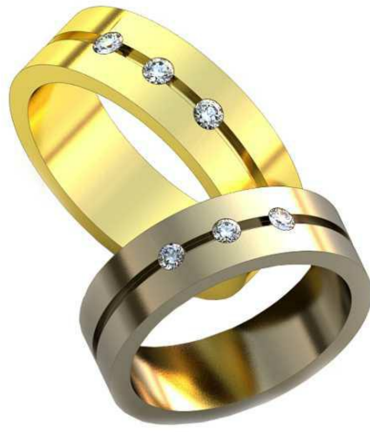
137ж/Р-20,5/Ш-7/Т-1,9/Кр 2.4-3шт./Вес-11,4 137м/Р-22,5/Ш-7,7/Т-2,05/Кр 2.7-3шт./Вес-15,1