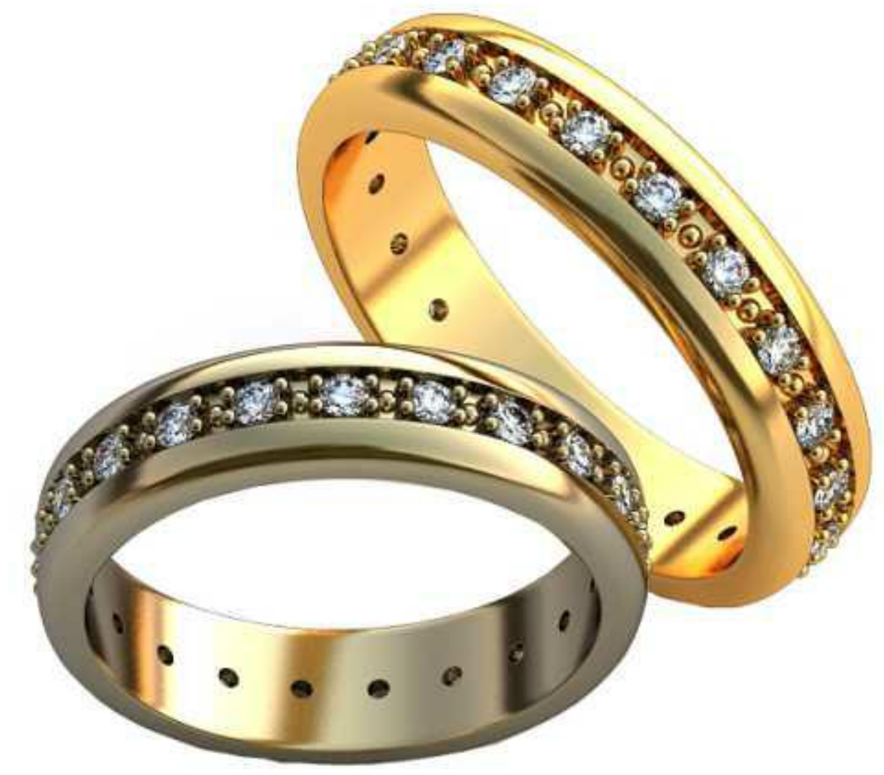
183ж/Р-17,5/Ш-5/Т-1,5/Кр 1.7-21шт./Вес-5,1 183м/Р-19,5/Ш-5/Т-1,9/Кр 1.75-21шт./Вес-6,3