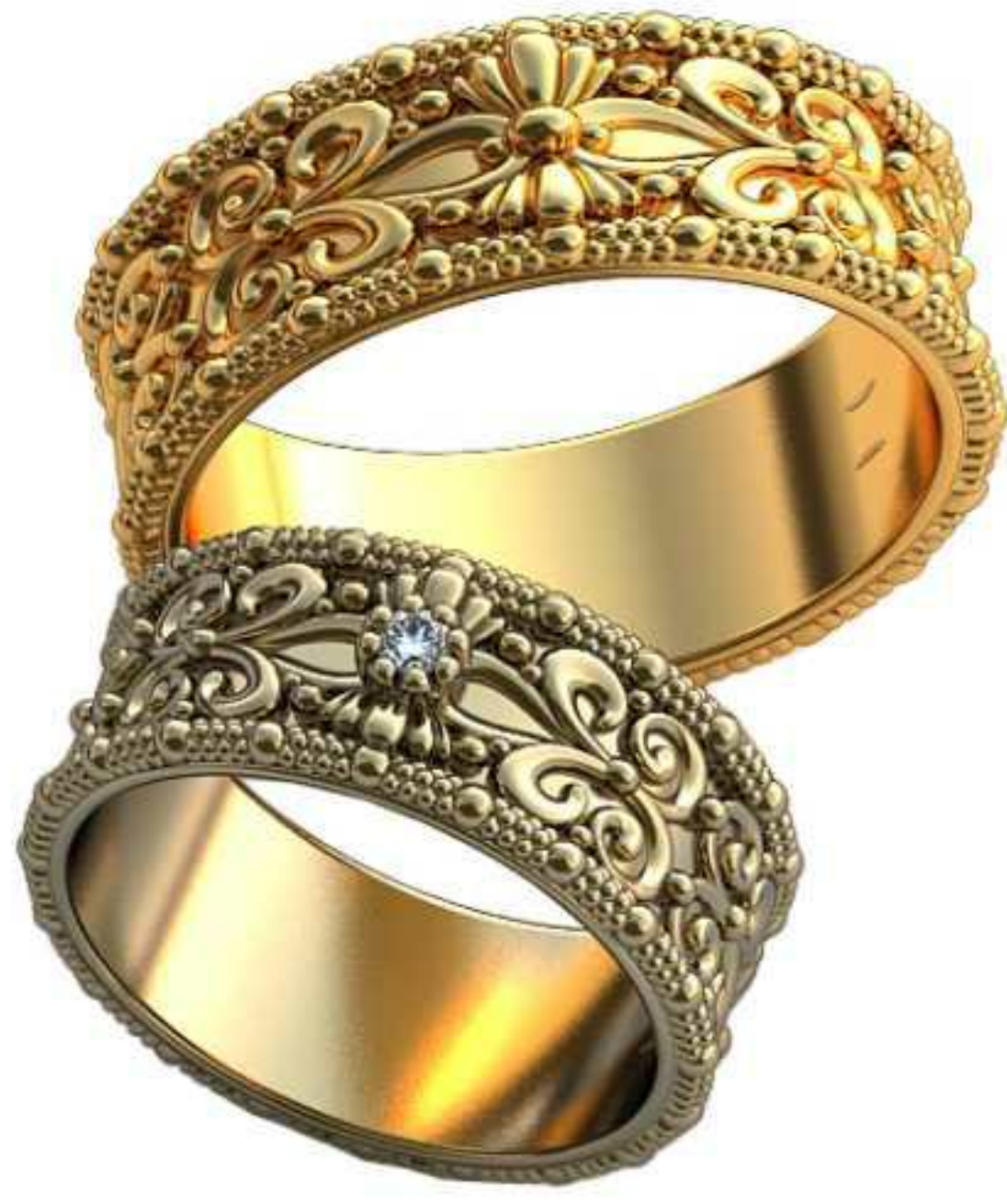
481ж/Р-16/Ш-7,5/Т-1,4/Кр 2.0-1шт./Вес-5,4 481м/Р-19,5/Ш-7,5/Т-1,8/Вес-10,4