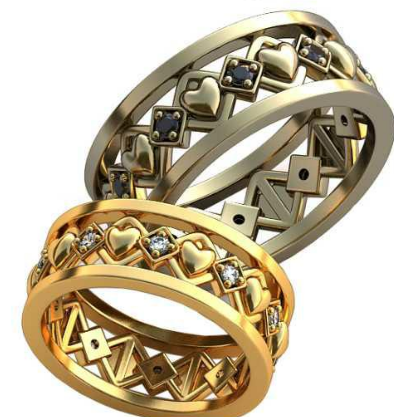
165ж/Р-18,0/Ш-8,0/Т-2,2/Кр 1.8-10шт./Вес-7,1 165м/Р-20,7/Ш-9,2/Т-2,5/Кр 1.8-10шт./Вес-11,0