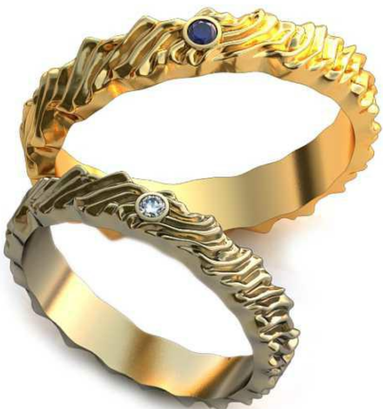
97ж/Р-18,0/Ш-4,0/Т-1,6/Кр 2.0-1шт./Вес-3,8 97м/Р-20,5/Ш-4,5/Т-2,0/Кр 2.0-1шт./Вес-5,8