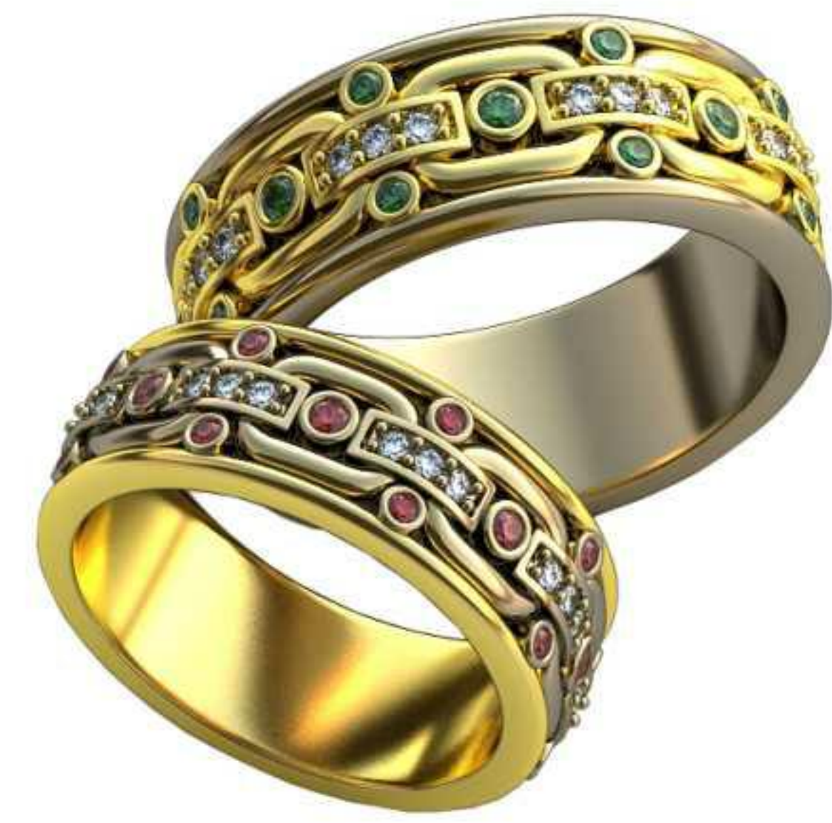
393ж/Р-16,7/Ш-7,6/Т-1,7/Кр 1.4-8шт.,1.2-40шт./Вес-8,7 393м/Р-19,2/Ш-8,0/Т-2,0/Кр 1.4-8шт.,1.2-40шт./Вес-13,1