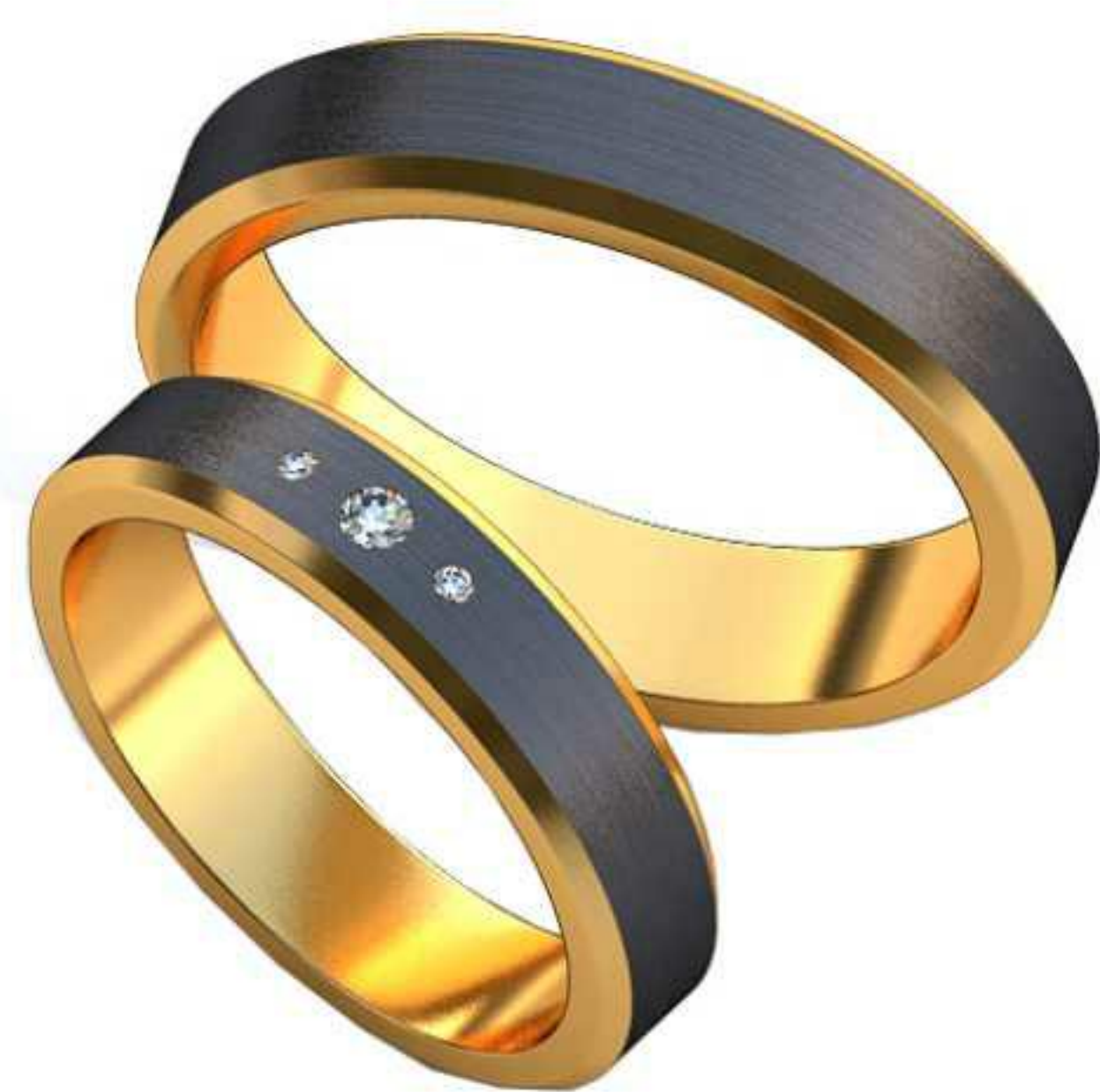
463ж/Р-15,7/Ш-4/Т-1,5/Кр 1.75-1шт., 1-2шт./Вес-4,5 463м/Р-19/Ш-4,5/Т-1,6/Вес-6,3