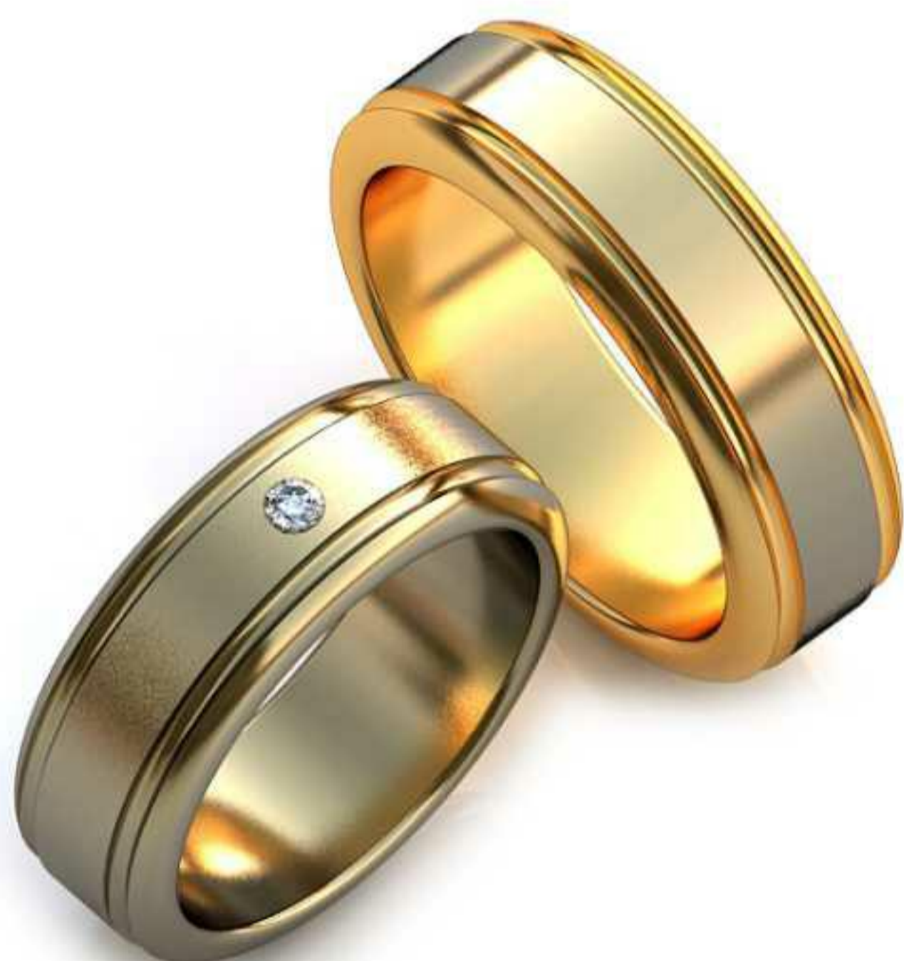
52ж/Р-17,0/Ш-7/Т-2,0/Кр 2.0-1шт./Вес-9,5 52м/Р-19,0/Ш-7/Т-2,2/Кр 2.0-1шт./Вес-12,0