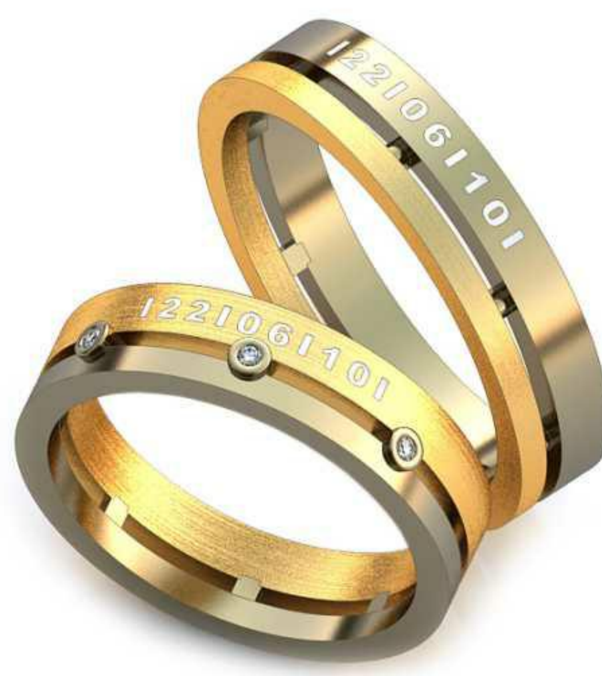
269ж/Р-16,0/Ш-4,5/Т-1,4/Кр 1.0-1шт./Вес-3,8 269м/Р-18,0/Ш-4,5/Т-1,6/Вес-4,8