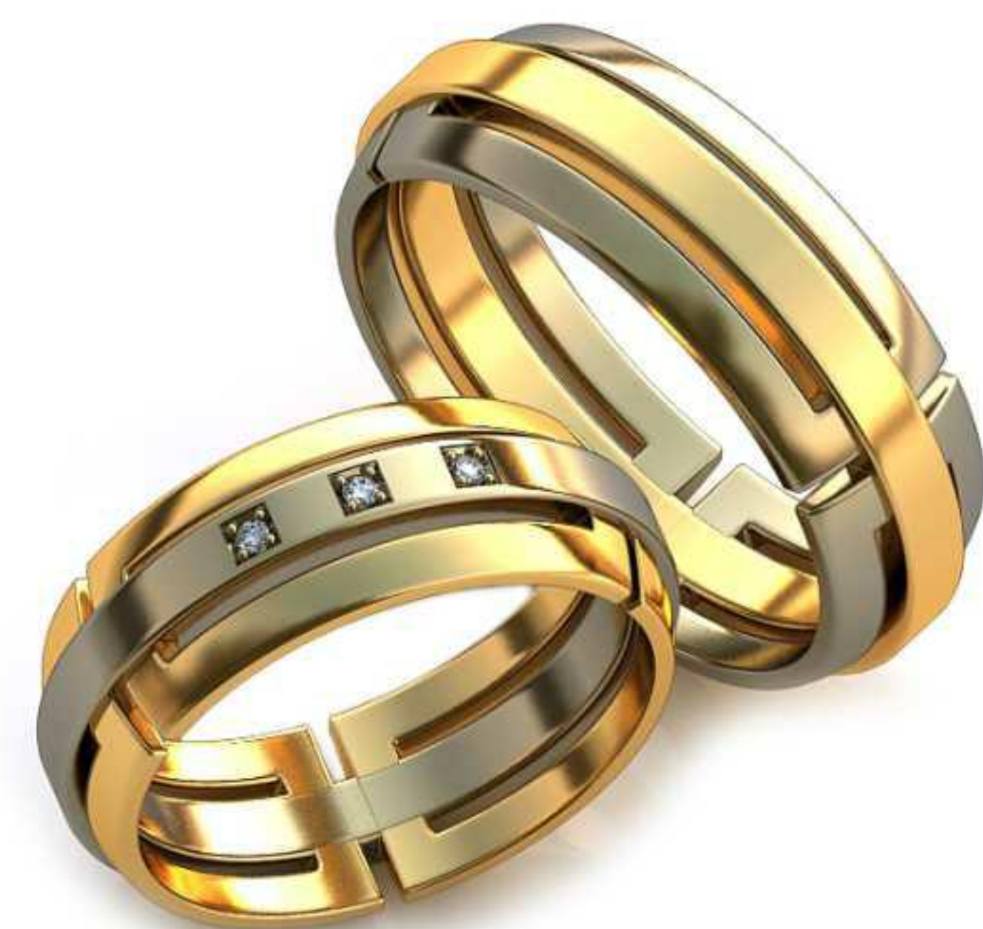
273ж/Р-19,7/Ш-8,0/Т-2,0/Кр 1.3-3шт./Вес-3,5 273м/Р-22,7/Ш-8/Т-2,3/Вес-12,8