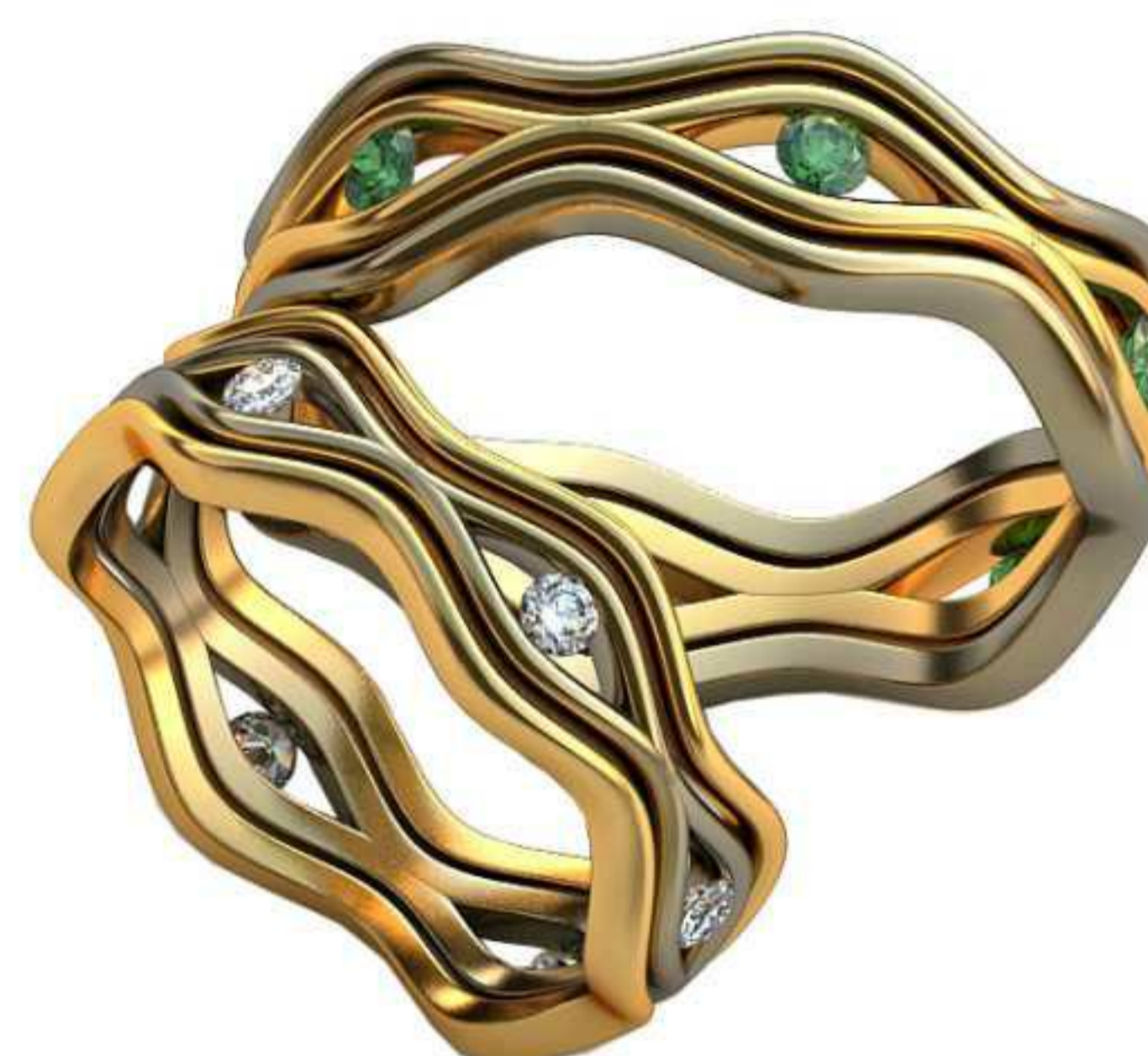
387ж/Р-16,7/Ш-6,0/Т-1,5/Кр 2.0-6шт./Вес-3,9 387м/Р-19,2/Ш-7,0/Т-1,7/Кр 2.0-6шт./Вес-6,1