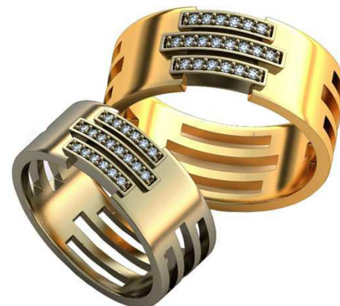
306ж/Р-17,0/Ш-7,8/Т-1,3/Кр 1.0-20шт./Вес-6,3 306м/Р-19,5/Ш-9,0/Т-1,5/Кр 1.2-20шт./Вес-9,7