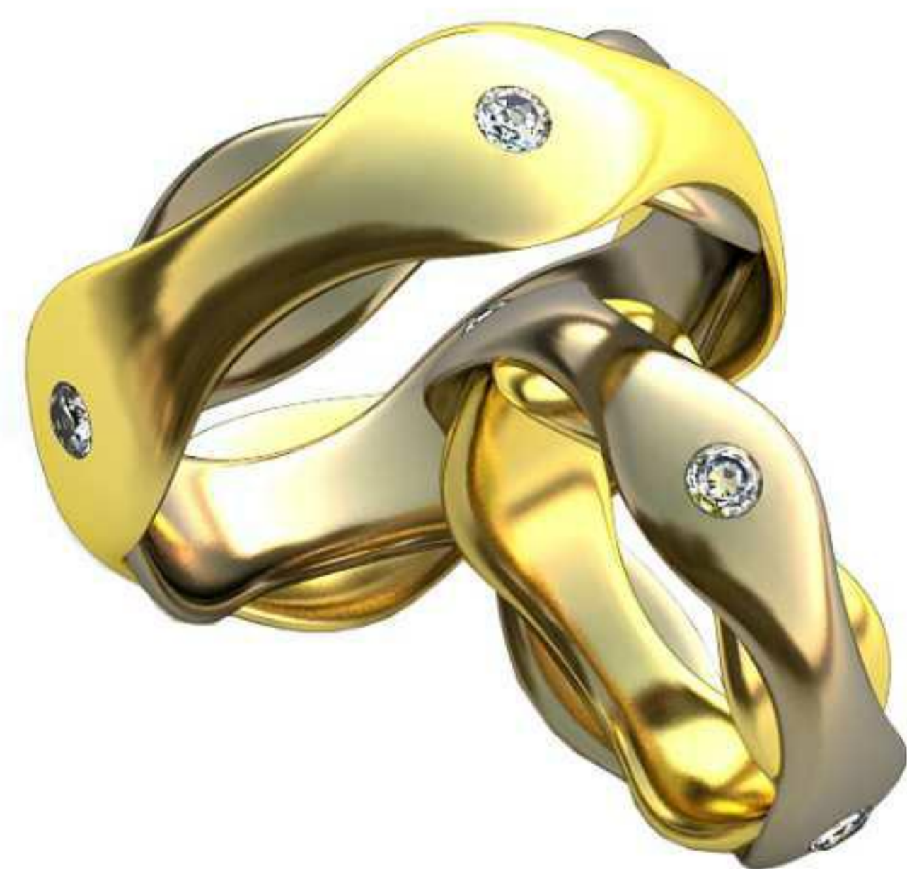
179ж/Р-16,0/Ш-6,0/Т-2,0/Кр 2.4-4шт./Вес-6,0 179м/Р-20,5/Ш-8,1/Т-2,1/Кр 2.4-4шт./Вес-11,4