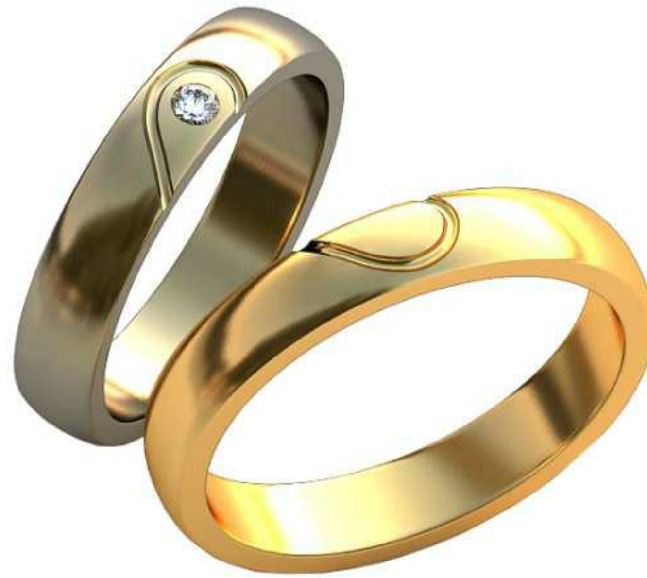
152ж/Р-17,2/Ш-4,0/Т-1,6/Кр 2.1-1шт./Вес-4,5 152м/Р-19,2/Ш-4,0/Т-1,7/Вес-5,6