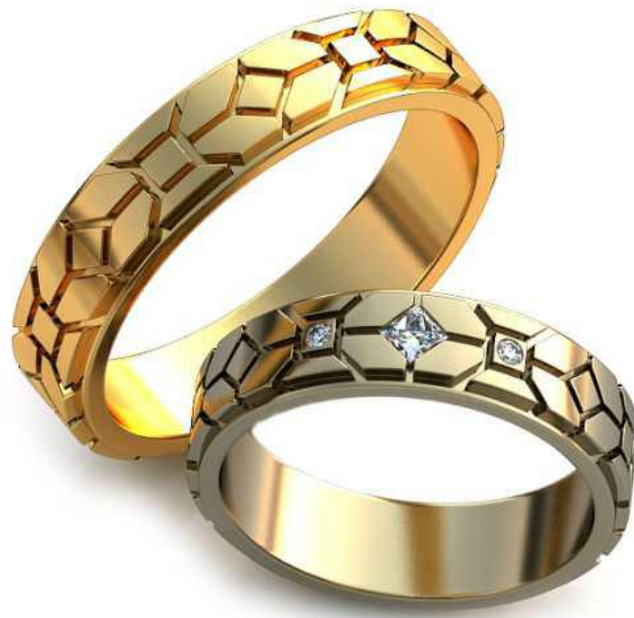
287ж/Р-17,5/Ш-5,4/Т-1,6/Пр 3.3x3.3-1шт. Кр 1.4-2шт./Вес-5,7 287м/Р-21,2/Ш-5,4/Т-1,9/Вес-8,51