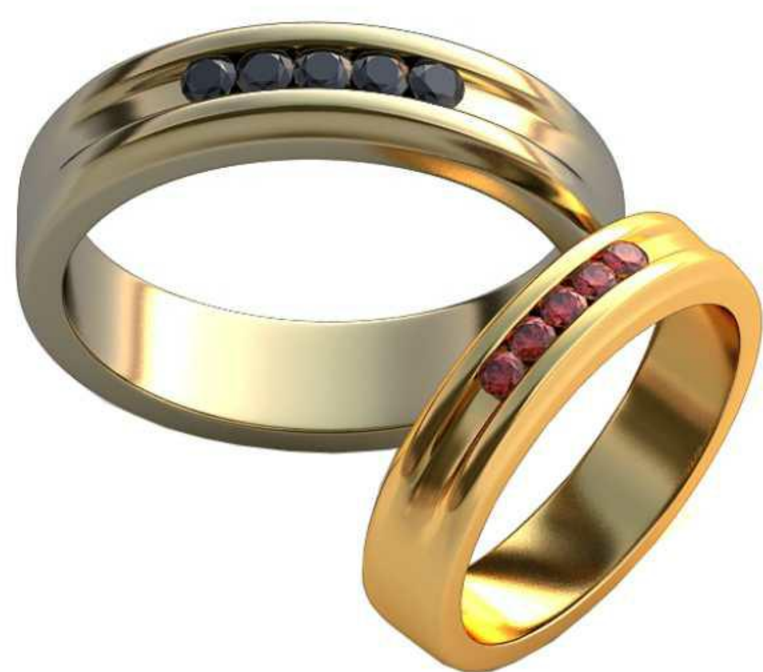
460ж/Р-20/Ш-5/Т-1,9/Кр 2.3-5шт./Вес-9,5 460м/Р-24,7/Ш-6,5/Т-2,3/Кр 2.8-5шт./Вес-17,8