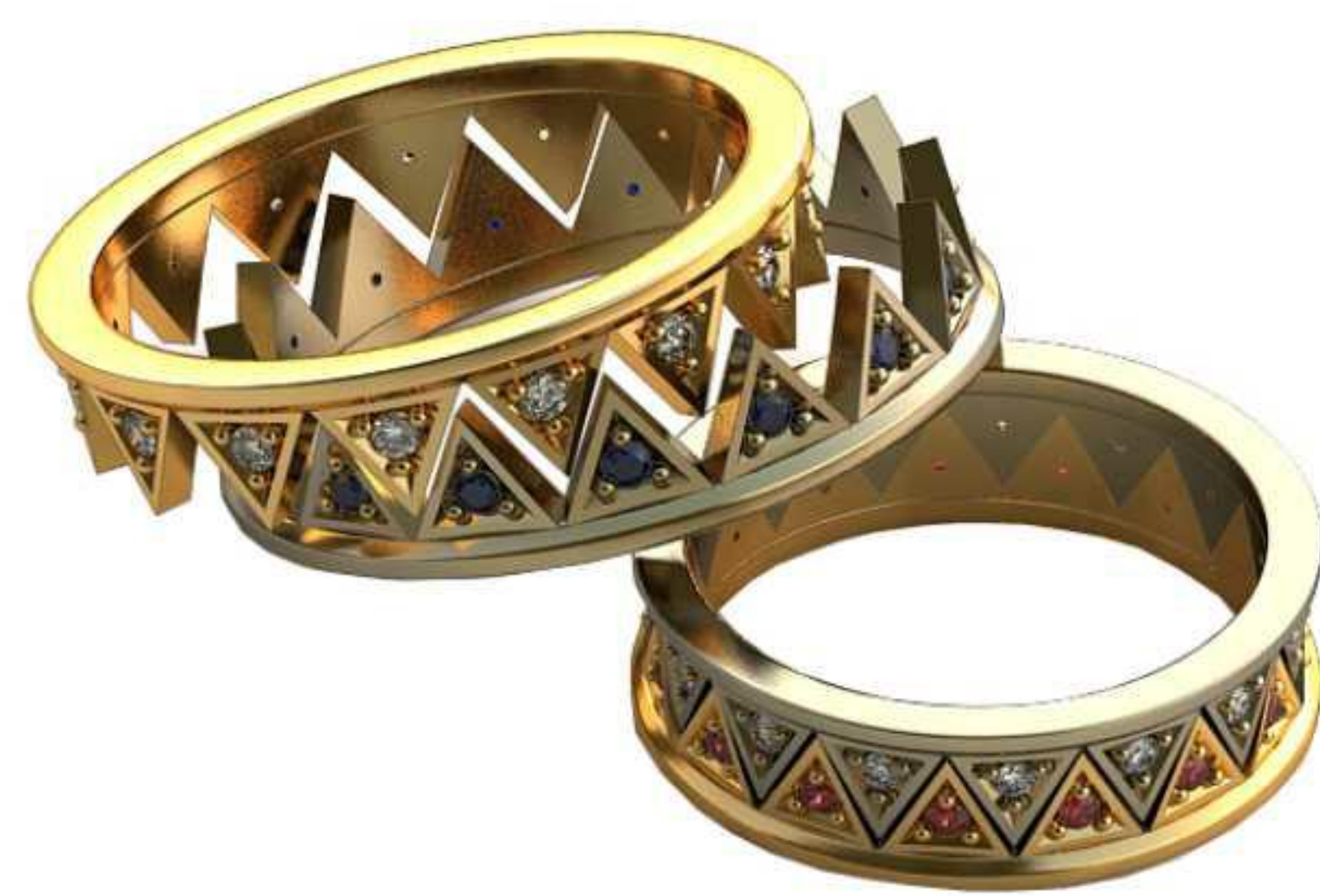
423ж/Р-17/Ш-5,6/Т-1,5/Кр 1.25-30шт./Вес-4,7 423м/Р-19,7/Ш-7/Т-1,8/Кр 1.5-30шт./Вес-7,5