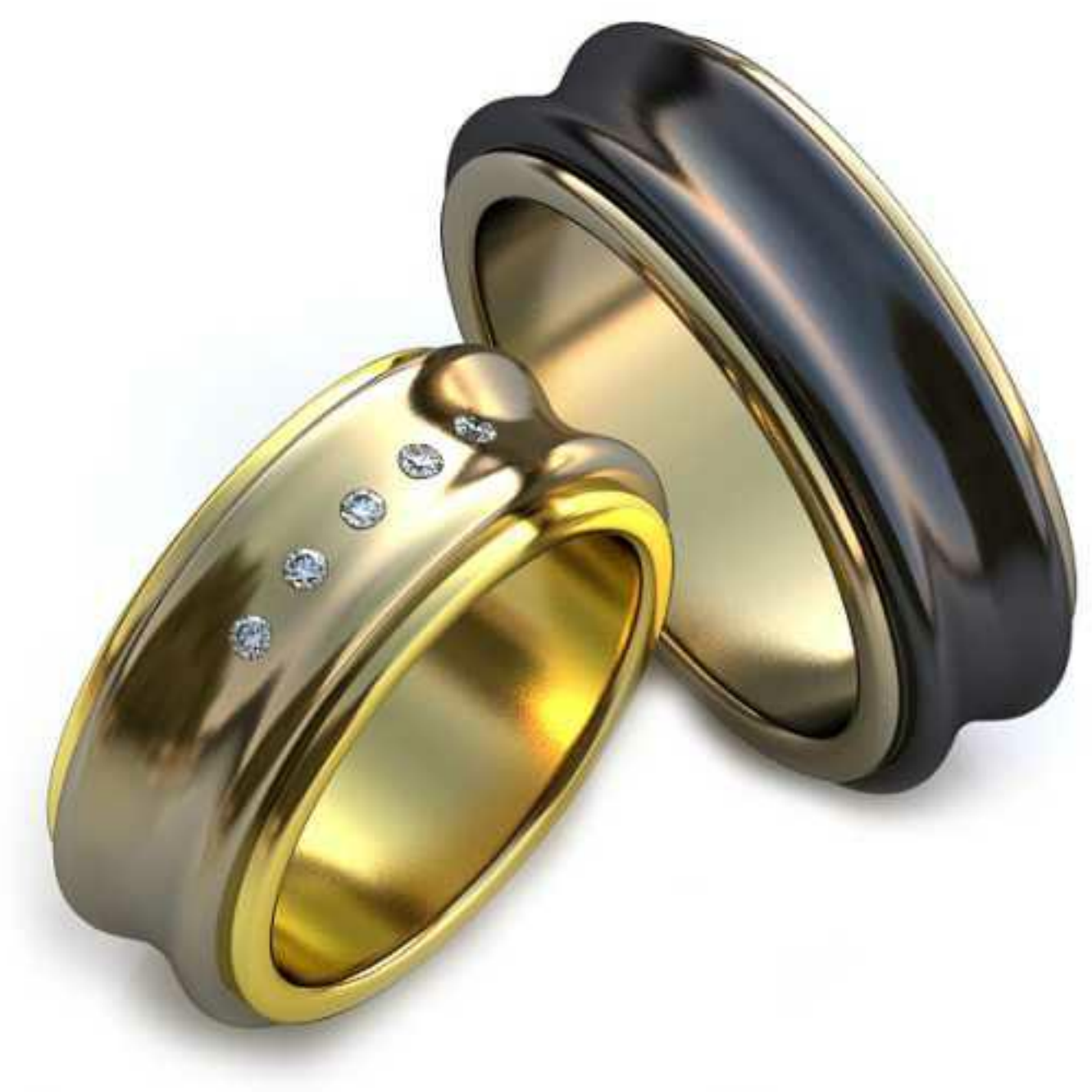
45ж/Р-17/Ш-8,4/Т-2,3/Кр 1.42-5шт./Вес-12,9 45м/Р-19,2/Ш-7,7/Т-2,8/Вес-15,7