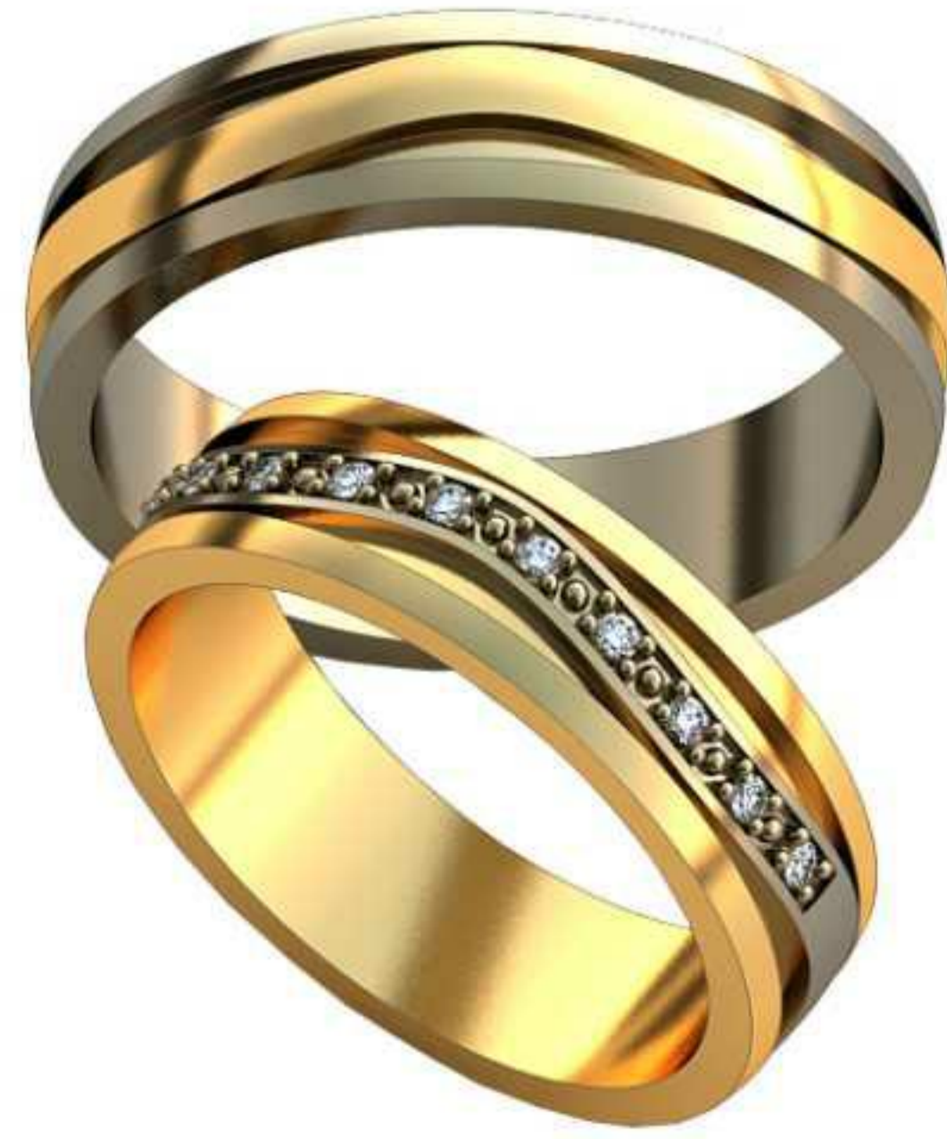
479ж/Р-17,5/Ш-5,5/Т-1,6/Кр 1.2-10шт./Вес-5,7 479м/Р-19,7/Ш-5,5/Т-1,6/Вес-6,5