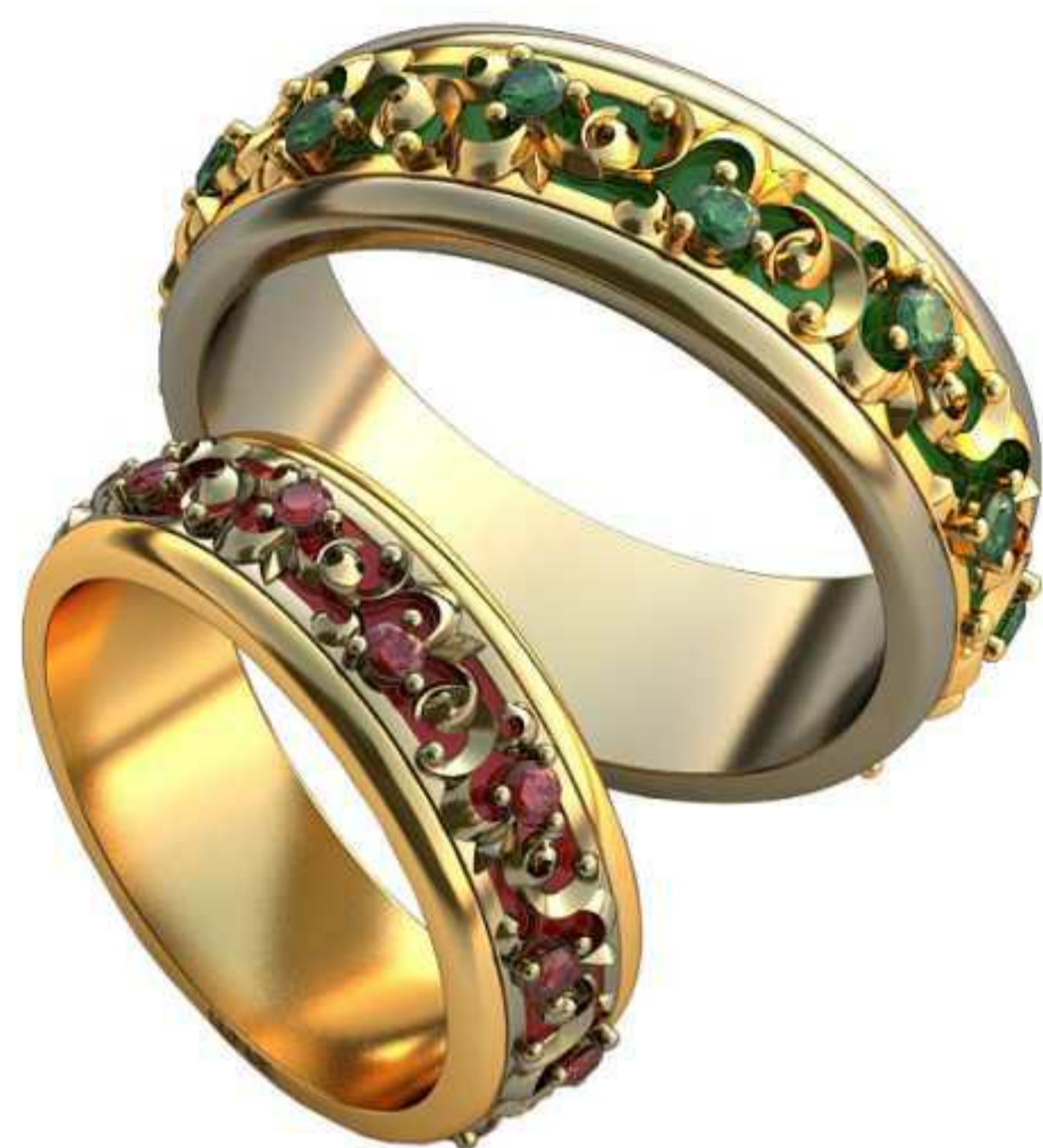
349ж/Р-16,2/Ш-6,0/Т-1,7/Кр 1.6-12шт./Вес-5,9 349м/Р-19,5/Ш-7,3/Т-2,1/Кр 1.6-12шт./Вес-10,6