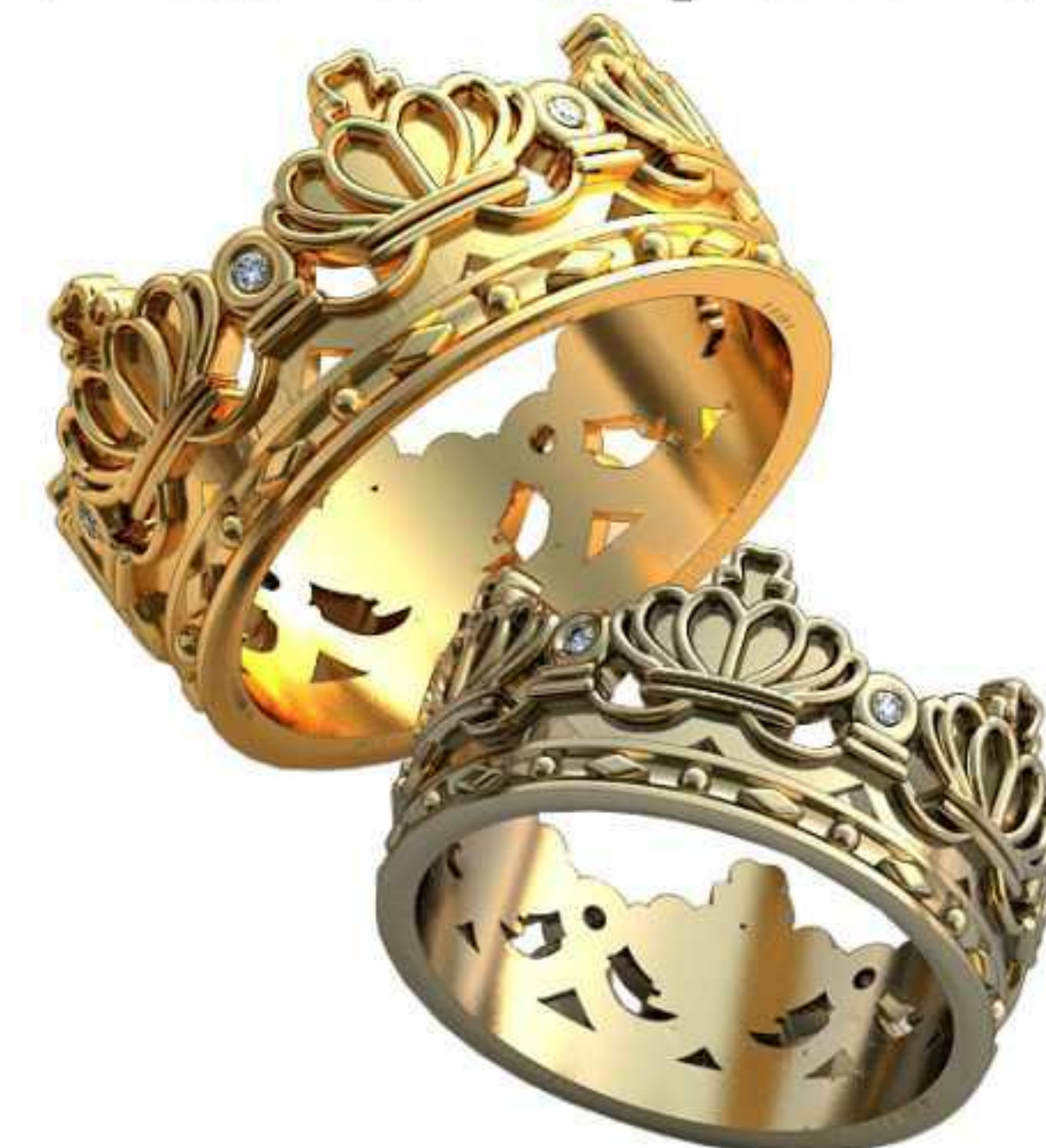
426ж/Р-16,7/Ш-9,5/Т-1,6/Кр 1.0-6шт./Вес-6,1 426м/Р-19,2/Ш-11/Т-2/Кр 1.25-6шт./Вес-9,4