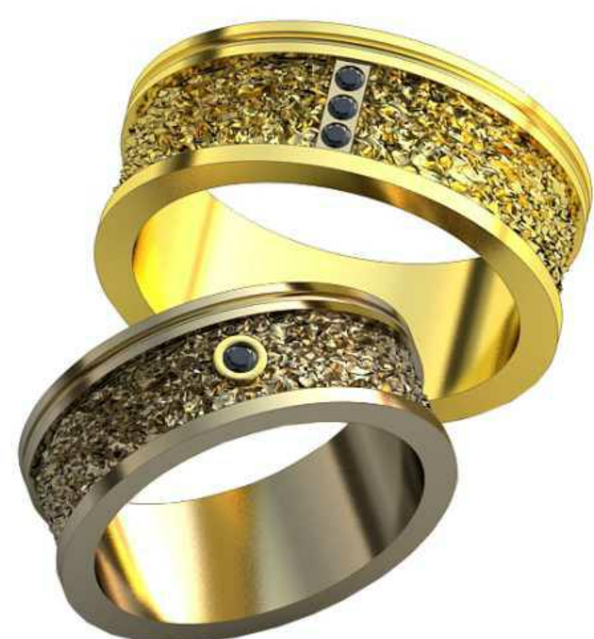
517ж/Р-18,7/Ш-8/Т-1,8/Кр 1.8-1шт./Вес-9,5 517м/Р-21,2/Ш-9/Т-2,0/Кр 1.6-3шт./Вес-20