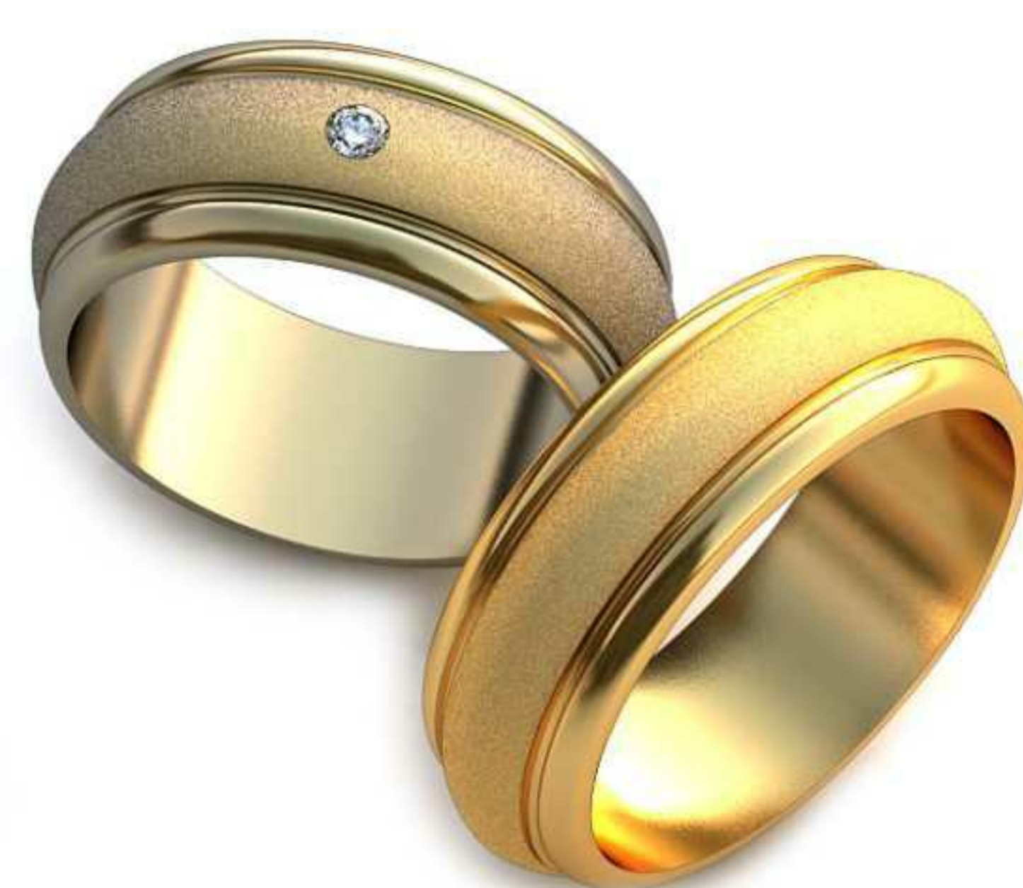
60ж/Р-17,0/Ш-8/Т-2,0/Кр 2.0-1шт./Вес-8,8 60м/Р-19,0/Ш-7,1/Т-2,3/Вес-9,4