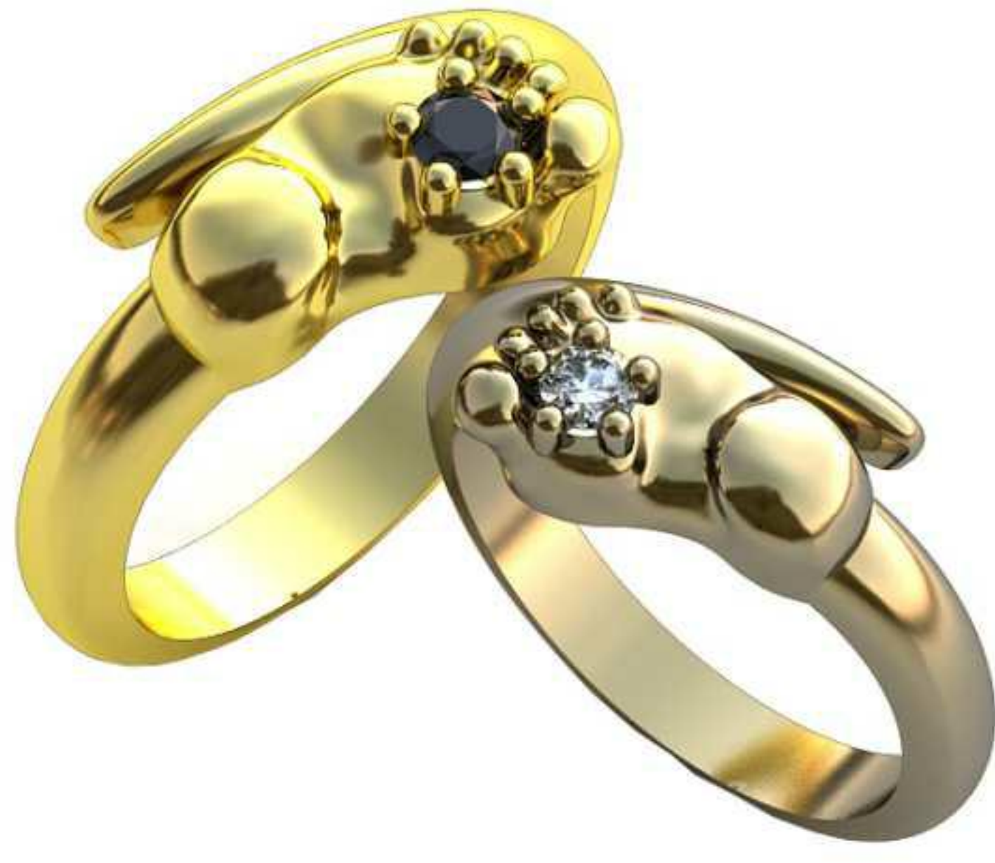
181ж/Р-17,0/Ш-9,4/Т-1,6/Кр 2.9-1шт./Вес-4,9 181м/Ш-19,0/Т-10,9/Кр 3.3-1шт./Вес-1,8