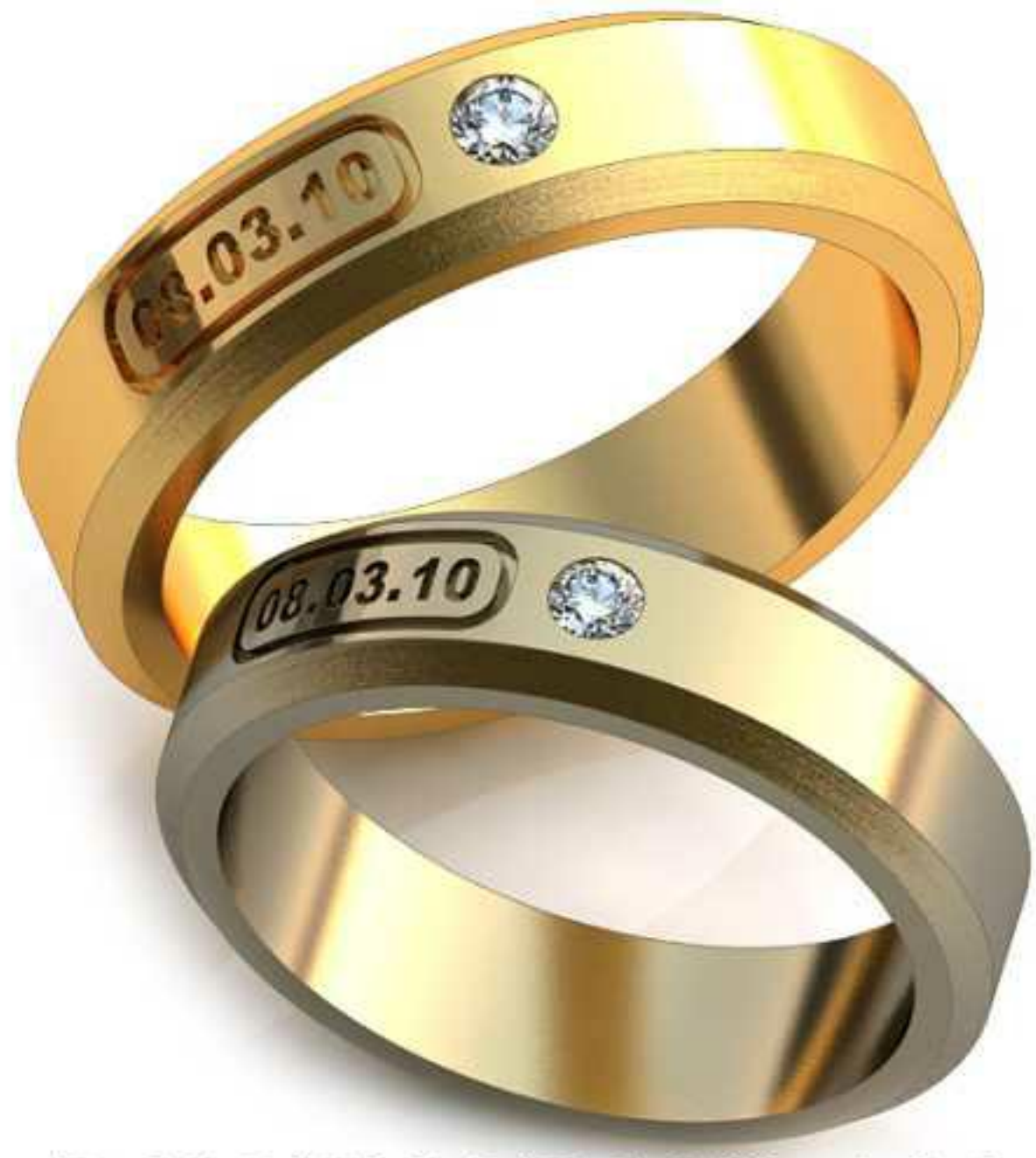
241ж/Р-17,0/Ш-5,0/Т-1,7/Кр 2.2-1шт./Вес 6,2 241м/Р-19,0/Ш-5,6/Т-1,9/Кр 2.5-1шт./Вес 8,8