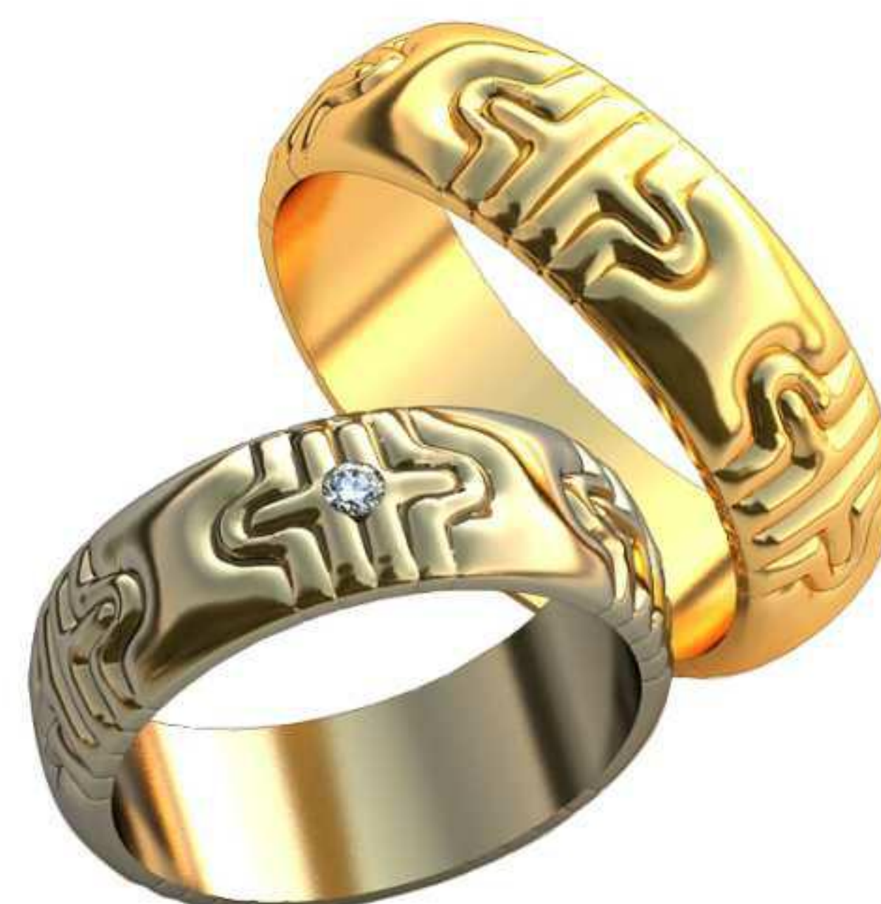
404ж/Р-17,7/Ш-6,8/Т-1,6/Кр 2.0-1шт./Вес-7,1 404м/Р-20,2/Ш-6,8/Т-1,6/Вес-8,6