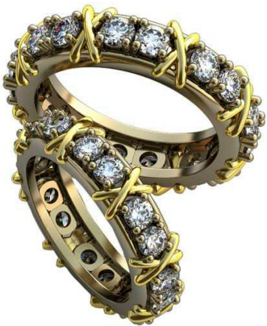
175ж/Р-16,5/Ш-4,8/Т-2,0/Кр 3.0-16шт./Вес-5,6 175м/Р-18,2/Ш-5,5/Т-2,3/Кр 3.0-16шт./Вес-7,8