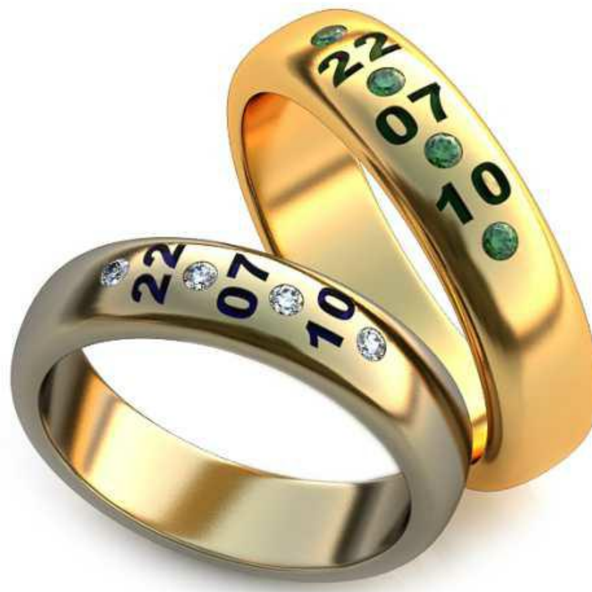
245ж/Р-15,7/Ш-5,0/Т-1,7/Кр 1.4-4шт./Вес-5 245м/Р-17,2/Ш-5,0/Т-1,8/Кр 1.4-4шт./Вес-6,6