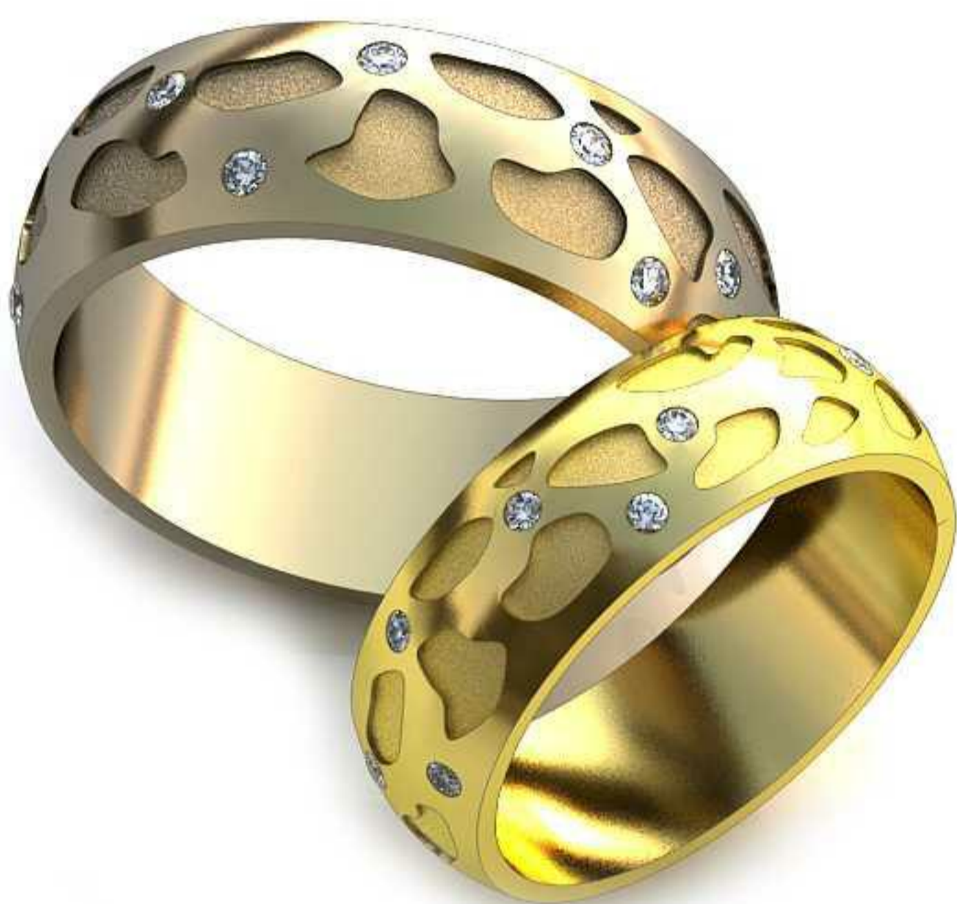
232ж/Р-16,2/Ш-6,0/Т-1,4/Кр 1.2-13шт./Вес-5,1 232м/Р-19,2/Ш-7,0/Т-1,7/Кр 1.2-13шт./Вес-8,2