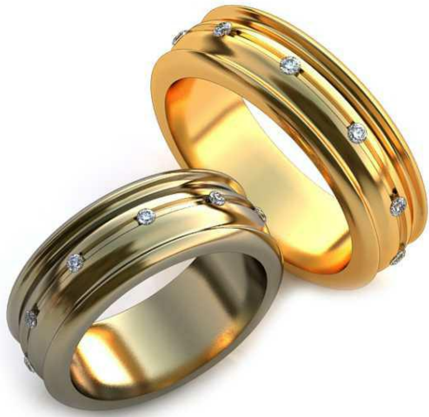
46ж/Р-17,0/Ш-7,5/Т-2,0/Кр 1.4-10шт./Вес-9,8 46м/Р-19,0/Ш-7,0/Т-2,2/Кр 1.57-10шт./Вес-11,5