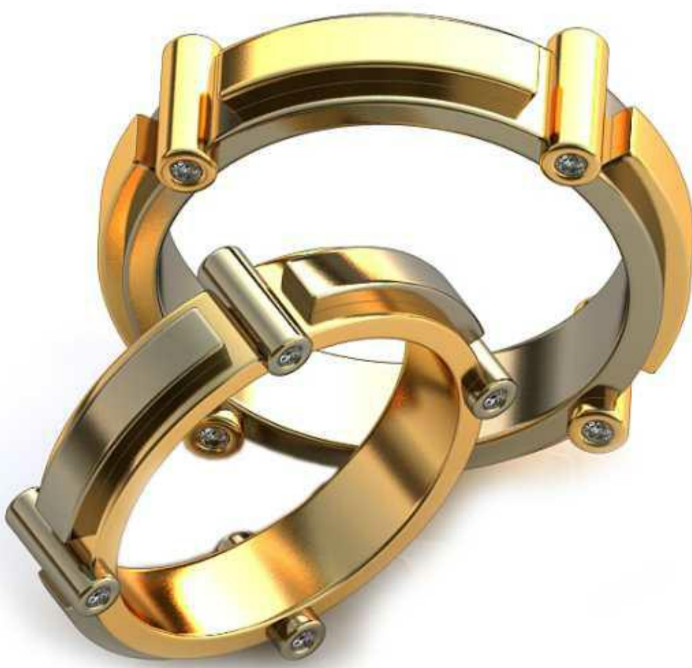
265ж/Р-16,7/Ш-6,0/Т-2,5/Кр 1.1-8шт./Вес-7,6 265м/Р-20,0/Ш-7,0/Т-2,6/Кр 1.3-8шт./Вес-12,3