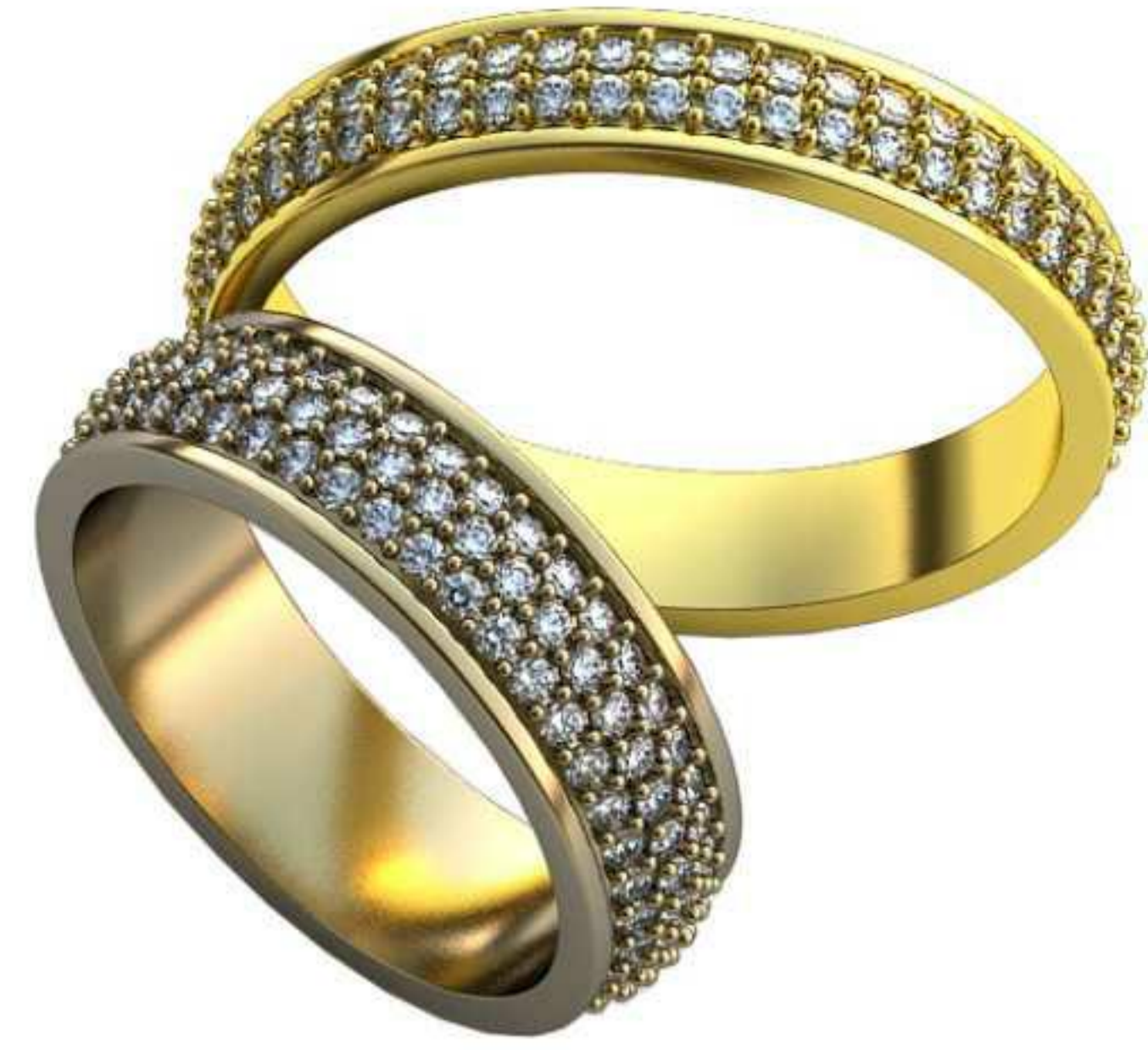
498ж/Р-16,7/Ш-5,6/Т-1,4/Кр 1.2-129шт./Вес-5,3 498м/Р-20,7/Ш-4,2/Т-1,5/Кр 1.25-100шт./Вес-4,8