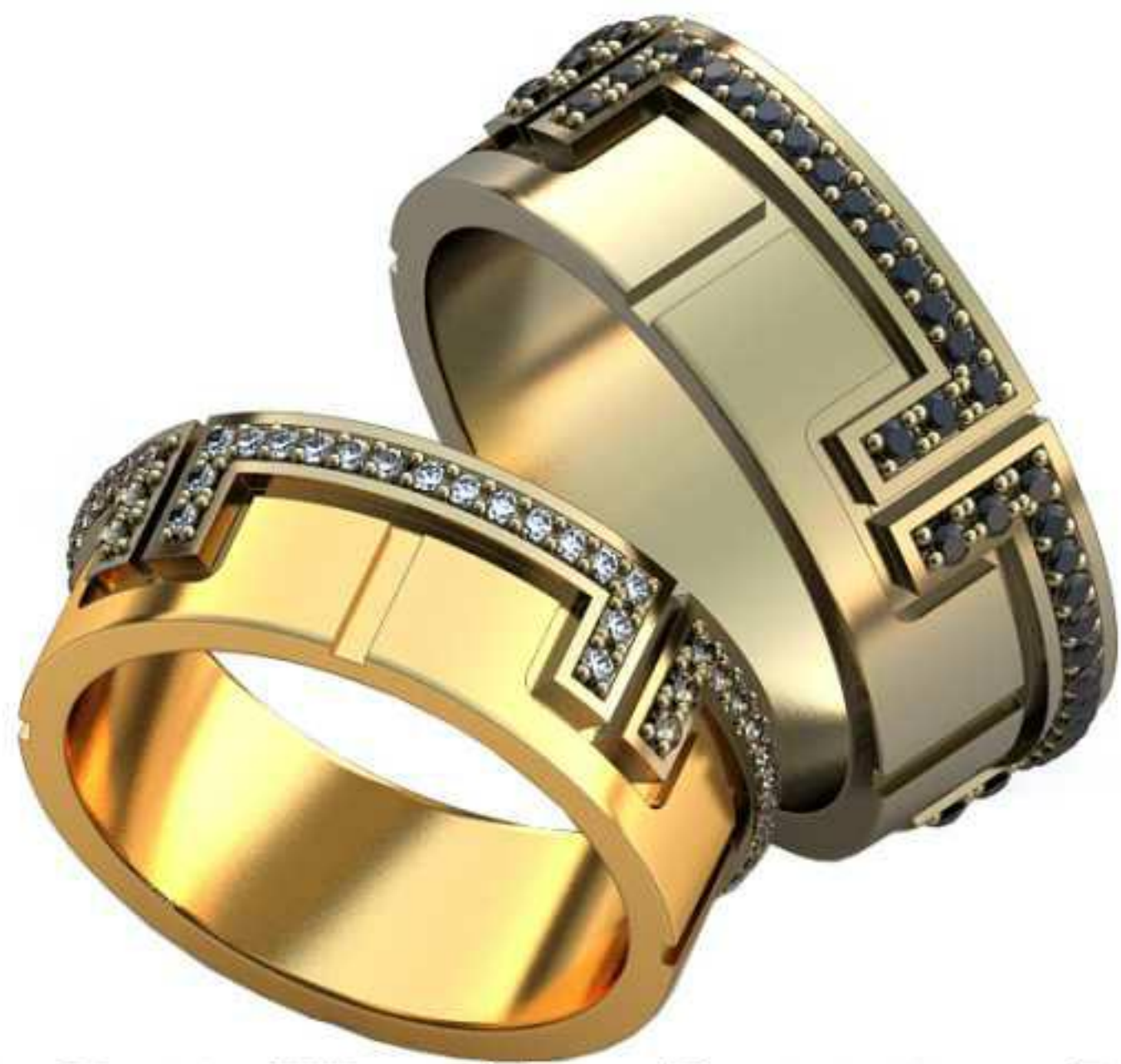
361ж/Р-16,5/Ш-7,0/Т-1,7/Кр 1,1-68шт./Вес-7,3 361м/Р-18,5/Ш-7,9/Т-2,0/Кр 1,1-68шт./Вес-10,5