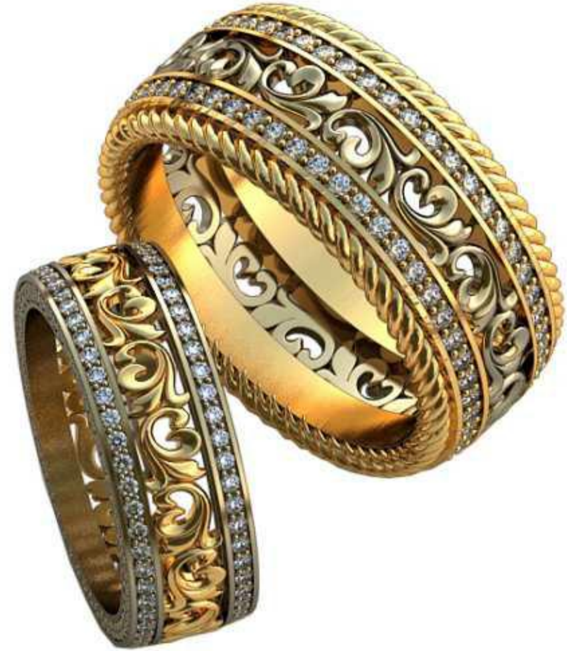
469ж/Р-17/Ш-7,3/Т-2,1/Кр 1.1-204шт./Вес-5,8 469м/Р-21/Ш-10,9/Т-2,6/Кр 1.4-102шт./Вес-15,3