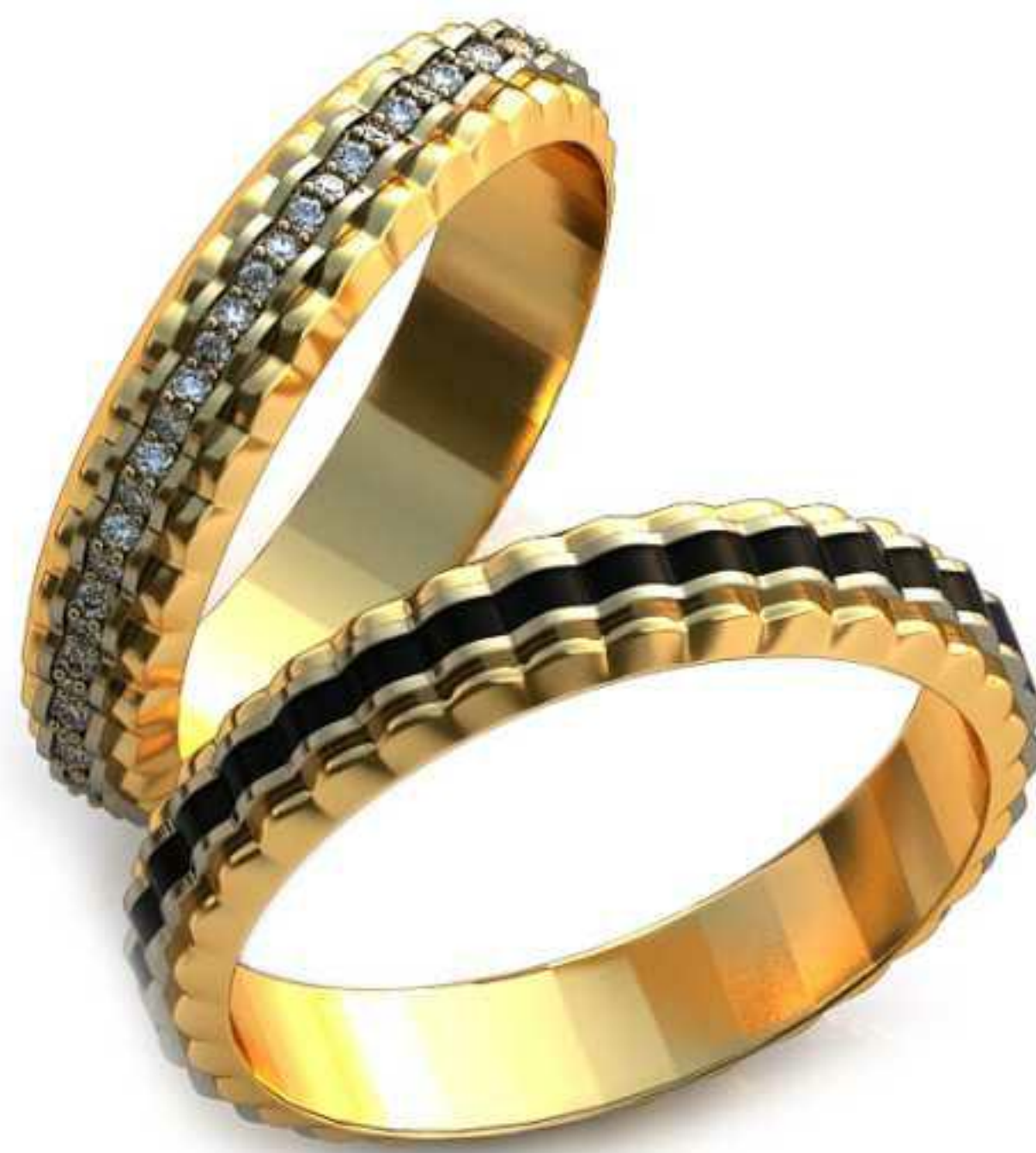
92ж/Р-19,2/Ш-5,0/Т-2,0/Кр 1.1-64шт./Вес-5,0 92м/Р-21,7/Ш-5,0/Т-2,0/Вес-6,2