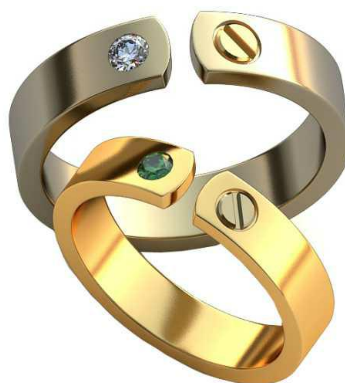
342ж/Р-16,0/Ш-4,0/Т-1,4/Кр 2.4-1шт./Вес-4,0 342м/Р-18,2/Ш-4,6/Т-1,6/Кр 2.6-1шт./Вес-6,0