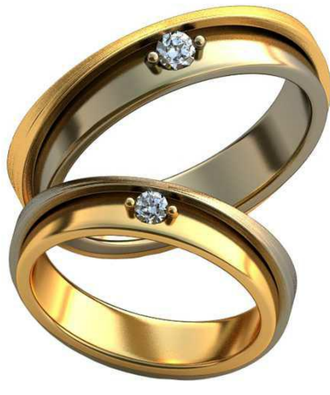
330ж/Р-17,7/Ш-4,4/Т-2,0/Кр 2,5-1шт./Вес-6,2 330м/Р-20,5/Ш-5,0/Т-2,4/Кр 3.0-1шт./Вес-9,8