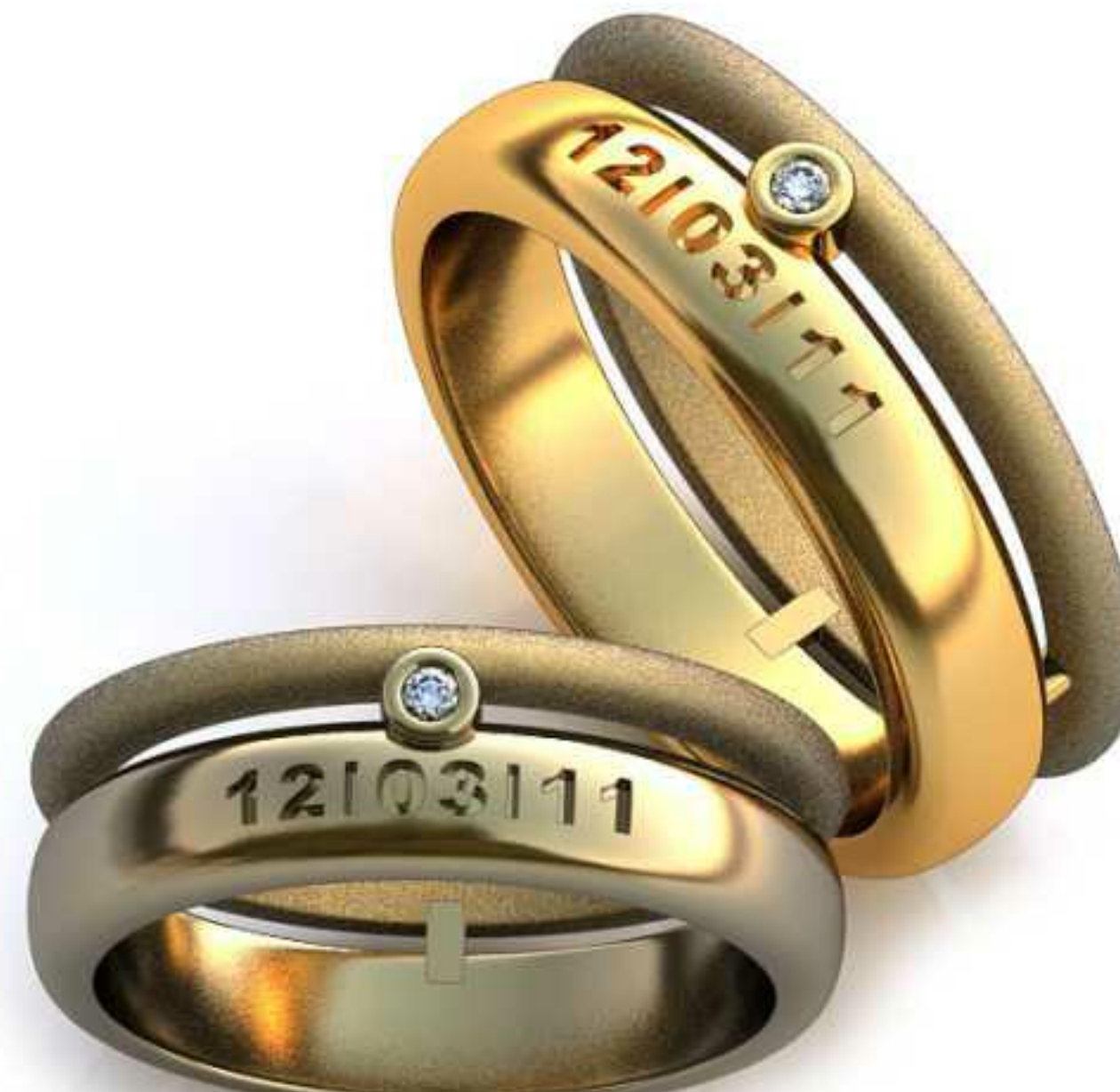
248ж/Р-15,7/Ш-6,0/Т-1,6/Кр 1.3-1шт./Вес-5,6 248м/Р-17,0/Ш-6,6/Т-1,7/Кр 1.3-1шт./Вес-7,2