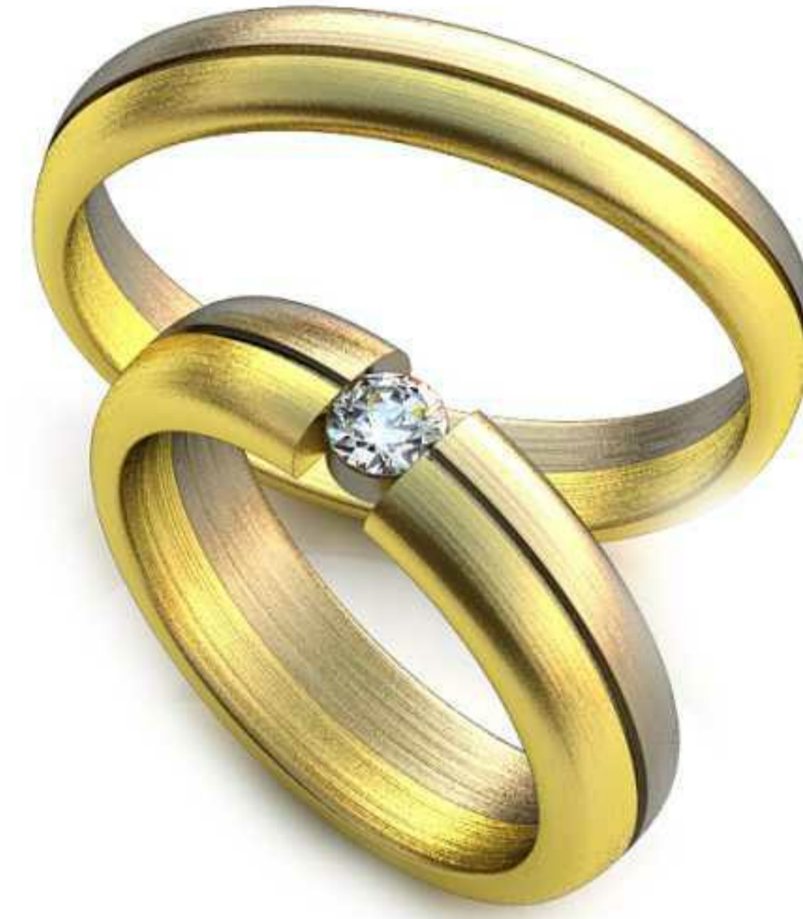
291ж/Р-16,2/Ш-5,0/Т-1,9/Кр 3.5-1шт./Вес-6,0 291м/Р-20,2/Ш-4,0/Т-1,3/Вес-4,0