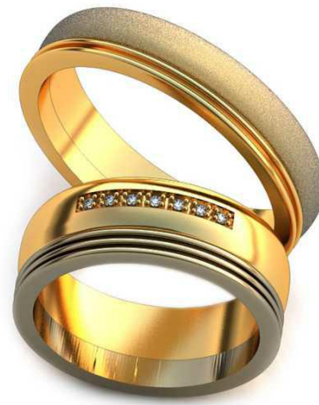
258ж/Р-17,0/Ш-7,0/Т-1,6/Кр 1.0-7шт./Вес-9,8 258м/Р-20,5/Ш-5/Т-1,8/Вес-10,7