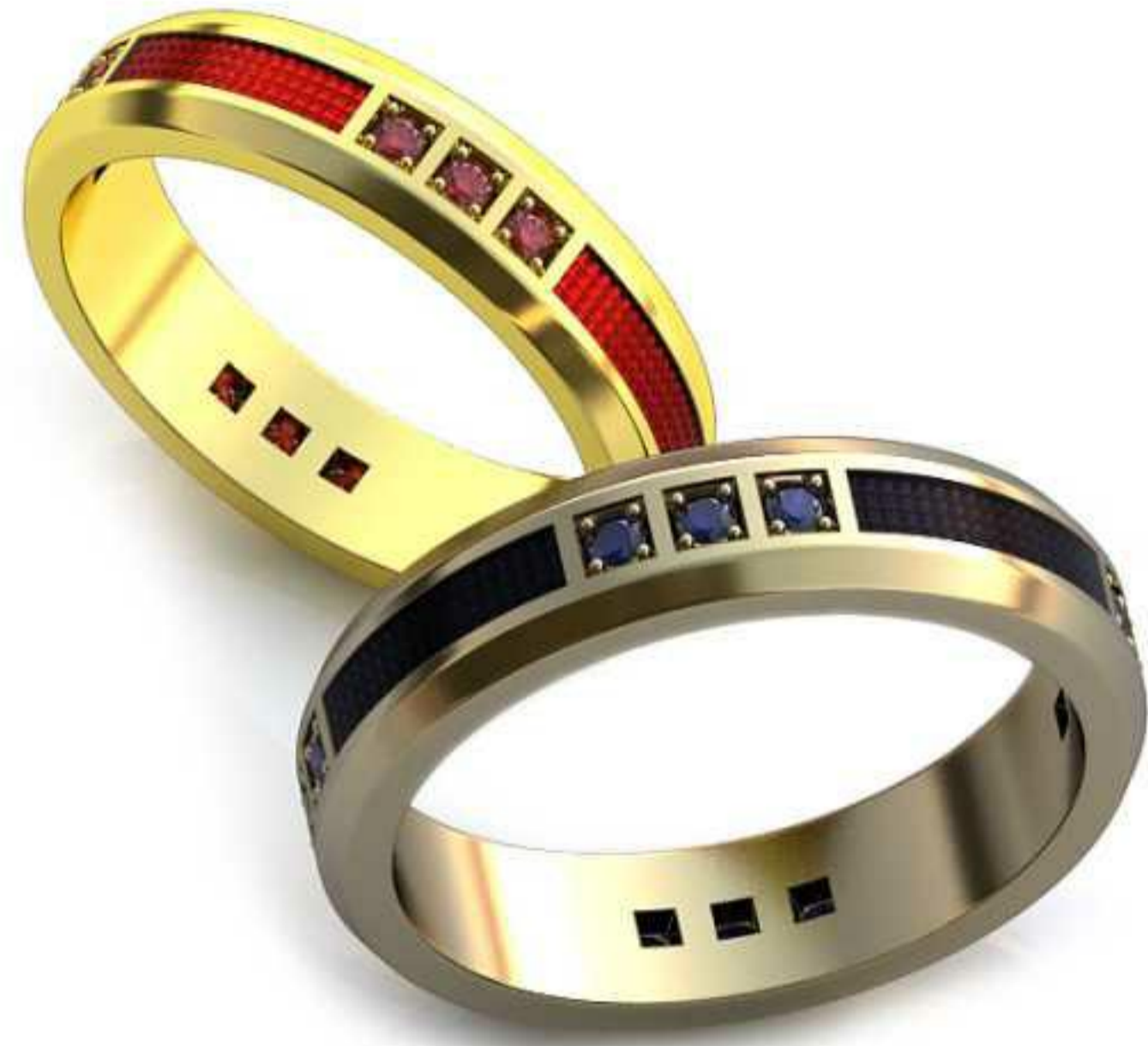
79ж/Р-19,0/Ш-5,0/Т-2,0/Кр 1.6-2шт./Вес-6,7 79м/Р-17,0/Ш-4,5/Т-1,7/Кр 1.6-2шт./Вес-4,7