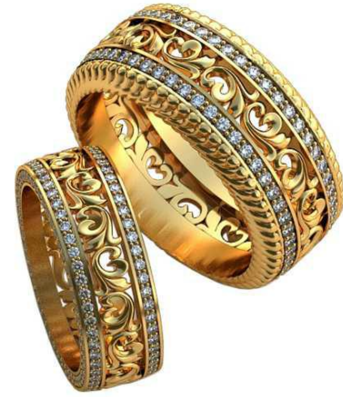
468ж/Р-17/Ш-7,3/Т-2,1/Кр 1.1-204шт./Вес-5,8 468м/Р-21/Ш-11/Т-2,8/Кр 1.4-102шт./Вес-14,5