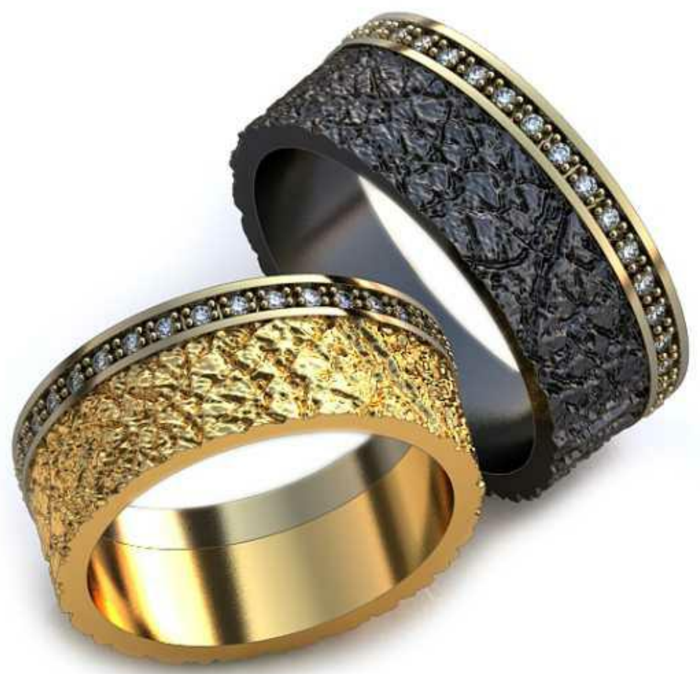
69ж/Р-18,2/Ш-8,0/Т-1,7/Кр 1.1-36шт./Вес-10,0 69м/Р-17,0/Ш-7,5/Т-1,6/Кр 1.1-36шт./Вес-8,2