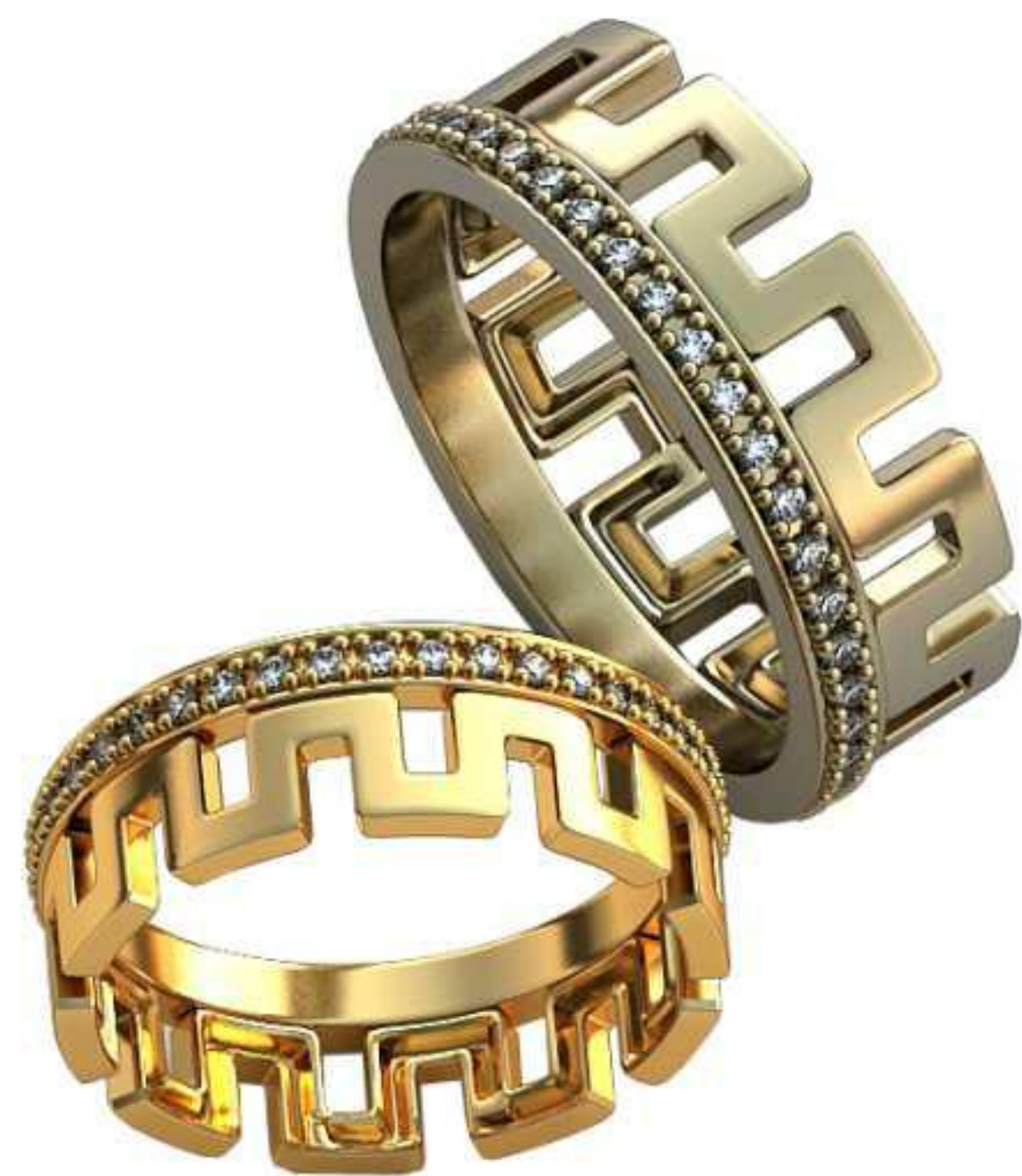
367ж/Р-17,5/Ш-6,7/Т-1,5/Кр 1,3-40шт./Вес-4,8 367м/Р-20,0/Ш-7,6/Т-1,7/Кр 1,3-40шт./Вес-7,2