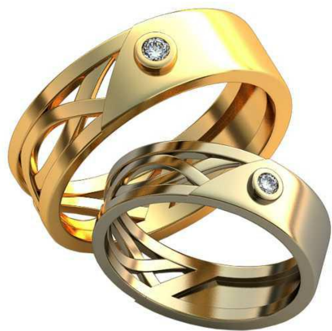
376ж/Р-17,5/Ш-6,0/Т-1,1/Кр 2.4-1шт./Вес-4,6 376м/Р-21,2/Ш-7,3/Т-1,8/Кр 2.9-1шт./Вес-8,2