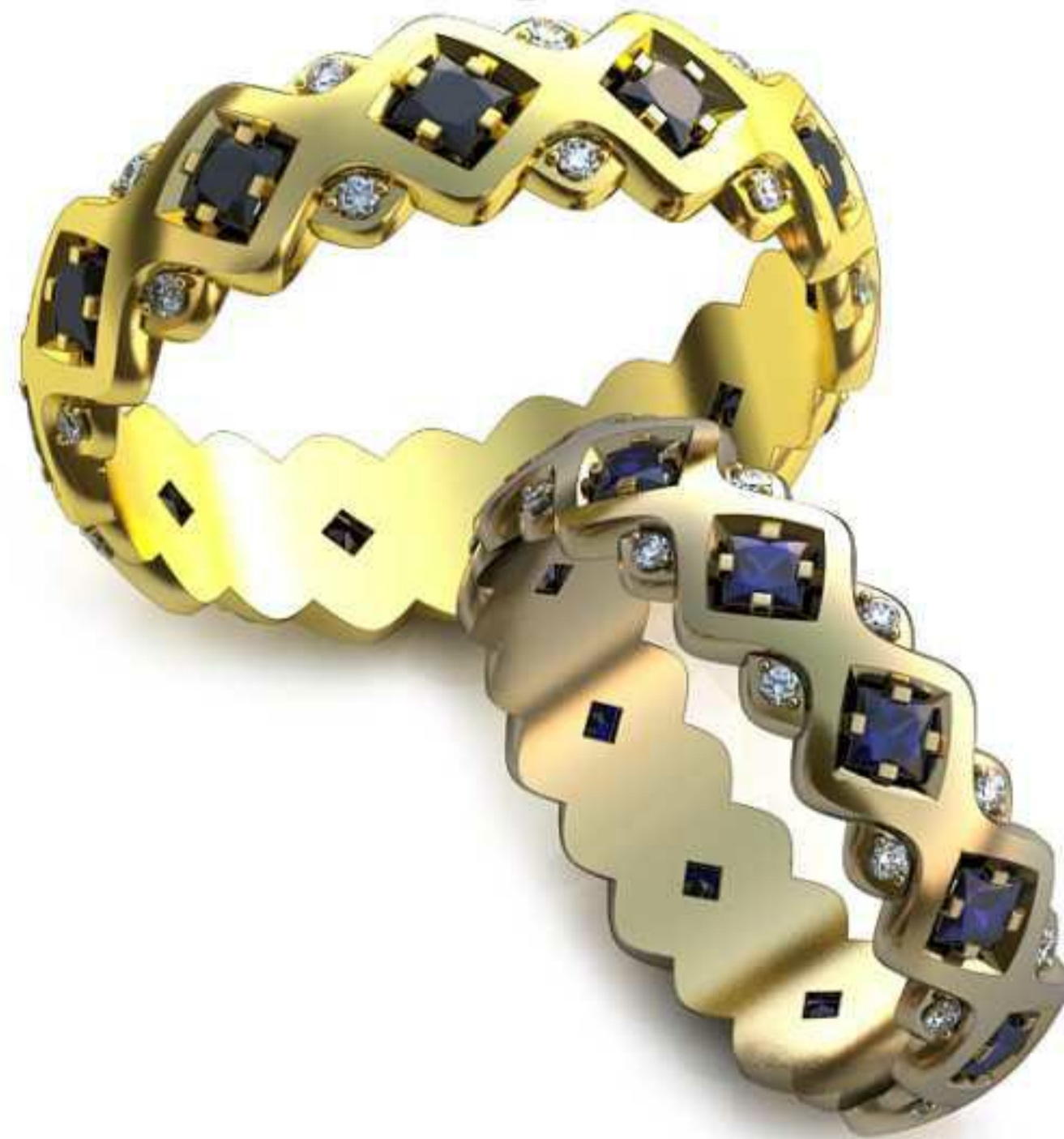
89ж/Р-17,7/Ш-5,7/Т-1,4/Кр 2.9-11 шт.,Пр 1.1-22 шт./Вес-3,9 89м/Р-19,7/Ш-6,0/Т-1,6/Кр 2.9-11 шт.,Пр 1.1-22шт./Вес-5,3