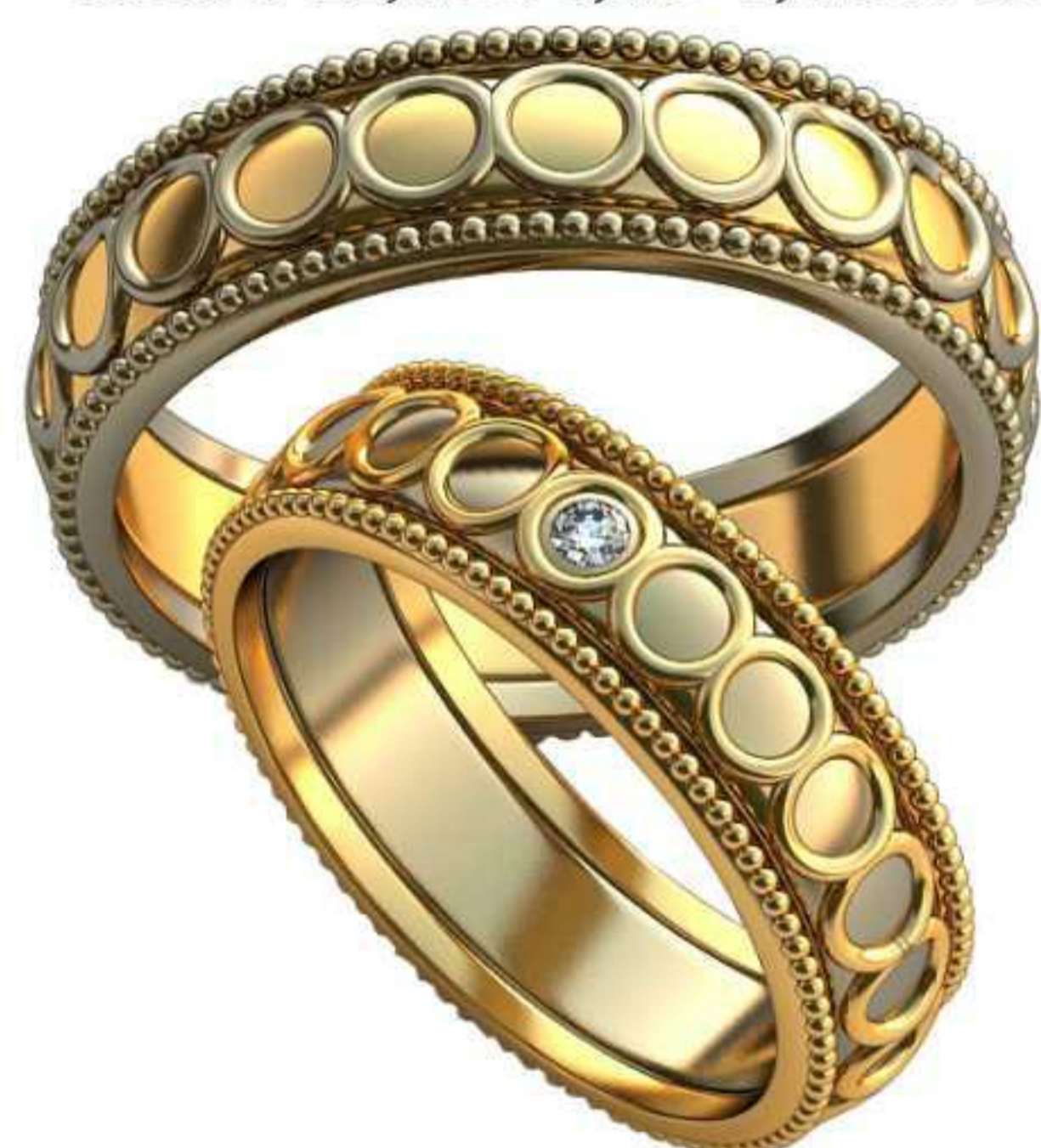
385ж/Р-17,7/Ш-6,0/Т-1,5/Кр 2.0-1шт./Вес-7,0 385м/Р-21,0/Ш-6,5/Т-2,0/Вес-7,8