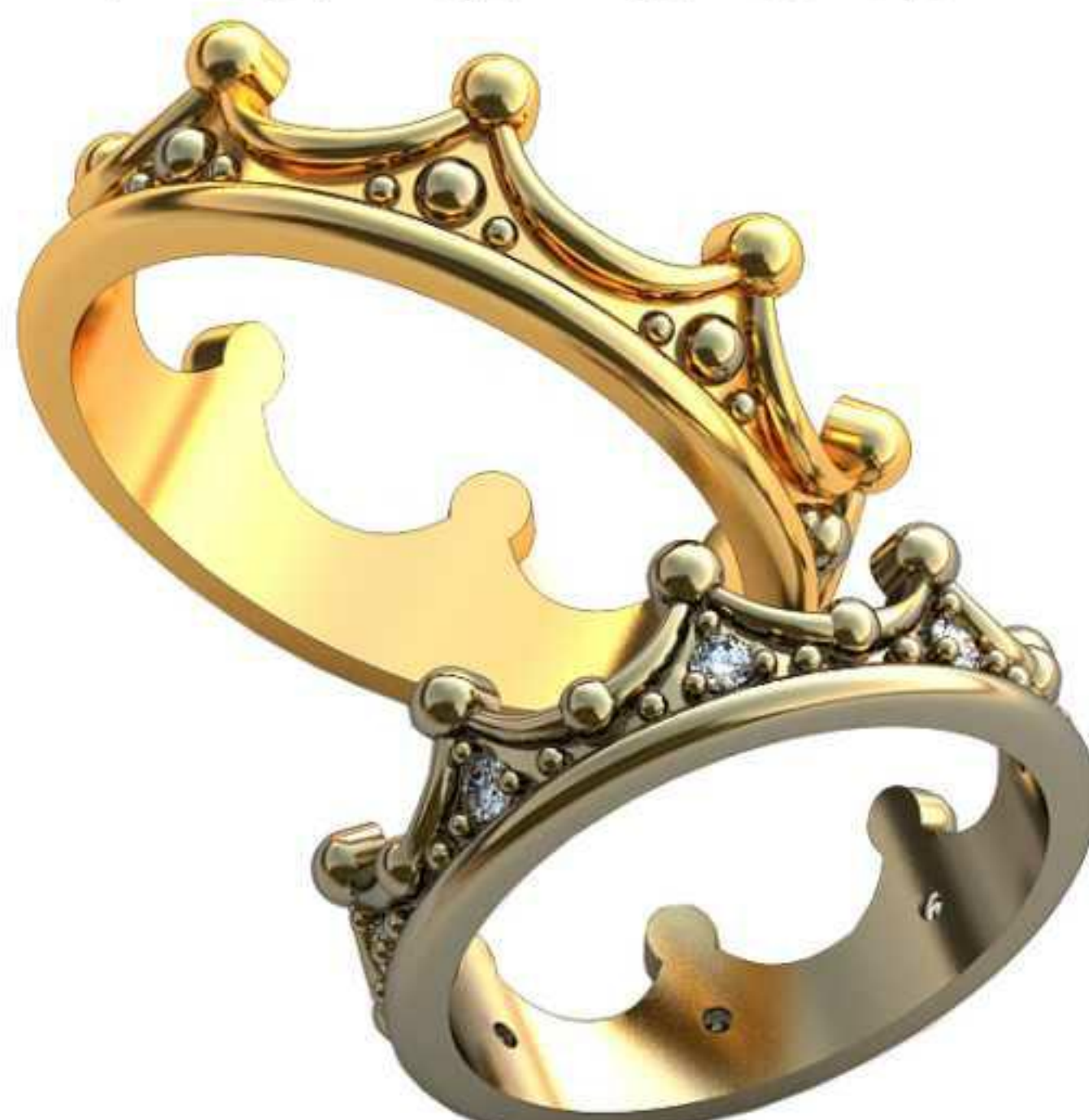
425ж/Р-16/Ш-5,7/Т-1,8/Кр 1.6-8шт./Вес-3,3 425м/Р-18,5/Ш-6,6/Т-2,1/Вес-4,9