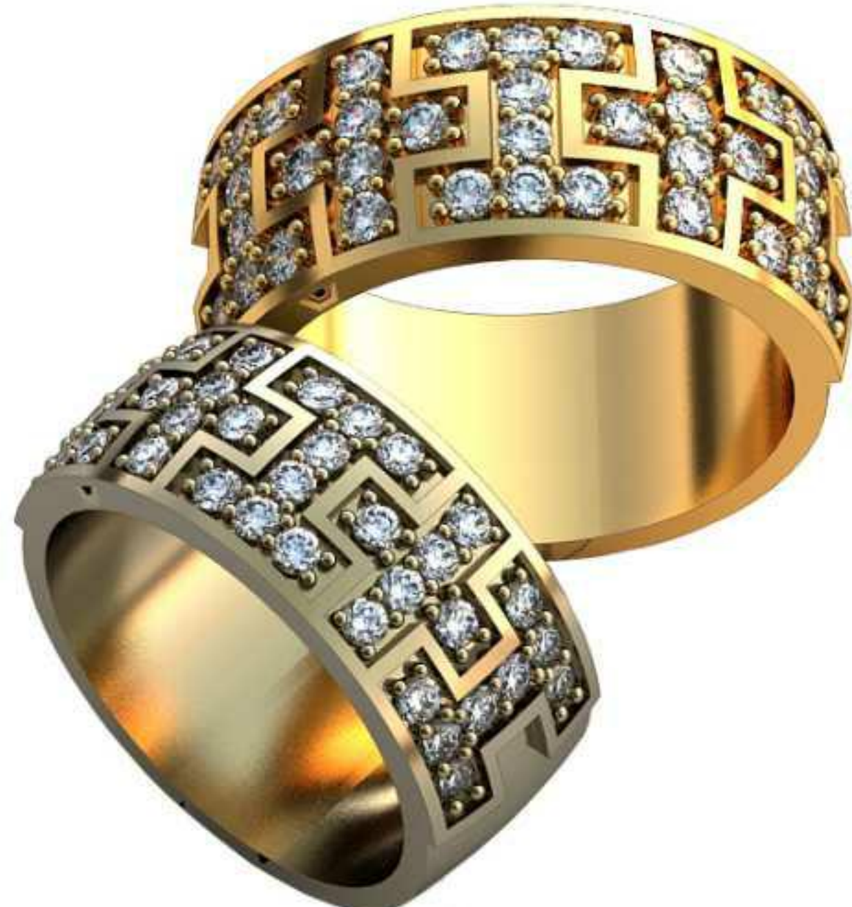
154ж/Р-17,2/Ш-8,7/Т-1,4/Кр 1.75-36шт./Вес-10,5 154м/Р-19,2/Ш-9,7/Т-1,6/Кр 1.75-36шт./Вес-14,2