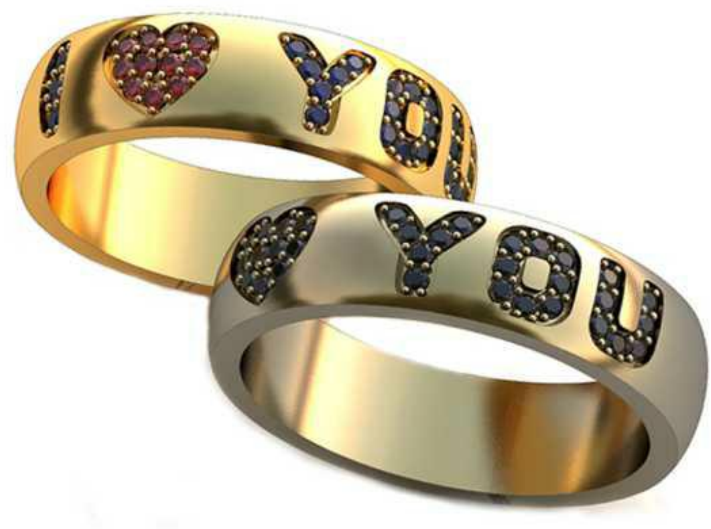
102ж/Р-18,5/Ш-5,5/Т-1,8/Кр 1.1-35шт./Вес-7,6 102м/Р-17,0/Ш-5,5/Т-1,7/Кр 1.1-35шт./Вес-6,4