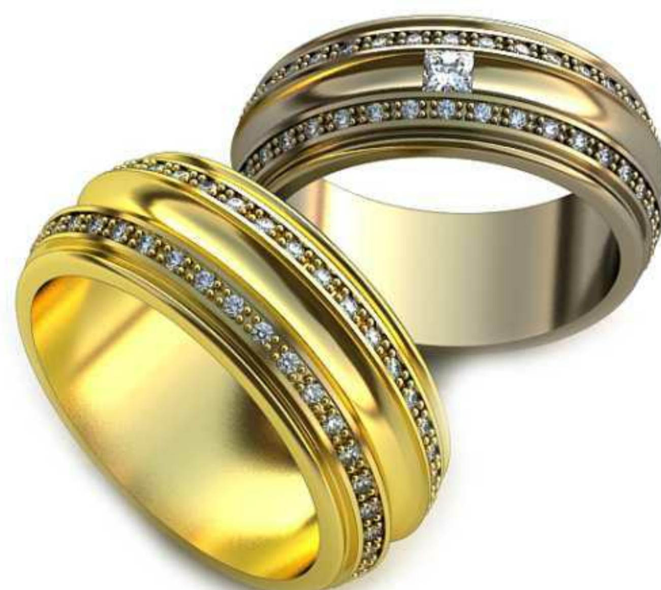
56ж/Р-17,0/Ш-7,5/Т-2,0/Кр 1.0-72шт.,2.3-1шт./Вес-7,1 56м/Р-18,5/Ш-8,2/Т-2,0/Пр 2.34x2.34-1шт. Кр 1.0-72шт./Вес-9,4