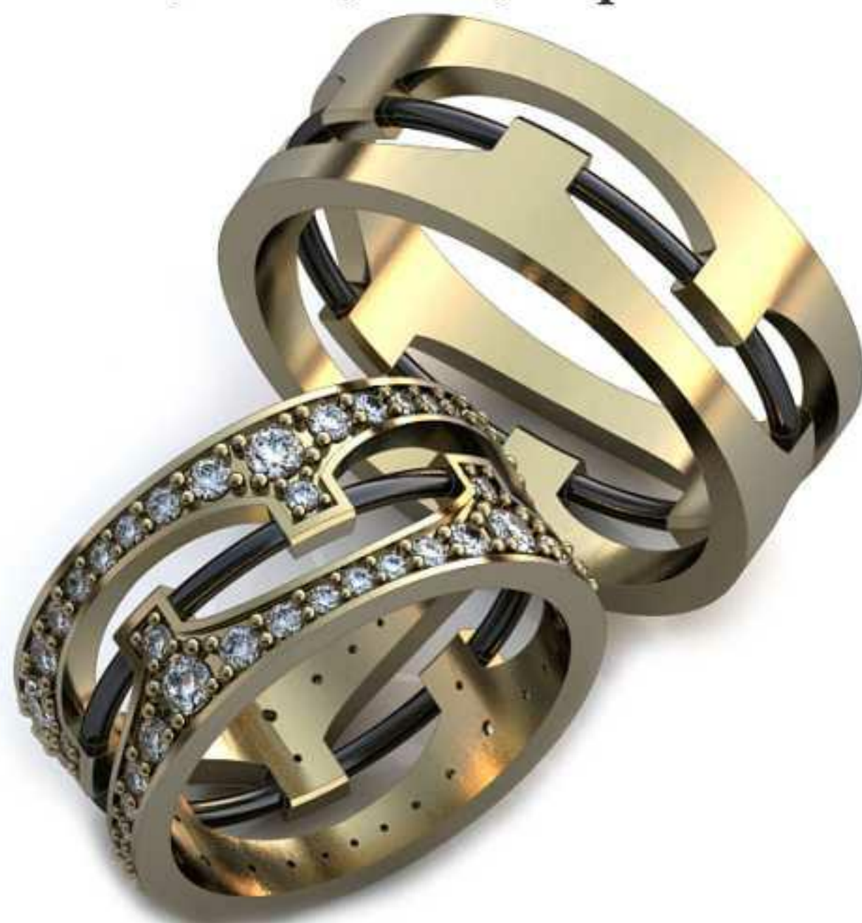
223ж/Р-18,0/Ш-9,7/Т-1,7/ Кр 1.3-24,1.4-8,1.4-16,1.5-16,2.3-8/Вес-7,4 223м/Р-21,0/Ш-8,8/Т-1,9/Вес-10,2