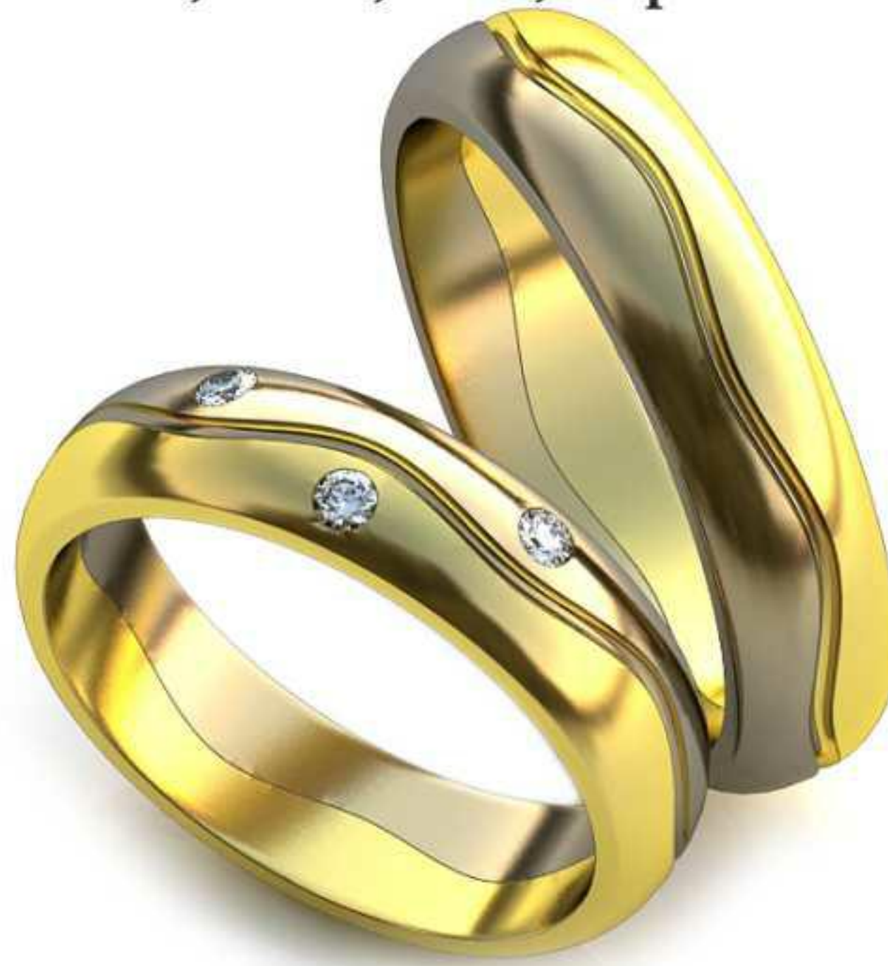
251ж/Р-17,5/Ш-5,0/Т-1,7/Кр 1.8-3шт./Вес-5,4 251м/Р-19,2/Ш-5,0/Т-1,8/Вес-6,7