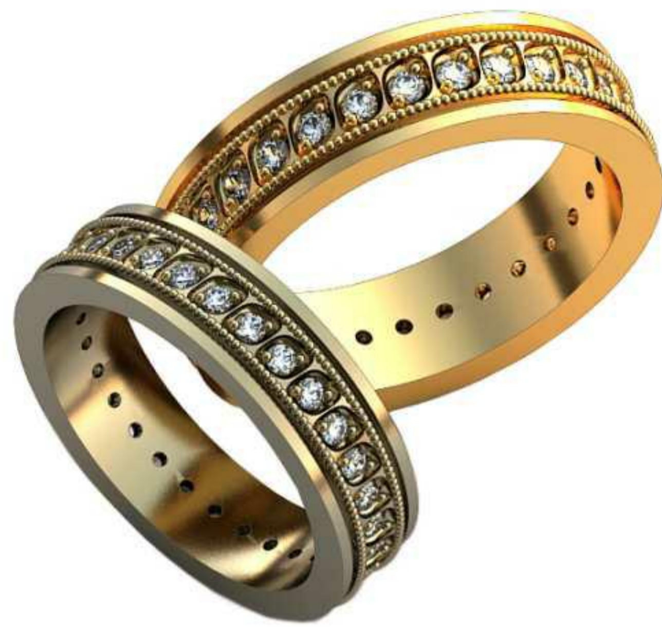
143ж/Р-16,5/Ш-5/Т-2,0/Кр 1.7-30шт./Вес-5,7 143м/Р-18,7/Ш-5,7/Т-2,2/Кр 1.5-30шт./Вес-8,3