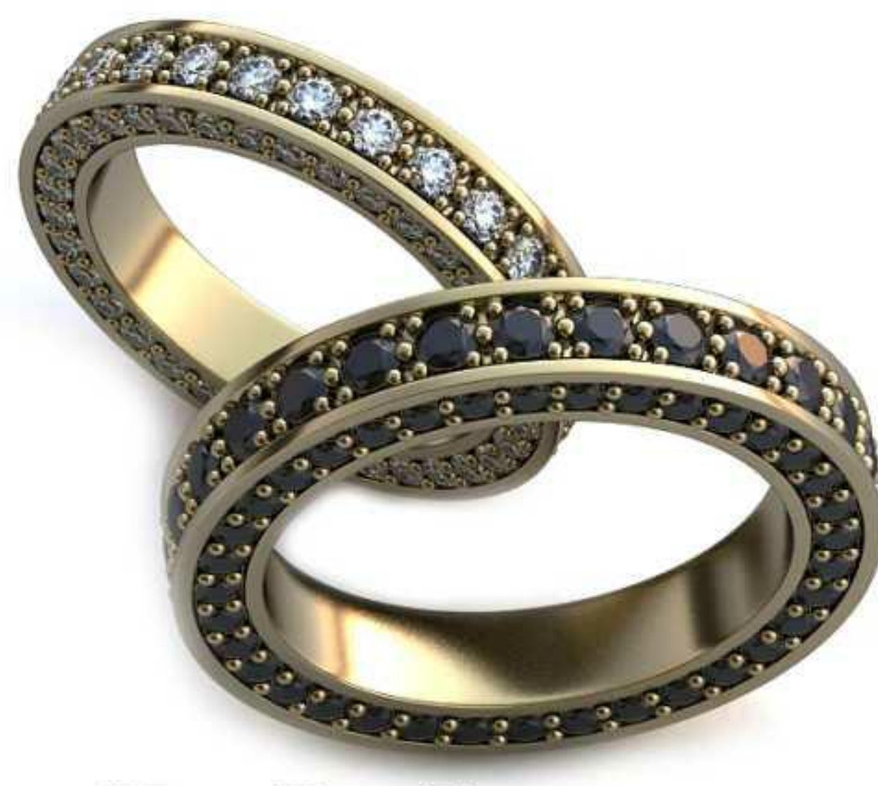
122ж/Р-17,0/Ш-4,2/Т-3,0/Кр 2.1-27шт.,1.5-72шт./Вес-7,0 122м/Р-20,0/Ш-5,0/Т-3,3/Кр 2.1-27шт.,1.5-72шт./Вес-11,0