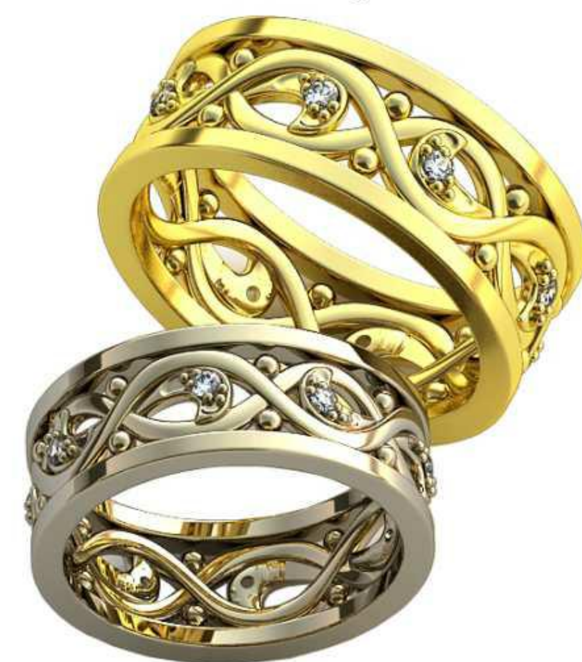
370ж/Р-18,0/Ш-8,0/Т-1,7/Кр 1,6-8шт./Вес-7,1 370м/Р-20,5/Ш-9,1/Т-2,0/Кр 1,6-8шт./Вес-10,7