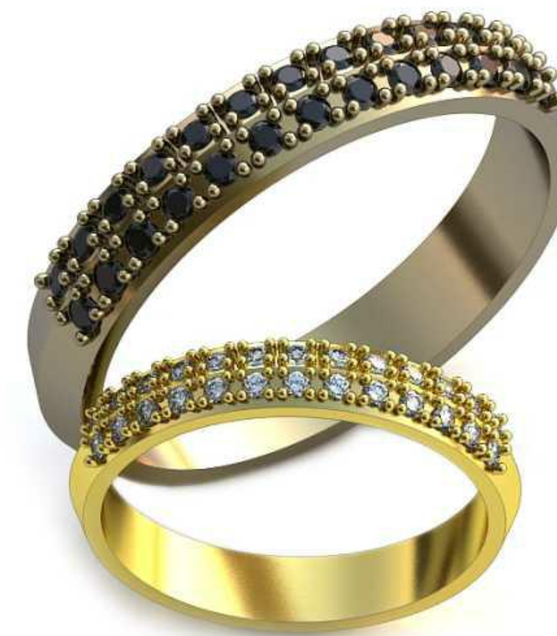
216ж/Р-16,5/Ш-5,0/Т-1,5/Кр 2.1-12шт./Вес-3,5 216м/Р-22,2/Ш-4,4/Т-1,8/Кр 1.6-26шт./Вес-6,4