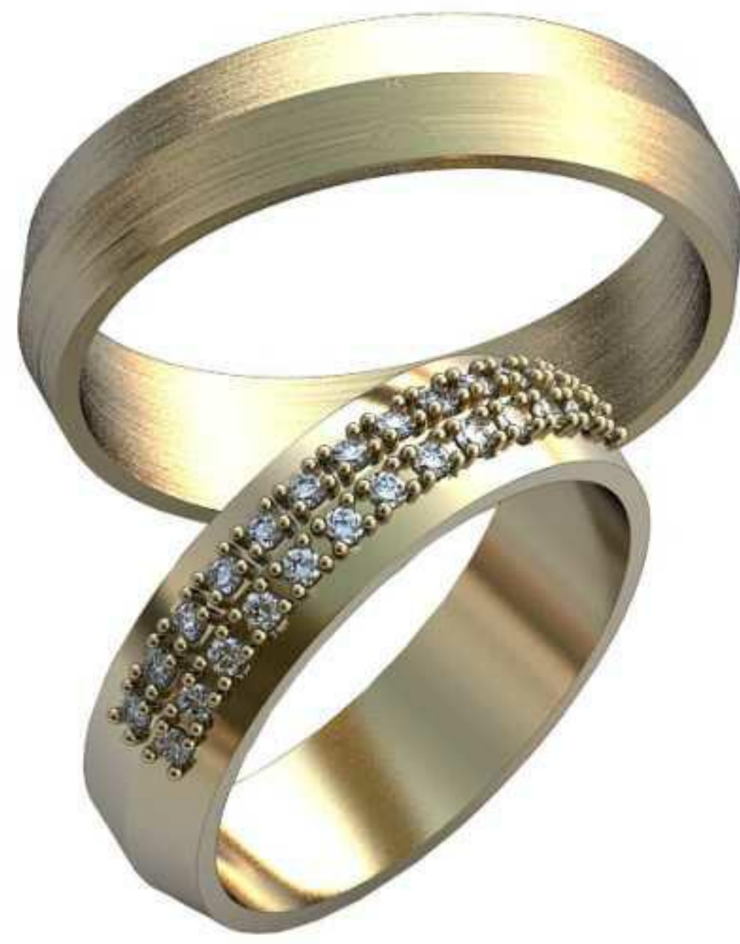
197ж/Р-16,5/Ш-5,0/Т-1,4/Кр 1.2-26шт./Вес-3,9 197м/Р-19,0/Ш-5,0/Т-1,4/Вес-4,4