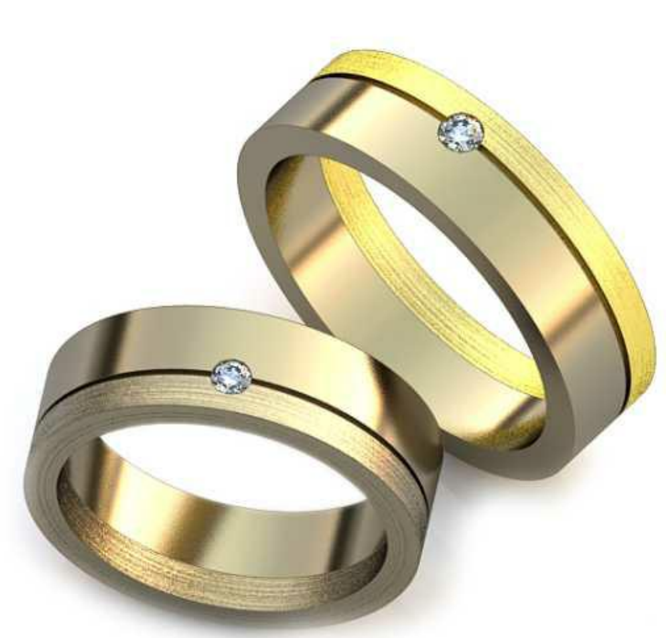
42ж/Р-17/Ш-6,0/Т-1,7/Кр 2.0-1шт./Вес-7,7 42м/Р-19,2/Ш-6,0/Т-1,8/Кр 2,3-1шт./Вес-9,8