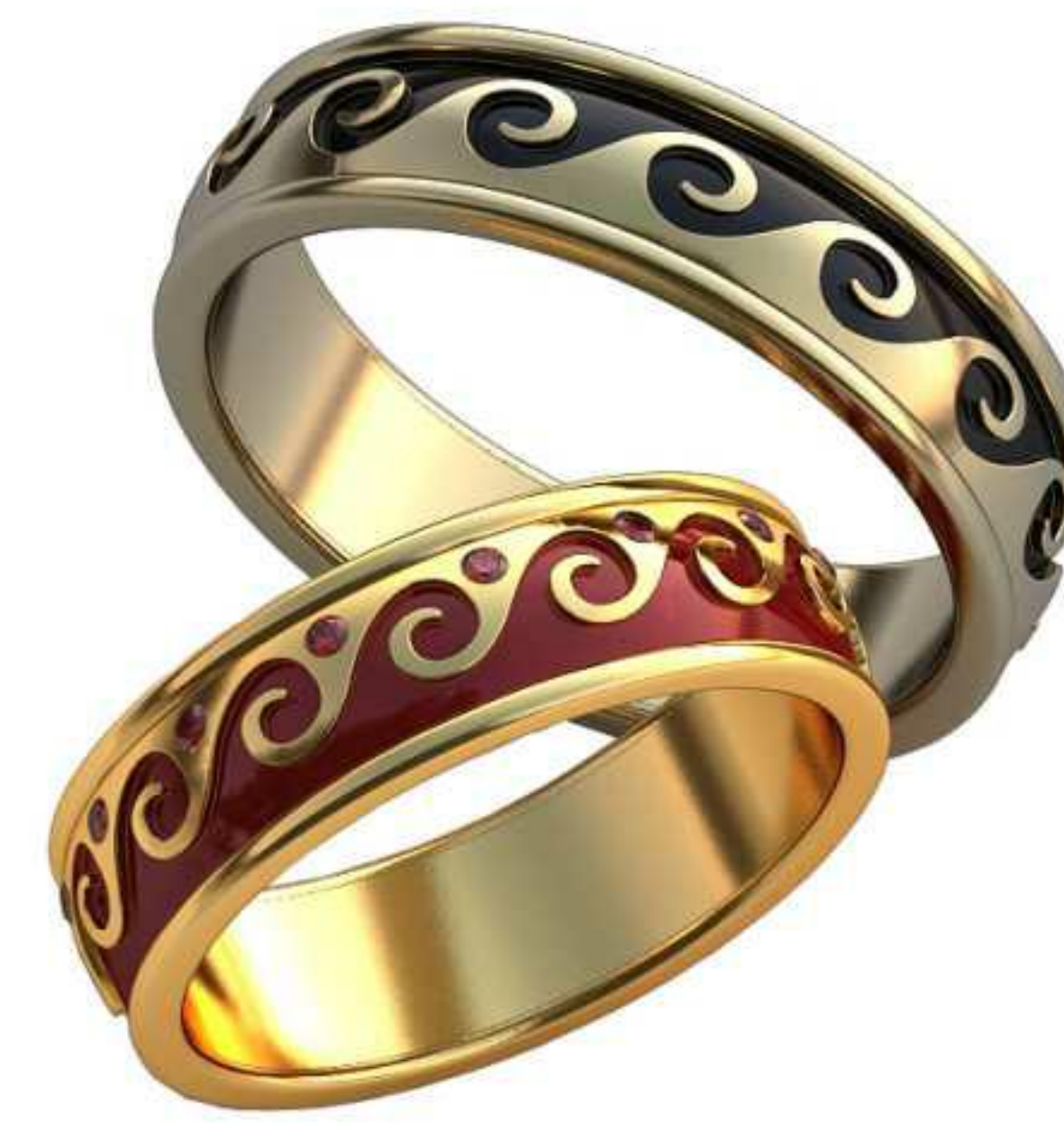
303ж/Р-17,5/Ш-5,8/Т-1,5/Кр 1.1-15шт./Вес-5,3 303м/Р-19,5/Ш-5,6/Т-1,7/Вес-6,5