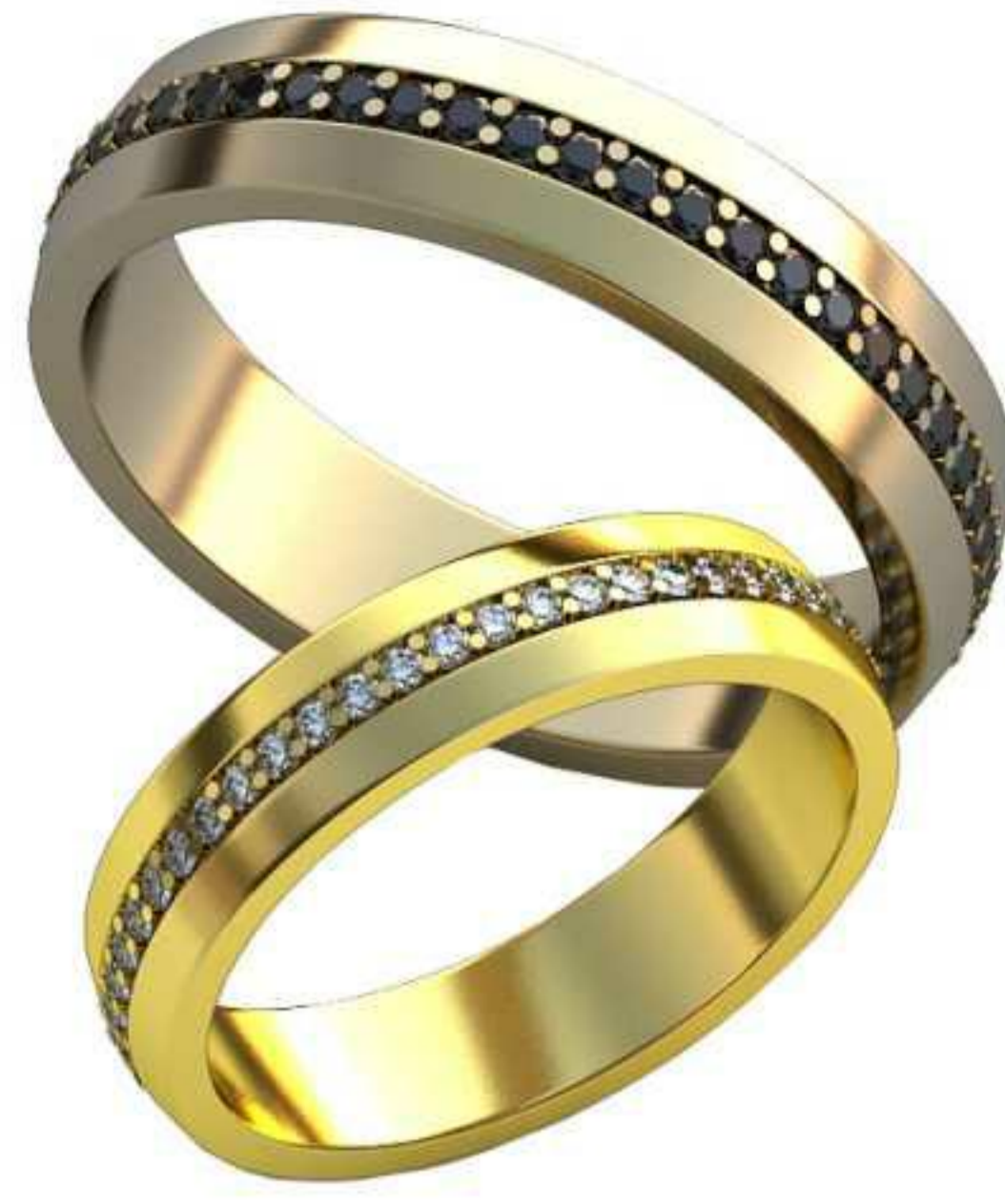
317ж/Р-19,0/Ш-5,0/Т-1,7/Кр 1.3-51шт./Вес-5,6 317м/Р-22,7/Ш-6,0/Т-1,9/Кр 1.3-51шт./Вес-9,6