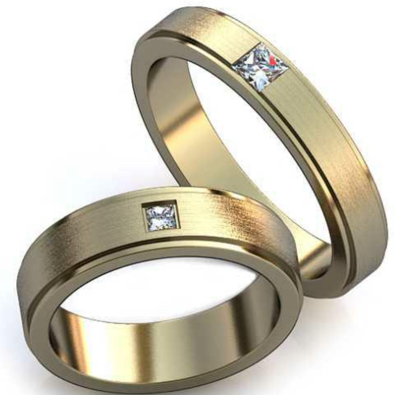
09ж/Р-16,3/Ш-5,0/Т-1,7/Пр 2.4x2,4-1шт./Вес-6,0 09м/Р-19,0/Ш-4,0/Т-1,9/Пр 3.0x3.0-1шт./Вес-6,2