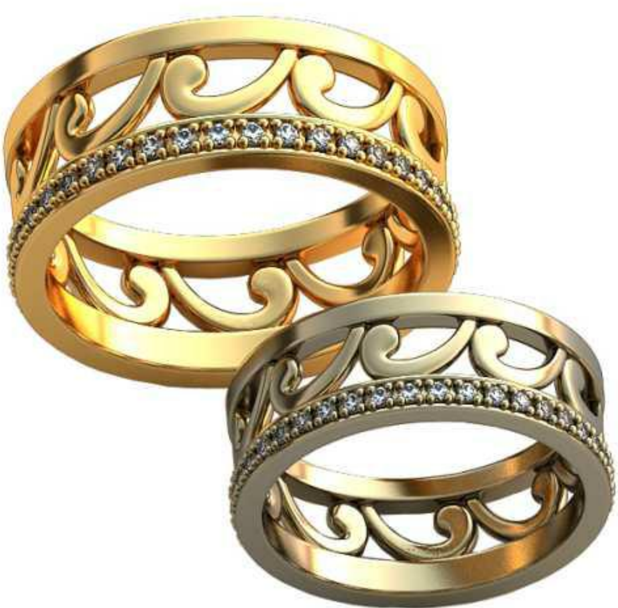
373ж/Р-17,5/Ш-7,5/Т-1,5/Кр 1,2-40шт./Вес-5,6 373м/Р-20,5/Ш-8,7/Т-2,0/Кр 1,2-40шт./Вес-9,0