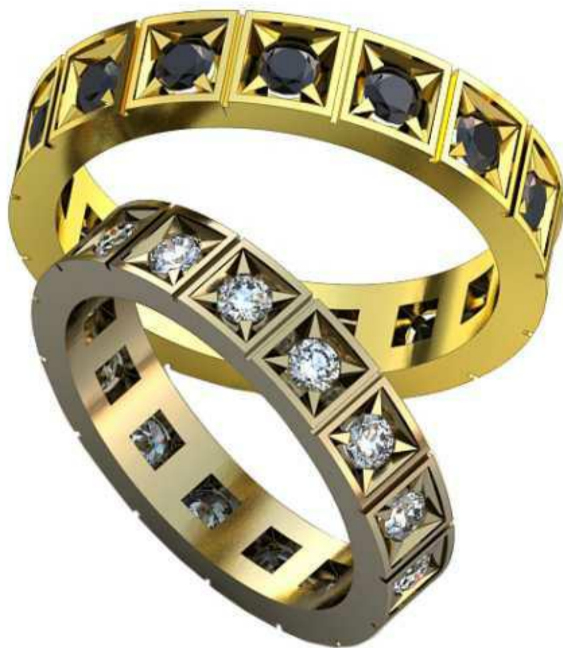
502ж/Р-17,2/Ш-4,2/Т-2,0/Кр 2.5-15шт./Вес-4,2 502м/Р-19,5/Ш-4,7/Т-2,0/Кр 2.7-15шт./Вес-5,4