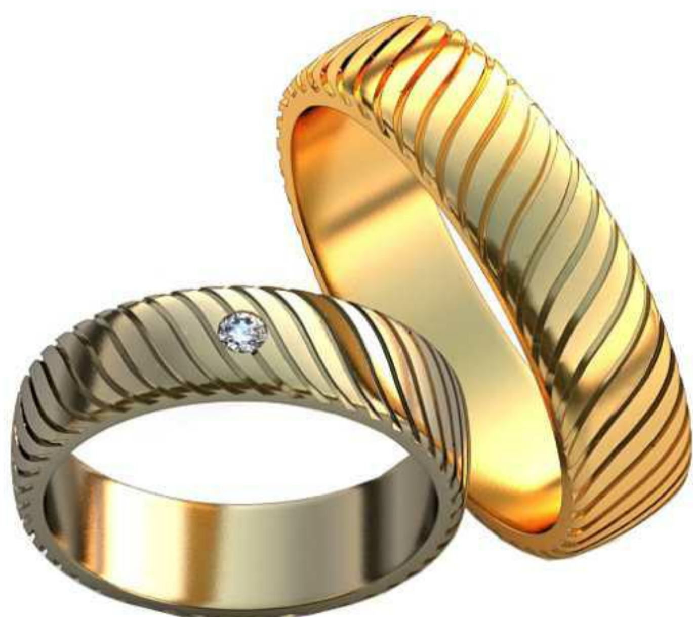
472ж/Р-16,2/Ш-5,2/Т-1,3/Кр 2.0-1шт./Вес-4,3 472м/Р-20/Ш-5,8/Т-1,7/Вес-7,5