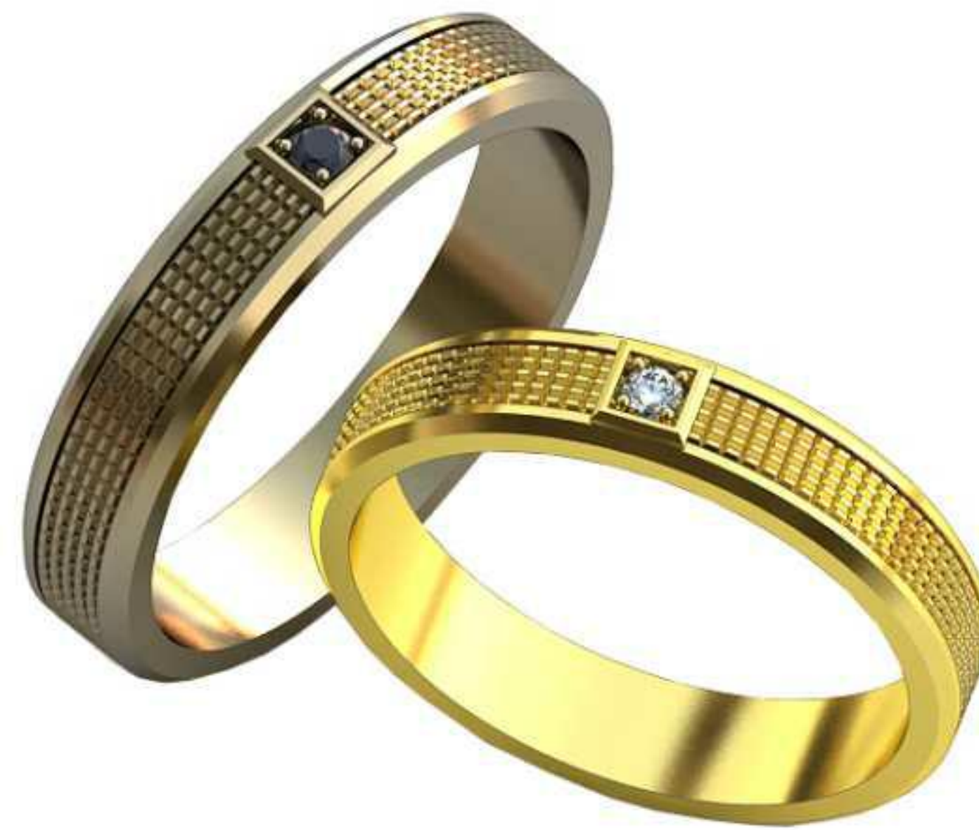
131ж/Р-20,3/Ш-4,5/Т-1,6/Кр 2.0-1шт./Вес-5,9 131м/Р-22,0/Ш-5,0/Т-1,7/Кр 2.0-1шт./Вес-7,6