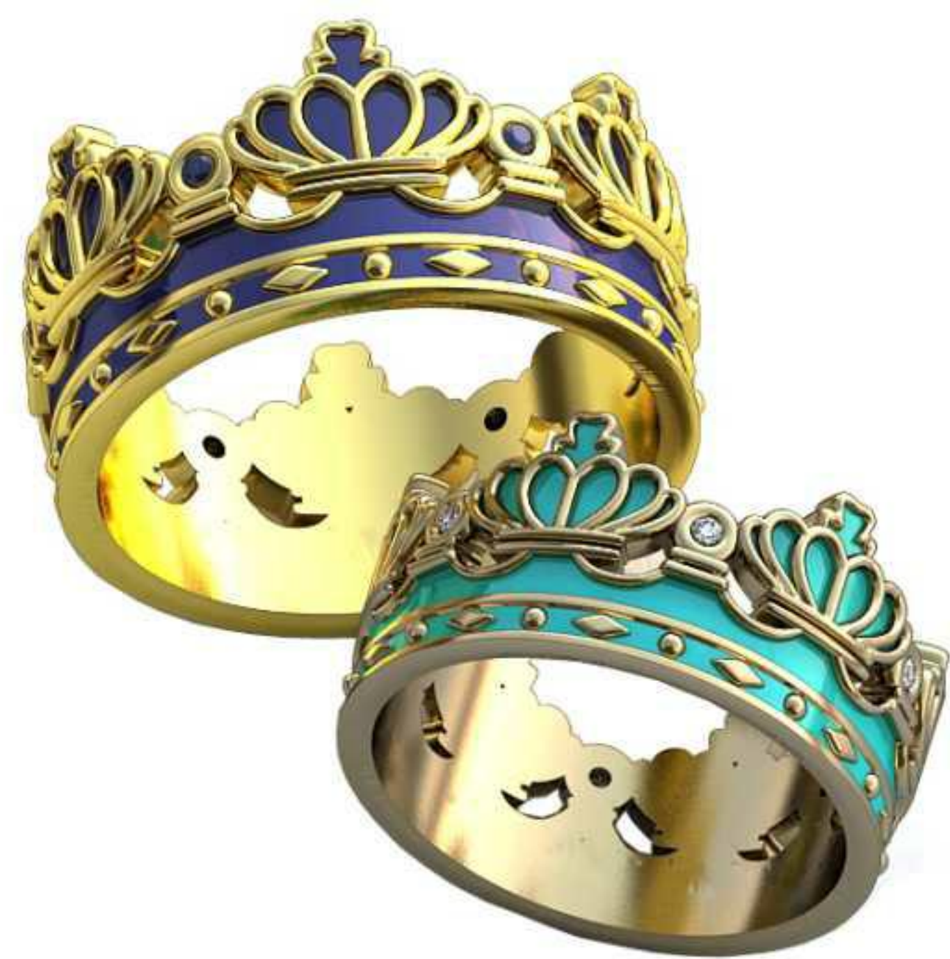
430ж/Р-16,7/Ш-9,5/Т-1,5/Кр 1.0-6шт./Вес-6,2 430м/Р-19,2/Ш-11/Т-1,9/Кр 1.25-6шт./Вес-9,6