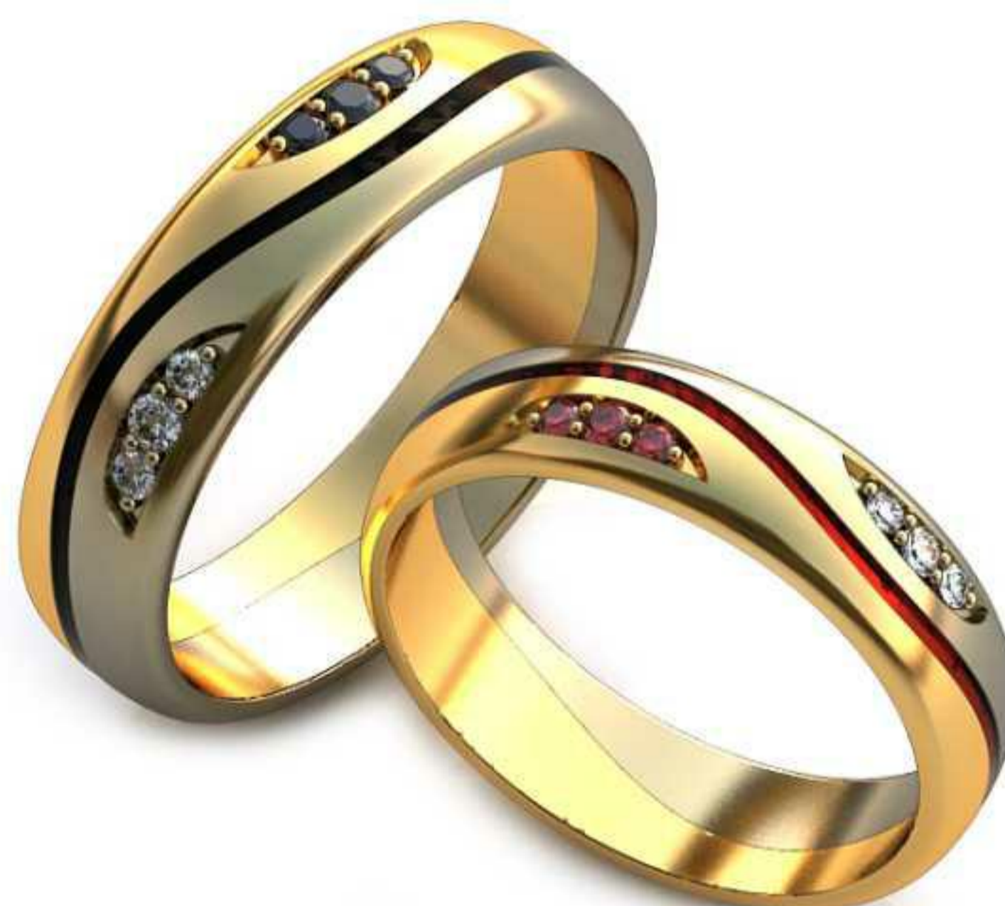
86ж/Р-17,5/Ш-5,0/Т-1,4/Кр 1.6-4шт.,1.3-8шт./Вес-4,3 86м/Р-19,7/Ш-5,5/Т-1,5/Кр 1.6-4шт.,1.3-8шт./Вес-6,1