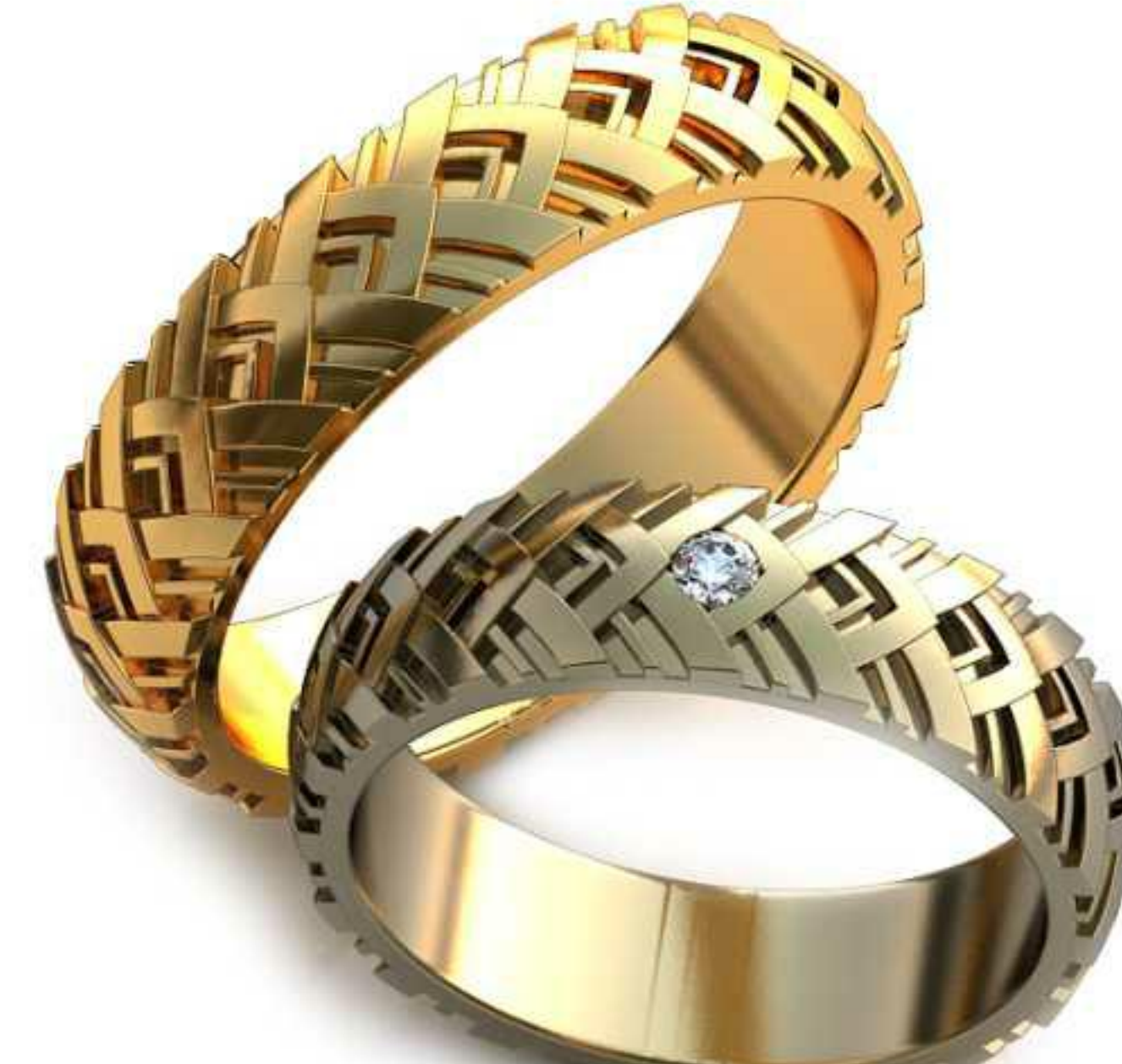
285ж/Р-16,5/Ш-5,1/Т-1,6/Кр 2.05-1шт./Вес-5,0 285м/Р-18,7/Ш-5,1/Т-2/Вес-6,6