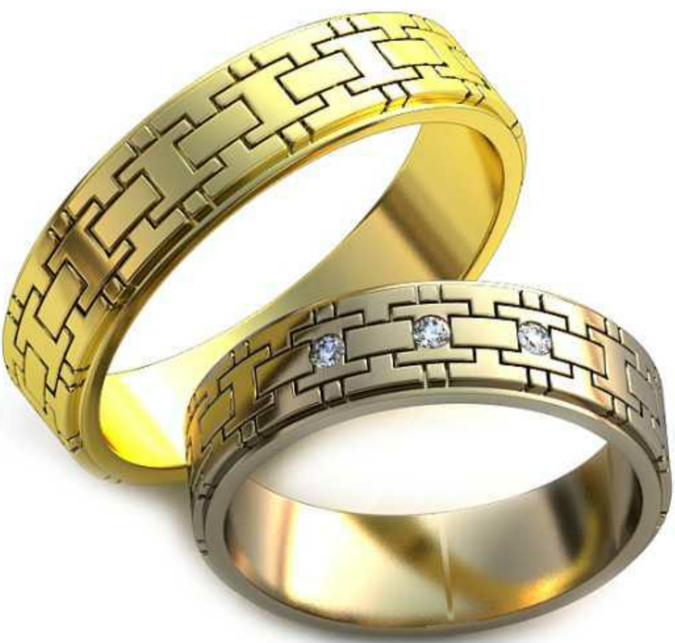
295ж/Р-21,5/Ш-7,0/Т-1,5/Кр 1.9-3шт./Вес-9,5 295м/Р-25,0/Ш-7,0/Т-1,8/Вес-13,0