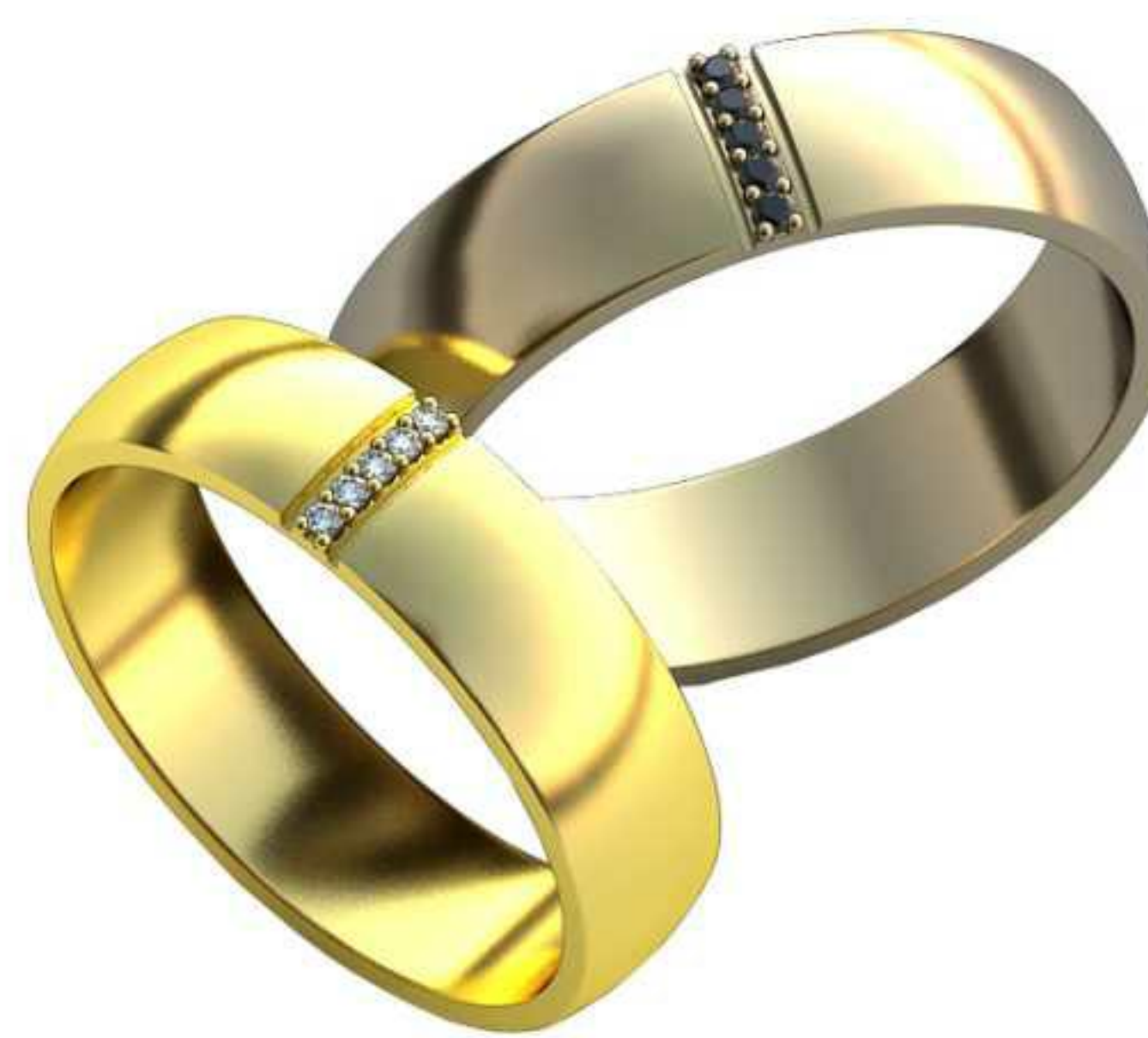
158ж/Р-19,0/Ш-5,5/Т-1,3/Кр 1.1-5шт./Вес-5,4 158м/Р-20,5/Ш-6,0/Т-1,4/Кр 1.1-5шт./Вес-7,0