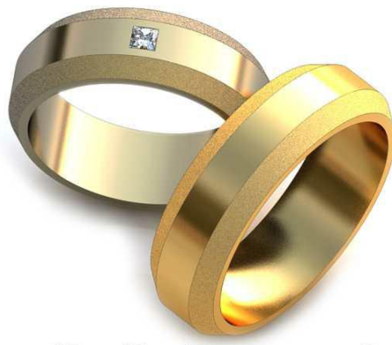
62ж/Р-17,0/Ш-6,5/Т-1,7/Пр 2.0x2.0-1шт./Вес-7,4 62м/Р-19,2/Ш-6,5/Т-2,0/Вес-9,4