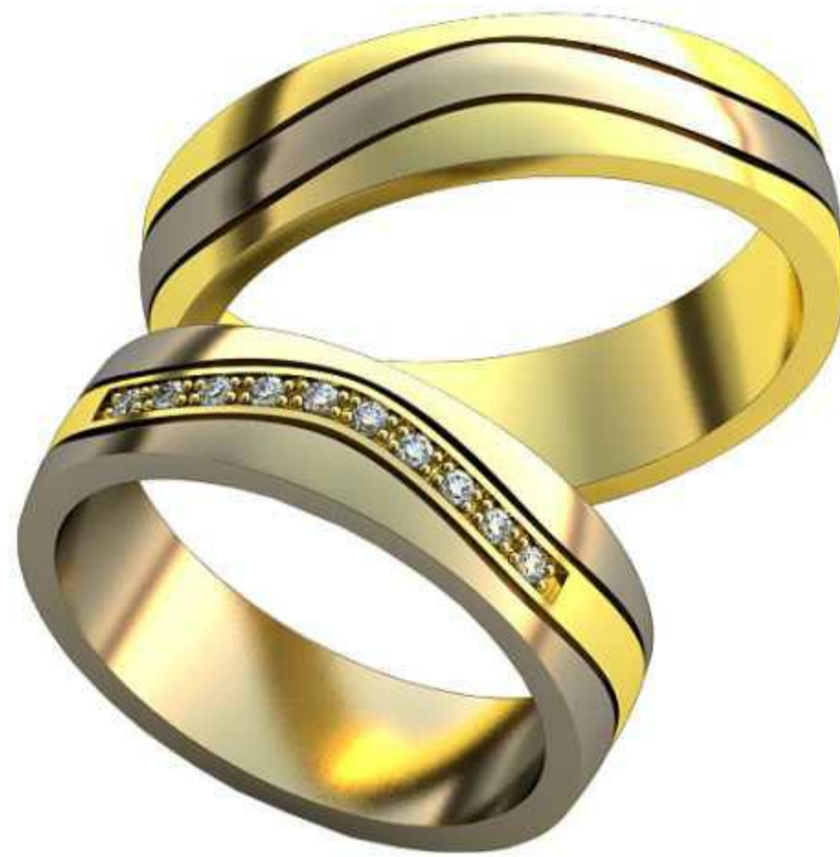
503ж/Р-17,7/Ш-5,5/Т-1,6/Кр 1.25-10шт./Вес-6,1 503м/Р-19,7/Ш-5,5/Т-1,6/Вес-6,7