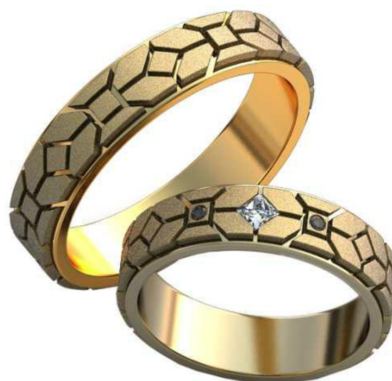
458ж/Р-17,5/Ш-5,4/Т-1,6/Пр 3.3x3.3-1шт.Кр 1.4-2шт./Вес-6,0 458м/Р-21,2/Ш-5,4/Т-1,9/Вес-8,5