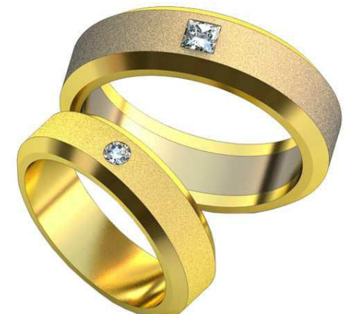
489ж/Р-17/Ш-5,6/Т-1,8/Кр 2.5-1шт./Вес-12 489м/Р-20,5/Ш-6,8/Т-2,1/Пр 3.0x3.0-1шт./Вес-20