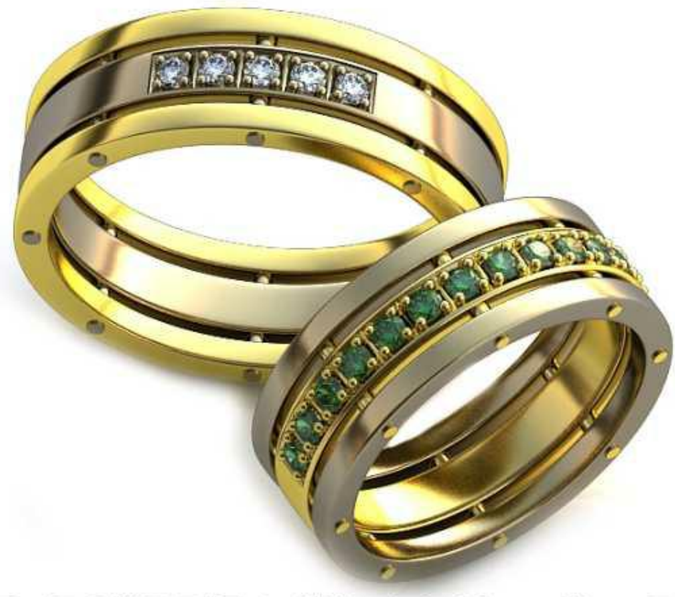
121ж/Р-17,2/Ш-7/Т-1,6/Кр 1.8-13шт./Вес-7,6 121м/Р-20,5/Ш-7/Т-1,8/Кр 1.8-5шт./Вес-10,0