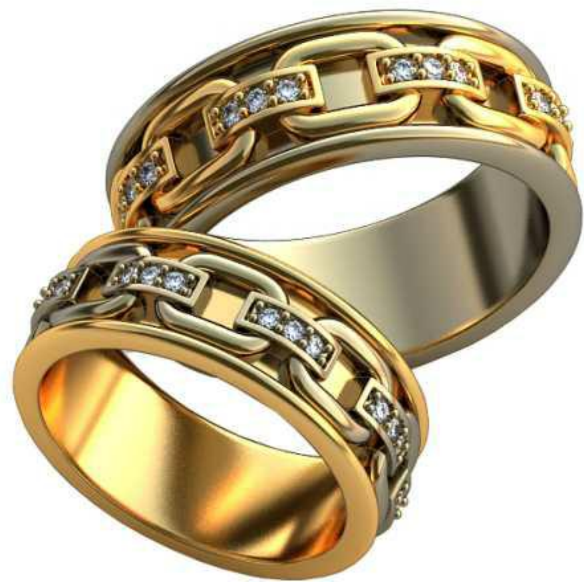
394ж/Р-16,7/Ш-7,0/Т-1,6/Кр 1.2-24шт./Вес-8,0 394м/Р-19,0/Ш-8,0/Т-1,9/Кр 1.2-24шт./Вес-12,0