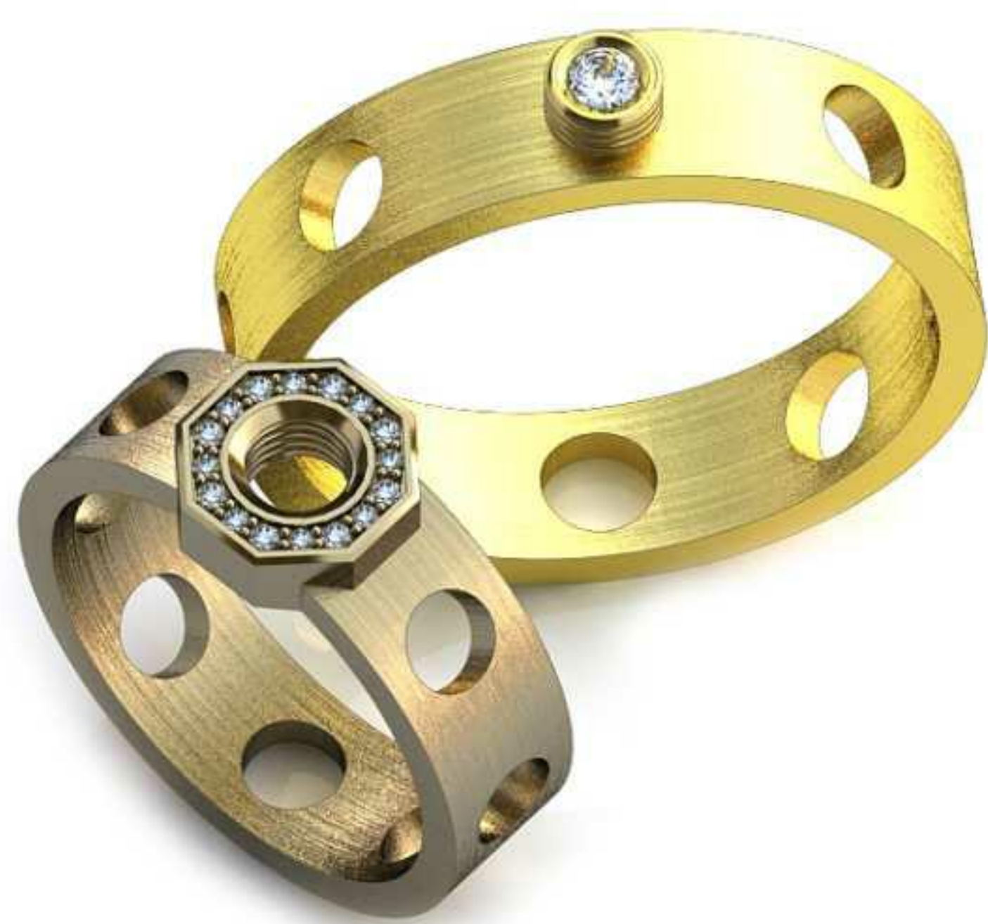
220ж/Р-17,0/Ш-5,9/Т-1,5/Кр 1.0-16шт./Вес-6,7 220м/Р-22,2/Ш-5,9/Т-1,6/Кр 2.5-1шт./Вес-8,1