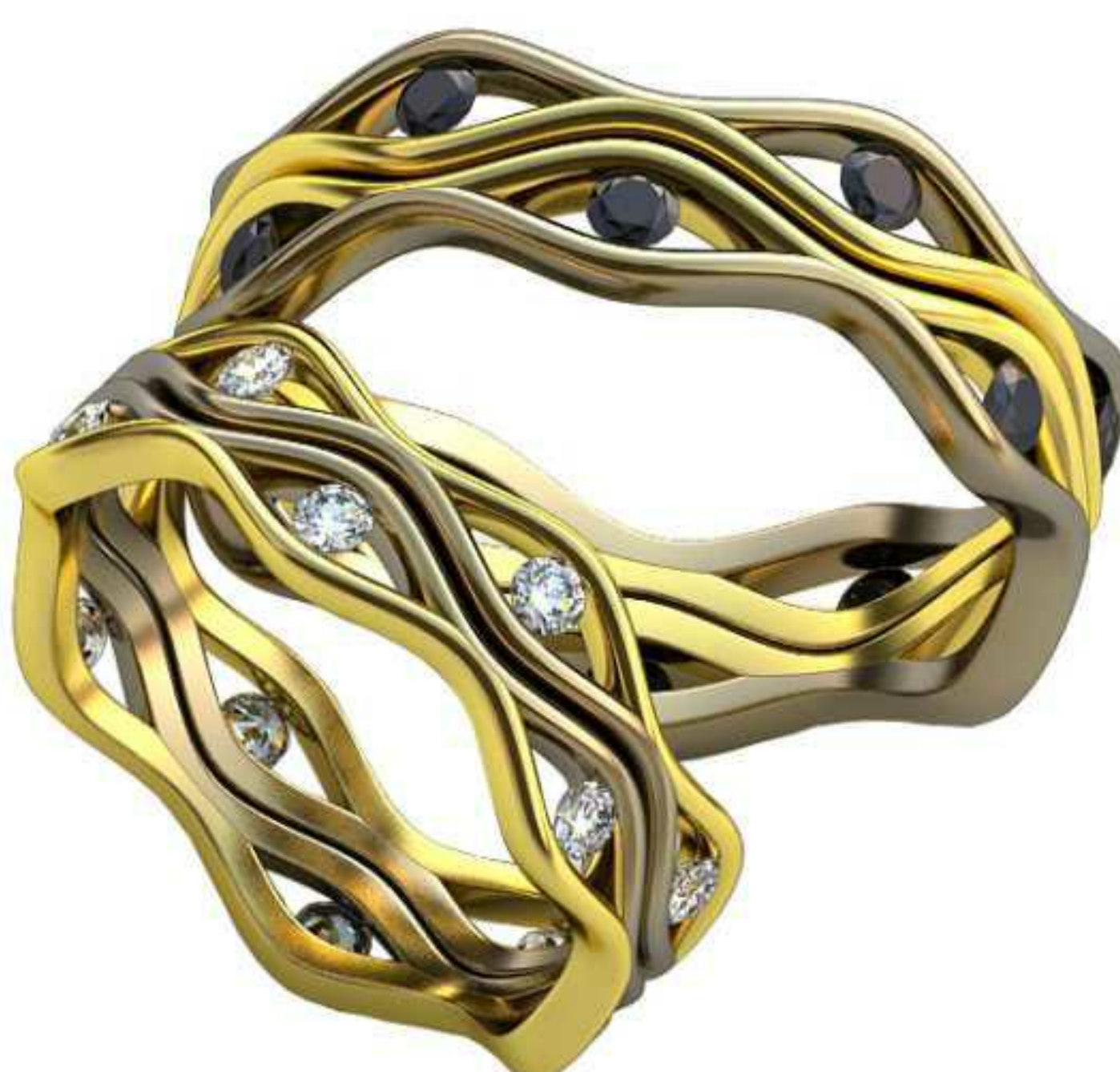
388ж/Р-16,7/Ш-5,9/Т-1,7/Кр 2.0-12шт./Вес-3,9 388м/Р-19,2/Ш-6,8/Т-1,7/Кр 2.0-12шт./Вес-6,1