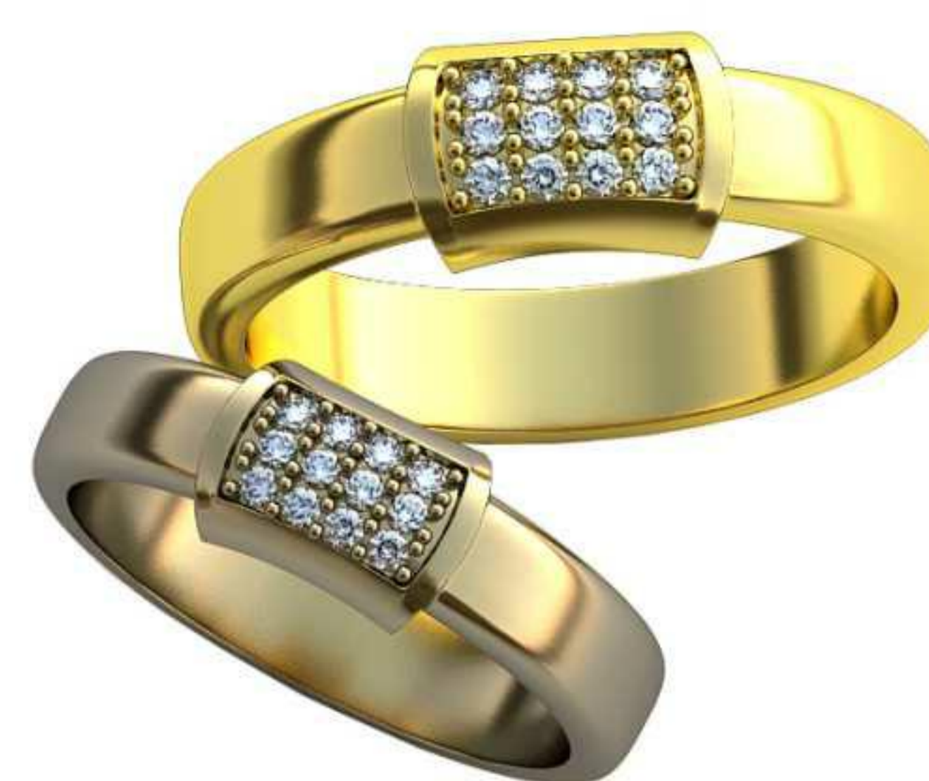
378ж/Р-17,0/Ш-4,0/Т-1,5/Кр 1.3-12шт./Вес-9,1 378м/Р-19,7/Ш-4,7/Т-1,7/Кр 1.3-12шт./Вес-7,2