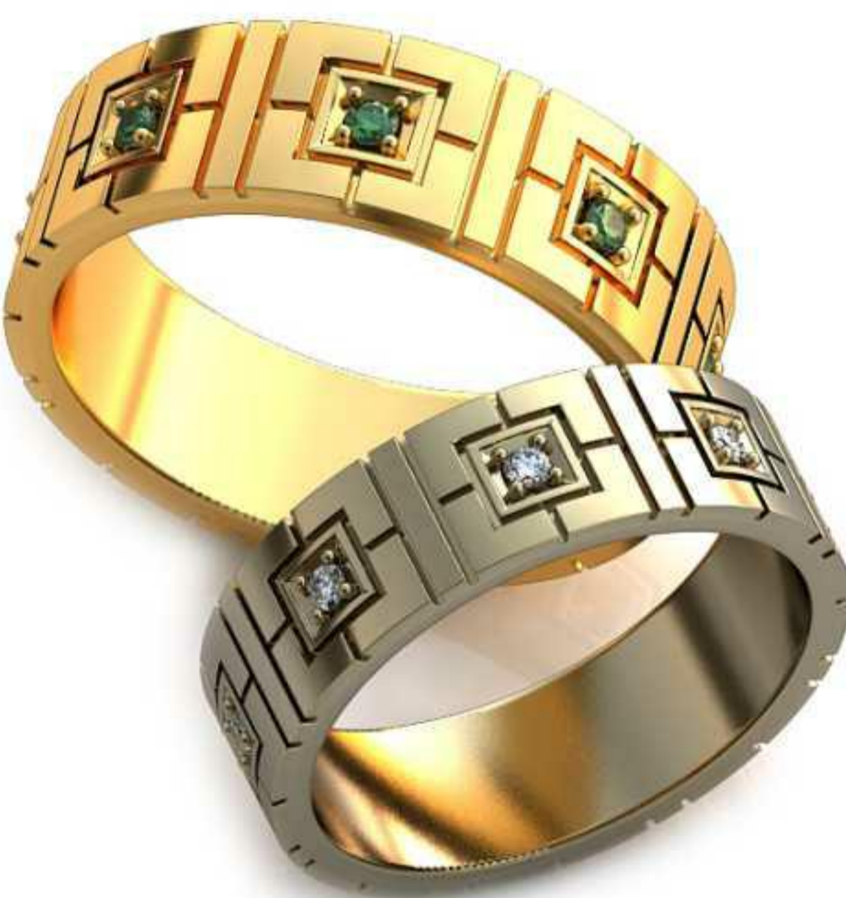
296ж/Р-18,7/Ш-6,3/Т-1,5/Кр 1.6-8шт./Вес-7,2 296м/Р-20,7/Ш-7,0/Т-1,6/Кр 1.8-8шт./Вес-10,0