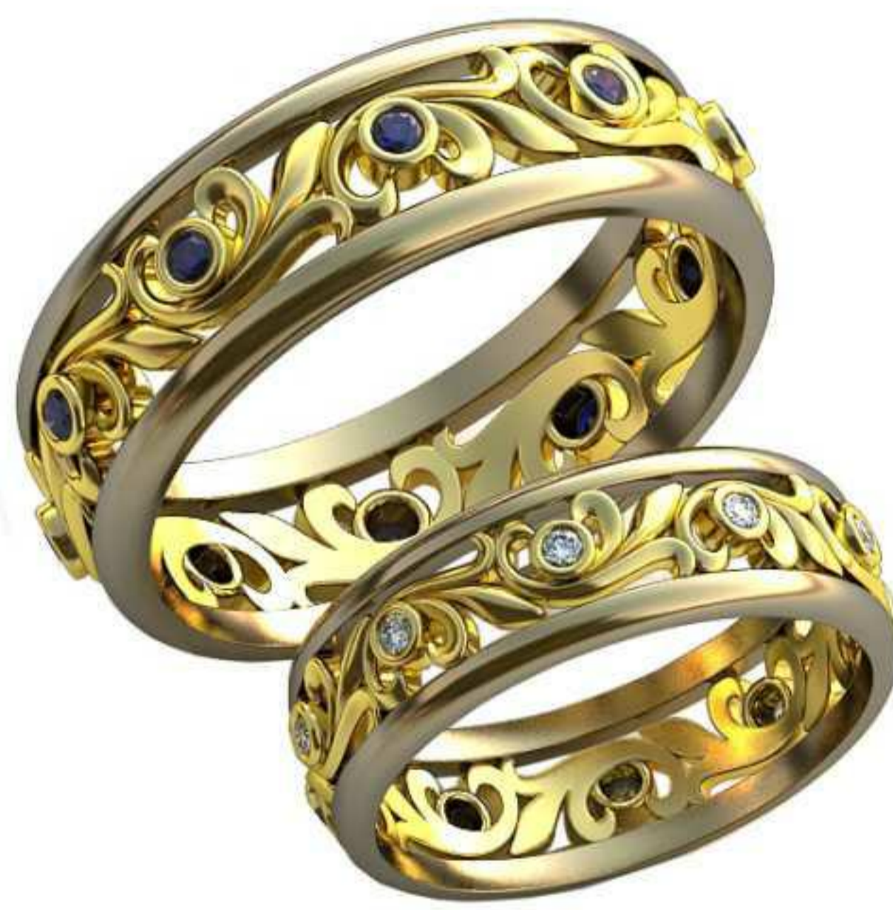
446ж/Р-15,2/Ш-5,5/Т-1,2/Кр 1.25-10шт./Вес-2,7 446м/Р-19,2/Ш-7/Т-1,5/Кр 1.55-10шт./Вес-5,5