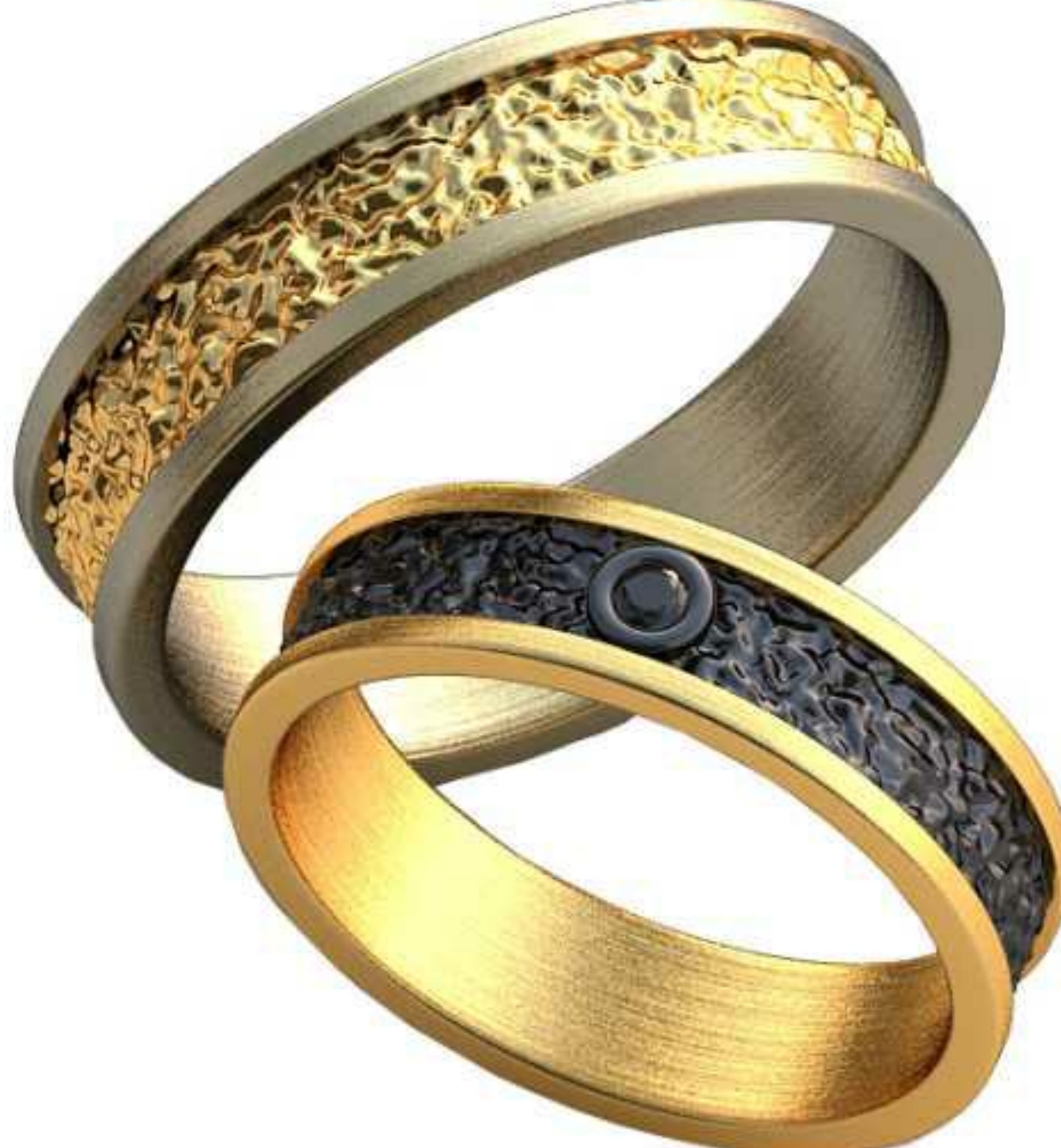
344ж/Р-16,0/Ш-4,6/Т-1,2/Кр 1.7-1шт./Вес-9,3 344м/Р-18,7/Ш-5,4/Т-1,4/Вес-5,2