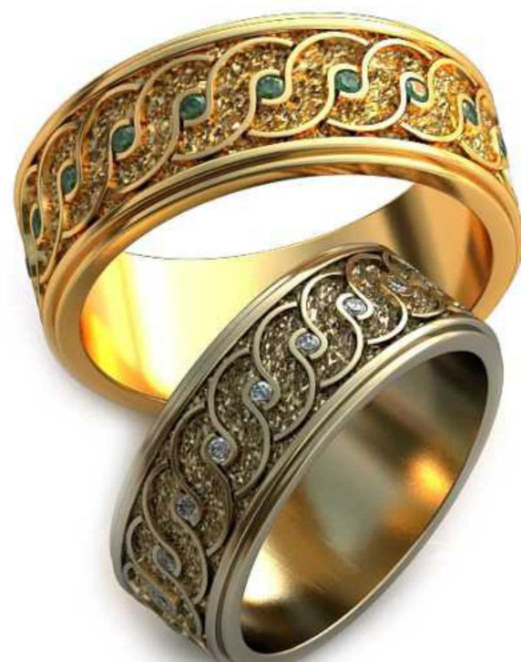
275ж/Р-16,2/Ш-7,0/Т-1,4/Кр 1.2-19шт./Вес-5,8 275м/Р-18,5/Ш-8,0/Т-1,6/Кр 1.2-19шт./Вес-8,4