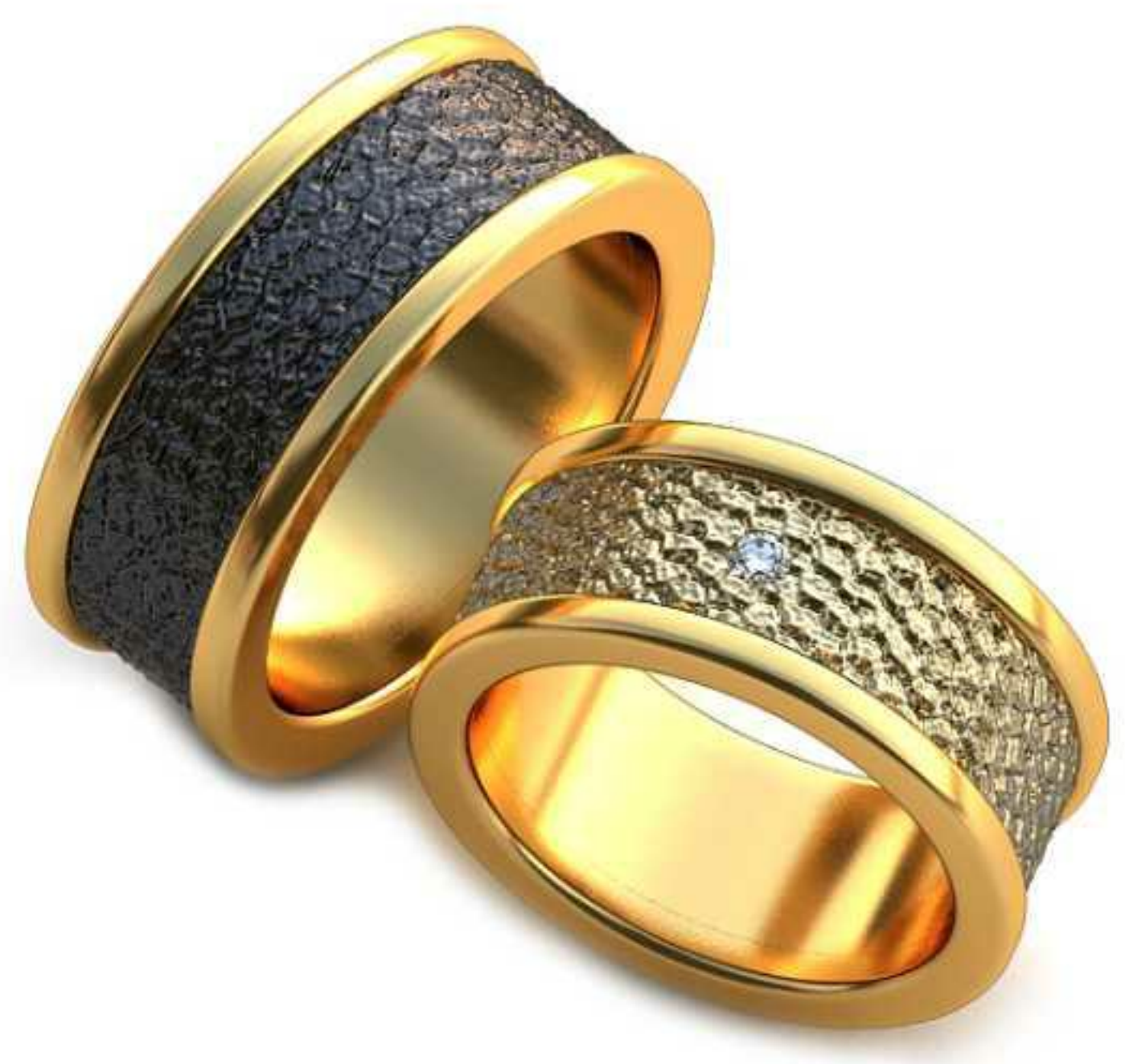
66ж/Р-16,7/Ш-8,8/Т-2,2/Кр 2.0-1шт./Вес-20,0 66м/Р-19,0/Ш-8,8/Т-2,5/Вес-25,6