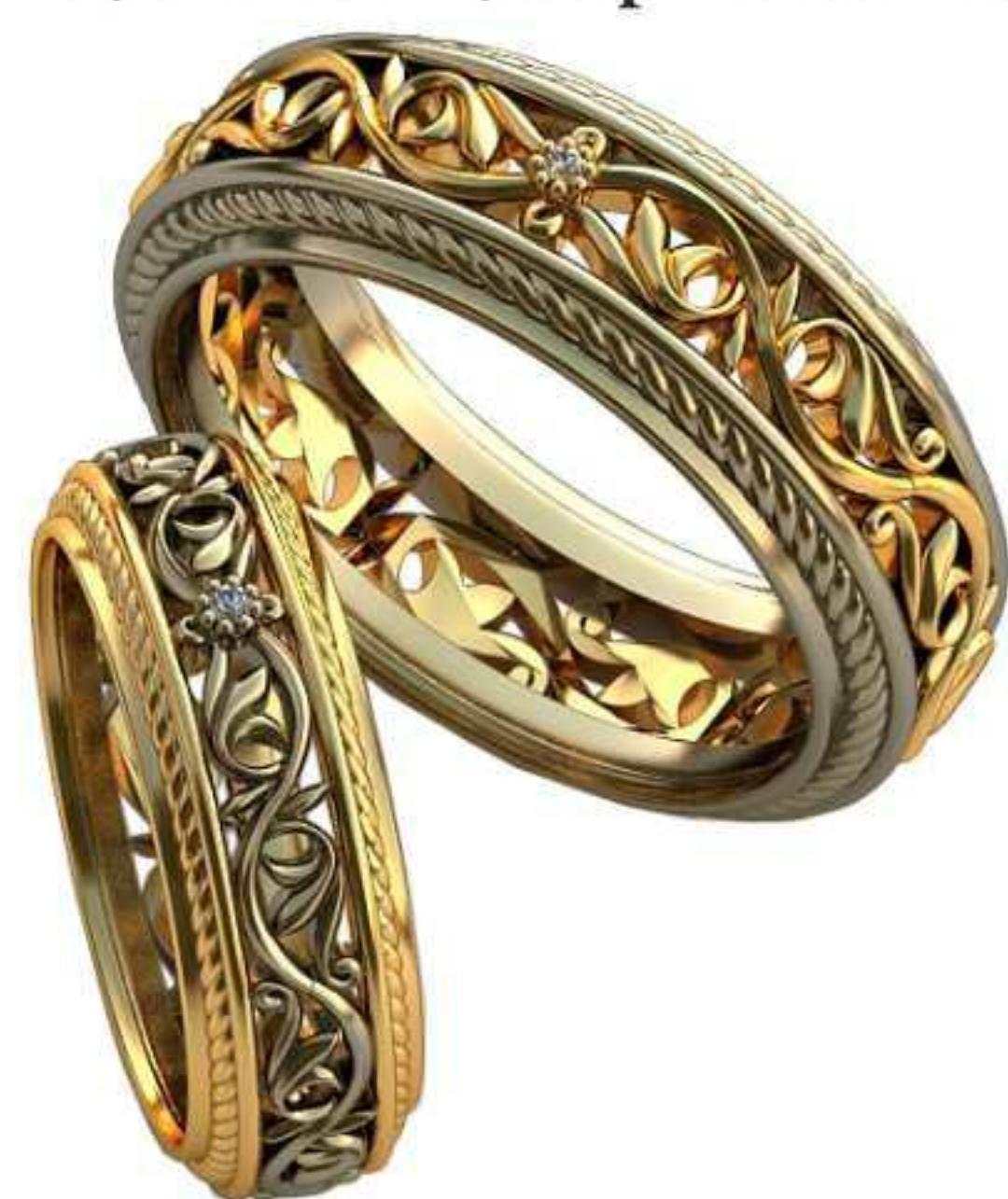
520ж/Р-16/Ш-6,3/Т-2,2/Кр срслось/Вес-4,9 520м/Р-19,7/Ш-7,9/Т-2,6/Кр срслось/Вес-9,4