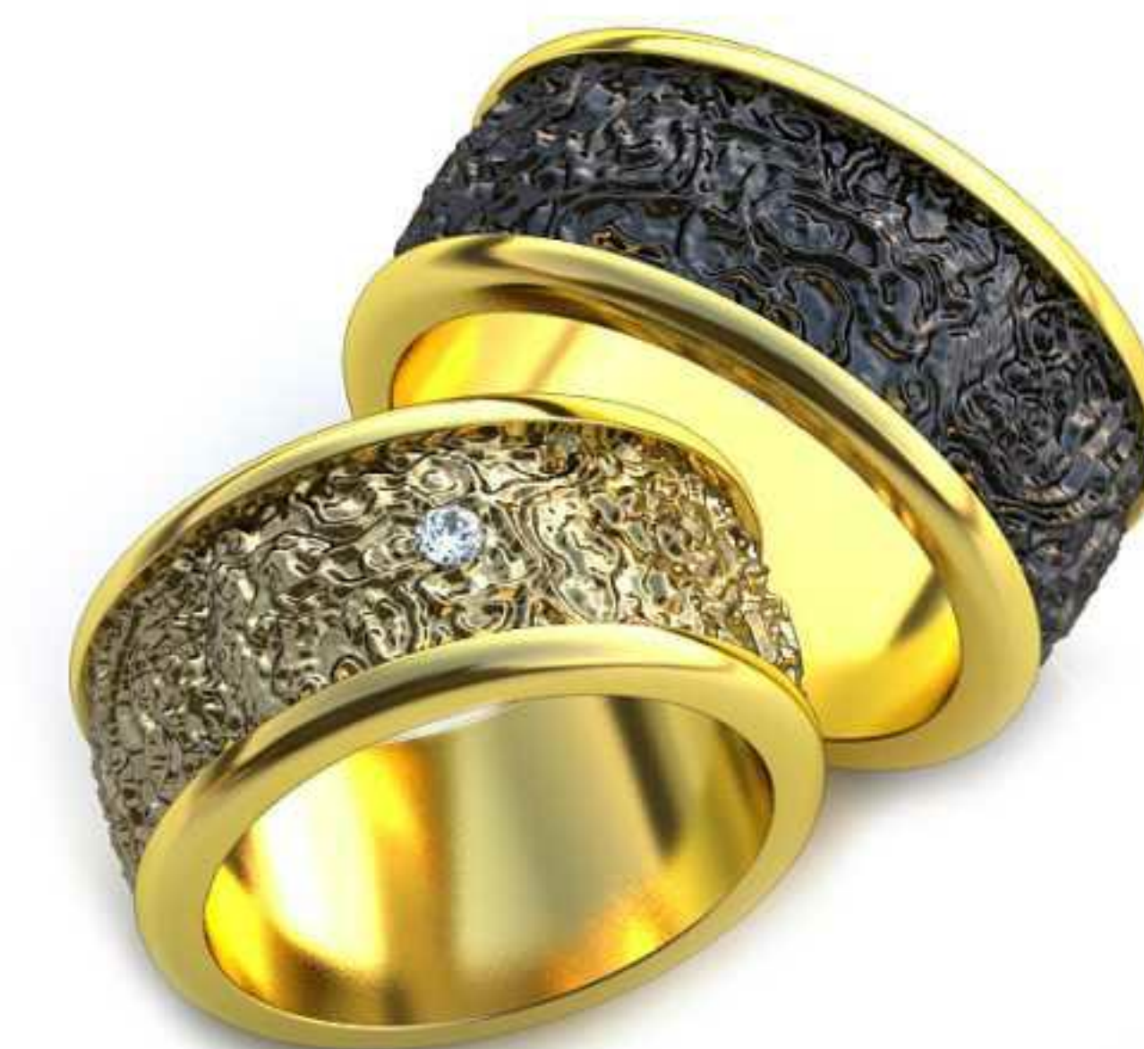
71ж/Р-16,5/Ш-9,6/Т-1,8/Кр 2.0-1шт./Вес-14,9 71м/Р-18,0/Ш-9,6/Т-2,0/Вес-18,0