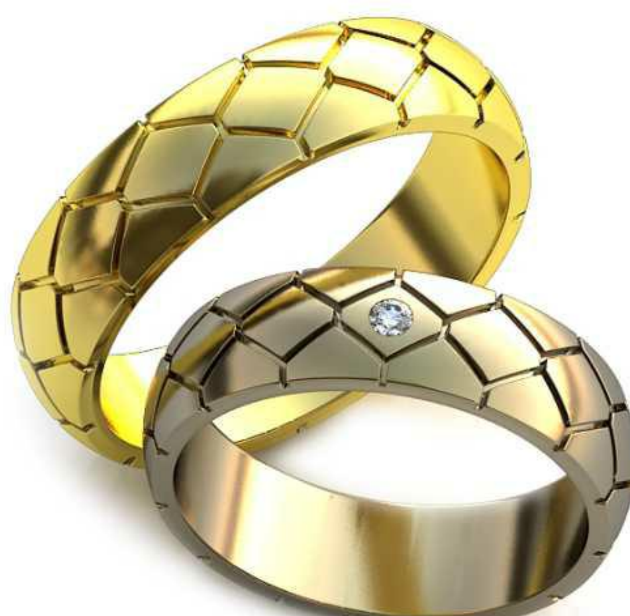
284ж/Р-18,7/Ш-6,0/Т-1,6/Кр 2.0-1шт./Вес-7,0 284м/Р-21,2/Ш-5,6/Т-1,9/Вес-8,9