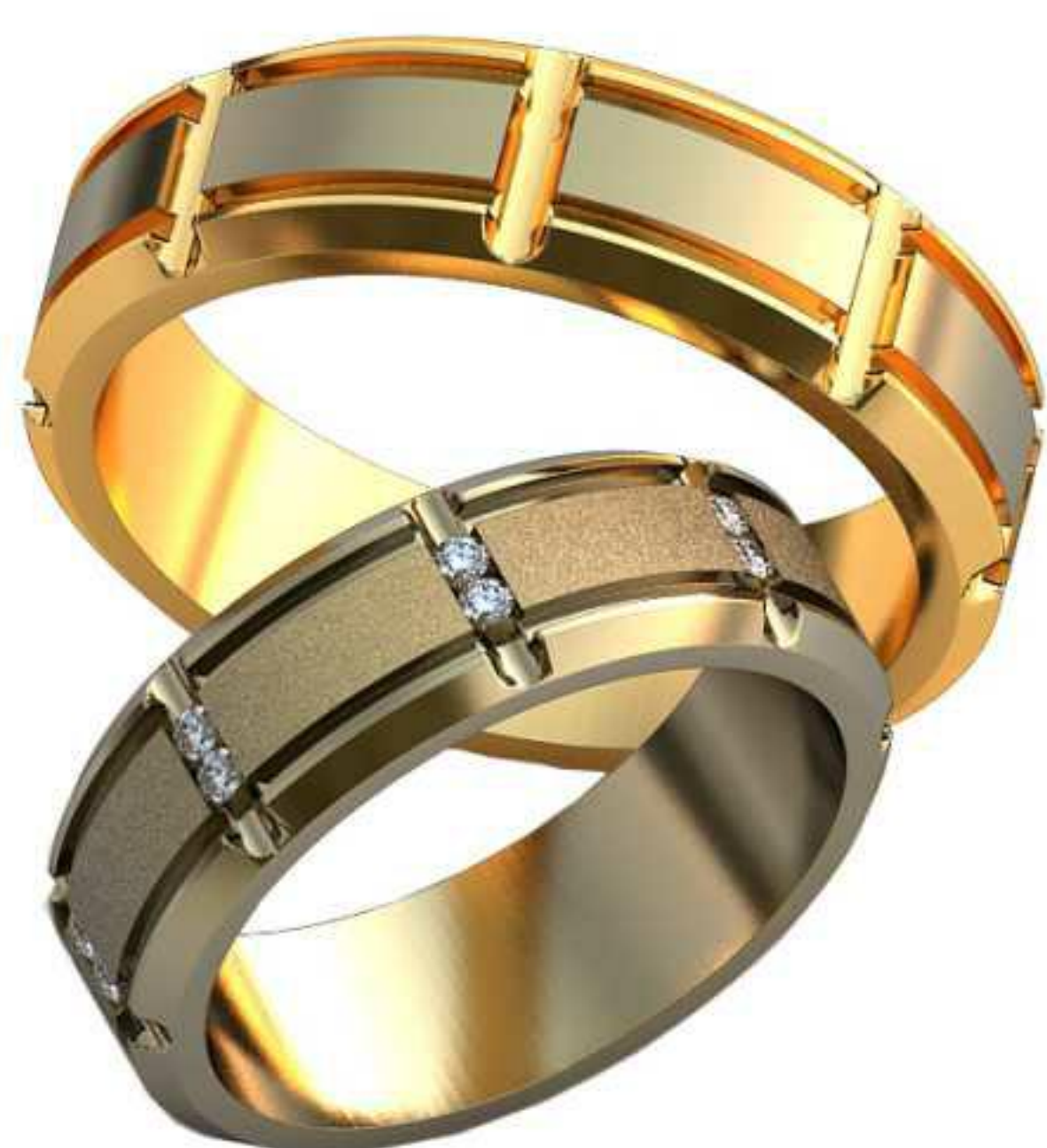
340ж/Р-17,0/Ш-6,0/Т-1,5/Кр 1.3-16шт./Вес-6,2 340м/Р-20,2/Ш-6,0/Т-2,0/Вес-8,9