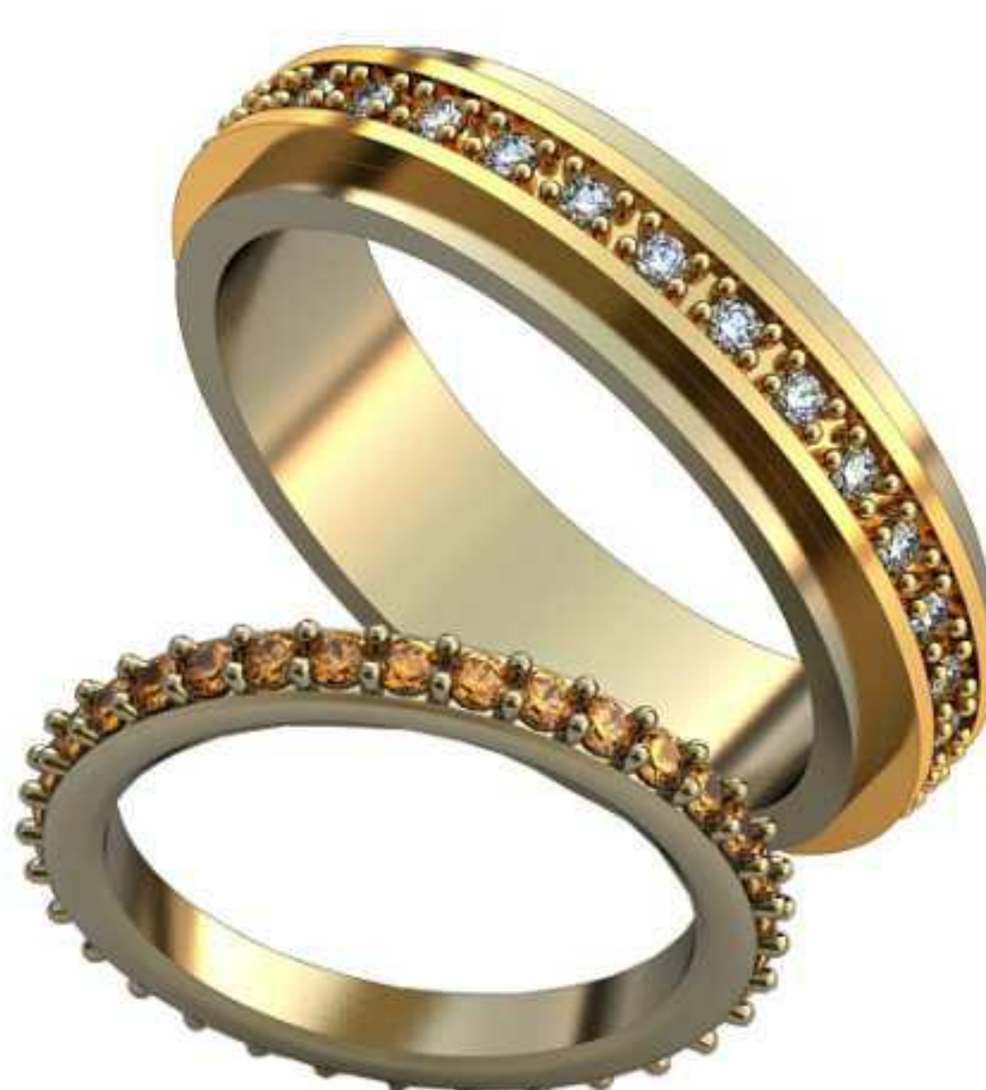
515ж/Р-15,7/Ш-2,4/Т-2,0/Кр 1.6-33шт./Вес-2,5 515м/Р-20,2/Ш-5,7/Т-2,5/Кр 1.5-30шт./Вес-9,5