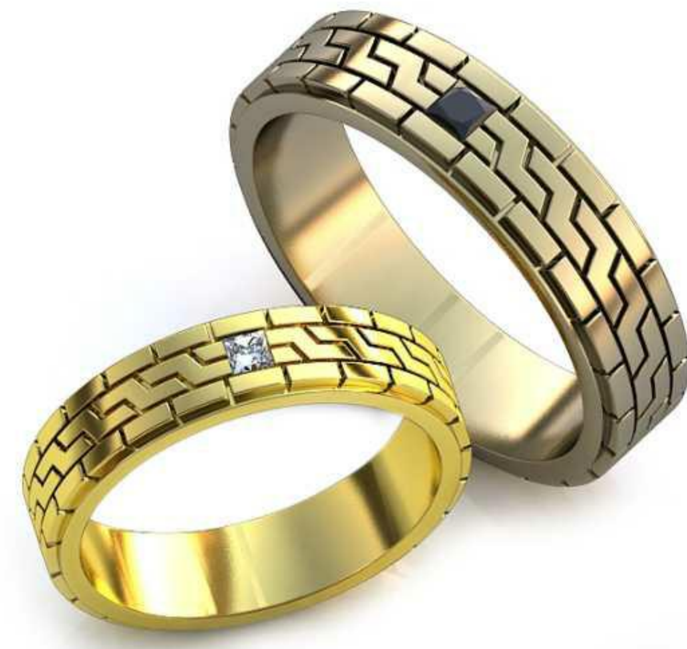
288ж/Р-15,5/Ш-4,3/Т-1,4/Пр 1.8x1.8-1шт./Вес-3,8 288м/Р-18,5/Ш-5,2/Т-1,7/Пр 2.1x2.1-1шт./Вес-6,5