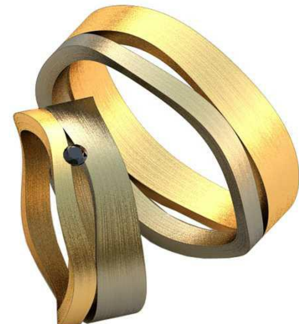
405ж/Р-15,5/Ш-6,8/Т-1,6/Кр 2.0-1шт./Вес-6,4 405м/Р-20,5/Ш-6,5/Т-1,5/Вес-8,2