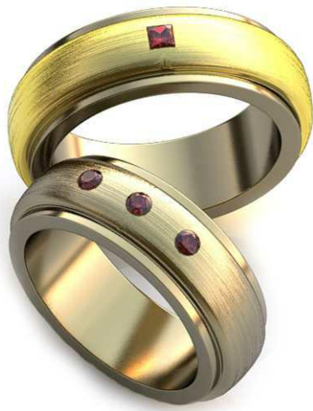
31ж/Р-17,0/Ш-7,0/Т-2,6/Кр 2.0-3шт./Вес-12,4 31м/Р-18,2/Ш-7,0/Т-2,8/Пр 2.0x2.0-1шт./Вес-14,2