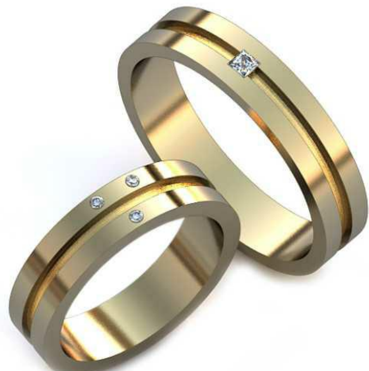
29ж/Р-17,0/Ш-5/Т-1,7/Кр 1.3-3шт./Вес-6,3 29м/Р-21,5/Ш-5/Т-1,5/Пр 2.3x2.3-1шт./Вес-6,6