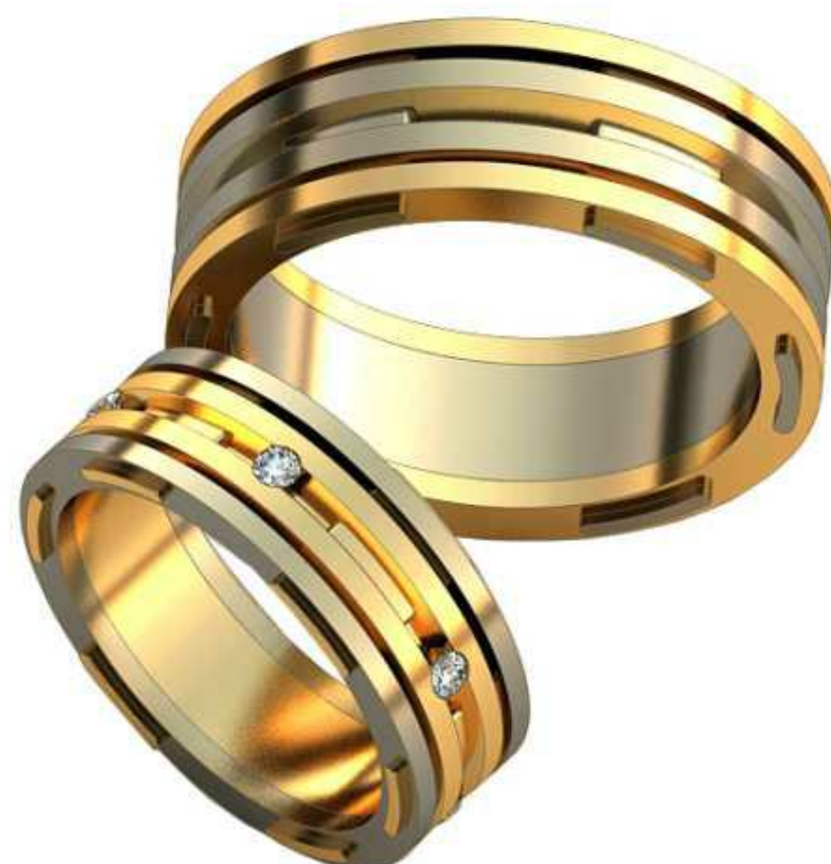
493ж/Р-17,2/Ш-7,2/Т-2,0/Кр 1.9-1шт./Вес-8,9 493м/Р-21/Ш-8,7/Т-2,4/Вес-16,3