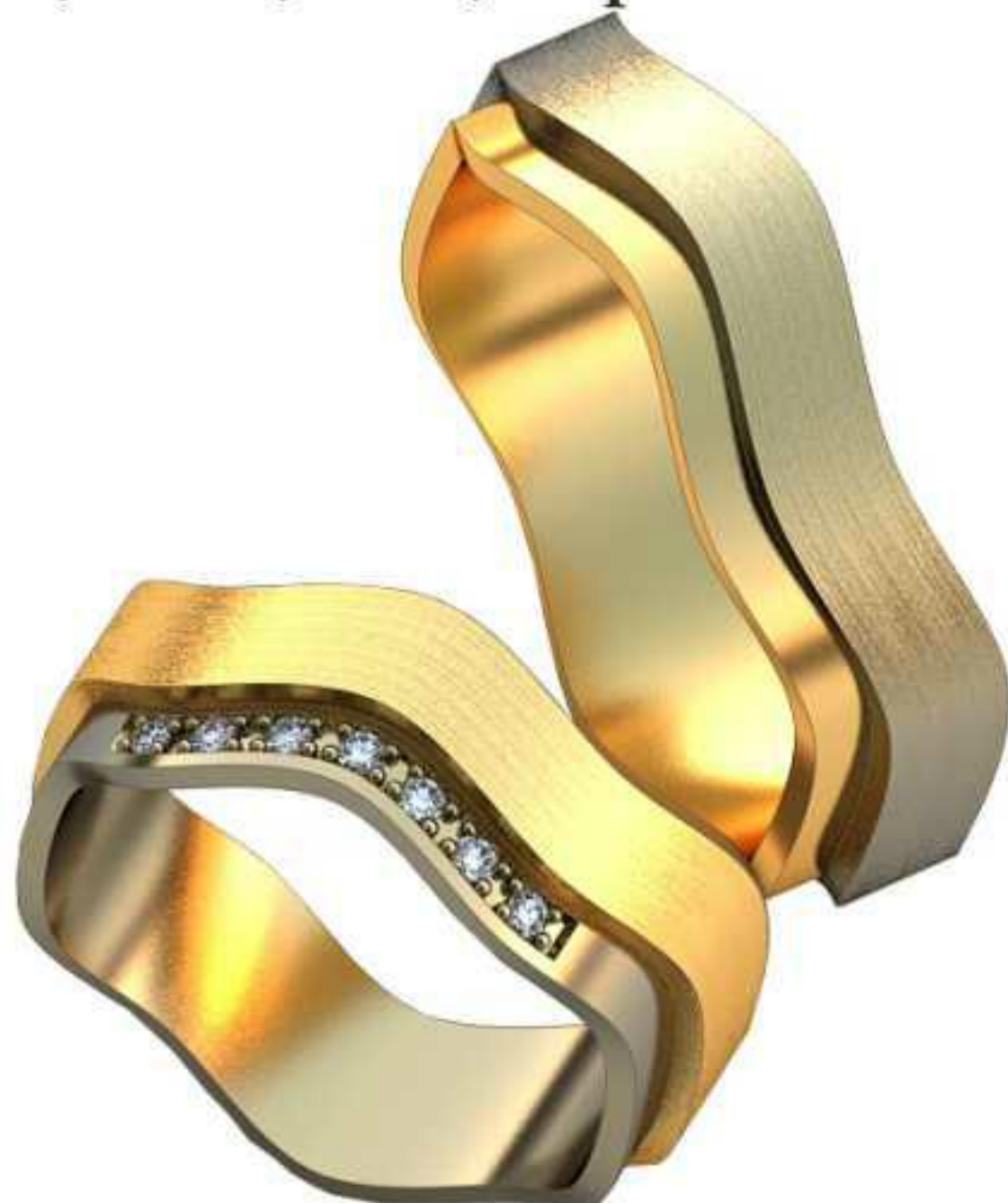
178ж/Р-15,7/Ш-6,6/Т-1,5/Кр 1.2-7шт./Вес-5,0 178м/Р-19,0/Ш-6,1/Т-1,9/Вес-7,0