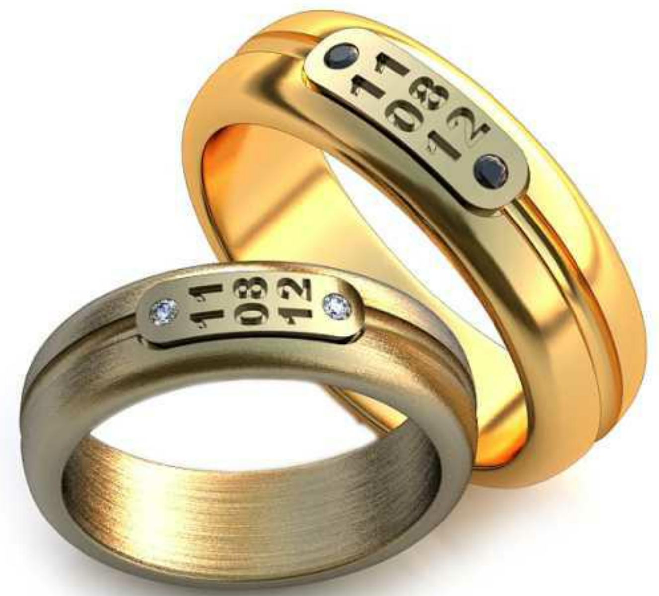
246ж/Р-17,5/Ш-6,0/Т-1,9/Кр 1.4-2шт./Вес-7,5 246м/Р-20,5/Ш-7,0/Т-2,2/Кр 1.4-2шт./Вес-12,0