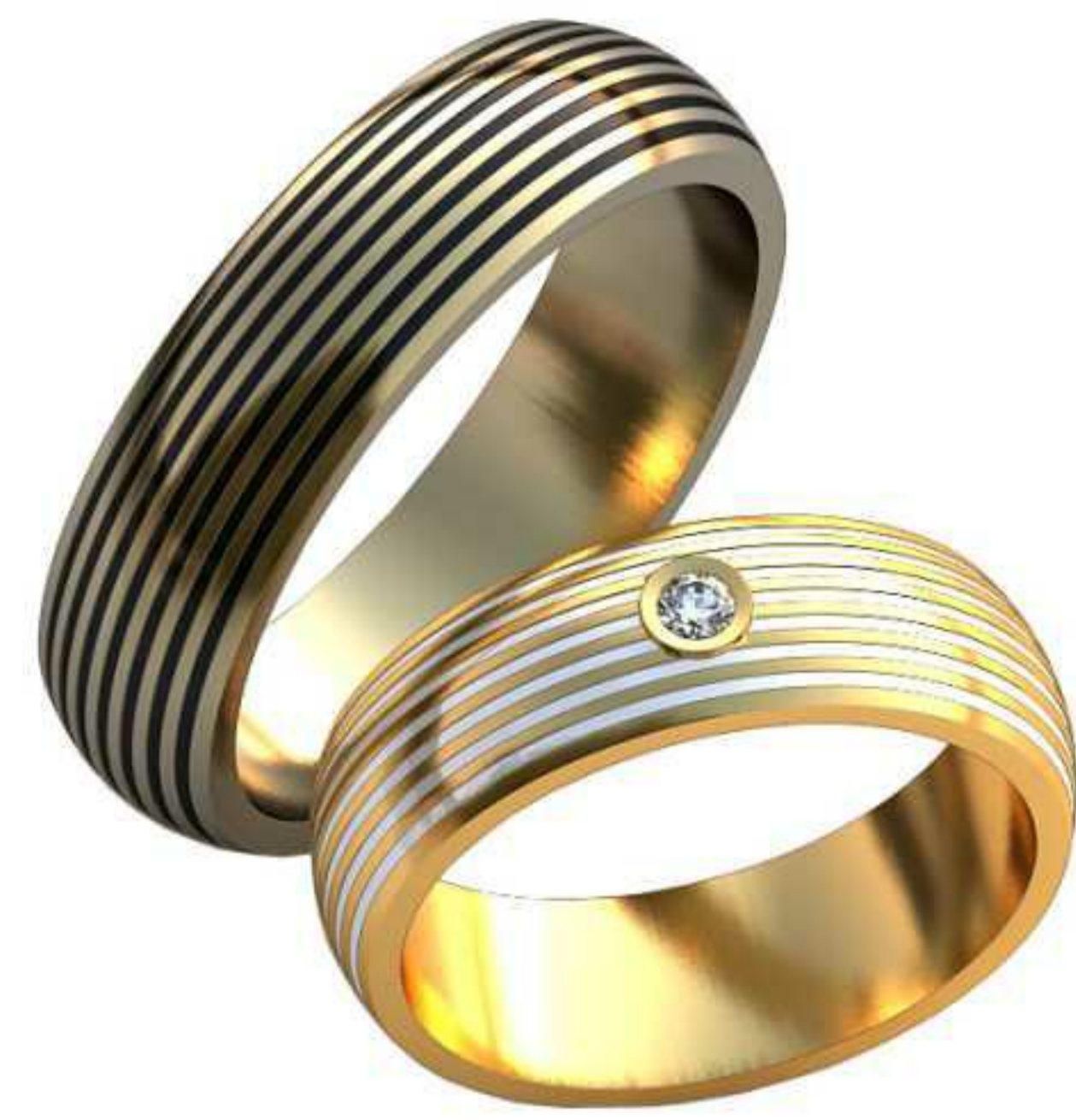
318ж/Р-17,0/Ш-6,0/Т-1,6/Кр 2.0-1шт./Вес-5,6 318м/Р-20,2/Ш-6/Т-1,9/Вес-8,0