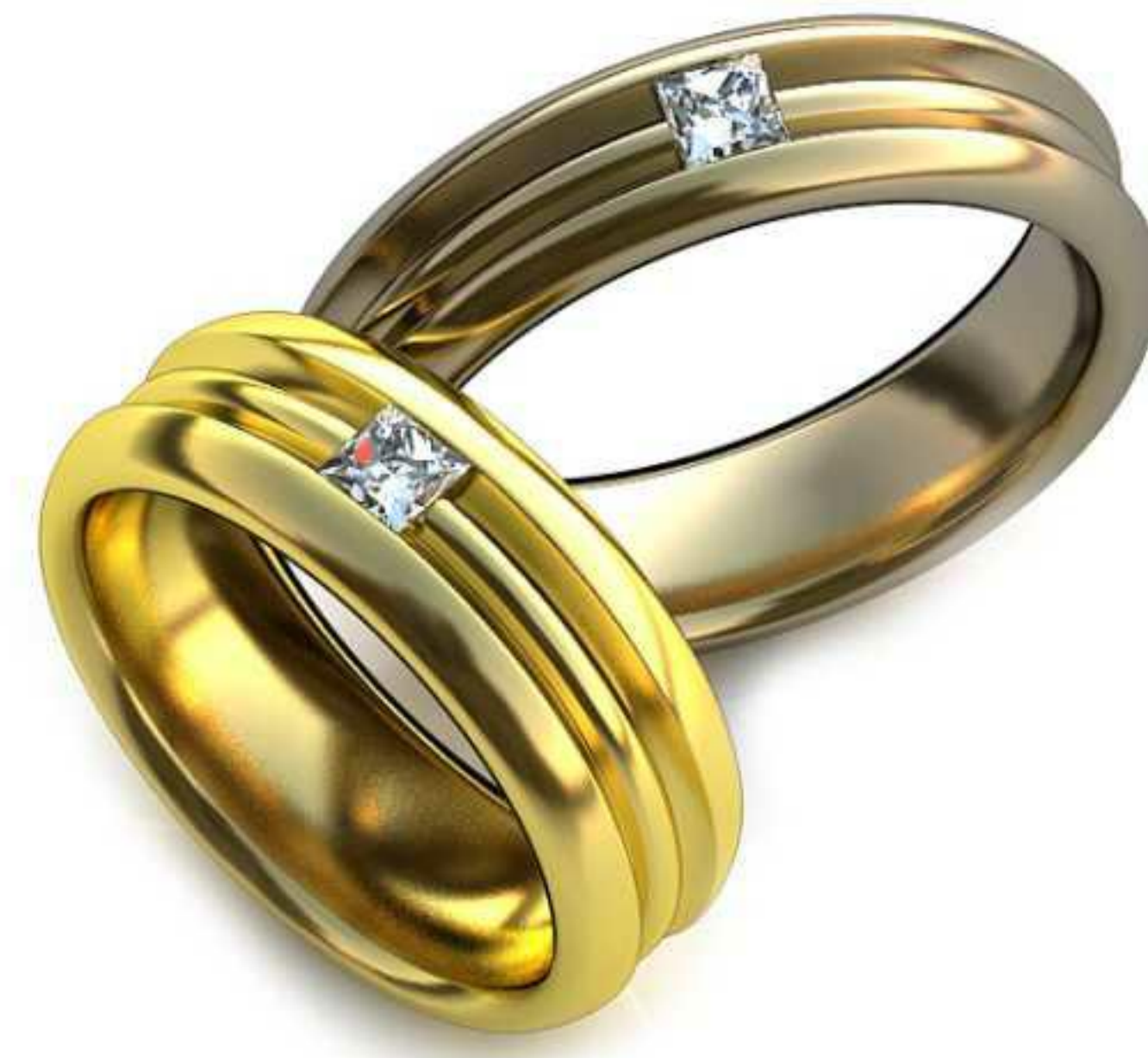
48ж/Р-17,5/Ш-7,0/Т-2,0/Пр 3.0x3.0-1шт./Вес-8,4 48м/Р-20,0/Ш-5,8/Т-2,1/Пр 2.0x2.0-1шт./Вес-8,5