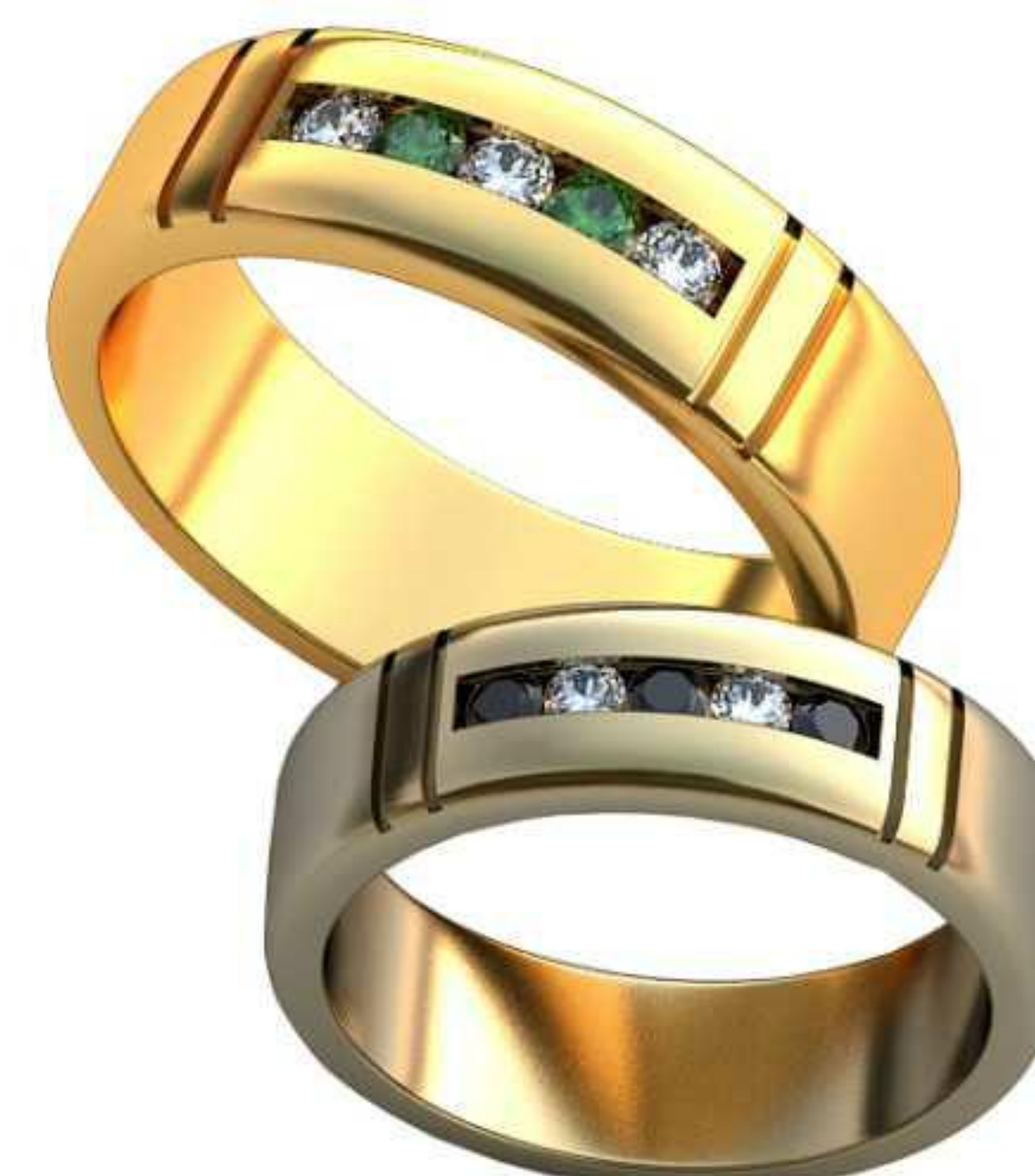
459ж/Р-21,5/Ш-7,3/Т-2/Кр 2.7-5шт./Вес-13,3 459м/Р-24,7/Ш-8,5/Т-2,3/Кр 3,1-5шт./Вес-20,6