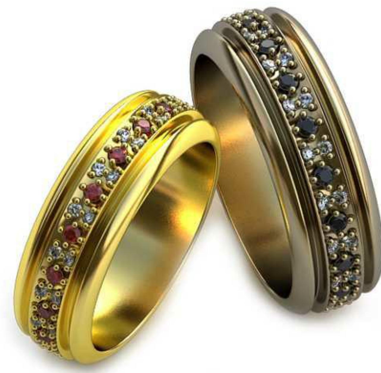
57ж /Р-17,0/Ш-6,5/Т-1,7/Кр 1.0-36шт.,1.4-18шт./Вес-6,1 57м/Р-19,0/Ш-7,0/Т-2,0/Кр 1.0-36шт.,1.4-18шт./Вес-8,0