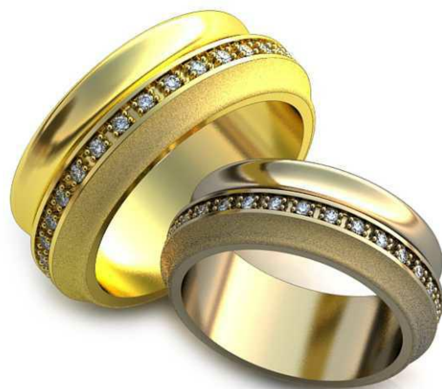
59ж/Р-19,5/Ш-8,9/Т-2,4/Кр 1.3-30шт./Вес-13,5 59м/Р-17/Ш-7,7/Т-2,0/Кр-1.3-30шт./Вес-8,8