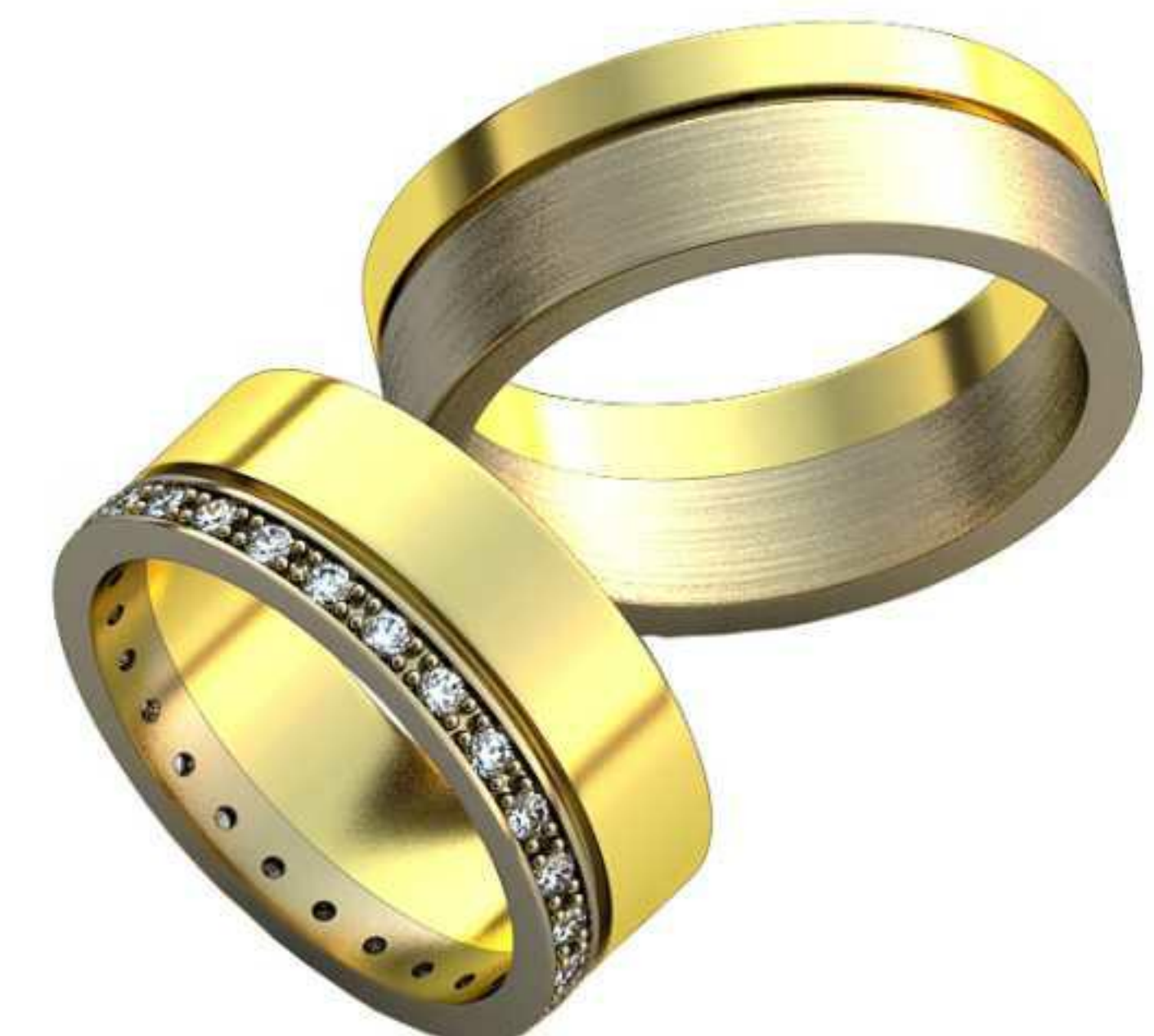
159ж/Р-16,5/Ш-7,0/Т-1,5/Кр 1.5-26шт./Вес-6,7 159м/Р-18,5/Ш-7/Т-1,6/Вес-9,1