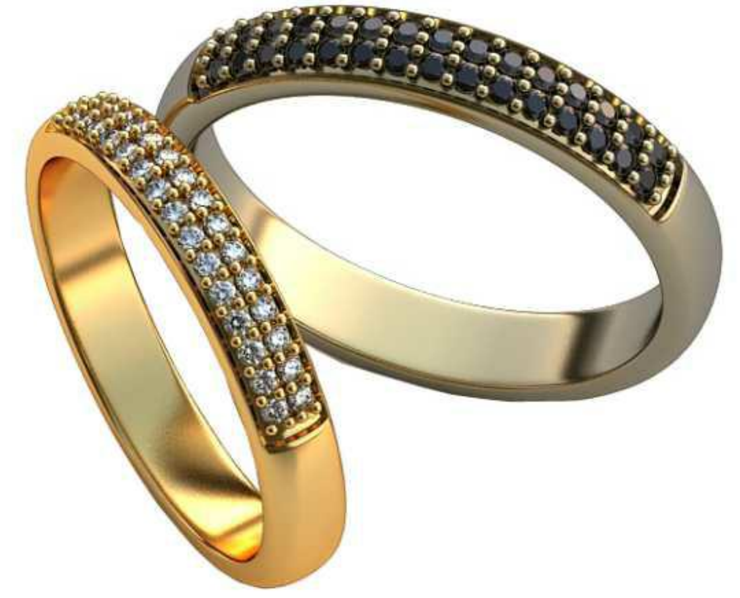
483ж/Р-15,5/Ш-3/Т-1,4/Кр 1.0-30шт./Вес-2,3 483м/Р-17,2/Ш-3,4/Т-1,6/Кр 1.1-30шт./Вес-3,3