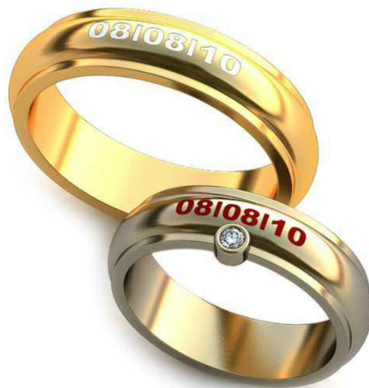
266ж/Р-16,2/Ш-5,0/Т-1,8/Кр 1.8-1шт./Вес-5,6 266м/Р-19,0/Ш-5,1/Т-2,1/Вес-8,0