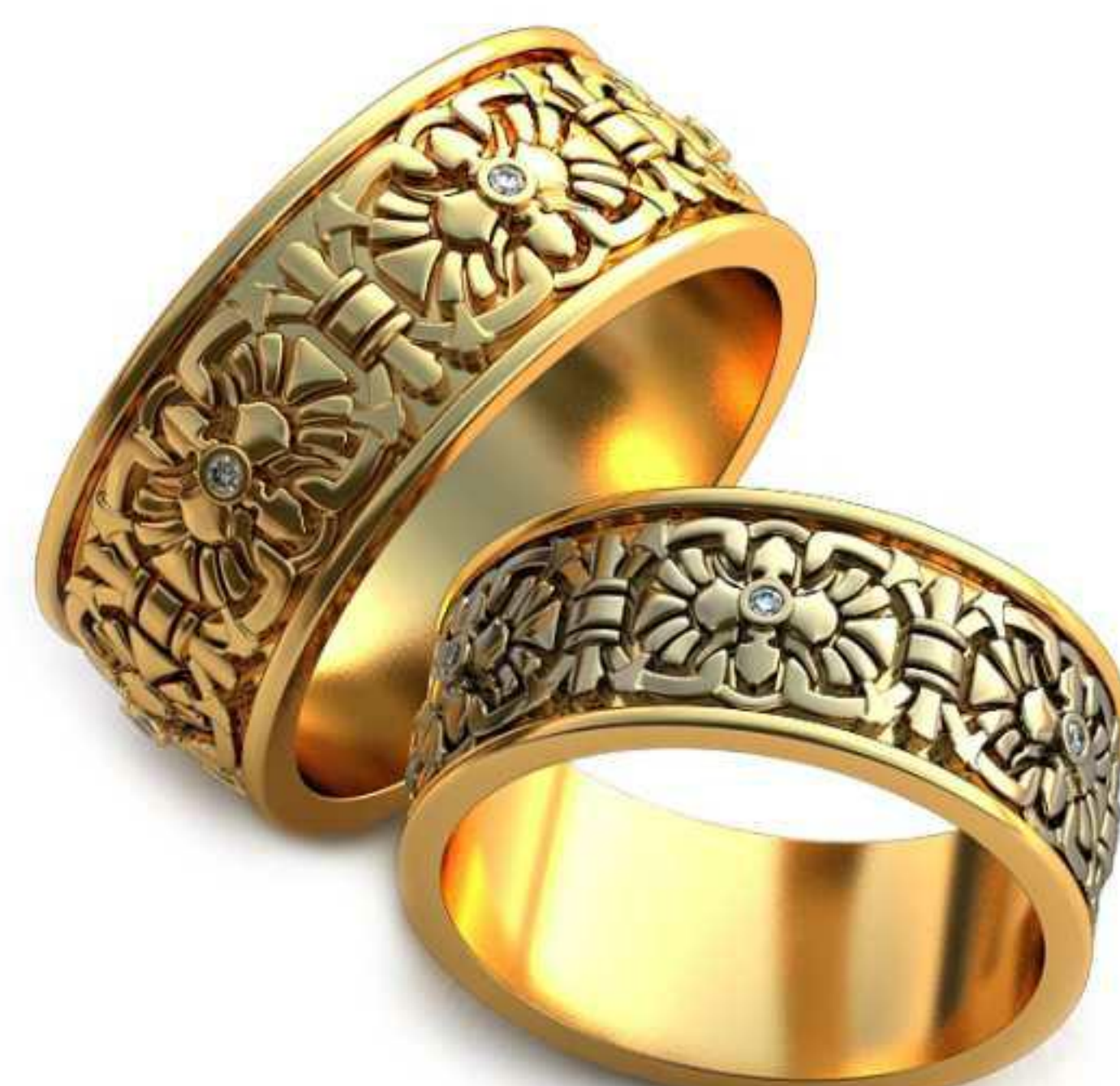
279ж/Р-15,2/Ш-7,1/Т-1,3/Кр 1.0-6шт./Вес-5,1 279м/Р-17,2/Ш-8,1/Т-1,4/Кр 1.0-6шт./Вес-7,2