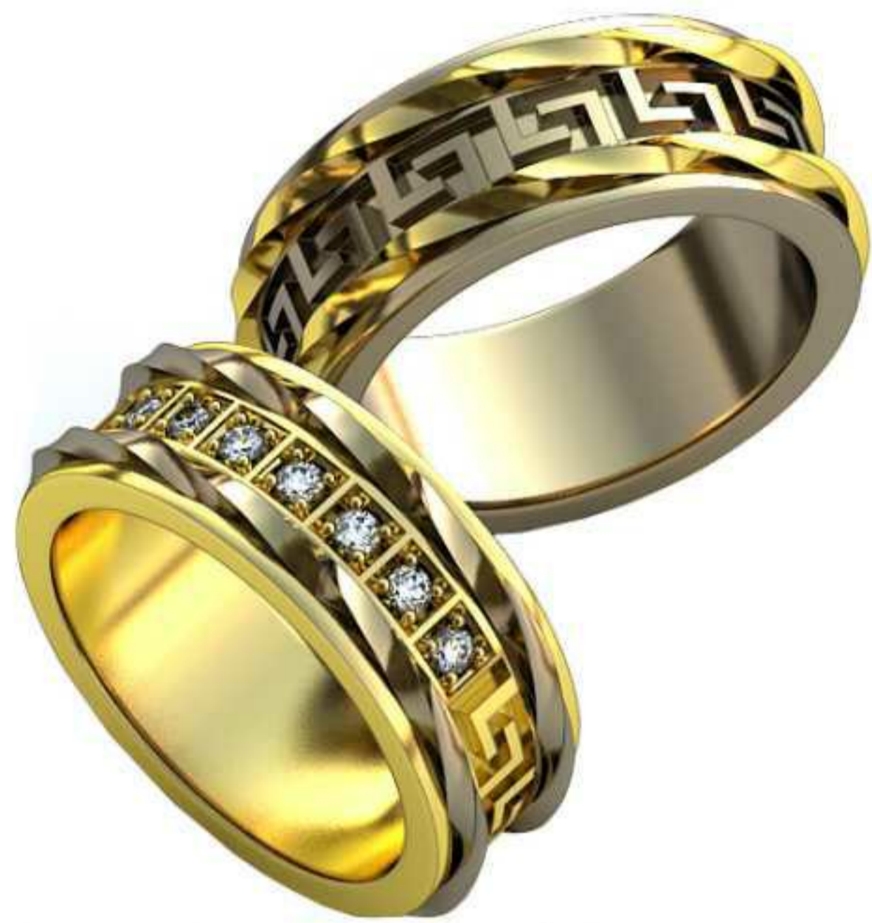
142ж/Р-16,7/Ш-7,5/Т-2,3/Кр 1.7-7шт./Вес-6,3 142м/Р-17,2/Ш-7,7/Т-2,3/Кр 1.7-7шт./Вес-6,8