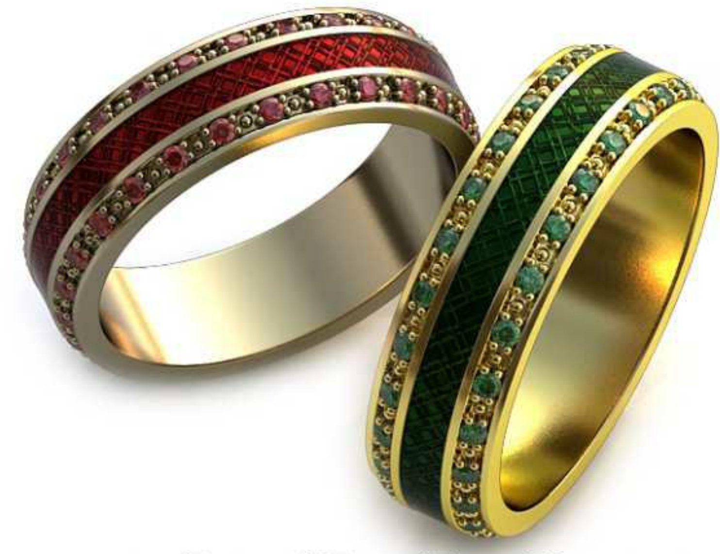
78ж/Р-17,0/Ш-5,7/Т-1,7/Кр 1.3-52шт./Вес-5,6 78м/Р-18,2/Ш-6,1/Т-1,8/Кр 1.3-52шт./Вес-7,1