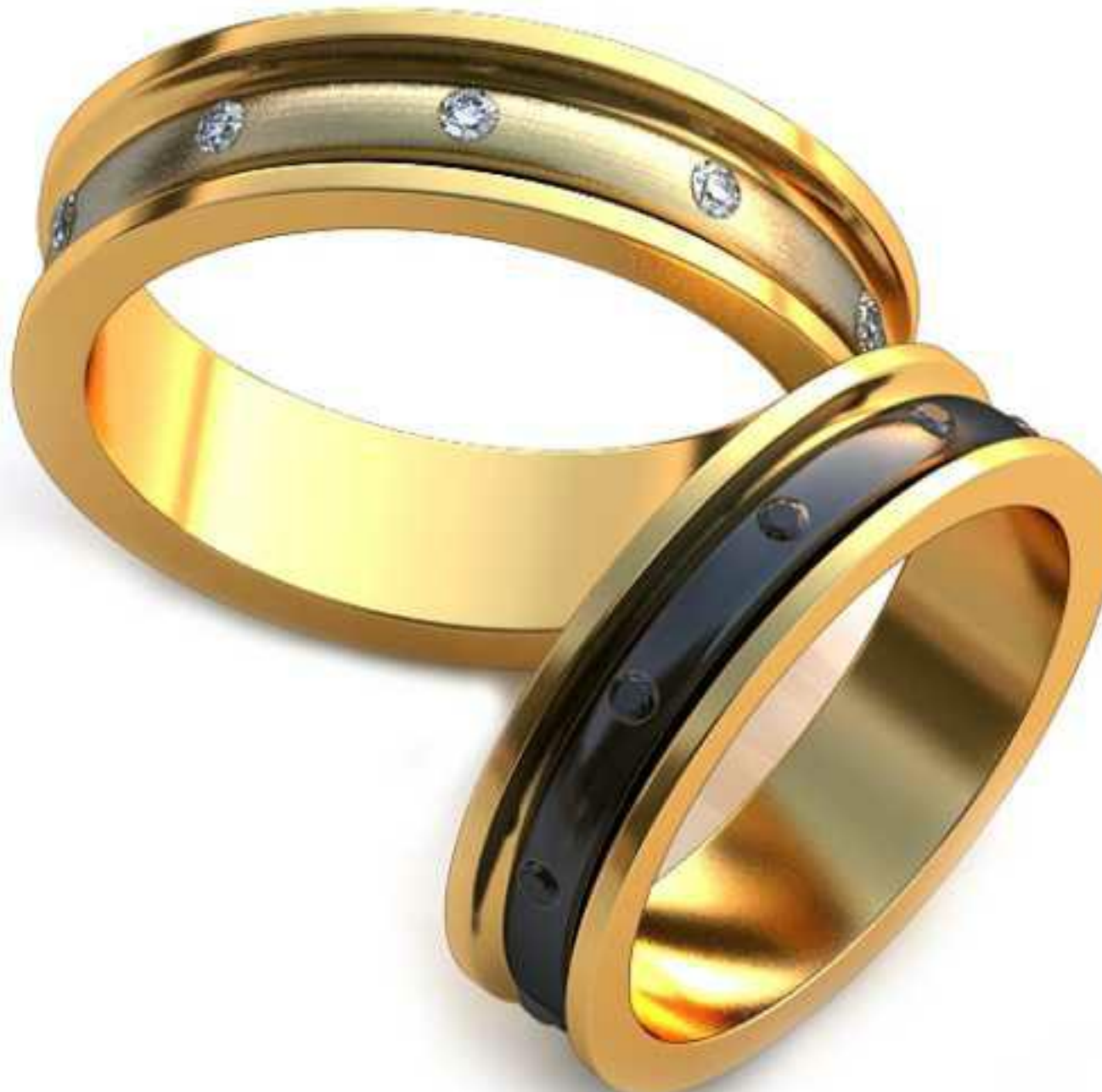
35ж/Р-17,0/Ш-5,0/Т-1,7/Кр 1.4-10шт./Вес-5,1 35м/Р-19,0/Ш-5,7/Т-2,0/Кр 1.4-10шт./Вес-7,3