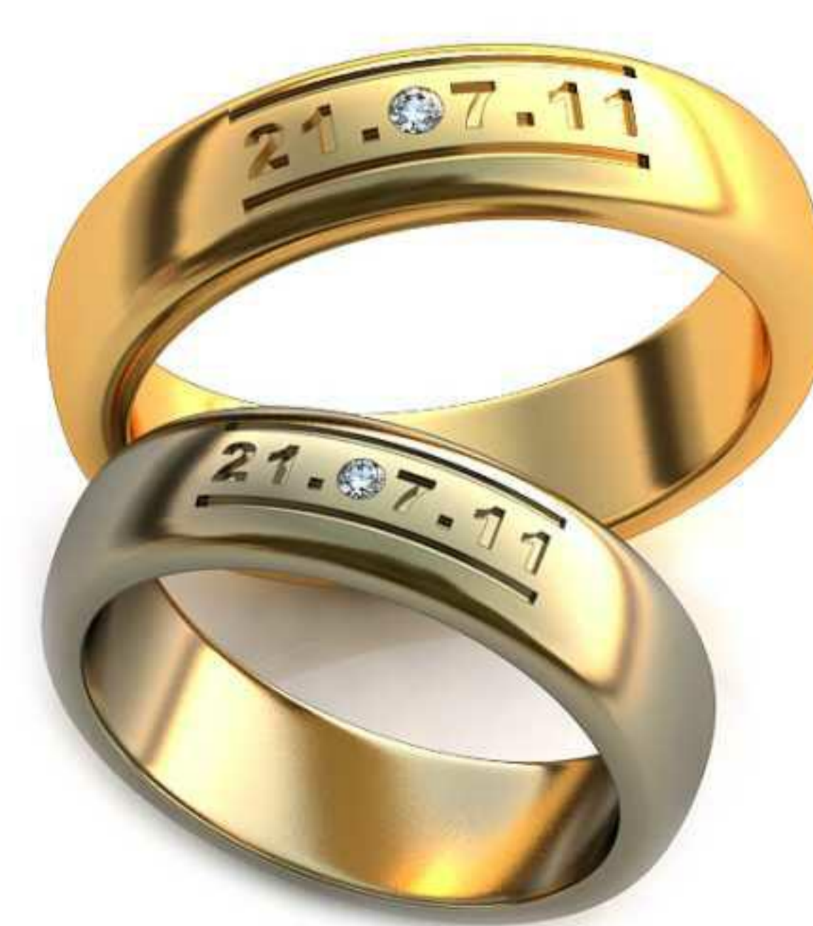
240ж/Р-17,0/Ш-5,5/Т-1,8/Кр 1.5-1шт./Вес-7,0 240м/Р-19,5/Ш-5,7/Т-2,1/Кр 1.6-1шт./Вес-9,6