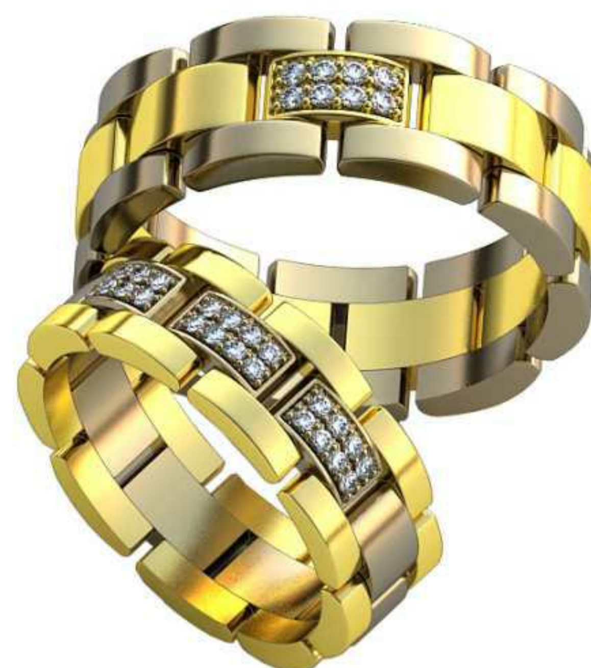
406ж/Р-16,5/Ш-5,3/Т-1,3/Кр 1.8-16шт./Вес-3,5 407ж/Р-16/Ш-6/Т-1,3/Пр 2.5x2.5-1шт. Кр 1.5-2шт./Вес-5,5 408ж/Р-18,2/Ш-7/Т-1,7/Кр 1.2-24шт./Вес-8,6 406м/Р-19,5/Ш-7/Т-1,6/Кр 1.8-16шт./Вес-6,5 407м/Р-18,2/Ш-6,8/Т-1,5/Пр 2.5x2.5-1шт. Кр 1.5-2шт./Вес-8,0 408м/Р-21,2/Ш-8/Т-2/Кр 1.35-8шт./Вес-12,1