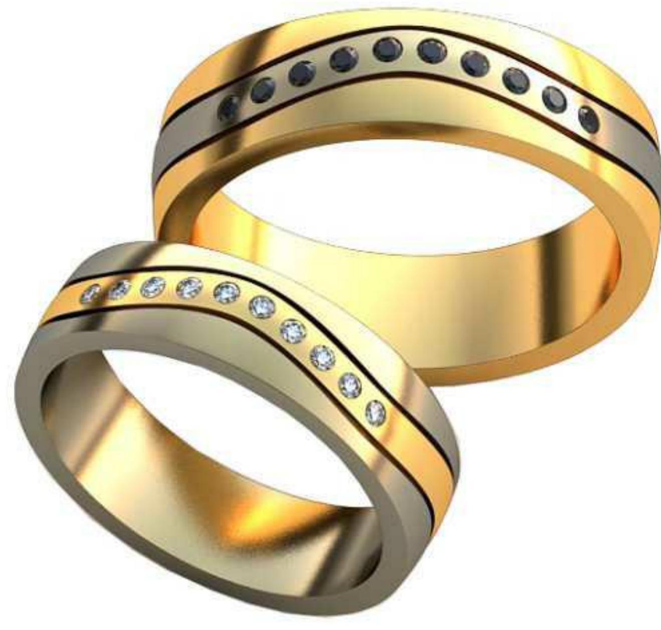
497ж/Р-17,7/Ш-5,5/Т-1,6/Кр 1.25-10шт./Вес-6,2 497м/Р-20,2/Ш-6,2/Т-1,7/Кр 1.4-10шт./Вес-9,1