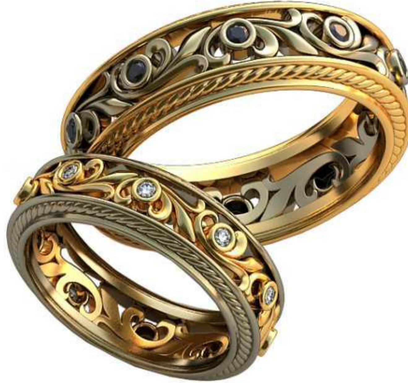
500ж/Р-16,5/Ш-6,1/Т-2,0/Кр 1.4-10шт./Вес-4,9 500м/Р-20/Ш-7,5/Т-2,5/Кр 1.7-10шт./Вес-9,0