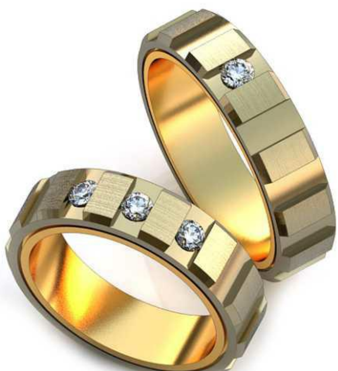
28ж/Р-16,0/Ш-5,0/Т-2,2/Кр 2.5-3шт./Вес-7,1 28м/Р-17,5/Ш-5,0/Т-2,0/Кр 2.66-1шт./Вес-7,0