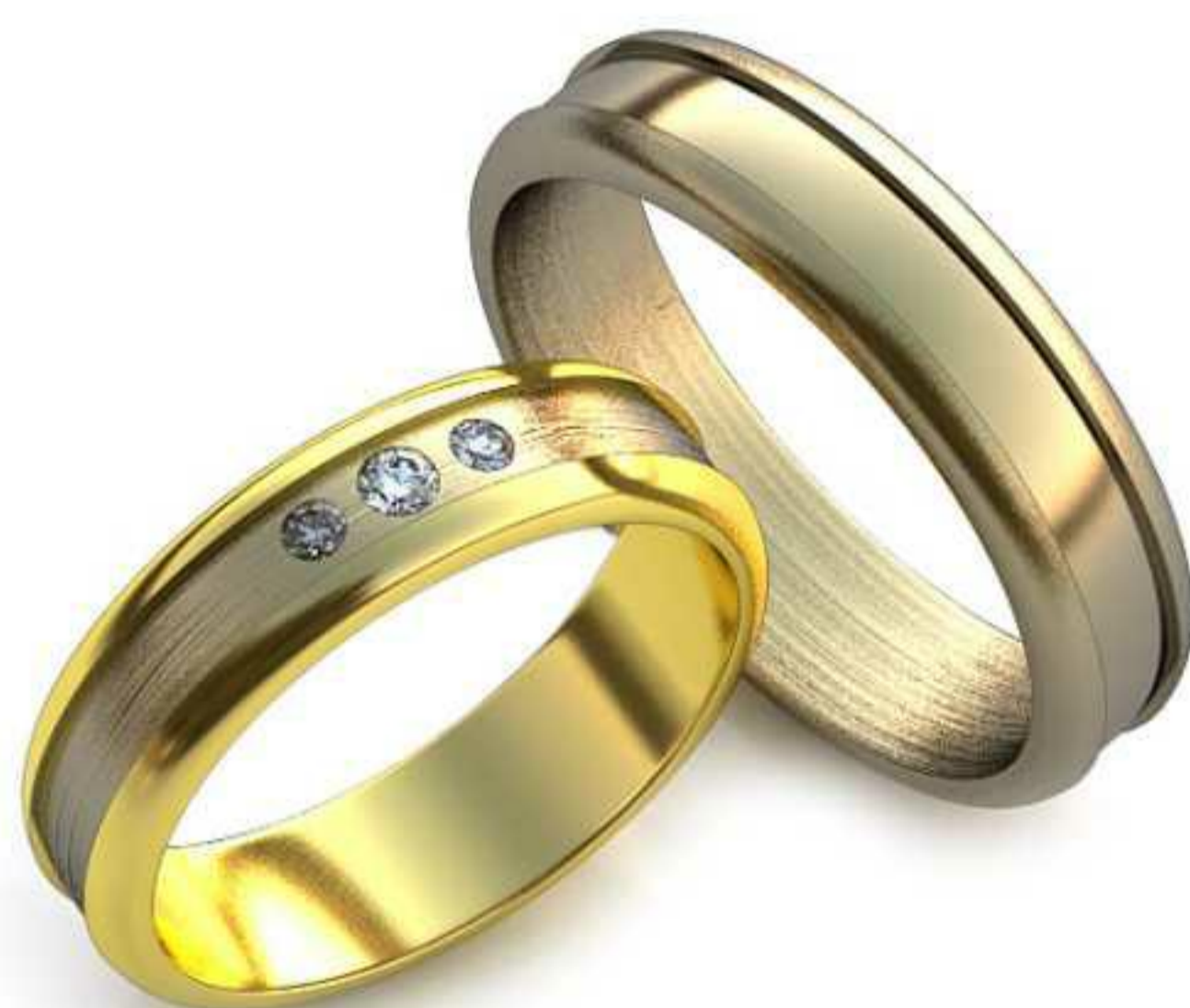
20ж/Р-17,0/Ш-5,0/Т-1,3/Кр 1.7-2шт.,2.0-1шт./Вес-3,8 20м/Р-19,0/Ш-5,0/Т-1,5/Вес-5,3