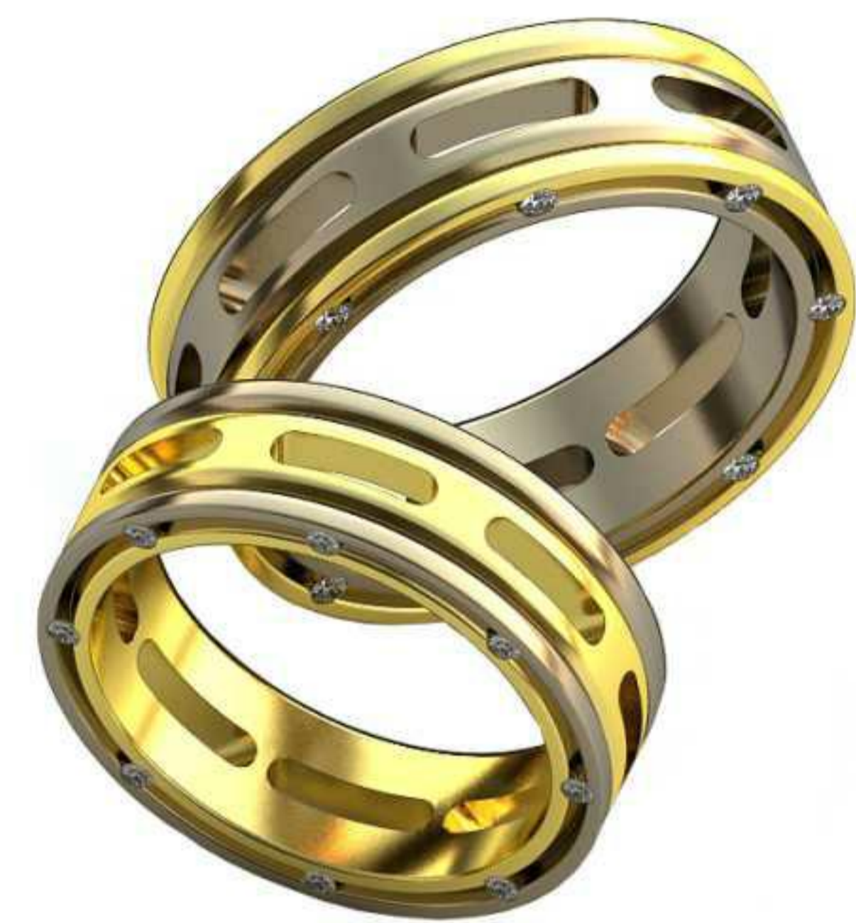
322ж/Р-17,0/Ш-6,0/Т-2,0/Кр 1.0-16шт./Вес-6,5 322м/Р-19,2/Ш-6,8/Т-2,2/Кр 1.3-16шт./Вес-9,3