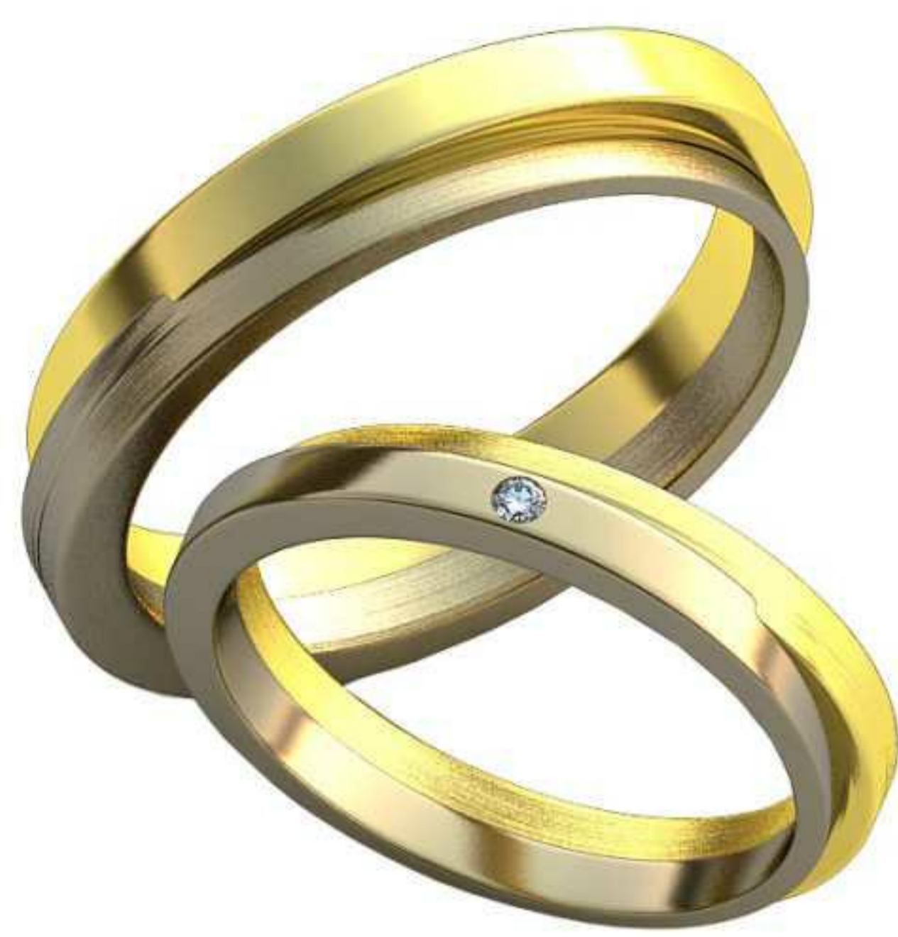
347ж/Р-17,0/Ш-3,4/Т-1,5/Кр 1.5-1шт./Вес-3,8 347м/Р-19,7/Ш-4,3/Т-1,7/Вес-6,5