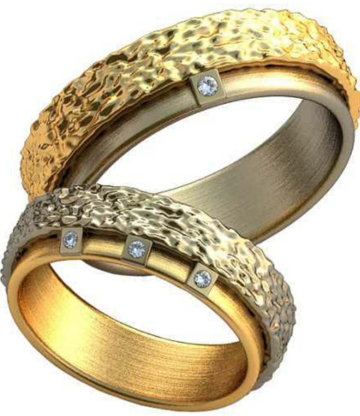
329ж/Р-18/Ш-6,0/Т-2,2/Кр 1.3-3шт./Вес-8,1 329м/Р-21/Ш-7,0/Т-2,5/Кр 1.5-1шт./Вес-12,8