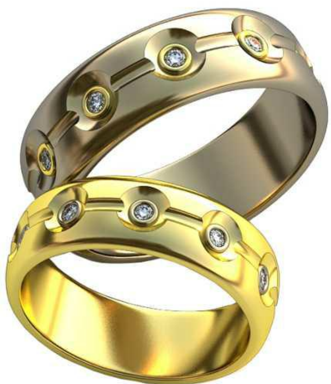
334ж/Р-16,7/Ш-6,0/Т-1,4/Кр 1.3-10шт./Вес-4,8 334м/Р-19,0/Ш-6,8/Т-1,6/Кр 1.5-10шт./Вес-7,2