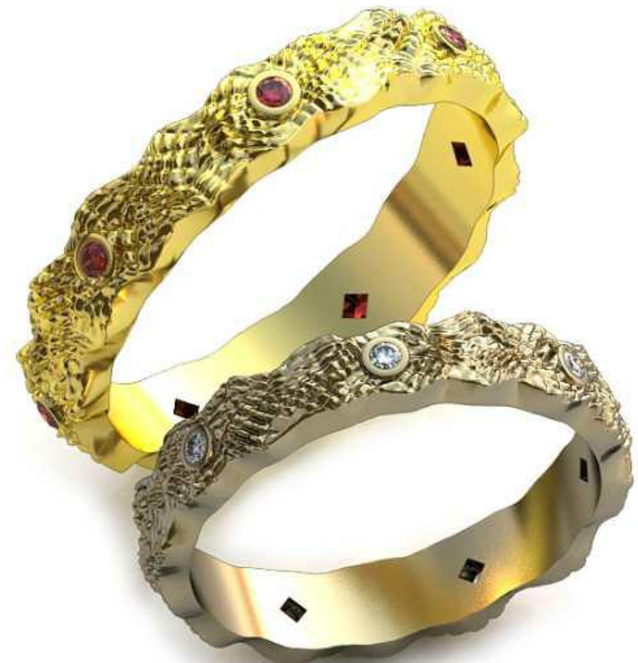
96ж/Р-17,7/Ш-4/Т-1,6/Кр 1.4-7шт./Вес-3,7 96м/Р-20,0/Ш-4,5/Т-1,8/Кр 1.4-7шт./Вес-5,5