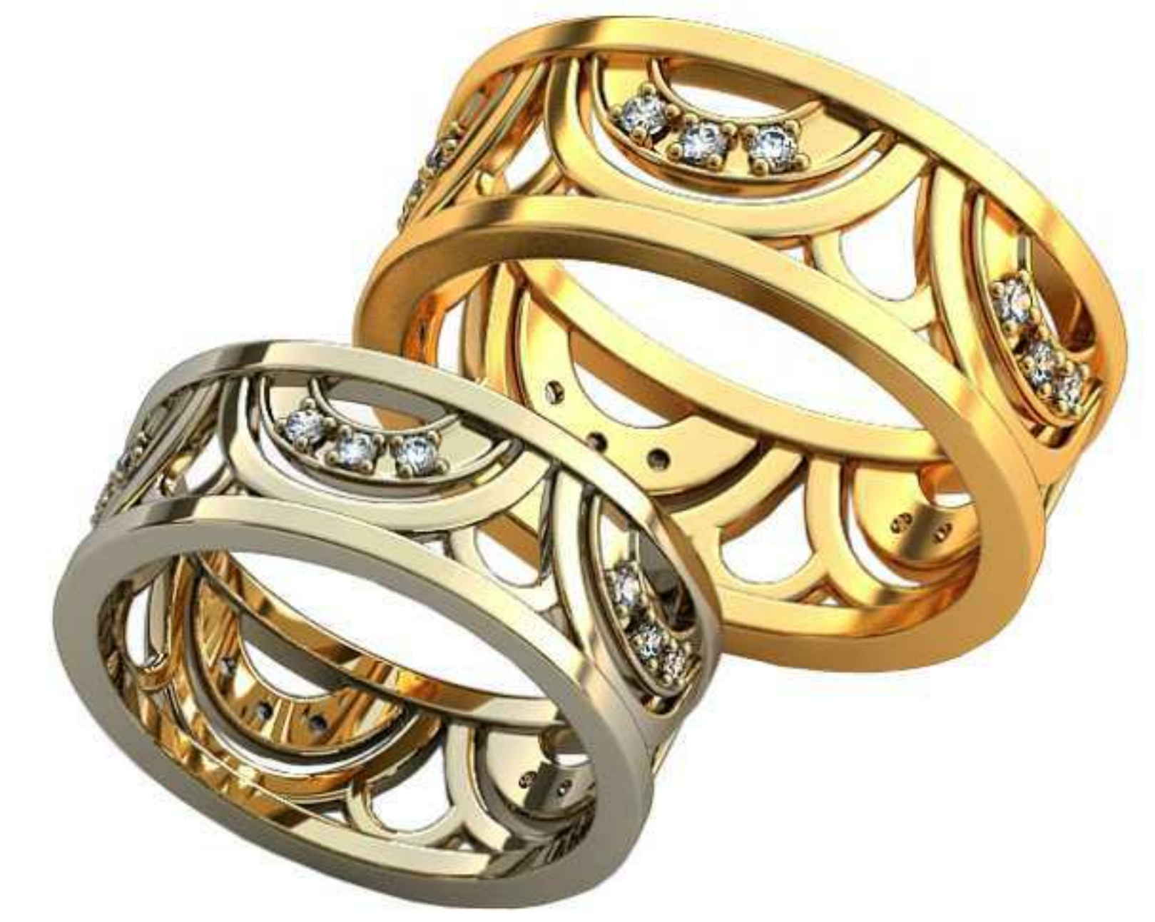
369ж/Р-18,5/Ш-8,0/Т-1,7/Кр 1,5-15шт./Вес-6,6 369м/Р-21,2/Ш-9,3/Т-1,9/Кр 1,5-15шт./Вес-10,2