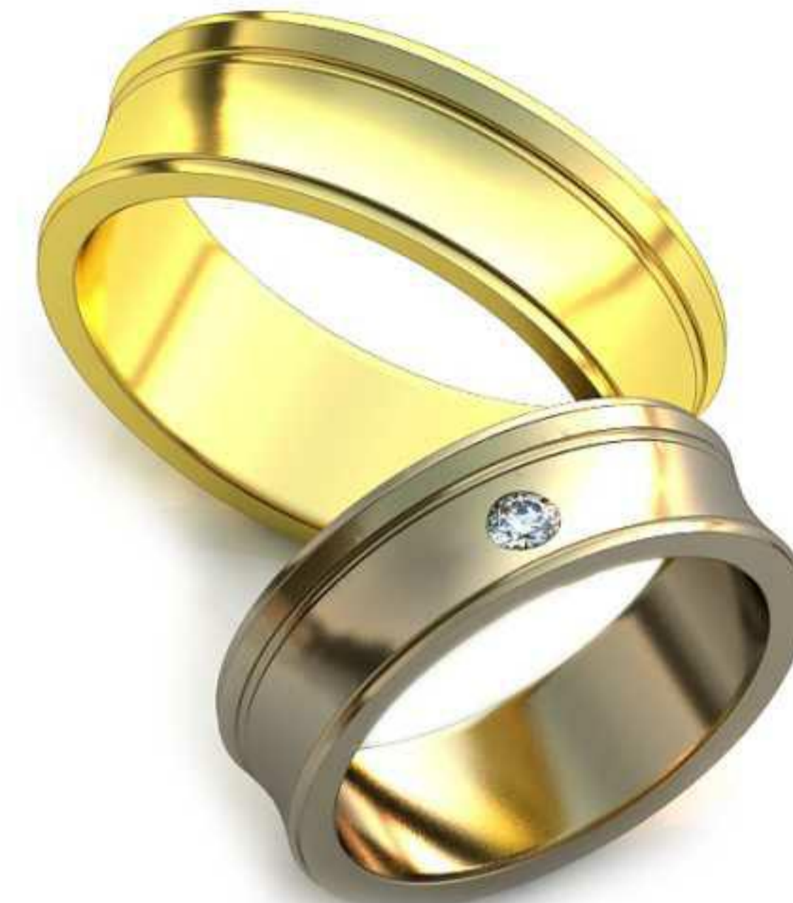
231ж/Р-16,5/Ш-6,0/Т-1,6/Кр 2.5-1шт./Вес-5,7 231м/Р-19,5/Ш-7,0/Т-1,6/Вес-7,8