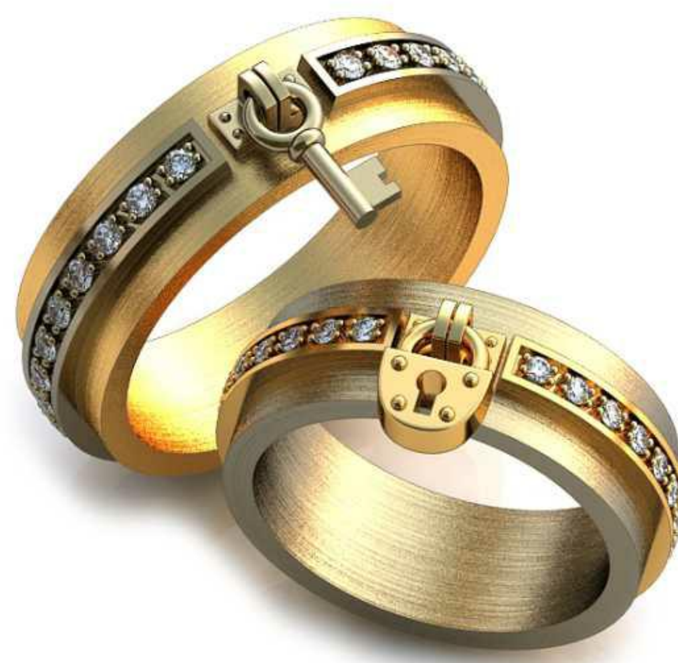
221ж/Р-20,0/Ш-8,0/Т-2,8/Кр 1.6-29шт./Вес-15,9 221м/Р-23,2/Ш-8,0/Т-2,9/Кр 1.6-29шт./Вес-18,0