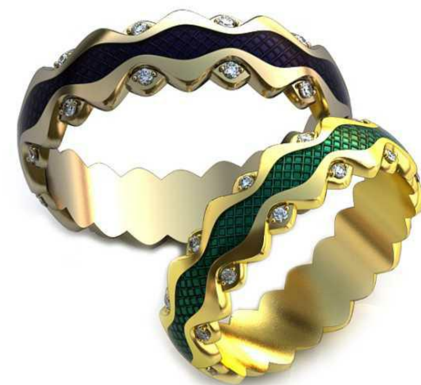
90ж/Р-17,7/Ш-5,5/Т-1,4/Кр 1.1-22шт./Вес-4,1 90м/Р-19,7/Ш-6,0/Т-1,5/Кр 1.1-22шт./Вес-5,5