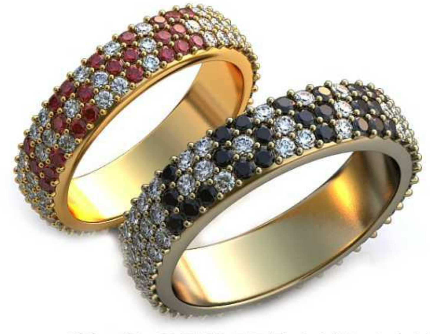
123ж/Р-18,7/Ш-5,5/Т-2,1/Кр 1.6-123шт./Вес-6,7 123м/Р-22,0/Ш-6,4/Т-2,5/Кр 1.6-123шт./Вес-10,5