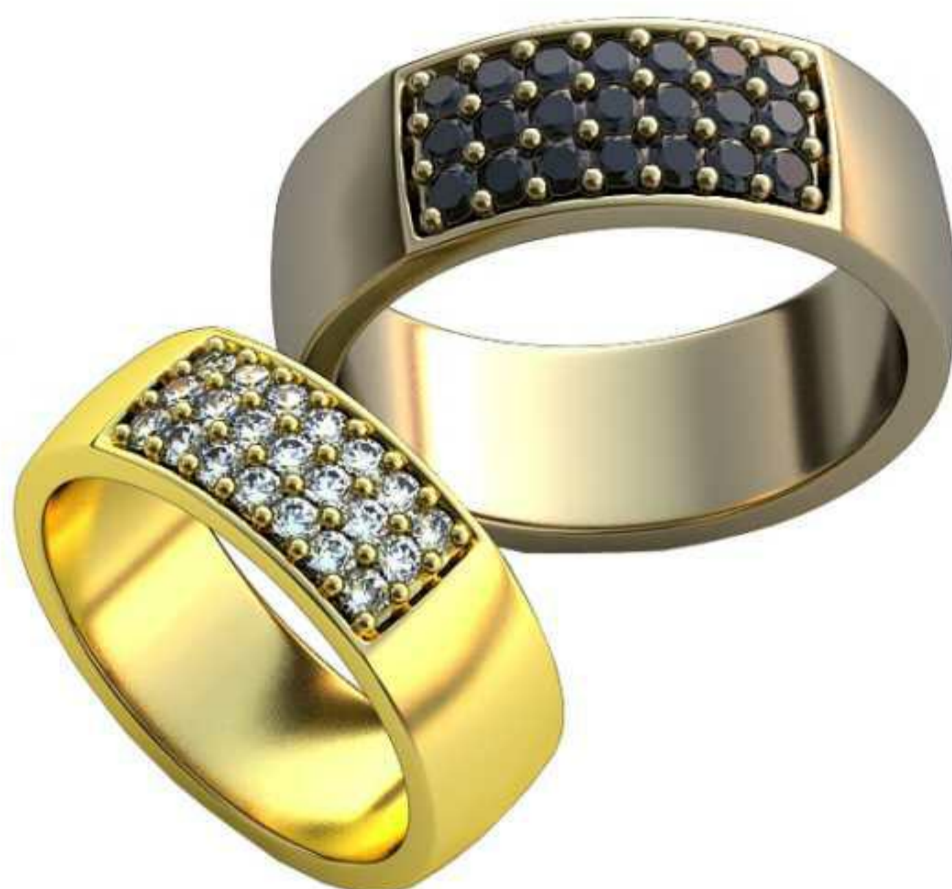
148ж/Р-15,2/Ш-6,0/Т-1,5/Кр 1.6-21шт./Вес-5,5 148м/Р-17,5/Ш-7,0/Т-1,8/Кр 1.6-21шт./Вес-8,5