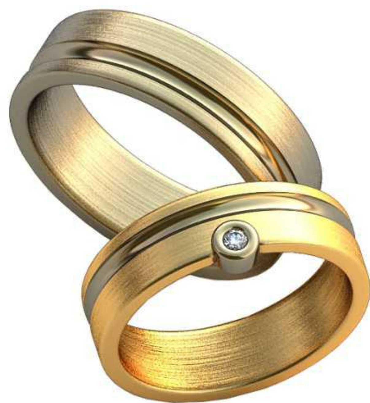
433ж/Р-16,7/Ш-5,4/Т-1,4/Кр 1.7-1шт./Вес-5,3 433м/Р-18,7/Ш-6/Т-1,6/Вес-7,2