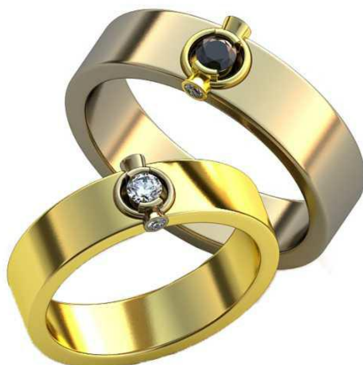
338ж/Р-18/Ш-5,3/Т-1,7/Кр 2.9-1шт.,1.5-2шт./Вес-7,3 338м/Р-20,5/Ш-6,2/Т-2/Кр 2.9-1шт.,1.5-2шт./Вес-11,0