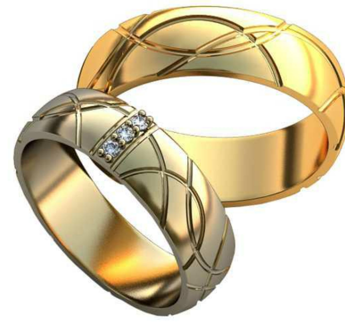
177ж/Р-15,5/Ш-5,0/Т-1,2/Кр 1.4-3шт./Вес-3,6 177м/Р-17,0/Ш-5,5/Т-1,4/Вес-4,7