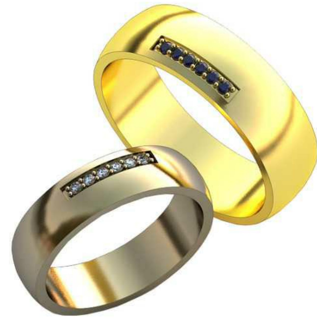
138ж/Р-15,7/Ш-4,8/Т-1,4/Кр 1.2-6шт./Вес-4,3 138м/Р-18,7/Ш-6,3/Т-1,4/Кр 1.2-6шт./Вес-6,6