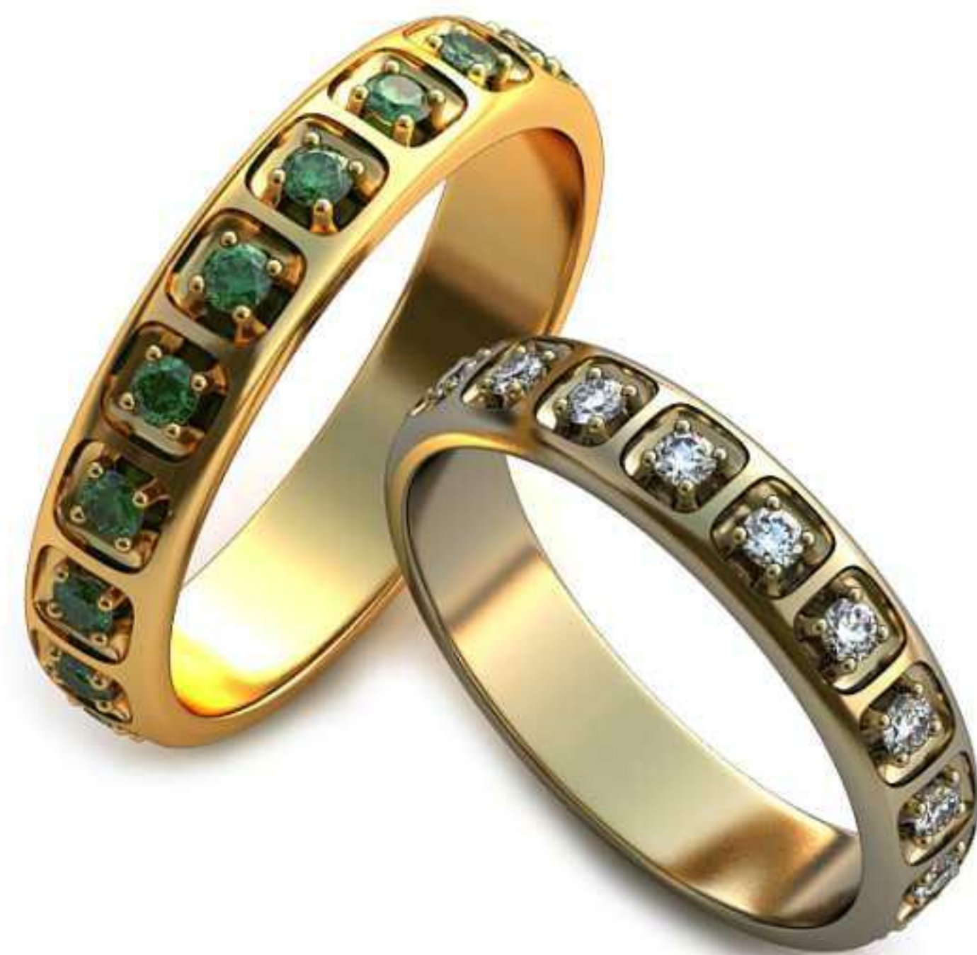
219ж/Р-16,7/Ш-4,0/Т-1,4/Кр 1.8-18шт./Вес-2,8 219м/Р-18,5/Ш-4,4/Т-1,5/Кр 2.0-18шт./Вес-4,0