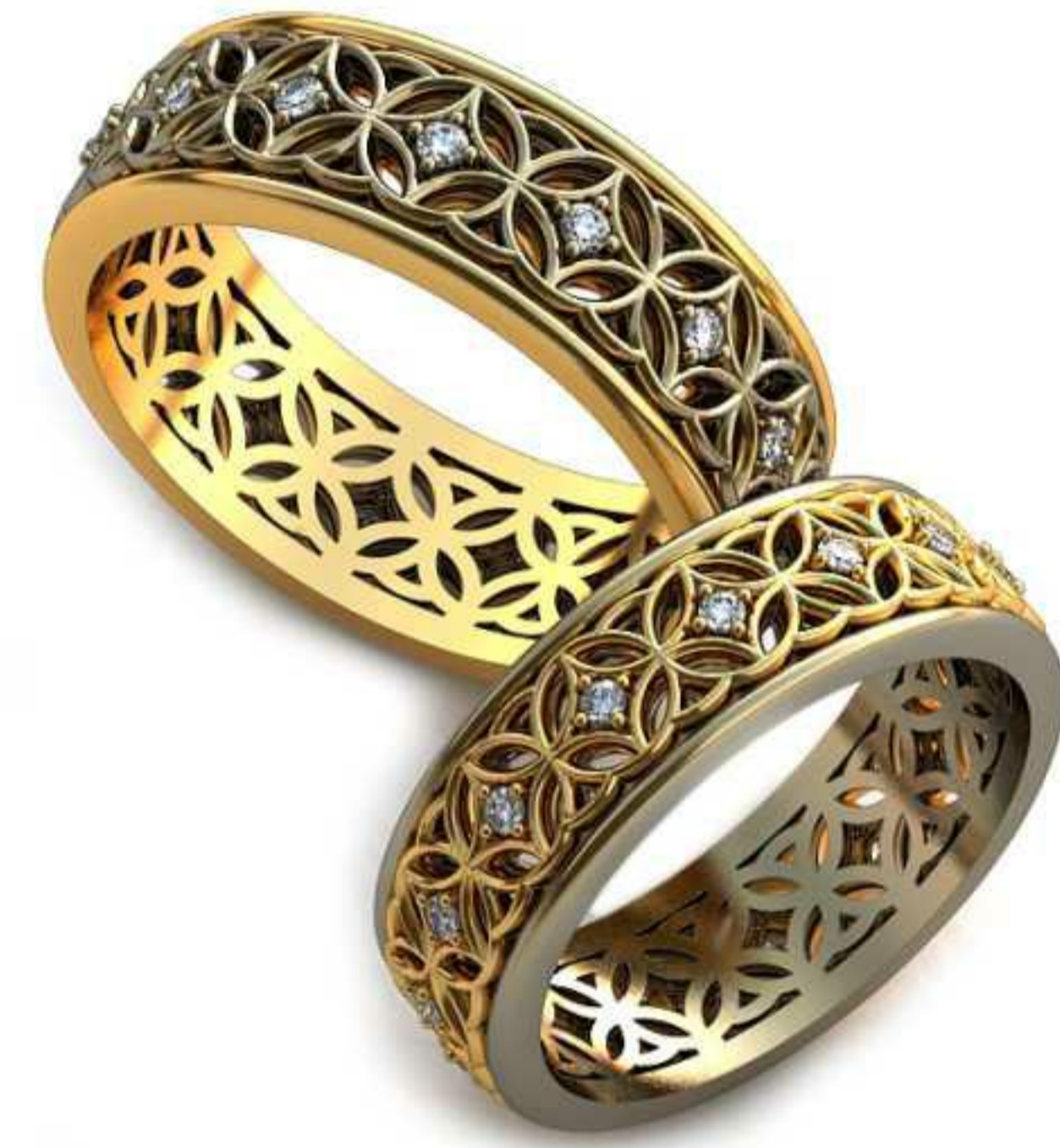
84ж/Р-16,5/Ш-6/Т-1,6/Кр 1.2-15шт./Вес-4,7 84м/Р-18,0/Ш-6,6/Т-1,9/Кр 1.2-15шт./Вес-6,2