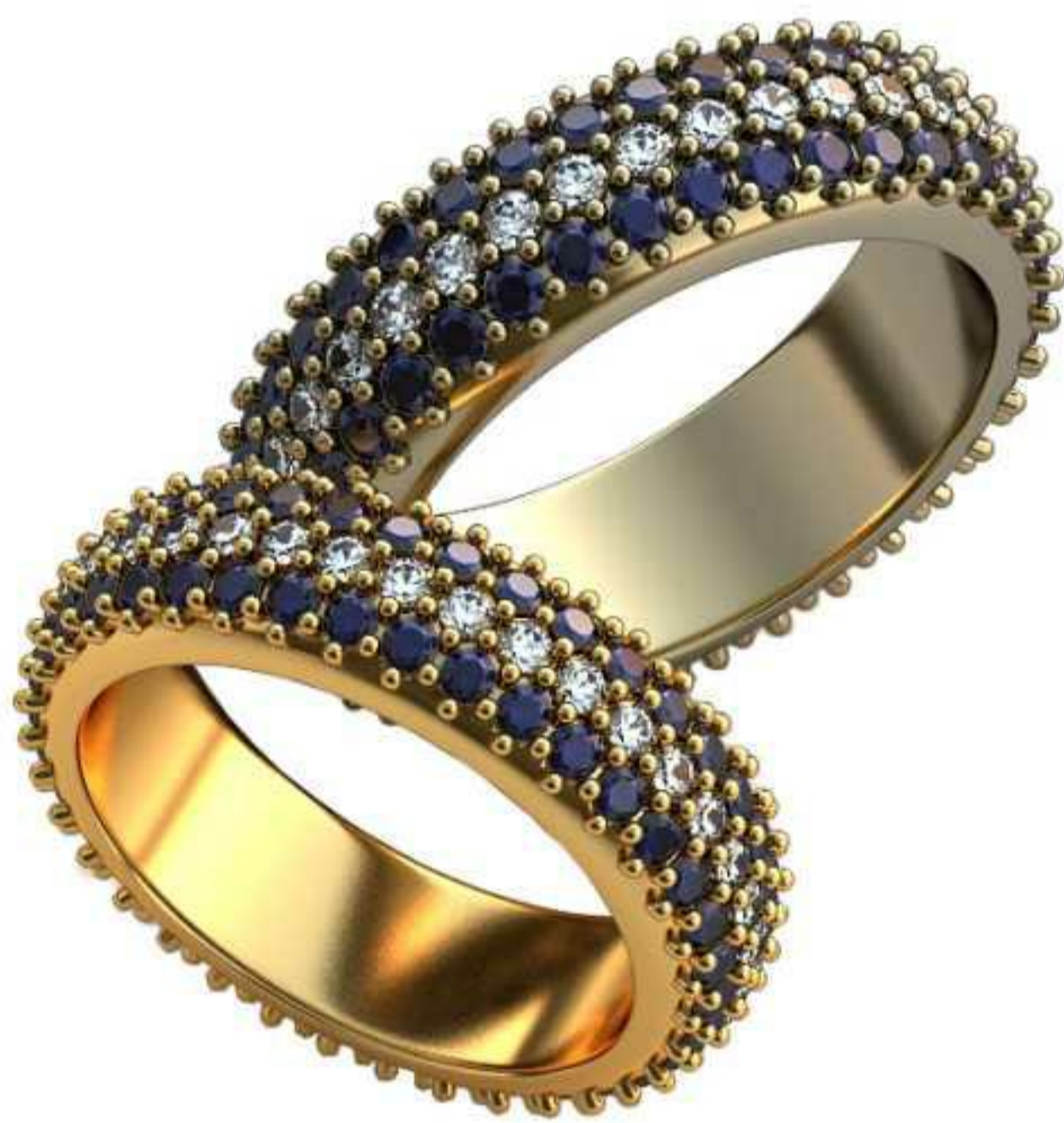
172ж/Р-16,0/Ш-5,5/Т-2,1/Кр 1.5-108шт./Вес-6,5 172м/Р-17,5/Ш-6,0/Т-2,2/Кр 1.5-108шт./Вес-8,6