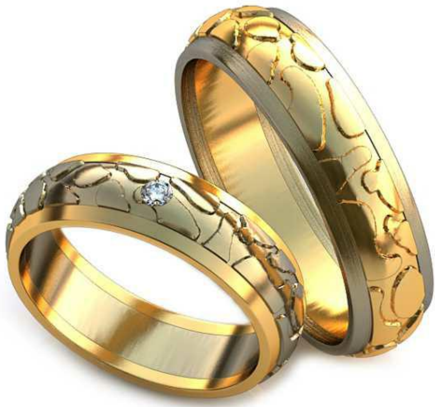
226ж/Р-16,7/Ш-5,5/Т-1,7/Кр 2.0-1шт./Вес-5,7 226м/Р-20,5/Ш-6,0/Т-1,9/Вес-8