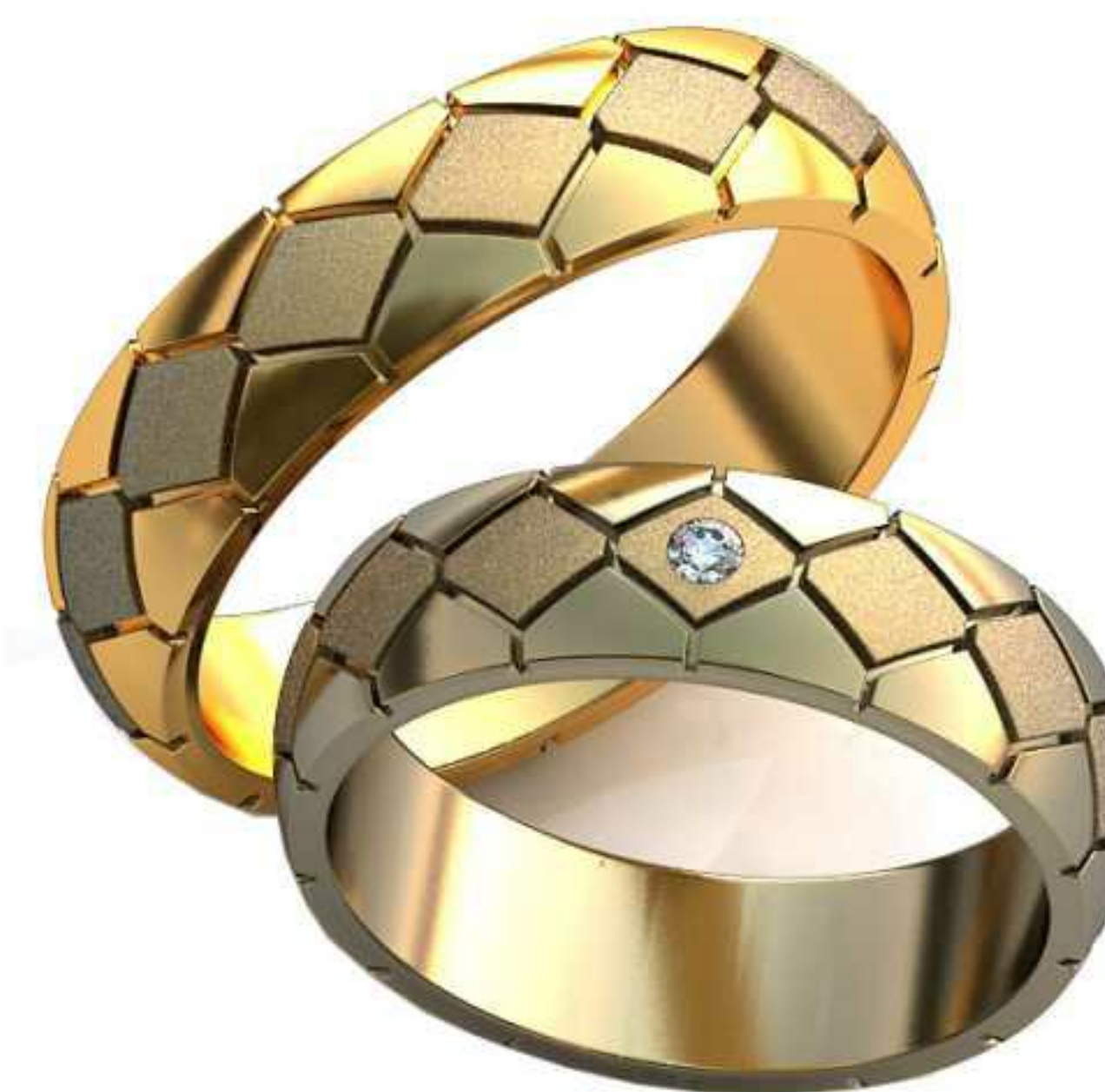
456ж/Р-18,7/Ш-6/Т-1,7/Кр 2.0-1шт./Вес-7,3 456м/Р-21,2/Ш-6/Т-1,9/Вес-9,3