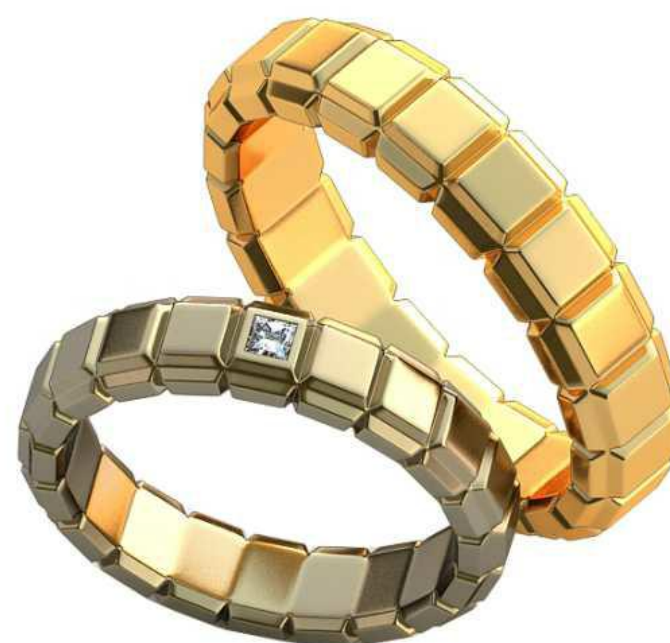
339ж/Р-17,7/Ш-4,6/Т-2,2/Пр 2.0x2.0-1шт./Вес-7,2 339м/Р-21,0/Ш-5,4/Т-2,6/Вес-12,1