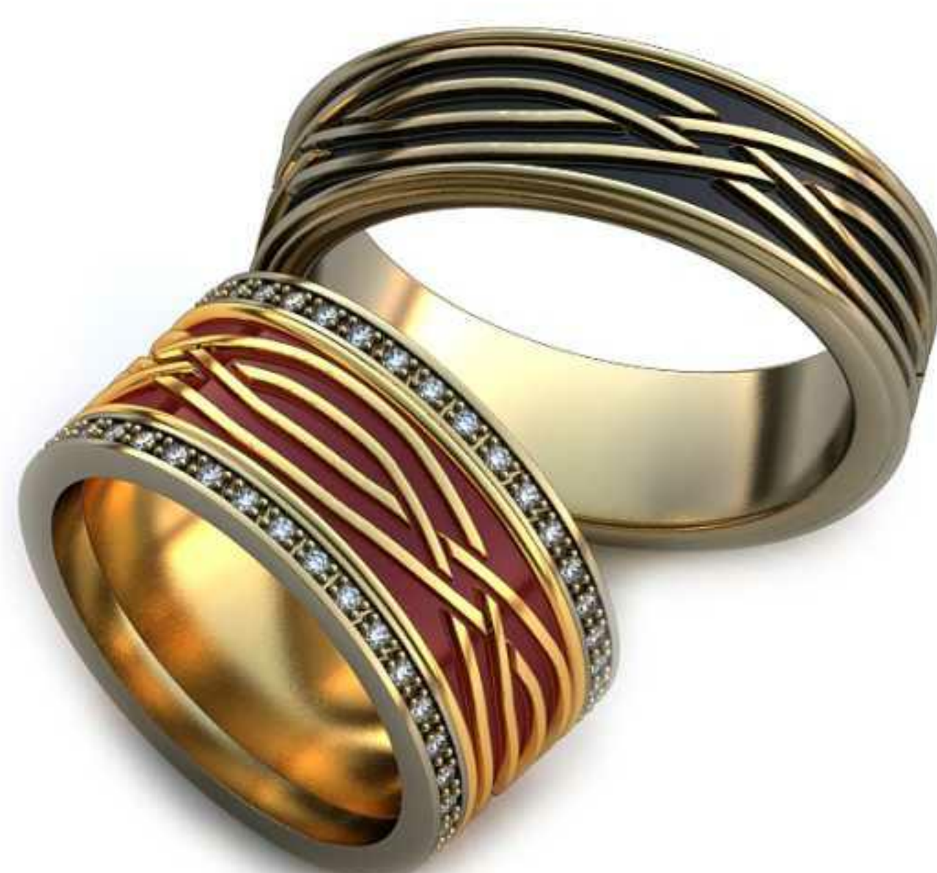
277ж/Р-17,7/Ш-10,4/Т-1,8/Кр 1.0-72шт./Вес-13,6 277м/Р-21,2/Ш-7,6/Т-2,1/Вес-12,7