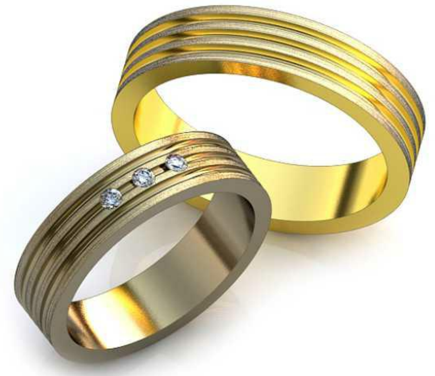
06ж/Р-17/Ш-5,0/Т-1,5/Кр 1.74-3шт./Вес-5,8 06м/Р-19,8/Ш-5,0/Т-1,7/Вес-7,2