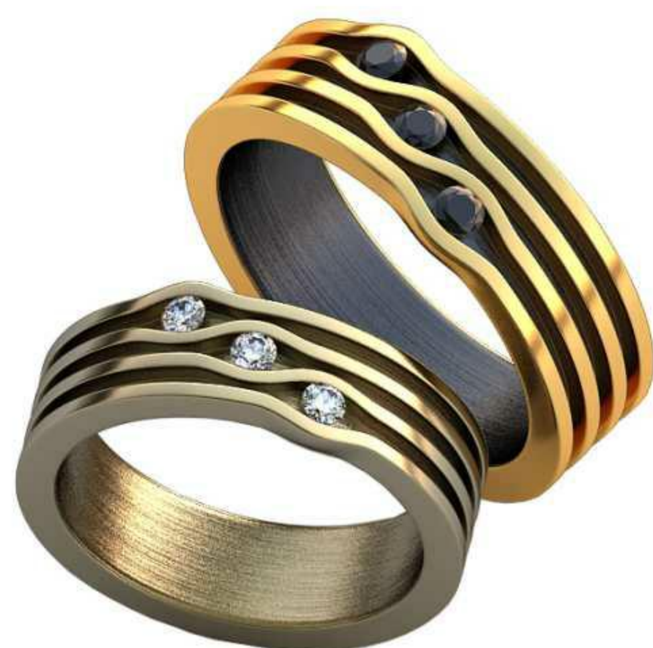
377ж/Р-15,7/Ш-5,4/Т-1,8/Кр 2.0-3шт./Вес-6,6 377м/Р-17,7/Ш-6,0/Т-2,0/Кр 2.0-3шт./Вес-9,1