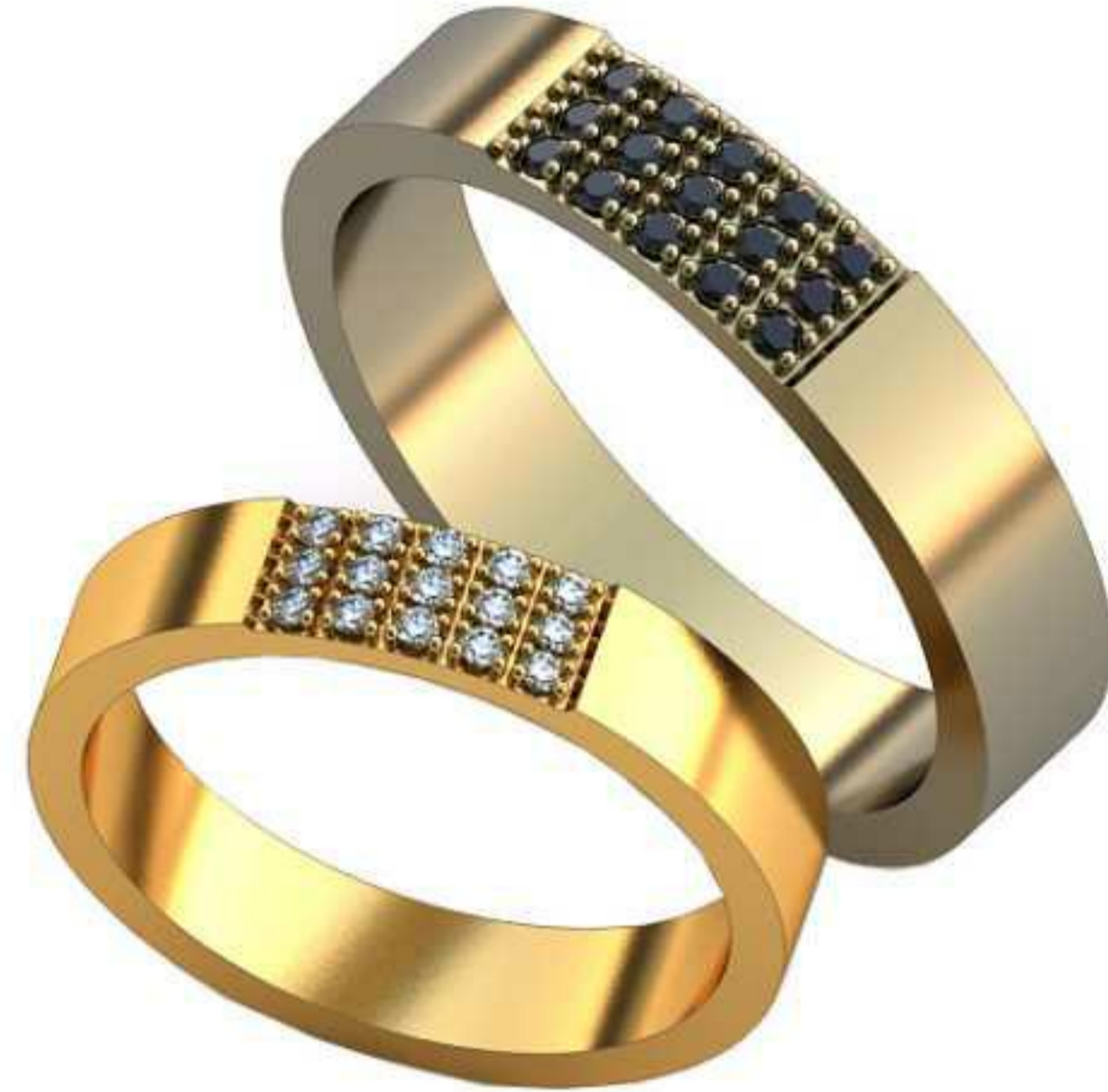
470ж/Р-18,2/Ш-4,1/Т-1,5/Кр 1.25-15шт./Вес-4,9 470м/Р-22/Ш-5/Т-1,8/Кр 1.5-15шт./Вес-8,6