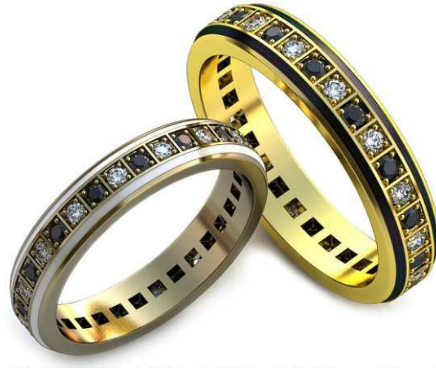
77ж/Р-18,0/Ш-4,2/Т-1,8/Кр 1.8-32шт./Вес-4,4 77м/Р-20,7/Ш-4,8/Т-2,0/Кр 1.8-32шт./Вес-6,6