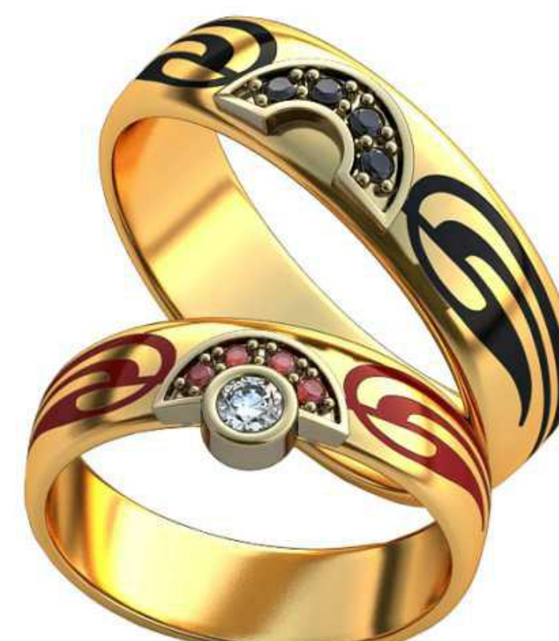
309ж/Р-16,5/Ш-5,0/Т-1,1/Кр 2.7-1шт.,1.2-4шт./Вес-3,9 309м/Р-19,5/Ш-5,8/Т-1,3/Кр 1.2-4шт./Вес-6,0