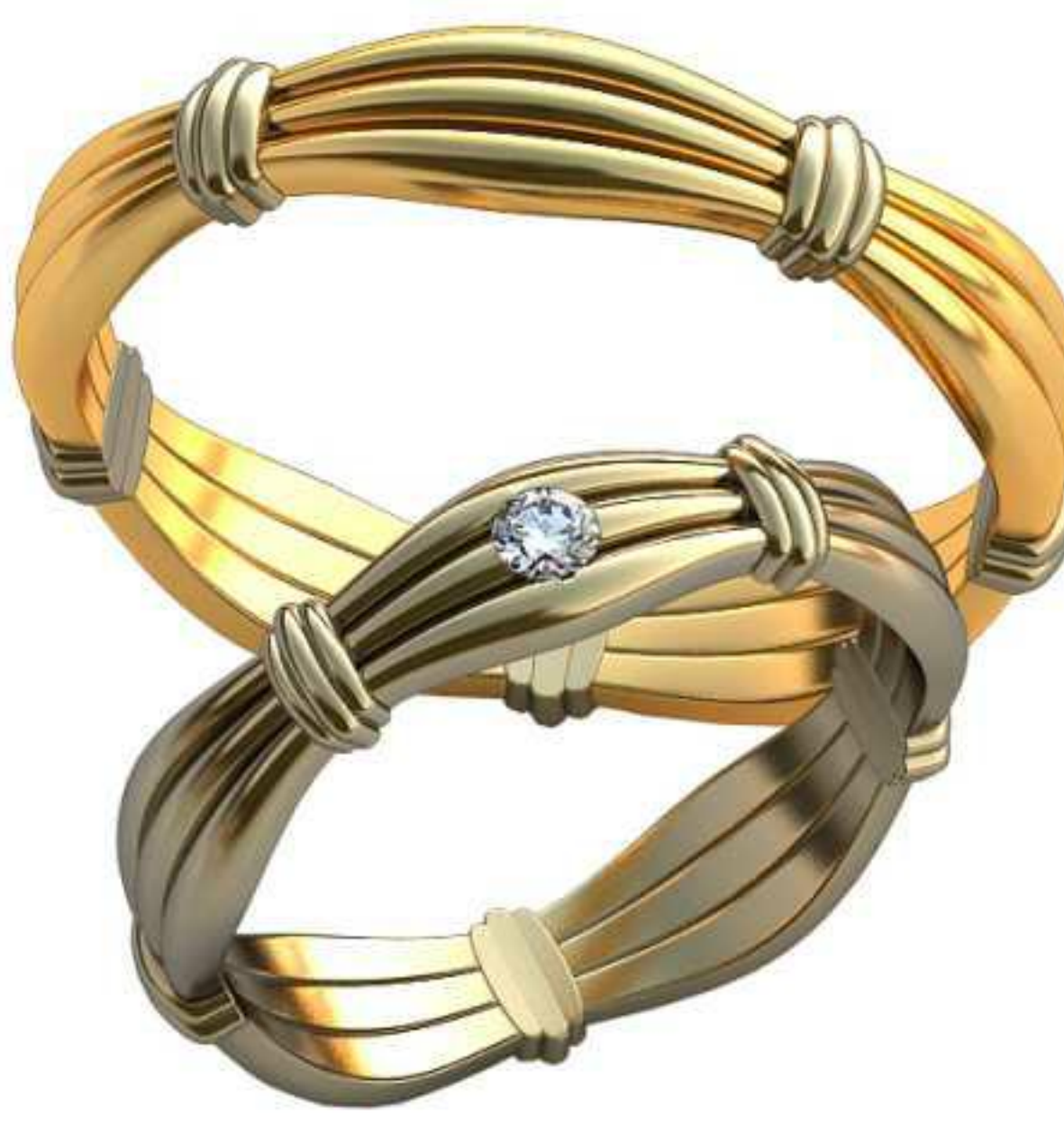
368ж/Р-17,7/Ш-4,5/Т-1,4/Кр 2,5-1шт./Вес-3,8 368м/Р-21,5/Ш-4,5/Т-1,7/Вес-5,6