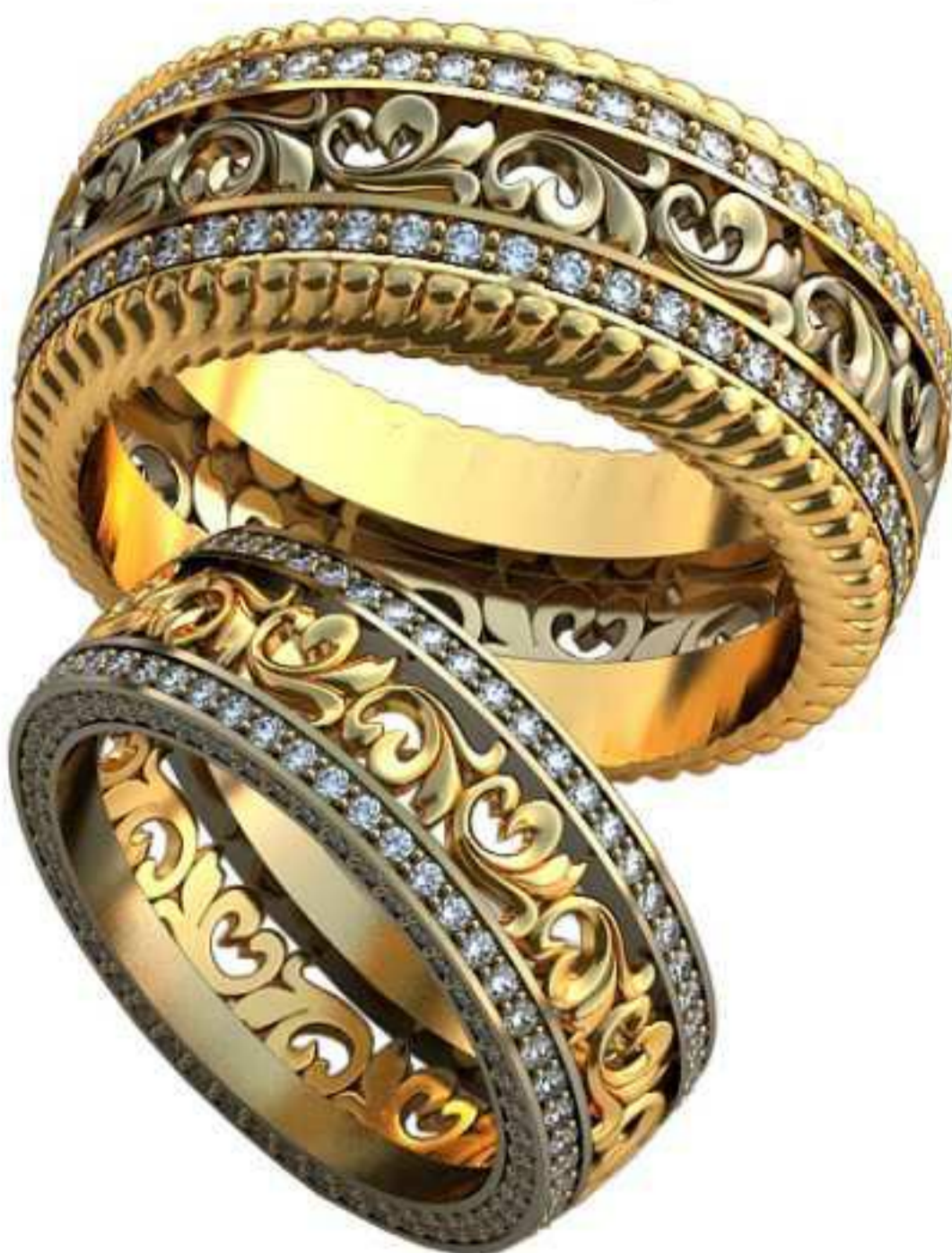
448ж/Р-17/Ш-7,3/Т-2,2/Кр 1.1-204шт./Вес-5,8 448м/Р-21/Ш-11/Т-2,7/Кр 1.4-102шт./Вес-14,5