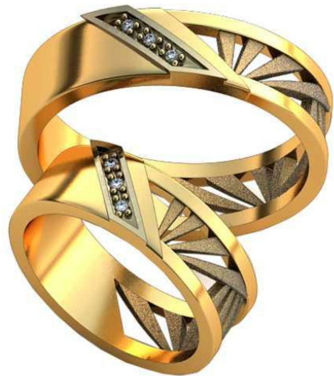
475ж/Р-15,5/Ш-6/Т-1,4/Кр 1.0-3шт./Вес-4,9 475м/Р-20/Ш-6/Т-1,5/Кр 1.0-3шт./Вес-6,6