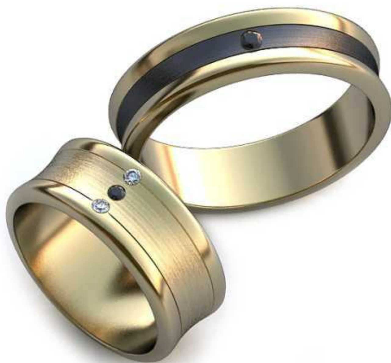
26ж/Р-16,7/Ш-7,9/Т-1,3/Кр 1.6-3шт./Вес-6,1 26м/Р-20,5/Ш-6,2/Т-1,6/Кр 1.95-1шт./Вес-5,8