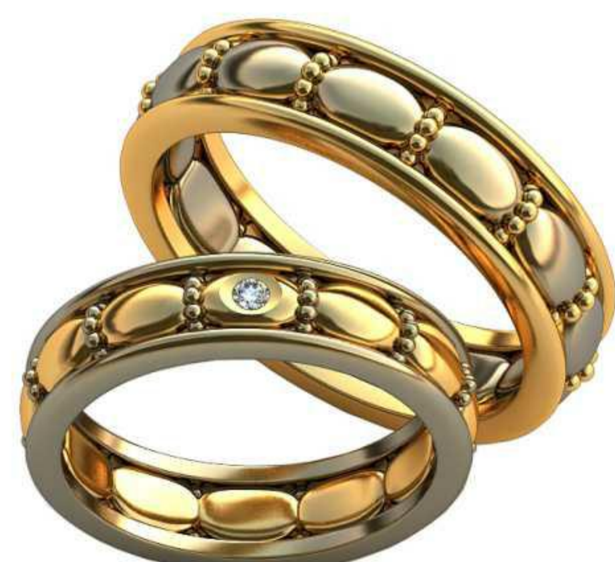
380ж/Р-17,0/Ш-5,0/Т-2,0/Кр 1.7-1шт./Вес-5,8 380м/Р-19,2/Ш-5,7/Т-2,2/Вес-8,9