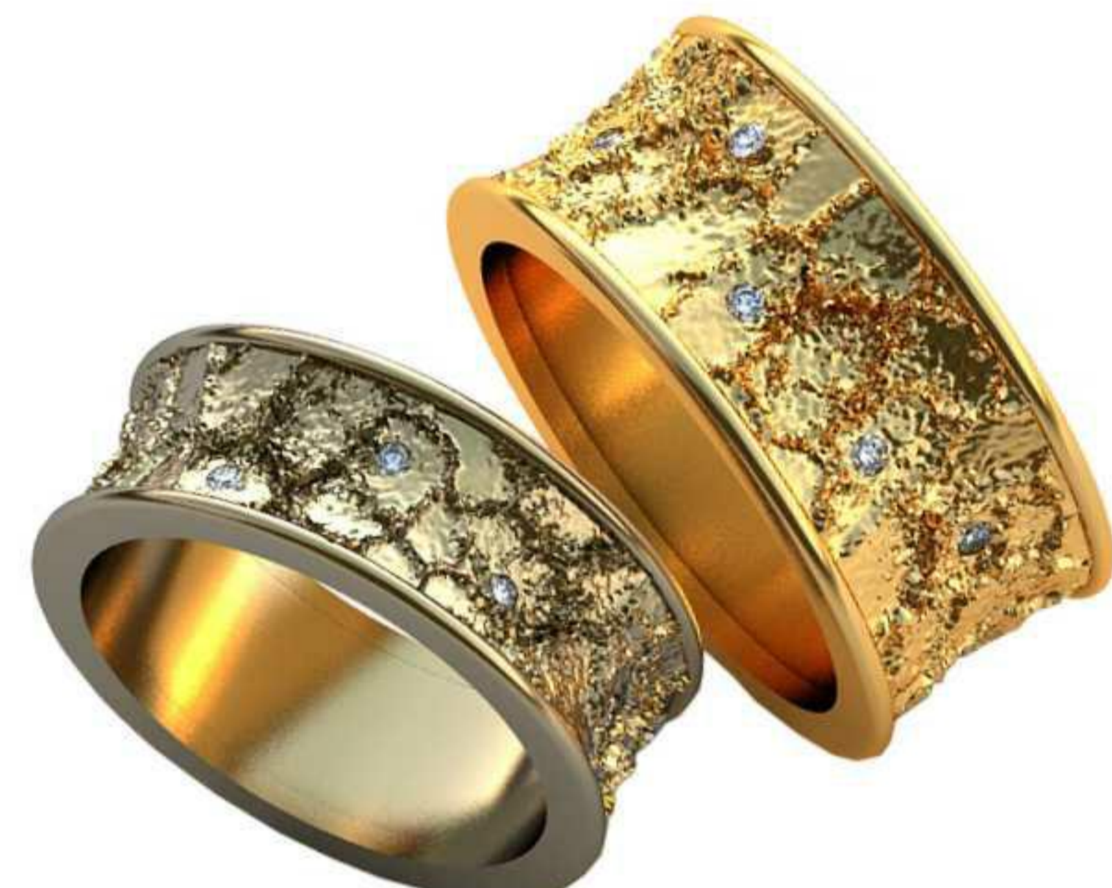
504ж/Р-17/Ш-7,5/Т-1,9/Кр 1.25-11шт./Вес-9,1 504м/Р-18,5/Ш-9,9/Т-2,0/Кр 1.25-11шт./Вес-12,9