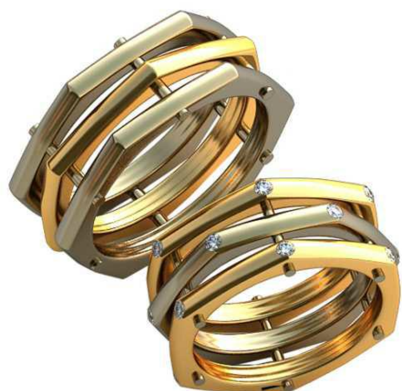
514ж/Р-16,7/Ш-9,5/Т-2,6/Кр 1.55-18шт./Вес-10,2 514м/Р-19/Ш-9,4/Т-3,0/Вес-12,9