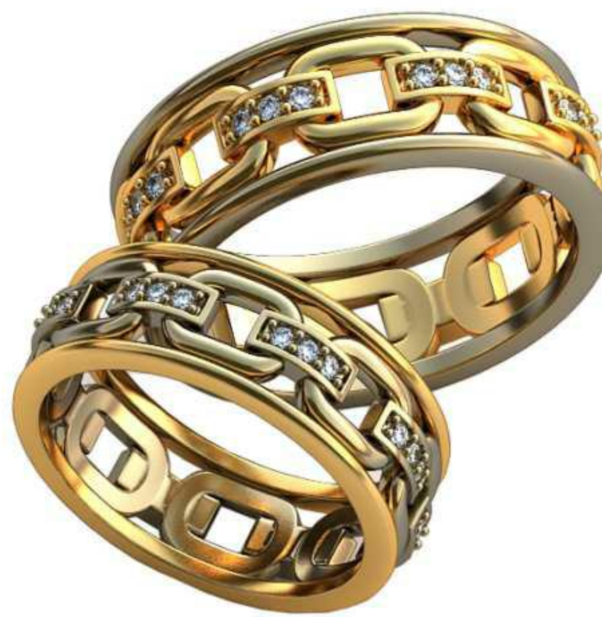
395ж/Р-16,7/Ш-7,0/Т-1,6/Кр 1.2-24шт./Вес-5,2 395м/Р-19,2/Ш-8,0/Т-1,8/Кр 1.2-24шт./Вес-7,9