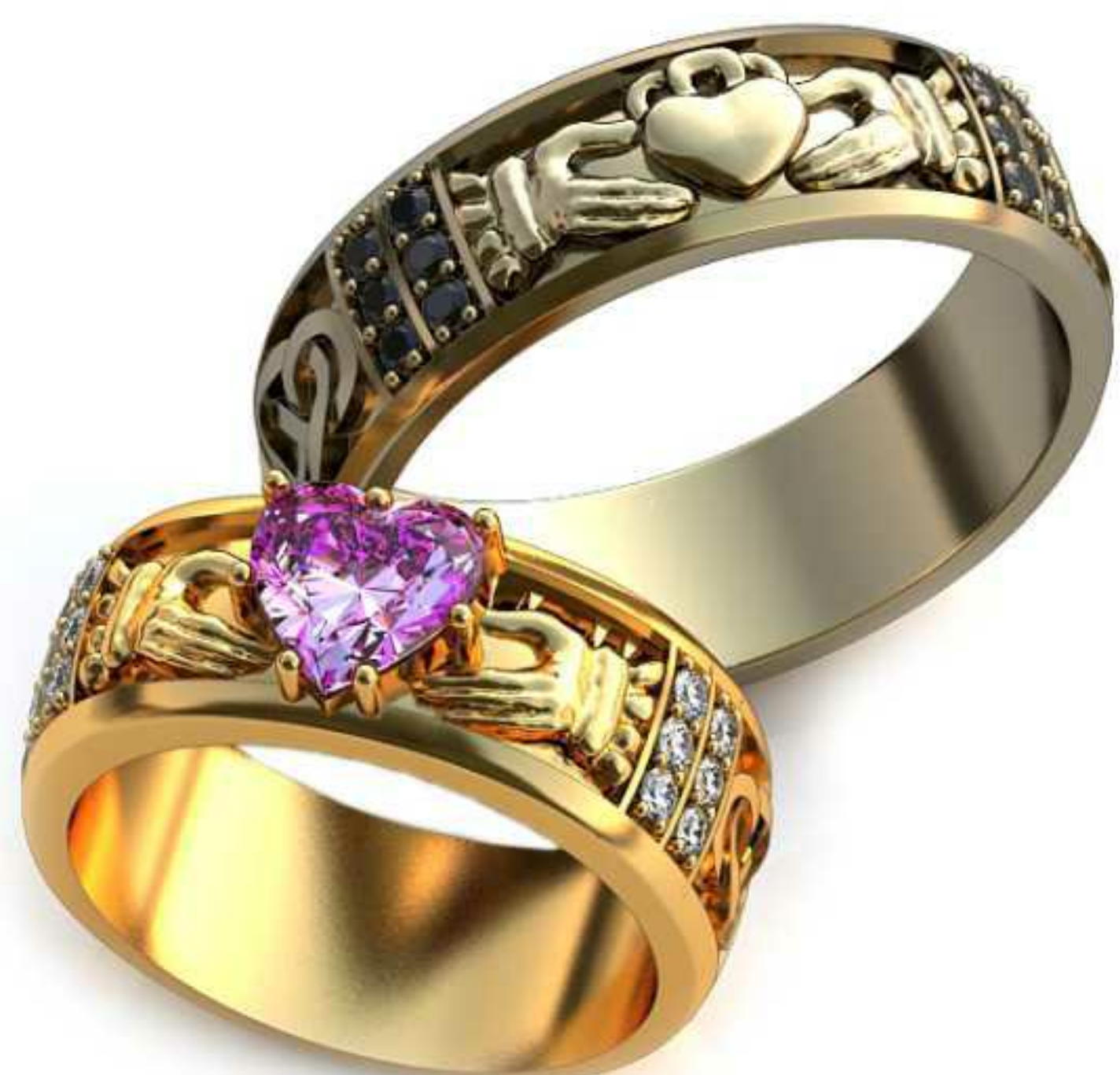
271ж/Р-15,5/Ш-6,7/Т-1,3/ Кр 1.3-12шт. серд. 5.95x5.91-1шт./Вес-6,1 271м/Кр 1.3-12шт./Р-18,5/Ш-6,2/Т-1,4/Вес-6,7