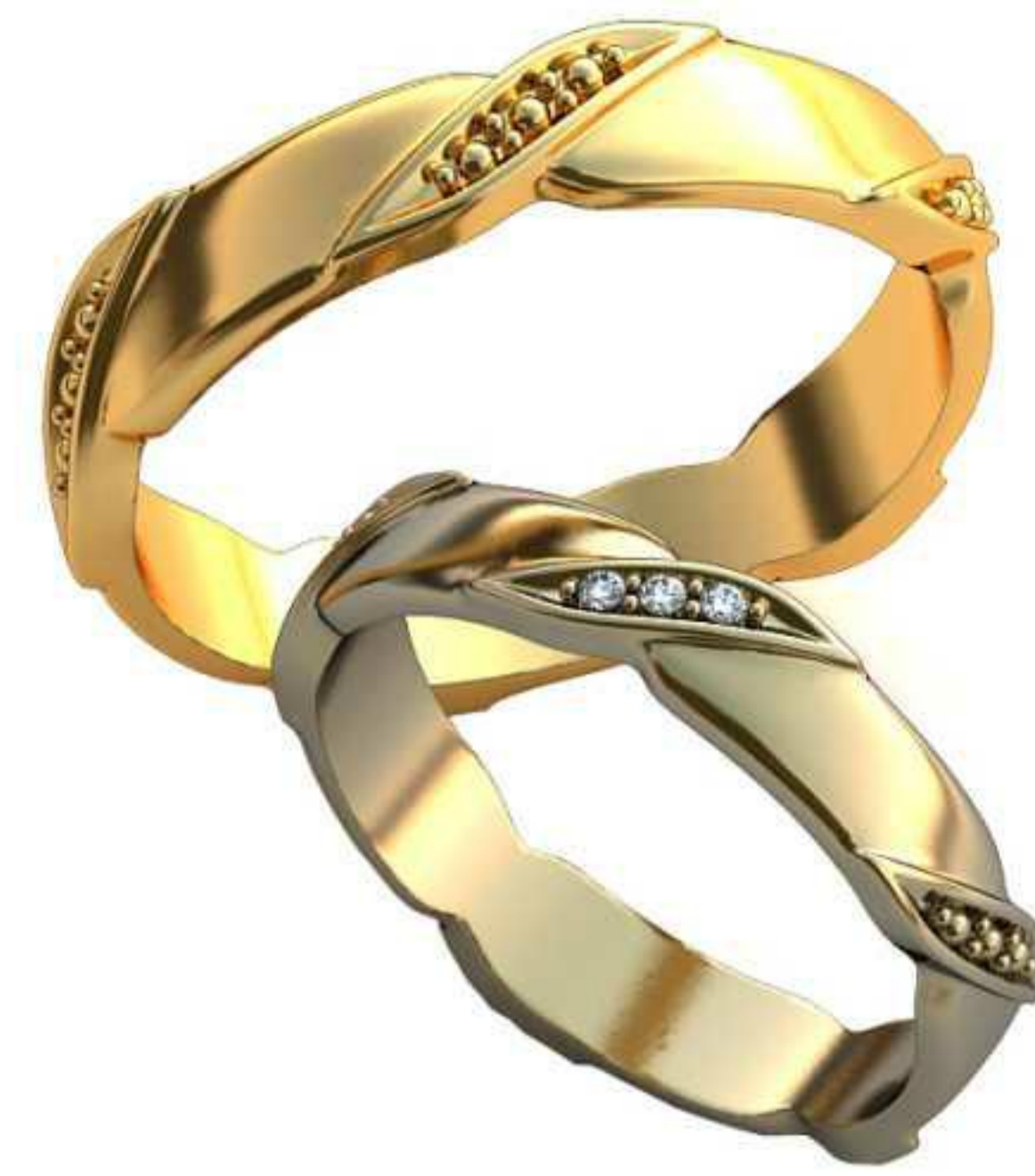
198ж/Р-16,0/Ш-3,6/Т-1,3/Кр 1.0-3шт./Вес-2,5 198м/Р-18,7/Ш-4,1/Т-1,5/Вес-4,0