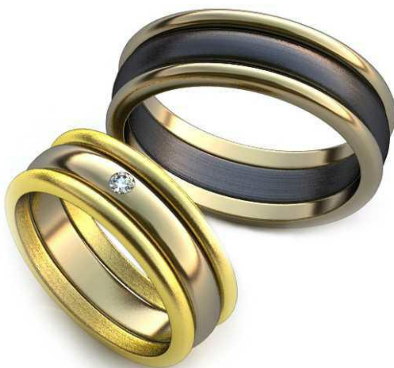
23ж/Р-16,7/Ш-6,7/Т-1,4/Кр 2.0-1шт./Вес-3,0 23м/Р-19,0/Ш-6,7/Т-1,6/Вес-4,0