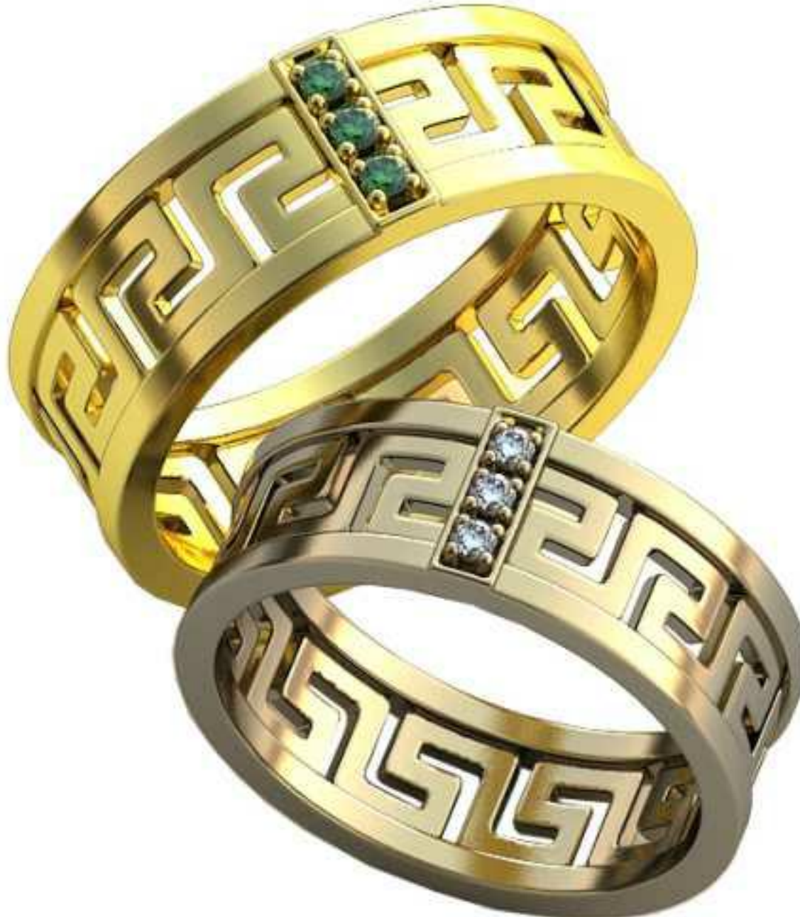
374ж/Р-17,5/Ш-7,0/Т-1,5/Кр 1,6-3шт./Вес-5,2 374м/Р-19,2/Ш-7,7/Т-1,6/Кр 1,6-3шт./Вес-7,0