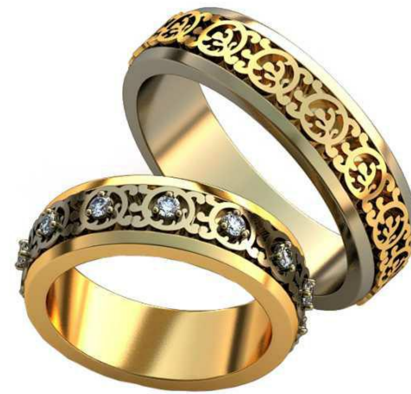
180ж/Р-16,2/Ш-5,8/Т-2/Кр 1.8-13шт./Вес-7,5 180м/Р-20,0/Ш-5,9/Т-2,0/Вес-8,2