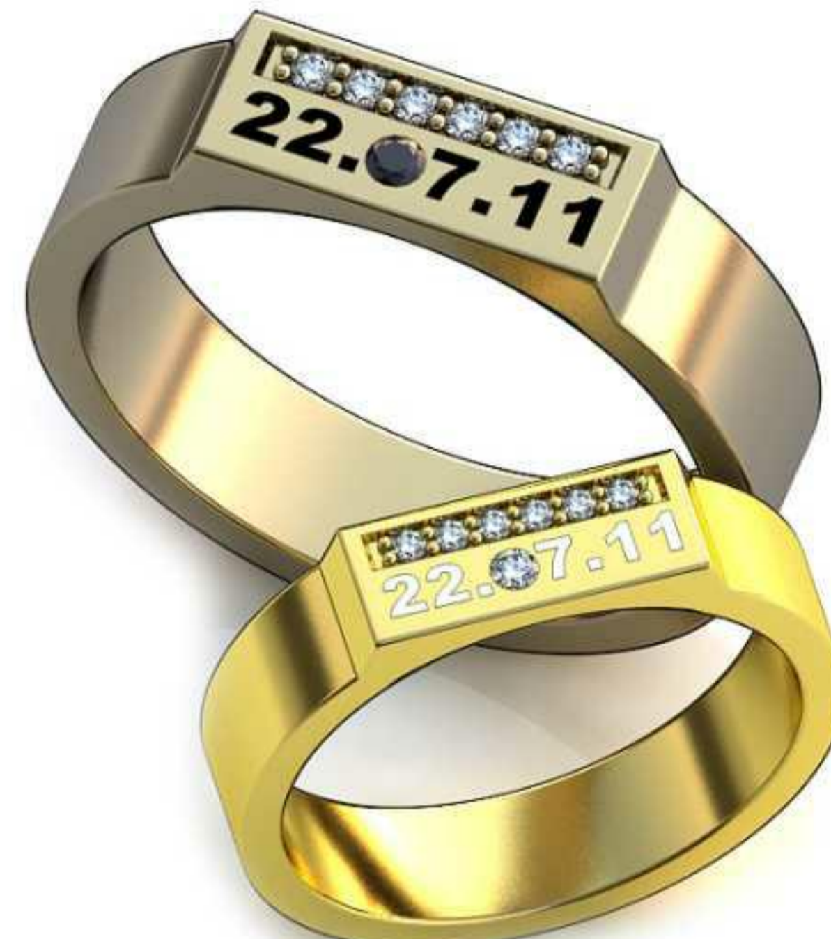
263ж/Р-16,5/Ш-4,4/Т-1,4/Кр 1.5-1шт.,1.15-6шт./Вес-4,6 263м/Р-20,5/Ш-5,4/Т-1,7/Кр 1.5-1шт.,1.15-6шт./Вес-8,9