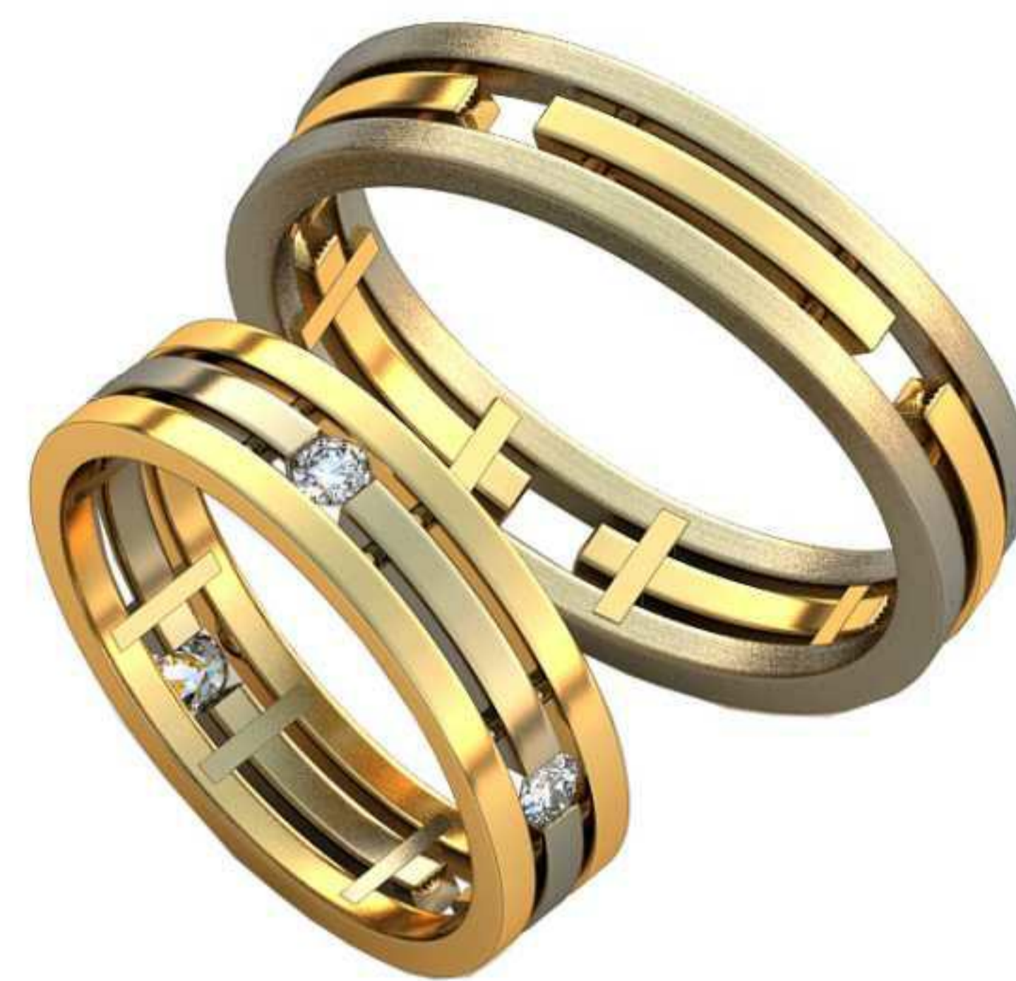
415ж/Р-18/Ш-7,3/Т-1,5/Пр 2.0x2.0-1шт./Вес-8,7 416ж/Р-17/Ш-5,5/Т-2/Вес-6,1 417ж/Р-17/Ш-5/Т-1,3/Кр 2.3-5шт./Вес-3,8 415м/Р-21,2/Ш-7/Т-1,8/Вес-11,8 416м/Р-20,2/Ш-5,5/Т-1,7/Вес-8,7 417м/Р-20,5/Ш-5/Т-1,6/Вес-5,6