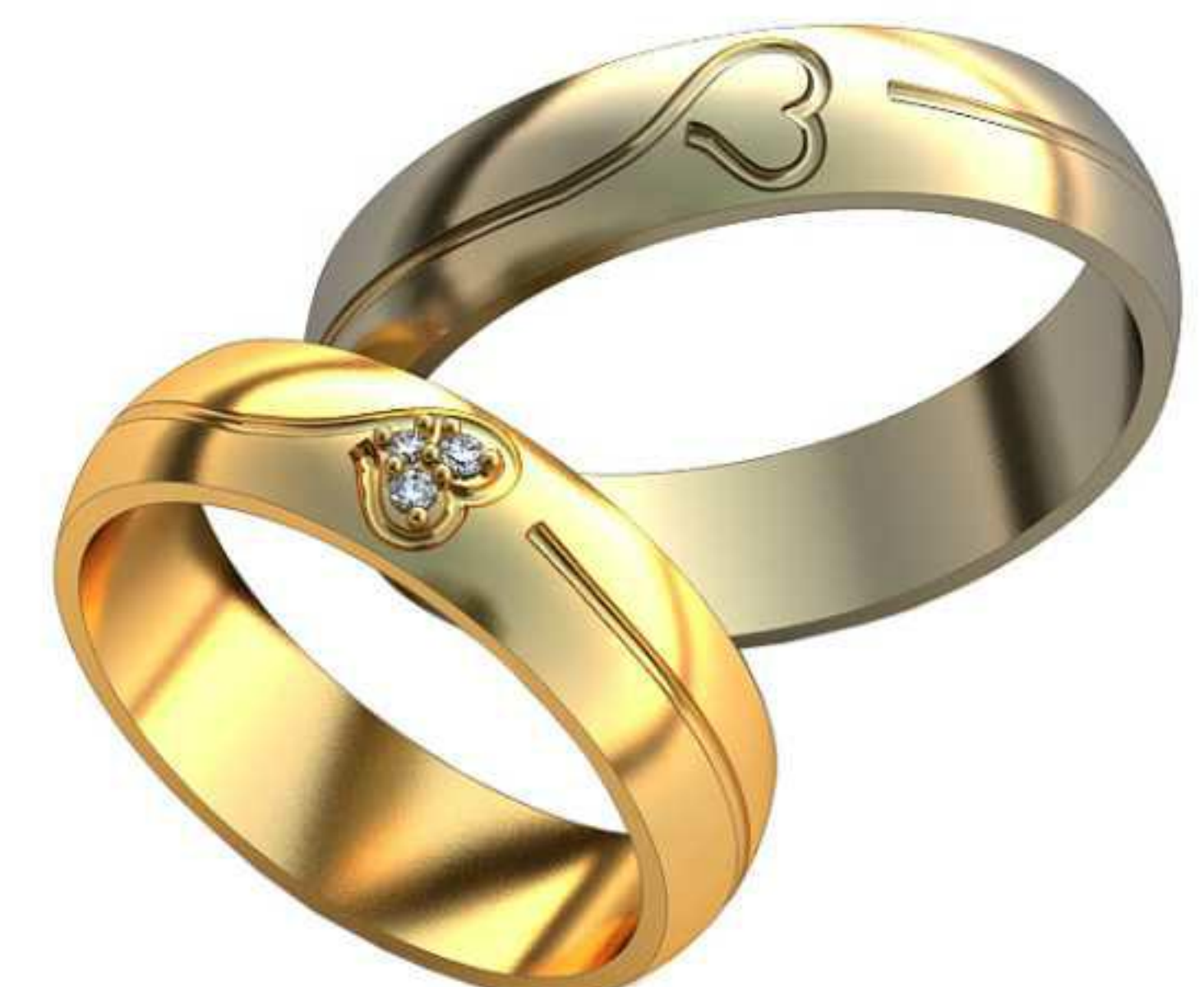
495ж/Р-16,7/Ш-5/Т-1,3/Кр 1.0-1,1.2-1,1.3.0-1шт./Вес-4,1 495м/Р-19,5/Ш-5/Т-1,3/Вес-4,8