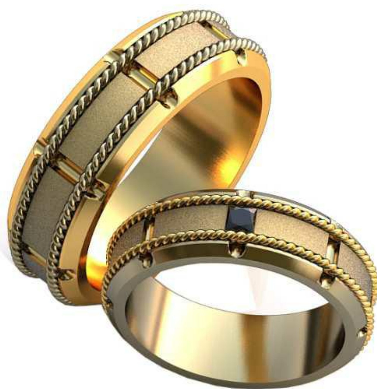
454ж/Р-20,2/Ш-7,3/Т-2,4/Пр 2.6x2.6-1шт./Вес-11,9 454м/Р-23,7/Ш-8,5/Т-2,8/Вес-19,4