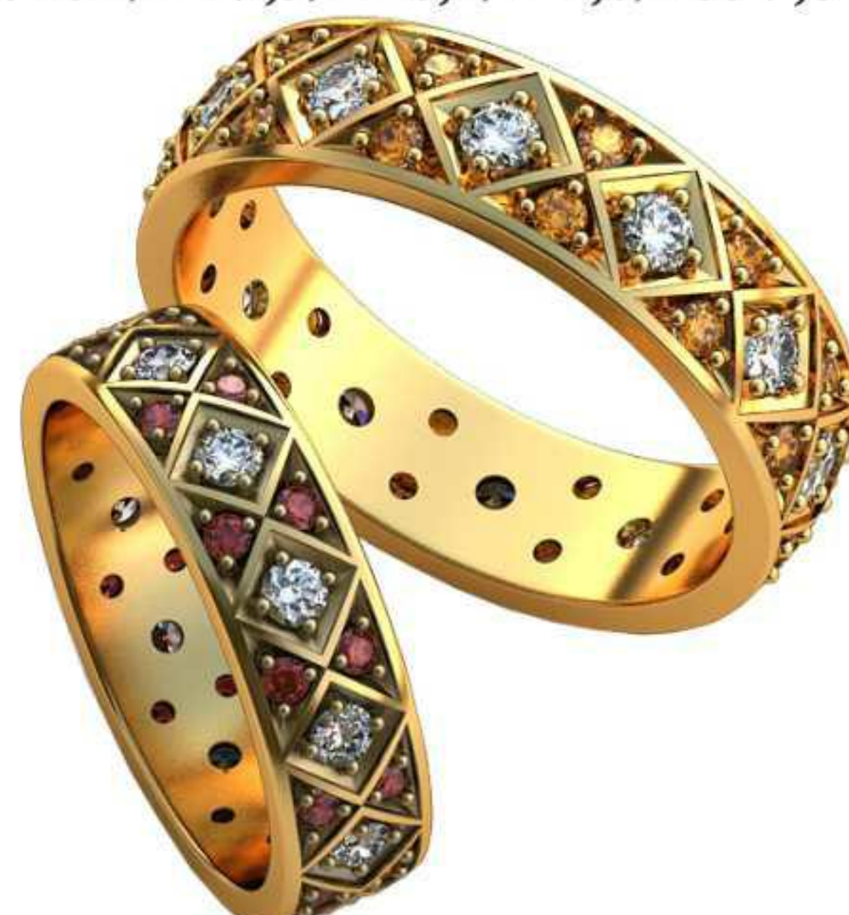
521ж/Р-21/Ш-6,6/Т-2,0/Кр 2.75-12шт.,1.8-24шт./Вес-8,8 521м/Р-25,2/Ш-7,6/Т-2,3/Кр 2.75-12шт.,1.8-24шт./Вес-13,3