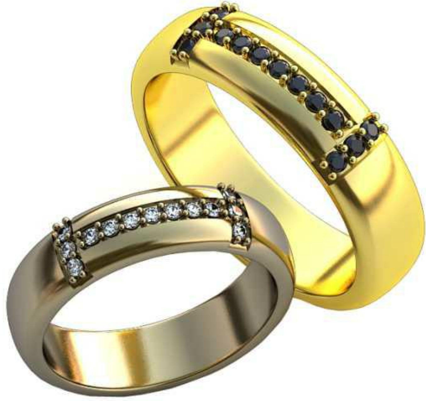
184ж/Р-16,5/Ш-5,0/Т-1,7/Кр 1.2-13шт./Вес-5,5 184м/Р-19,5/Ш-5,9/Т-2,0/Кр 1.5-13шт./Вес-9,2