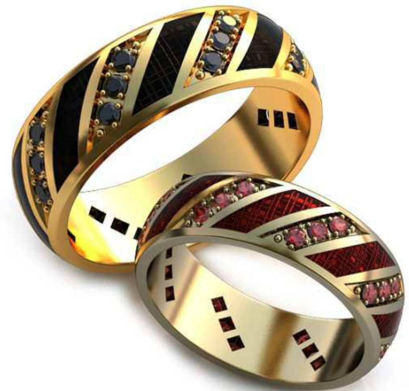
82ж/Р-20,0/Ш-7/Т-1,7/Кр 1.7-24шт./Вес-7,7 82м/Р-17,0/Ш-6/Т-1,4/Кр 1.7-24шт./Вес-4,7