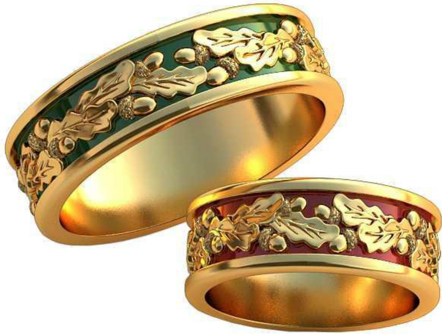
496ж/Р-16/Ш-7/Т-1,5/Кр 1.0-1шт./Вес-6,5 496м/Р-21,5/Ш-7/Т-1,5/Кр 1.0-1шт./Вес-9,1