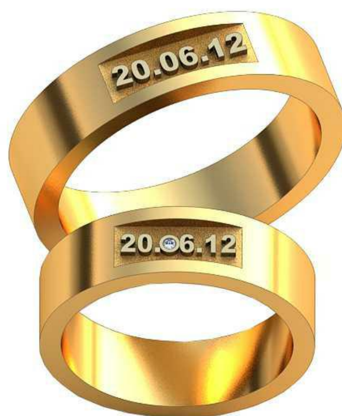
506ж/Р-17/Ш-5,6/Т-1,5/Кр 1.0-1шт./Вес-6,7 506м/Р-20,2/Ш-5,6/Т-1,8/Вес-9,7