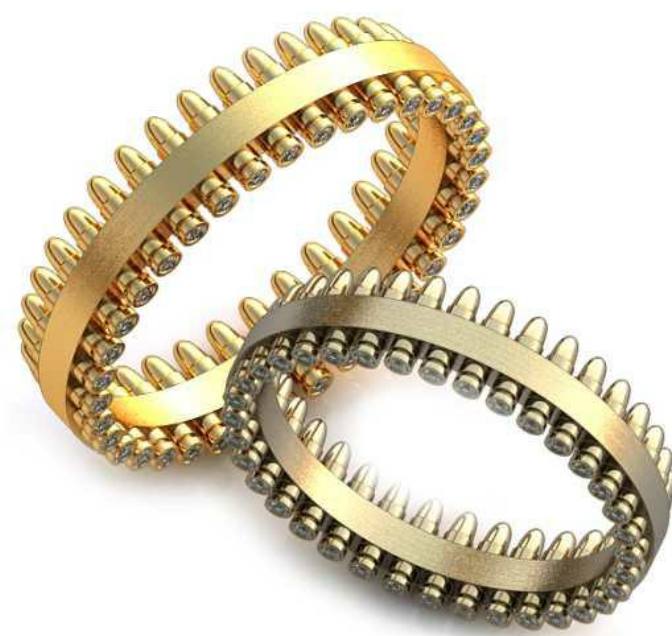
225ж/Р-17,7/Ш-5,0/Т-1,6/Кр 0.8-36шт./Вес-4,2 225м/Р-20,0/Ш-5,7/Т-1,8/Кр 0.9-36шт./Вес-6,0