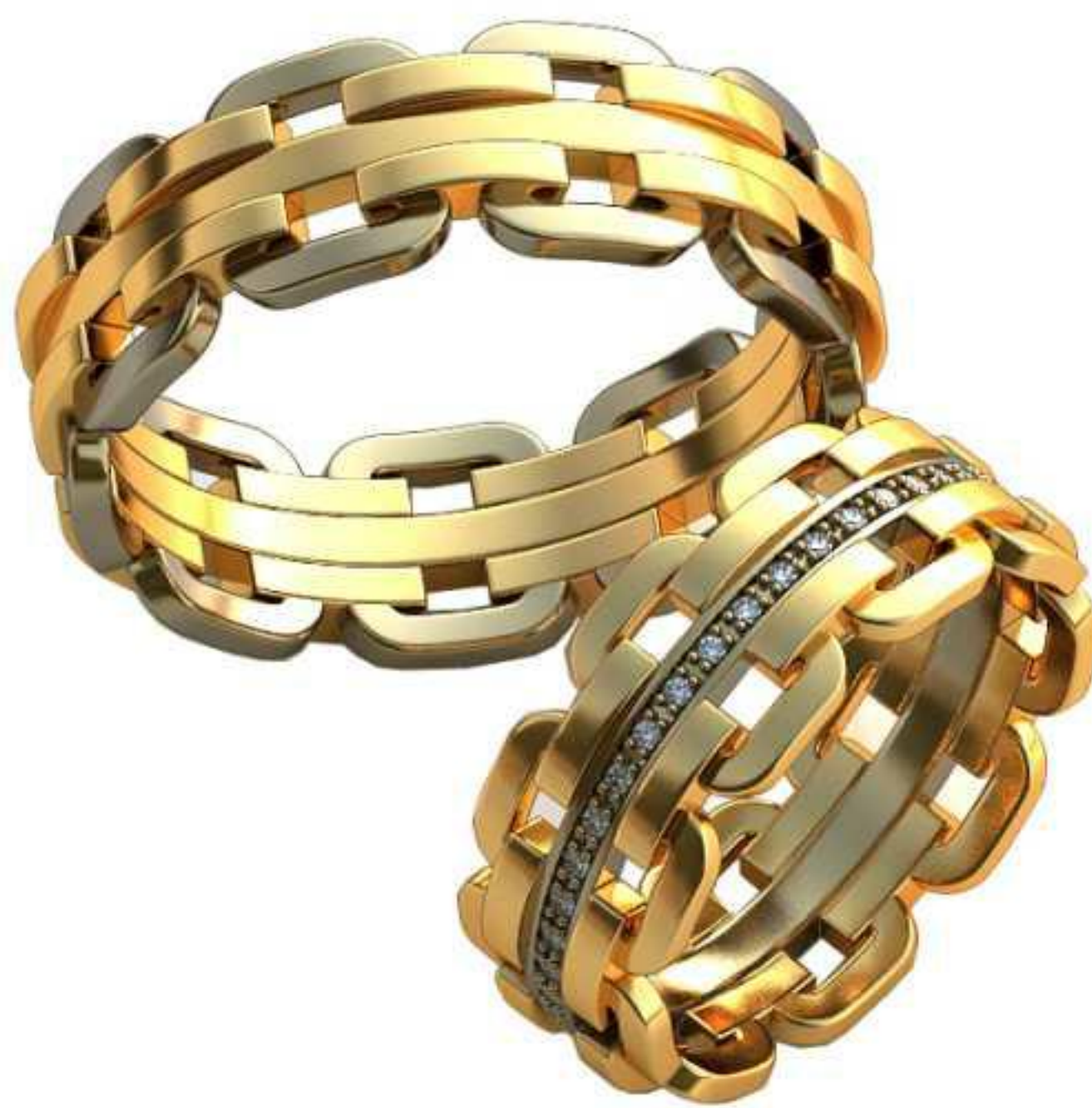
422ж/Р-19,7/Ш-8,7/Т-2/Кр 1.0-40шт./Вес-9,6 422м/Р-23,5/Ш-8,6/Т-2,3/Вес-19,0