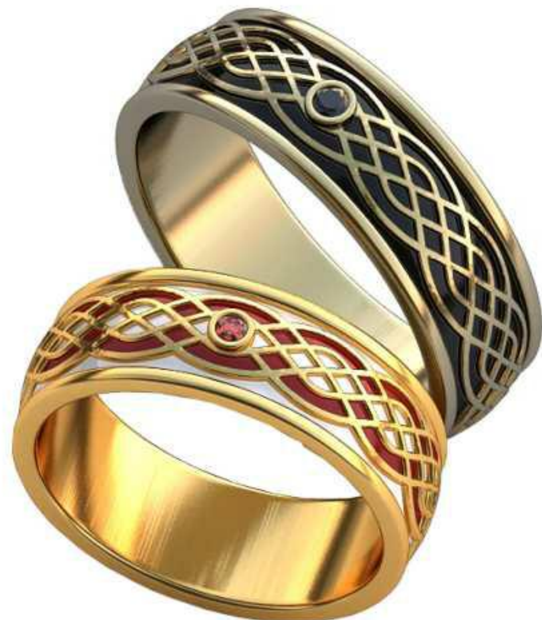
304ж/Р-17,7/Ш-6,8/Т-1,6/Кр 1.7-1шт./Вес-6,9 304м/Р-20,0/Ш-6,8/Т-1,8/Кр 1.8-1шт./Вес-8,5