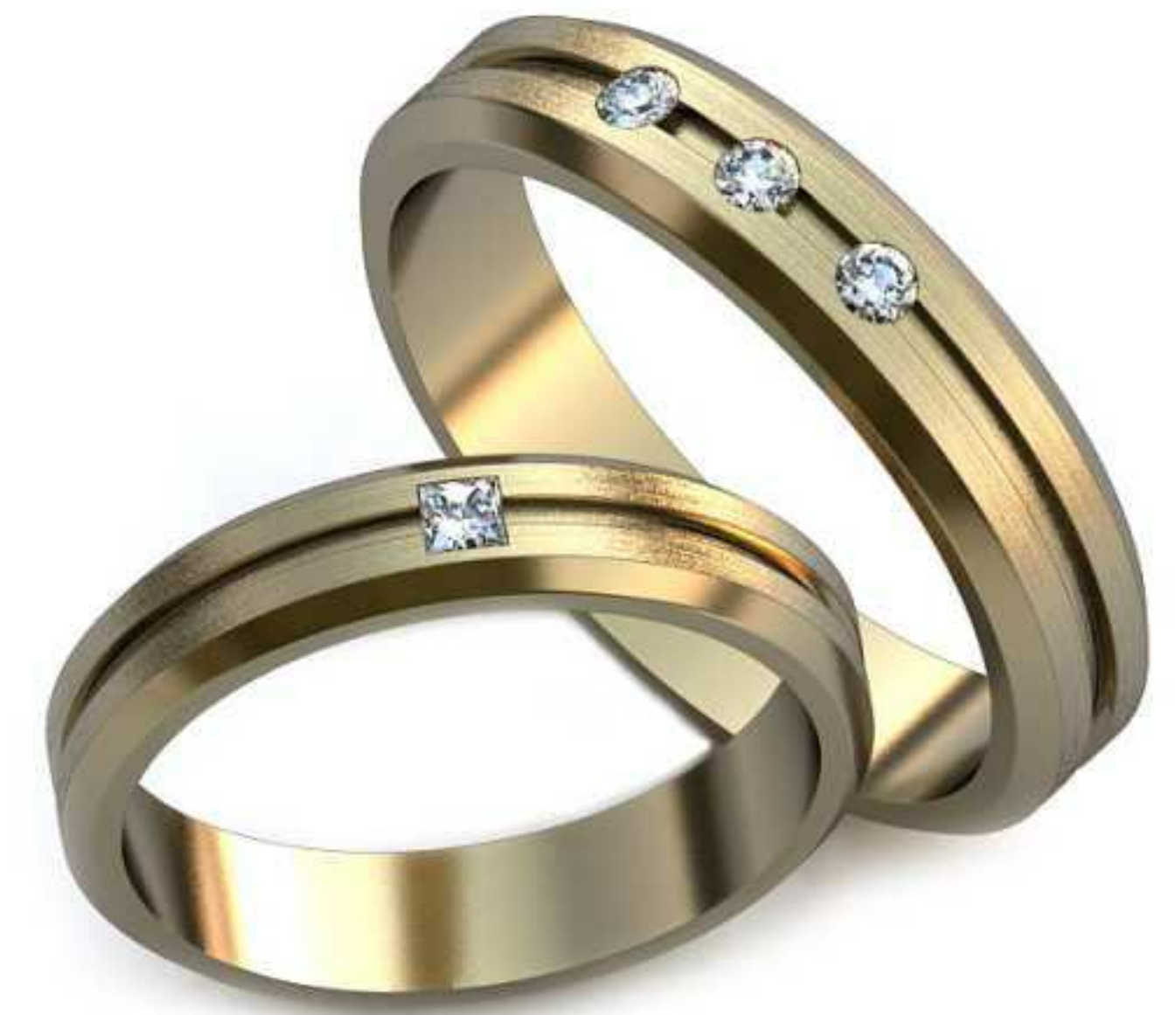
03ж/Р-17,0/Ш-4,0/Т-1,4/Пр 2.0x2.0-1шт./Вес-3,6 03м/Р-19,6/Ш-4,6/Т-1,5/Кр 2.0-3шт./Вес-5,6