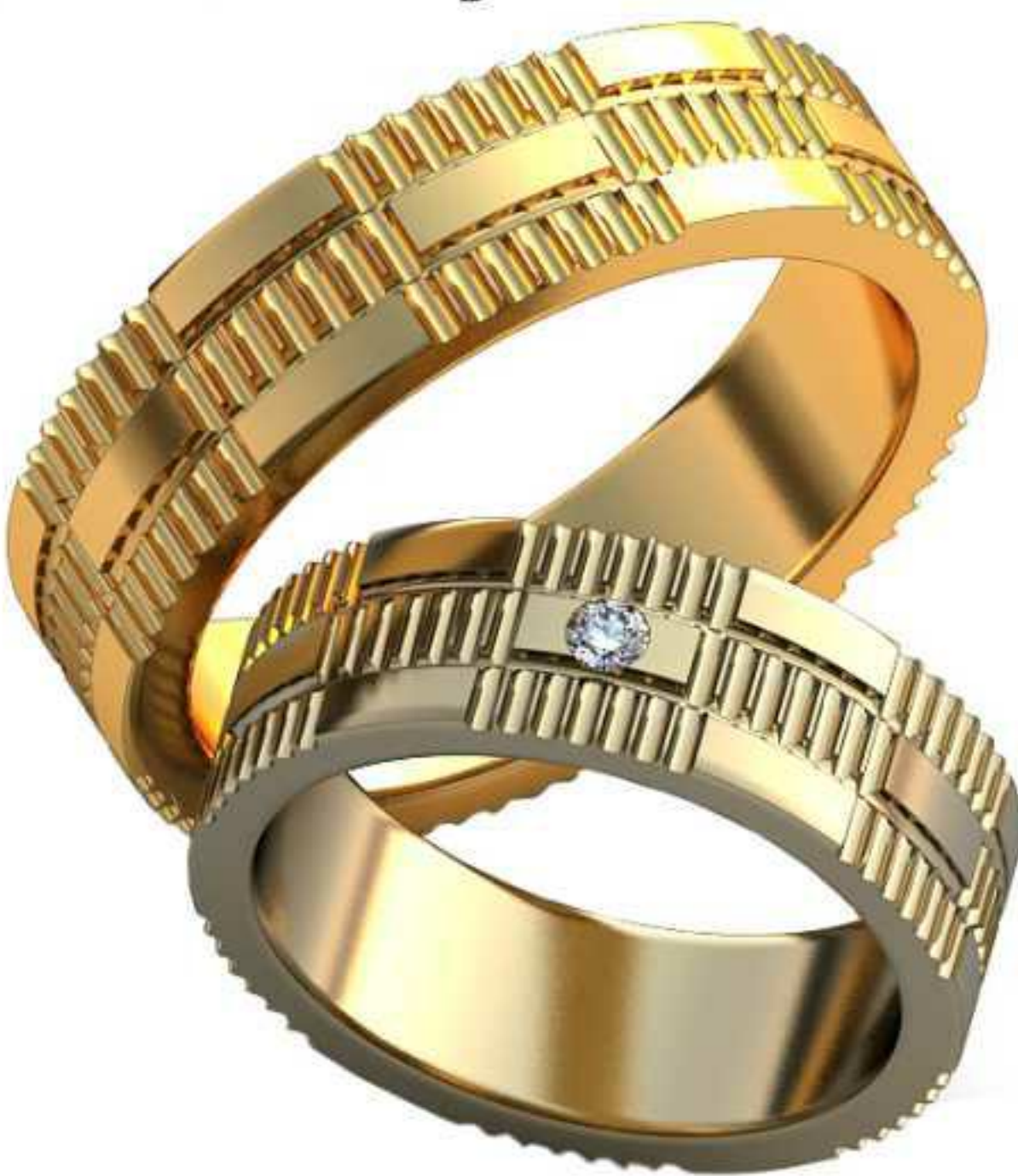
341ж/Р-16,0/Ш-6,0/Т-1,6/Кр 2.0-1шт./Вес-6,1 341м/Р-19,7/Ш-6,0/Т-2,0/Вес-9,2