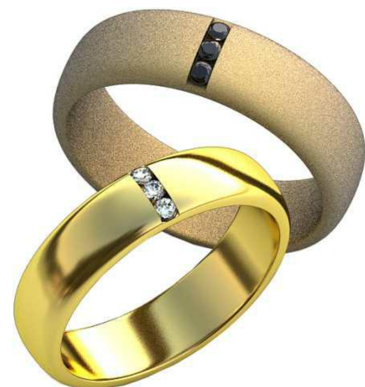
195ж/Р-18,7/Ш-6,1/Т-1,6/Кр 1.6-3шт./Вес-7,1 195м/Р-17,1/Ш-5,0/Т-1,5/Кр 1.6-3шт./Вес-5,2