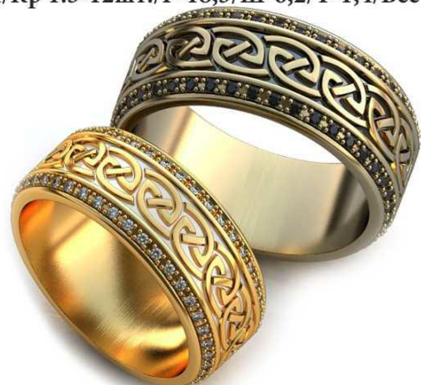
274ж/Р-18,0/Ш-8,1/Т-1,7/Кр 1.0-80шт./Вес-8,8 274м/Р-20,0/Ш-9,0/Т-1,8/Кр 1.0-80шт./Вес-12,0