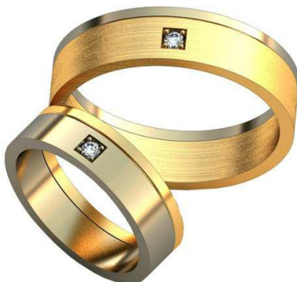
146ж/Р-16,0/Ш-5,1/Т-1,4/Кр 2.0-1шт./Вес-5,0 146м/Р-21,5/Ш-6,1/Т-1,5/Кр 2.0-1шт./Вес-7,9