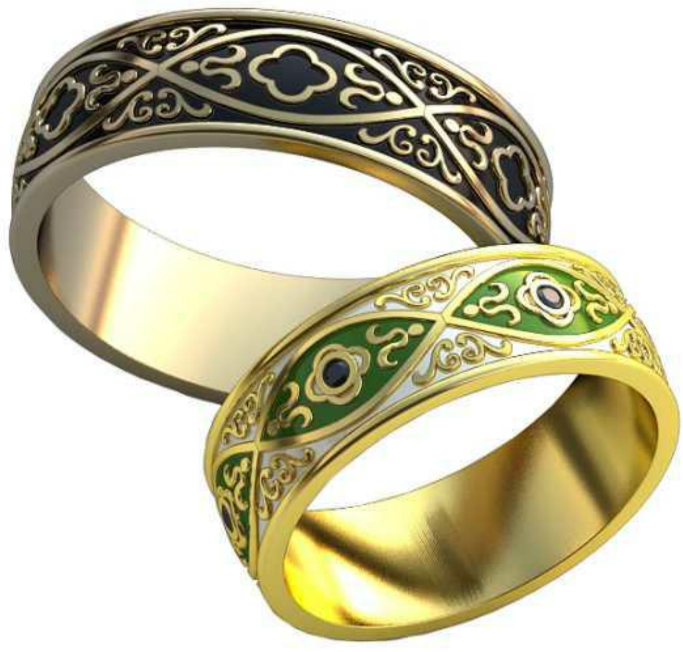
316ж/Р-20,7/Ш-7,6/Т-1,6/Кр 1.6-6шт./Вес-8,2 316м/Р-23,7/Ш-7,6/Т-1,7/Вес-11,0