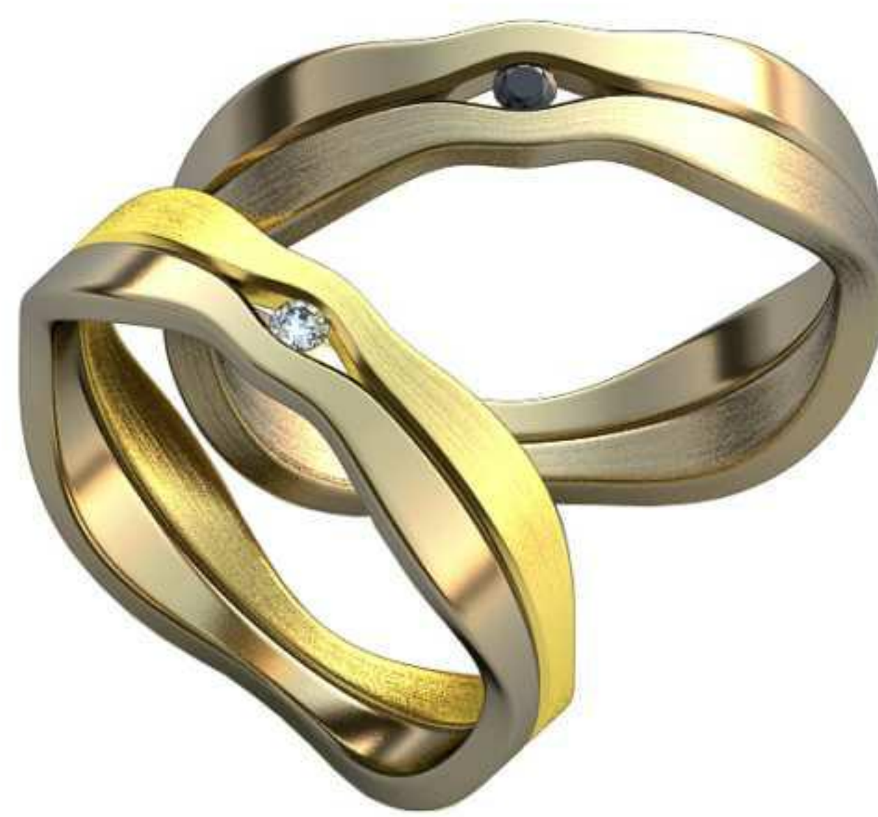
434ж/Р-18,5/Ш-5,5/Т-1,5/Кр 2.0-1шт./Вес-5,0 434м/Р-20/Ш-6/Т-1,5/Кр 2.0-1шт./Вес-6,3