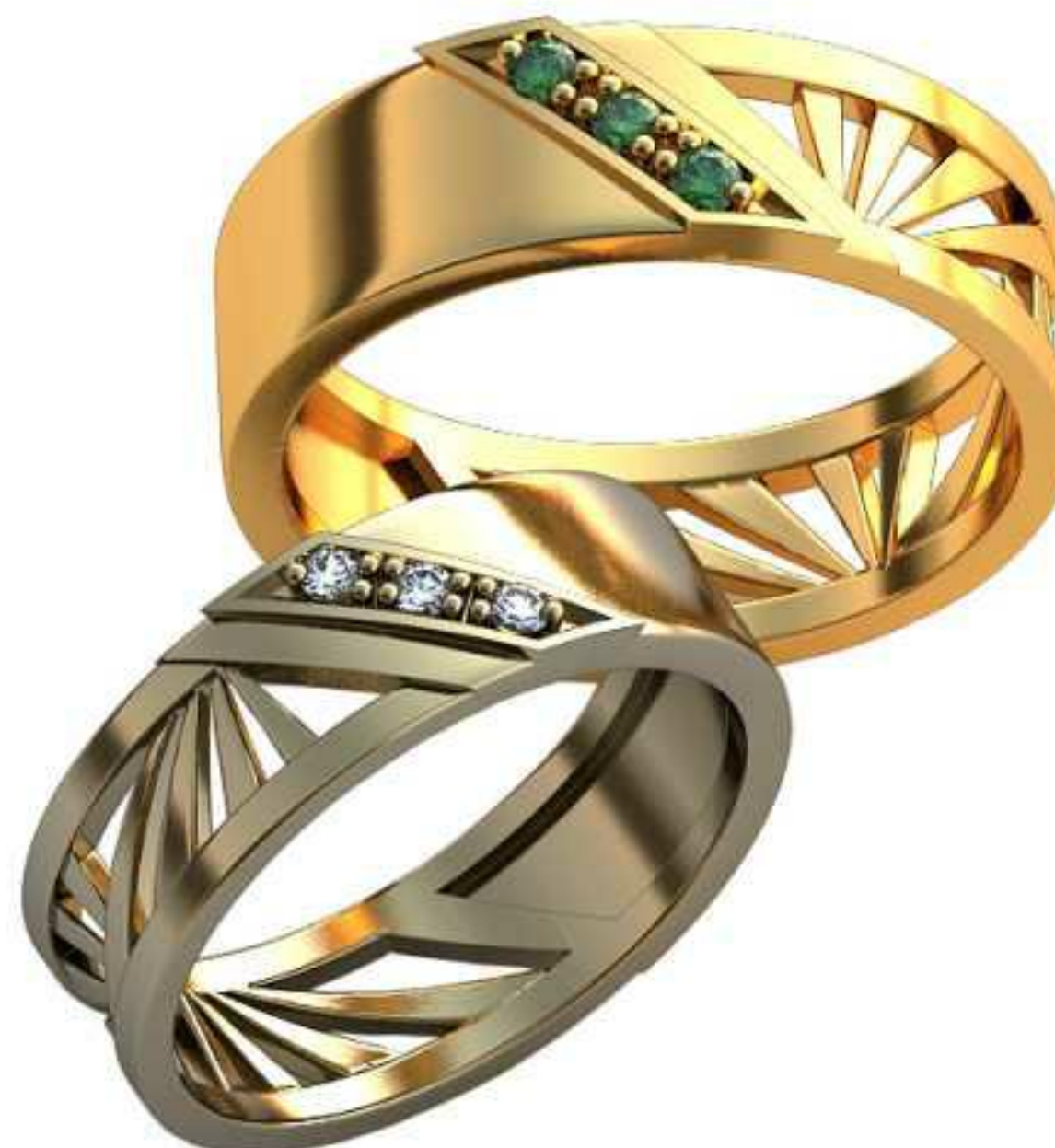
365ж/Р-17,2/Ш-6,0/Т-1,3/Кр 1,7-3шт./Вес-4,4 365м/Р-19,2/Ш-6,6/Т-1,4/Кр 1,9-3шт./Вес-6,0