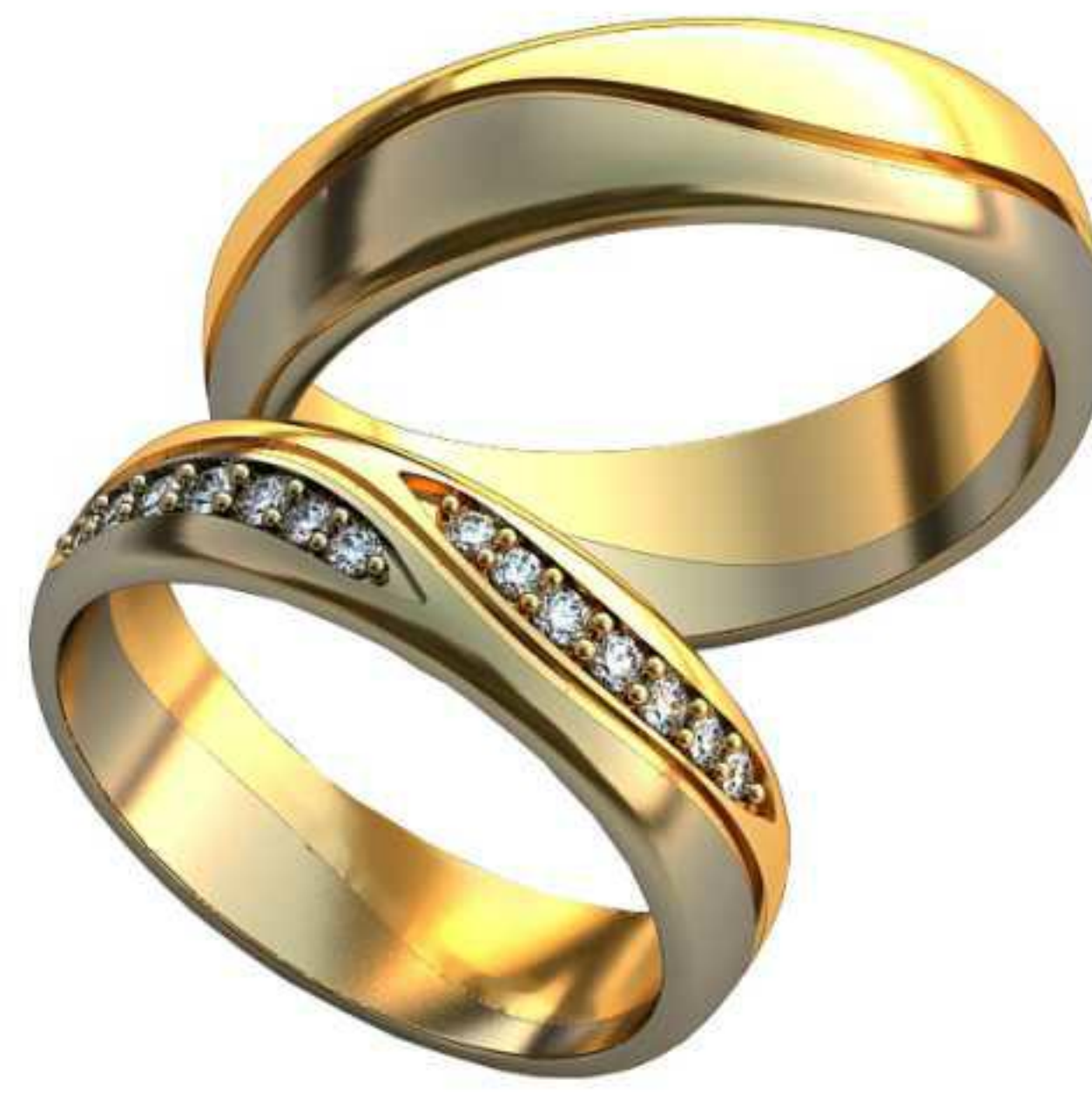
188ж/Р-17,5/Ш-5,1/Т-1,4/Кр 1.3-5,1.4-3,1.5-3,1.6-3/Вес-4,3 188м/Р-19,5/Ш-5,7/Т-1,5/Вес-6,4