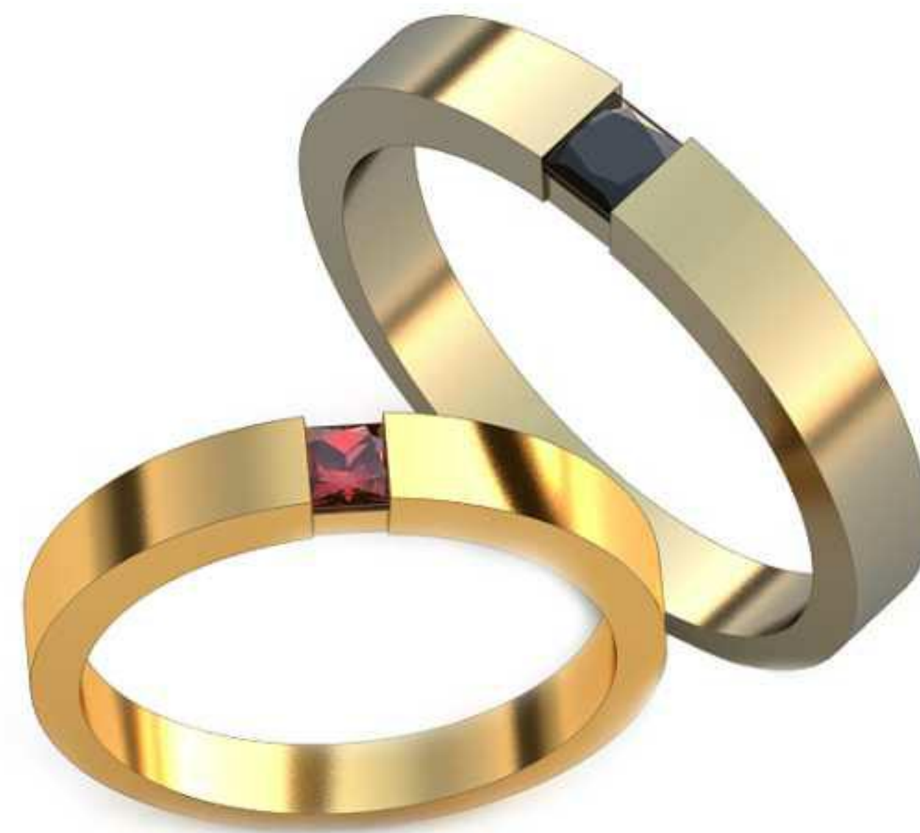
134ж/Р-17,0/Ш-3,2/Т-2,1/Кр 3.0-1шт./Вес-3,4 134м/Р-20,0/Ш-3,7/Т-2,5/Кр 3.5-1шт./Вес-5,6