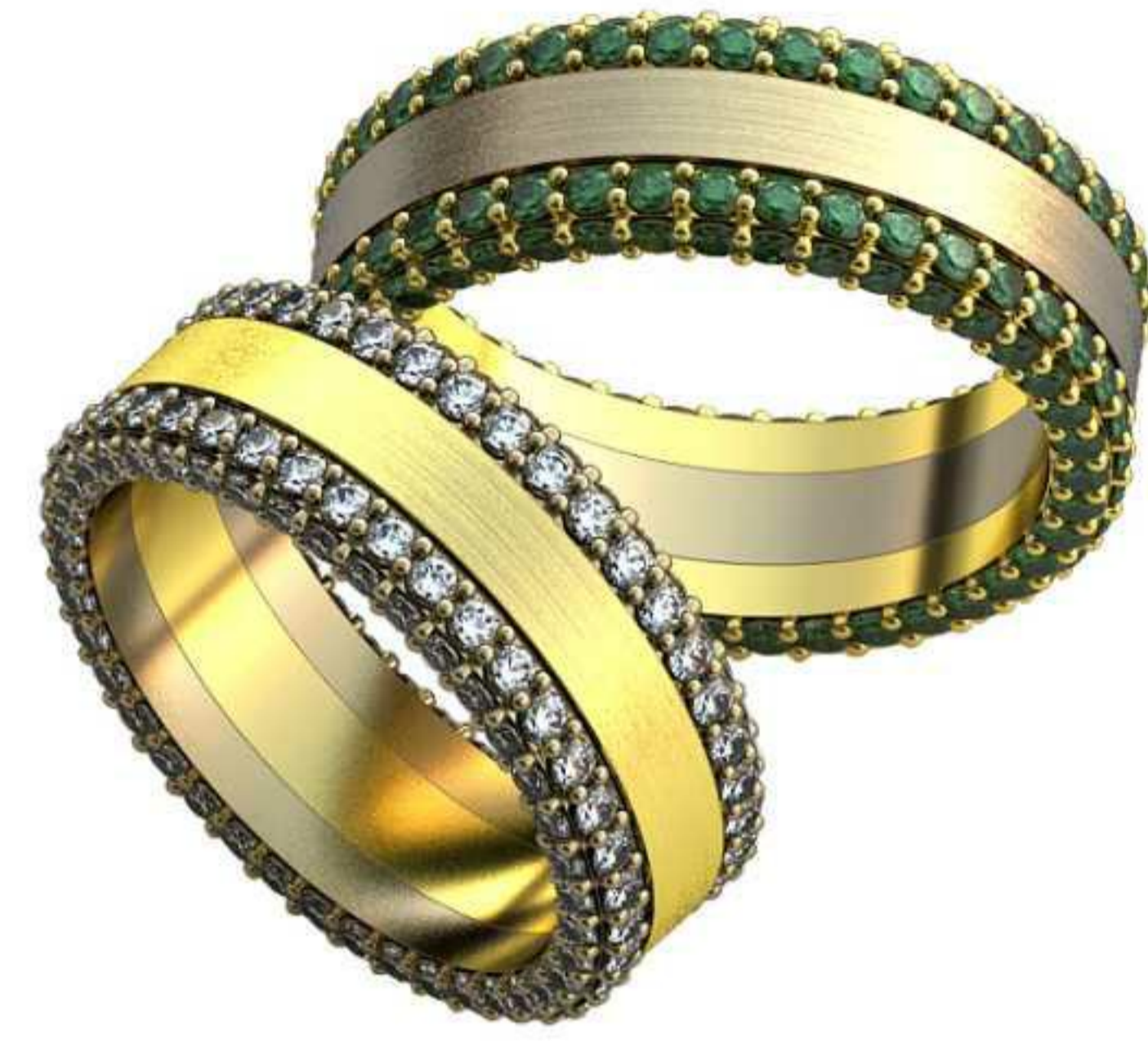
174ж/Р-15,7/Ш-7,0/Т-2,3/Кр 1.4-60шт./Вес-7,2 174м/Р-17,7/Ш-7,0/Т-2,0/Кр 1.4-60шт./Вес-8,3