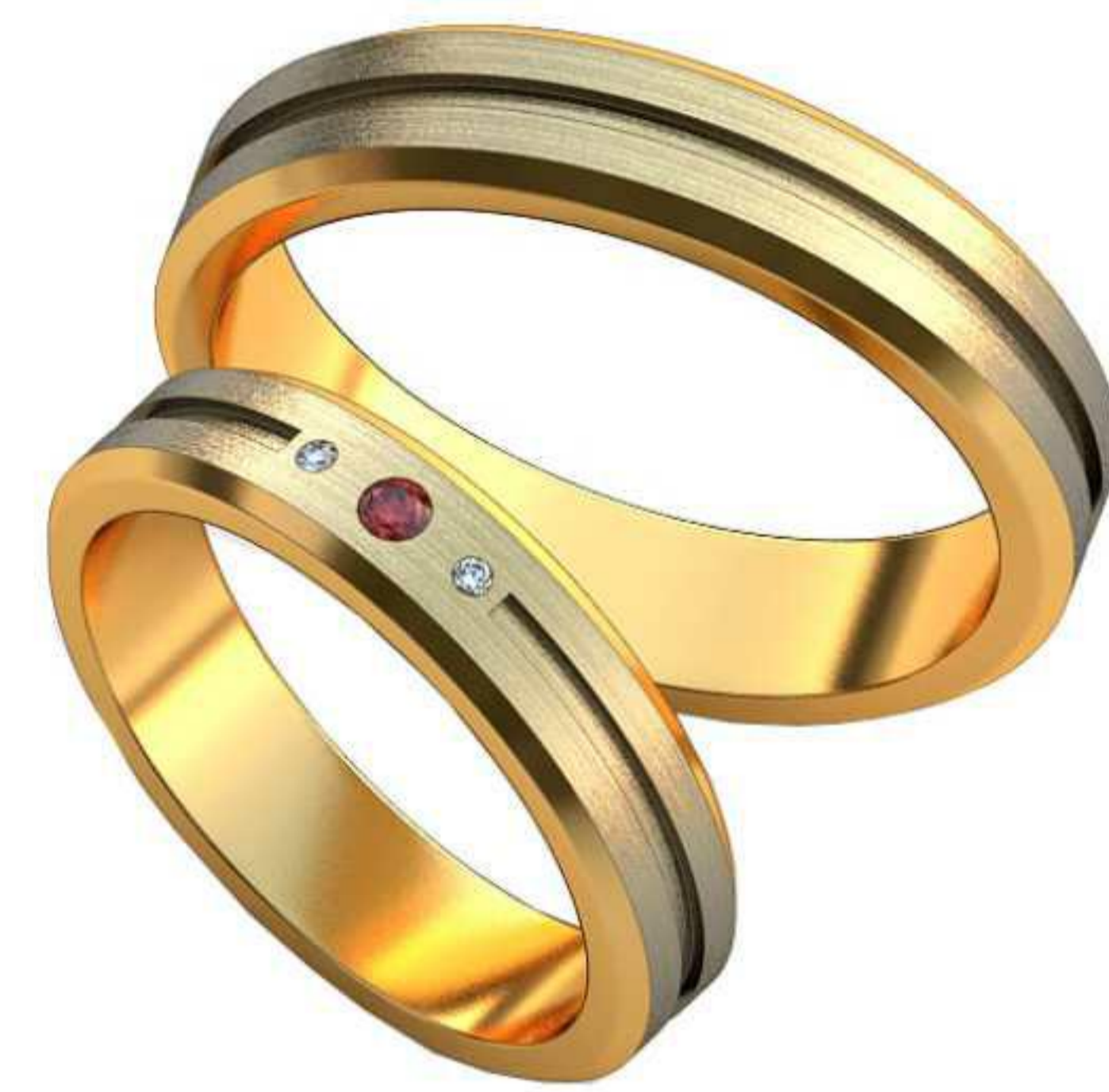
444ж/Р-15,7/Ш-4/Т-1,5/Кр 1.7 -1шт.,1-2шт./Вес-4,7 444м/Р-19/Ш-4,5/Т-1,6/Вес-5,9