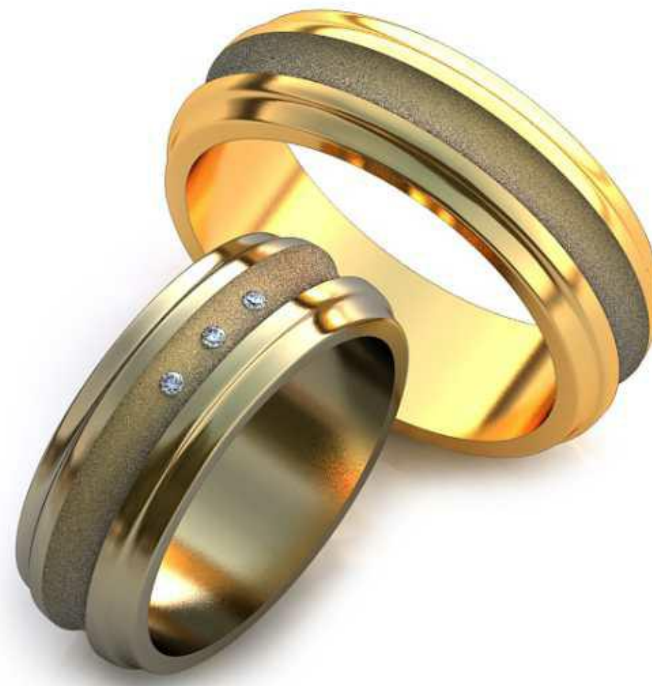
65ж/Р-15,7/Ш-6,4/Т-1,6/Кр 1.0-3шт./Вес-5,7 65м/Р-18,0/Ш-6,4/Т-1,8/Вес-7,3