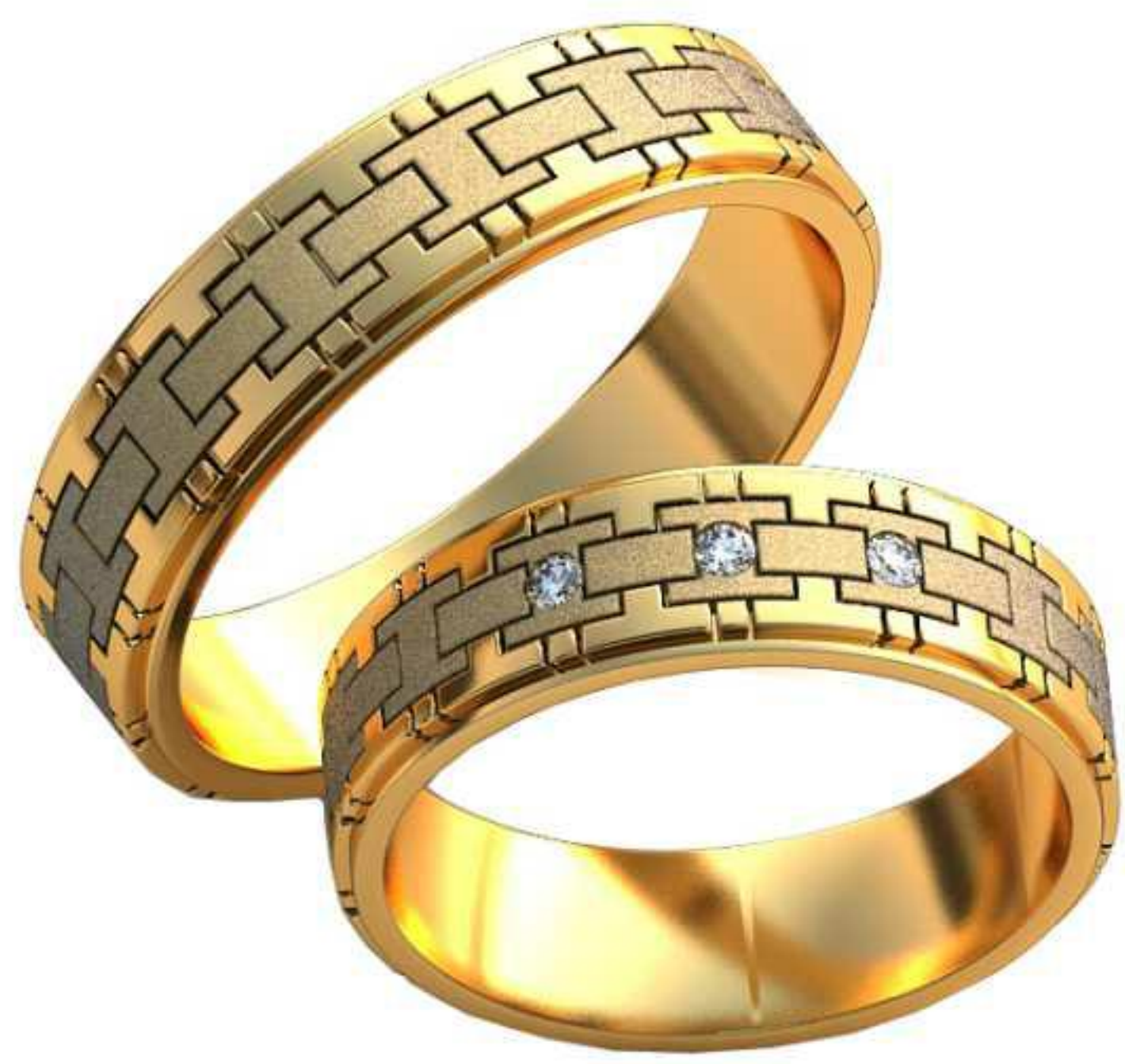
451ж/Р-21,5/Ш-7/Т-1,6/Кр 2.0-3шт./Вес-9,9 451м/Р-25/Ш-7/Т-1,8/Вес-13