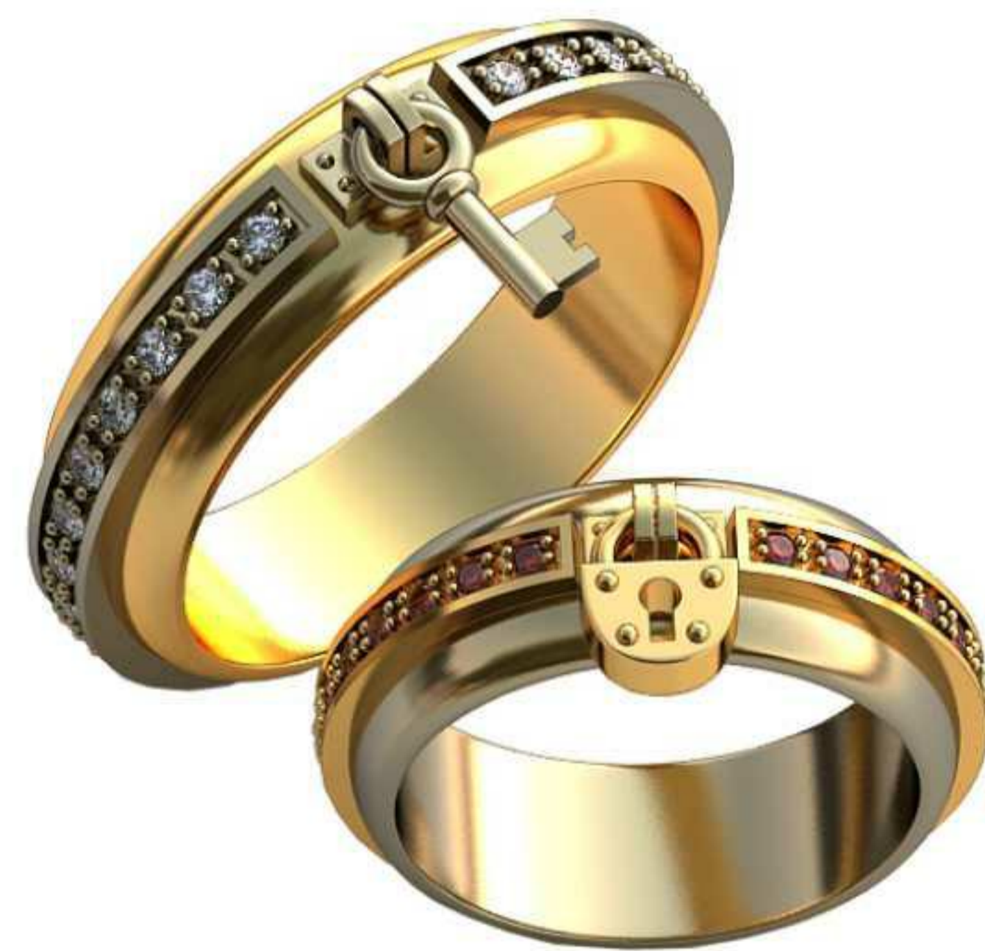
507ж/Р-16/Ш-6,4/Т-2,1/Кр 1.3-29шт./Вес-7,5 507м/Р-20/Ш-6,3/Т-2,3/Кр 1.5-29шт./Вес-10