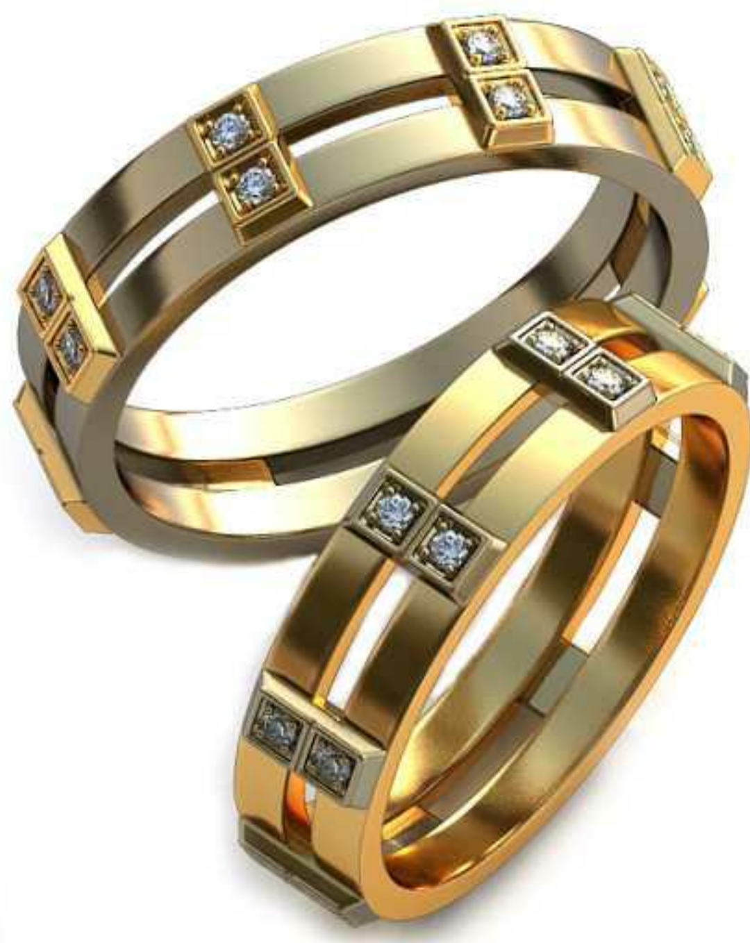
104ж/Р-17,5/Ш-5,0/Т-1,2/Кр 1.3-16шт./Вес-4,3 104м/Р-18,7/Ш-5,0/Т-1,3/Кр 1.3-16шт./Вес-5