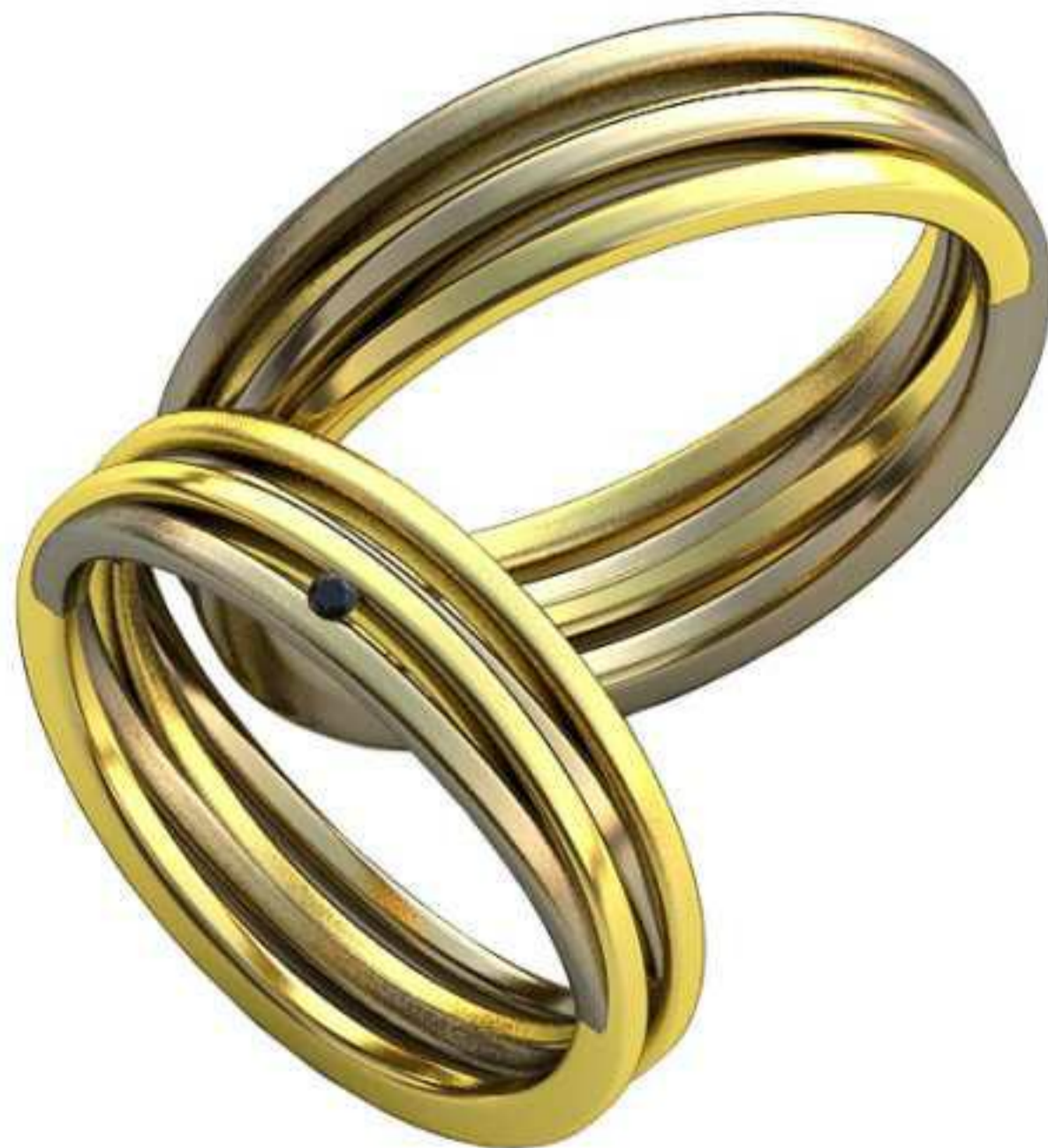
359ж/Р-17,7/Ш-5,0/Т-1,7/Кр 1.3-1шт./Вес-5,2 359м/Р-20,2/Ш-5,7/Т-1,9/Вес-7,6