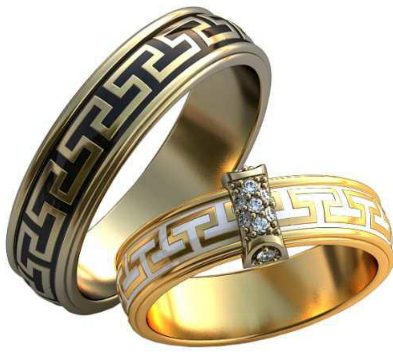
302ж/Р-18,7/Ш-5,8/Т-1,7/Кр 1.4-9шт./Вес 7,3 302м/Р-22,2/Ш-6,6/Т-2,0/Вес-10,5