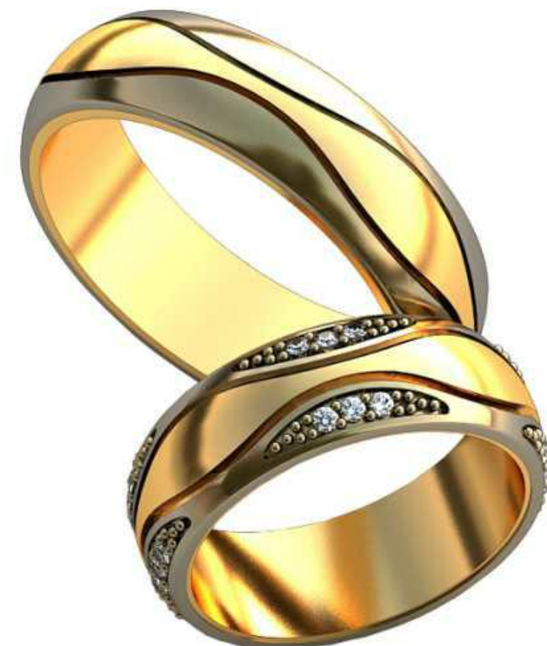
189ж/Р-16,0/Ш-6,1/Т-1,6/Кр 1.4-24шт./Вес-3,8 189м/Р-19,5/Ш-6,0/Т-2,0/Вес-8,9