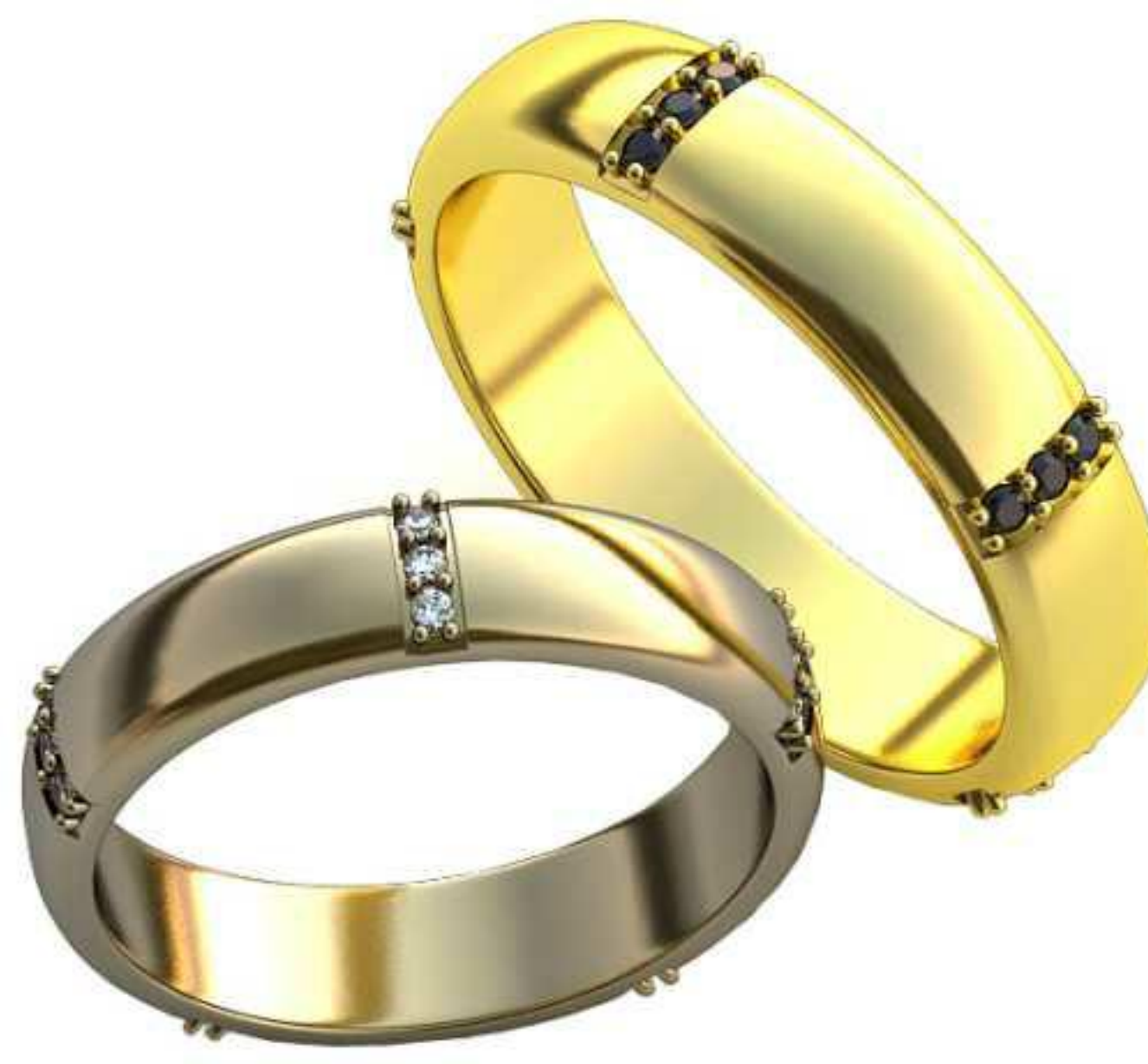
185ж/Р-19,2/Ш-5,0/Т-1,7/Кр 1.2-15шт./Вес-6,4 185м/Р-21,7/Ш-5,6/Т-2,0/Кр 1.2-15шт./Вес-9,1