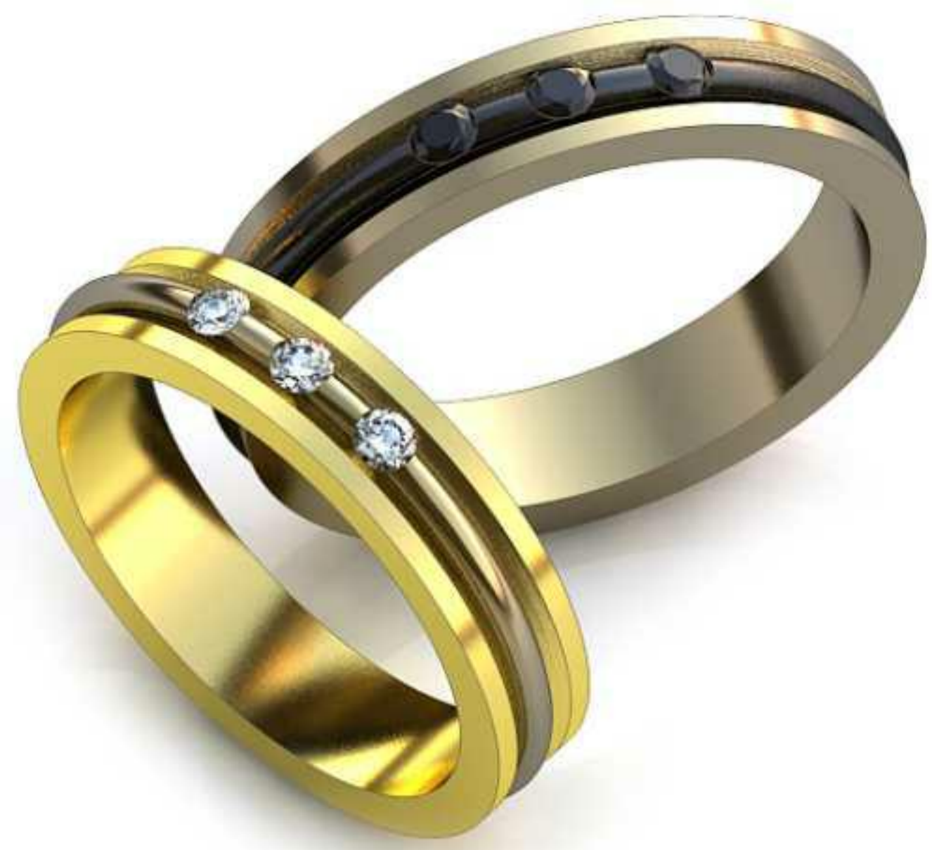
16ж/Р17,0/Ш-4,2/Т-2,1/Кр 2.0-3шт./Вес-5,5 16м/Р-19,0/Ш-4,2/Т-2,4/Кр 2.27-3шт./Вес-6,7