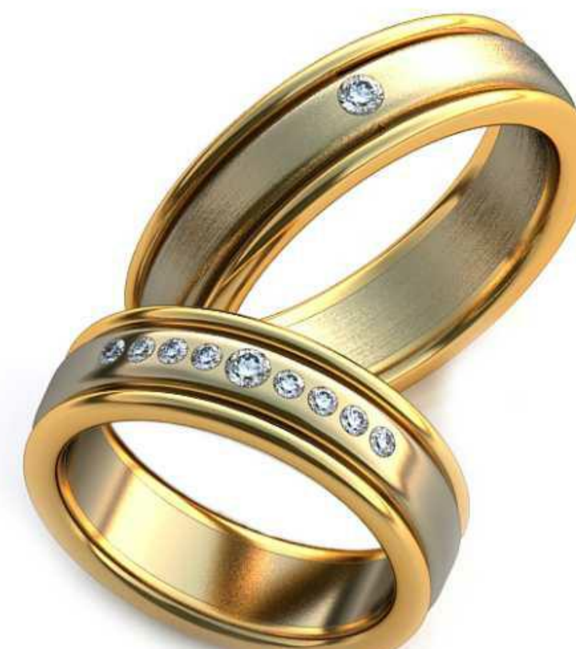
30ж/Р-16,0/Ш-5,9/Т-1,8/Кр 2.0-1шт.,1.5-8шт./Вес-7,0 30м/Р-17,9/Ш-5,9/Т-2,1/Кр 2.0-1шт./Вес-8,9