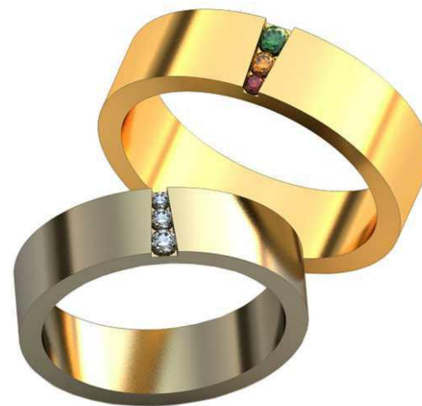
409ж/Р-21/Ш-6,7/Т-1,6/Вес-8,2 410ж/Р-20,7/Ш-6,7/Т-1,8/Кр 1.7-24шт./Вес-7,6 411ж/Р-15,5/Ш-4,8/Т-1,4/Кр 1.2-1шт., 1.5-1шт., 1.8-1шт./Вес-4,7 409м/Р-23,5/Ш-7,5/Т-1,8/Вес-11,4 410м/Р-23,2/Ш-7,5/Т-2/Кр 2.0-24шт./Вес-10,6 411м/Р-17,2/Ш-5,3/Т-1,6/Кр 1.3-1шт., 1.5-1шт., 2.0-1шт./Вес-6,5