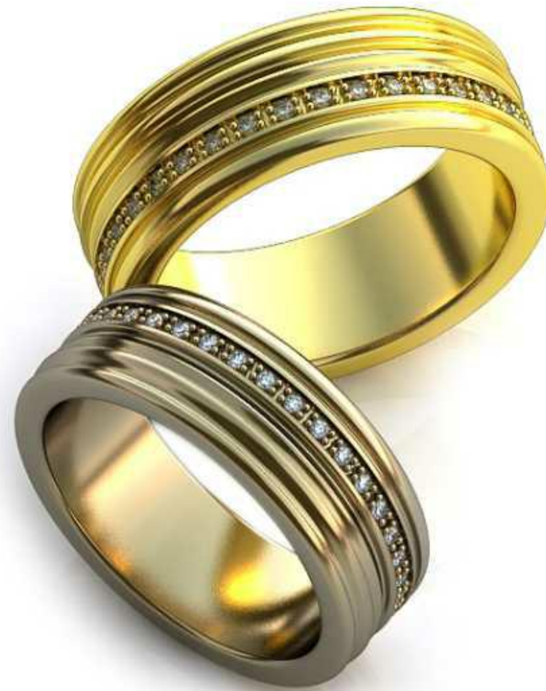
50ж/Р-18,2/Ш-7,3/Т-2,1/Кр 1.0-36шт./Вес-11,2 50м/Р-17/Ш-6,8/Т-2,0/Кр 1.0-36шт./Вес-9