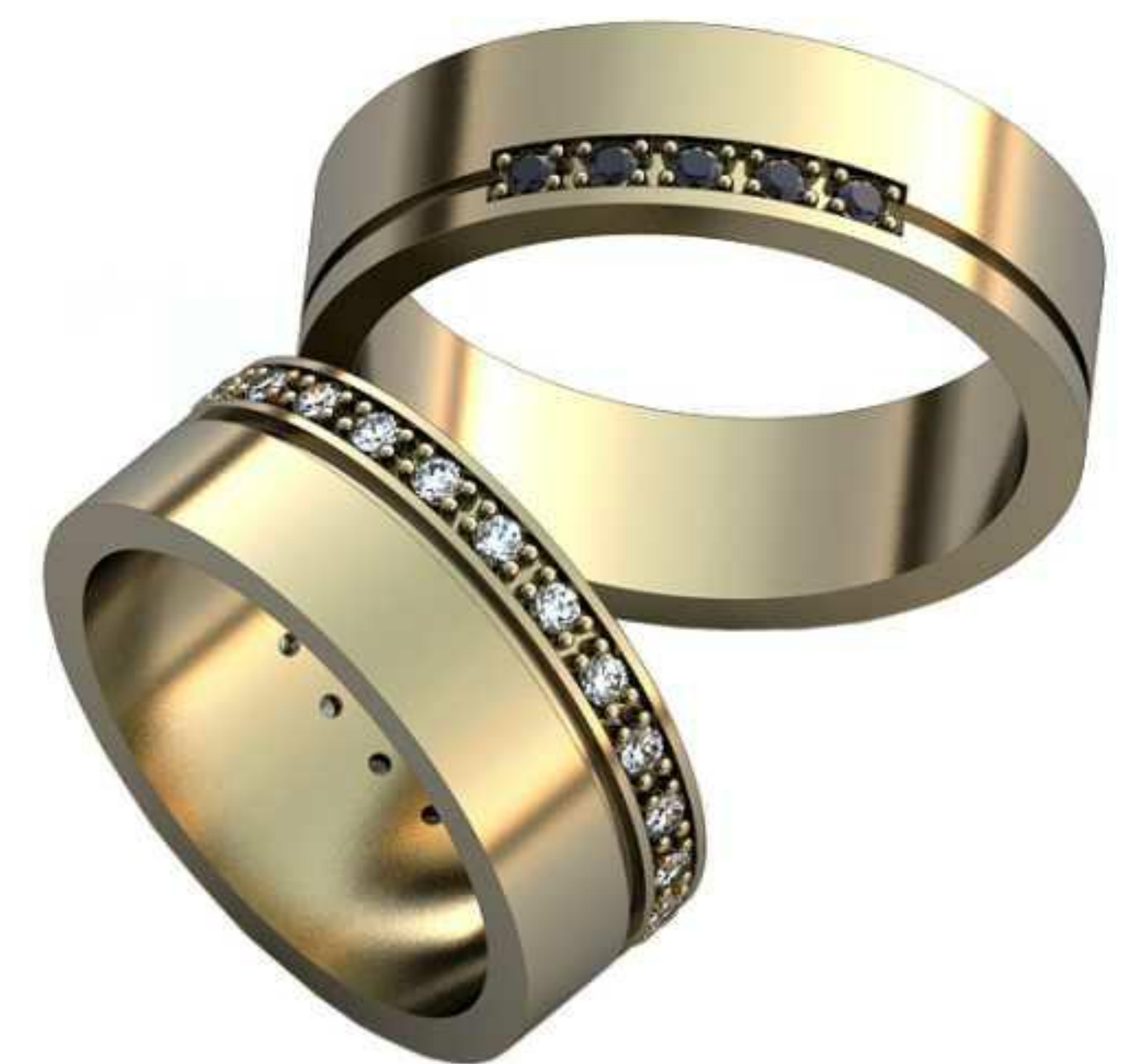
153ж/Р-16,2/Ш-7,0/Т-1,5/Кр 1.5-24шт./Вес-7,1 153м/Р-19,0/Ш-6,0/Т-1,6/Кр 1.5-5шт./Вес-7,9