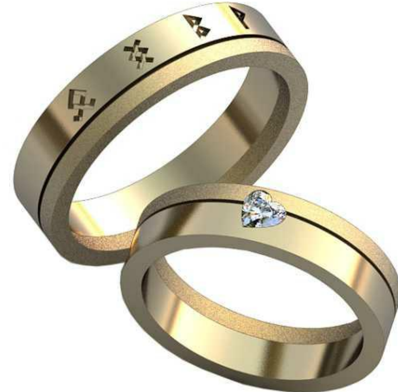
501ж/Р-17,5/Ш-4,8/Т-1,6/Серд. 2.6x3.25-1шт./Вес-6,0 501м/Р-20/Ш-5,2/Т-1,6/Вес-7,37