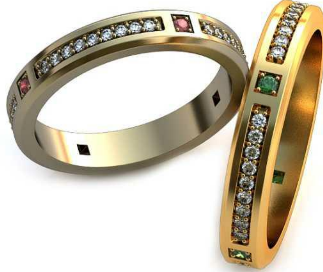
80ж/Р-17,0/Ш-3,4/Т-1,6/Кр 1.5-4шт.,1.1-36шт./Вес-3,8 80м/Р-18,7/Ш-7,7/Т-1,8/Кр 1.5-4шт.,1.1-36шт./Вес-5,1