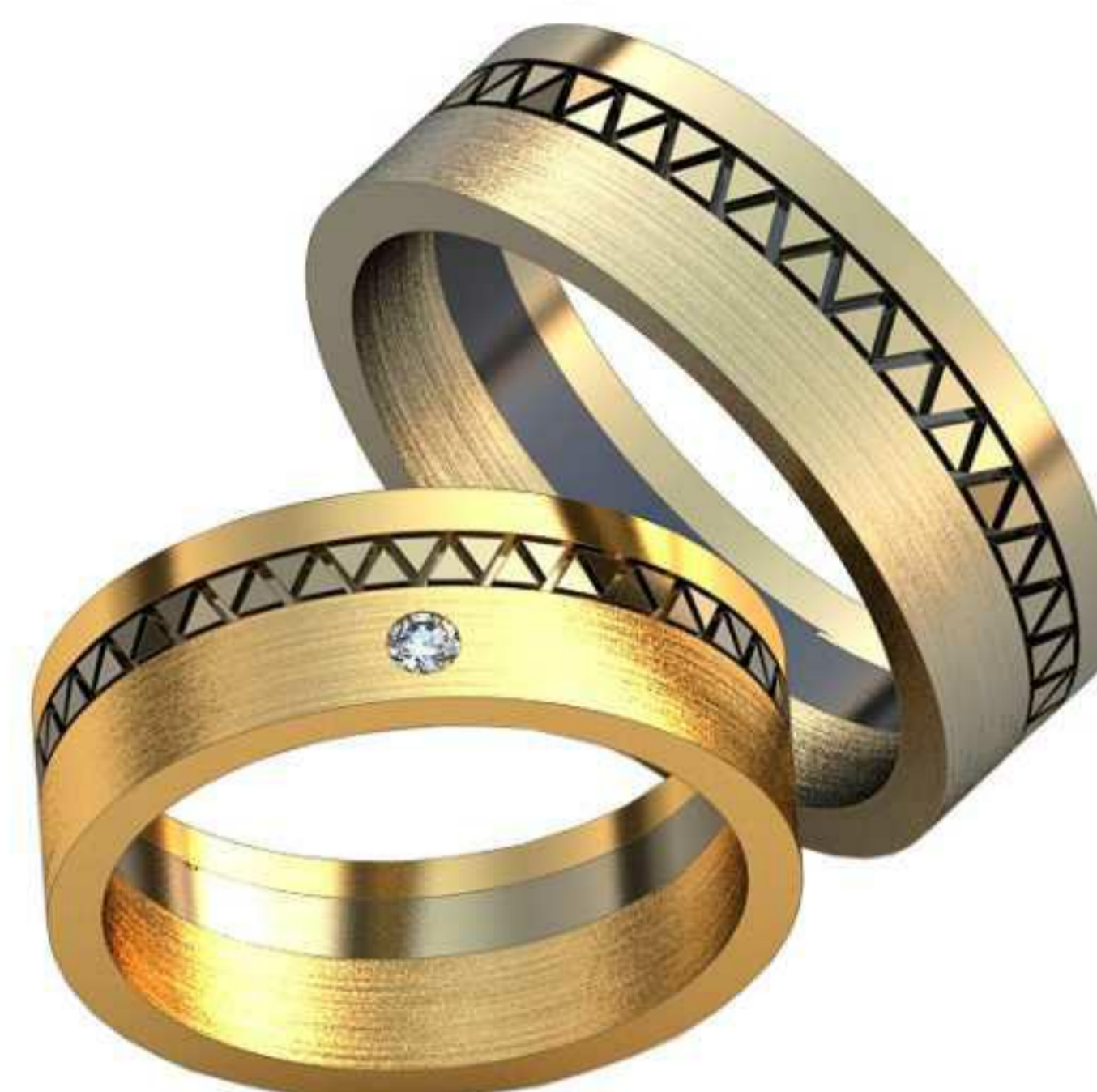
412ж/Р-16,5/Ш-2,5/Т-1,4/Кр 1.6-9шт./Вес-2,2 413ж/Р-16,2/Ш-5/Т-1,9/Кр 3.5-1шт./Вес-6,2 414ж/Р-18/Ш-6,9/Т-1,5/Кр 2.0-1шт./Вес-7,6 412м/Р-20/Ш-3/Т-1,6/Кр 1.8-9шт./Вес-3,4 413м/Р-20,2/Ш-4/Т-1,3/Вес-4,0 414м/Р-20,5/Ш-7/Т-1,7/Вес-10,0