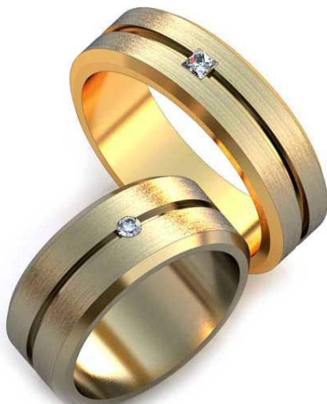
43ж/Р-20,0/Ш-6,7/Т-1,8/Кр 2.15-1шт./Вес-9,9 43м/Р-17,0/Ш-8,0/Т-1,6/Пр 1.85x1.85-1шт./Вес-9,0