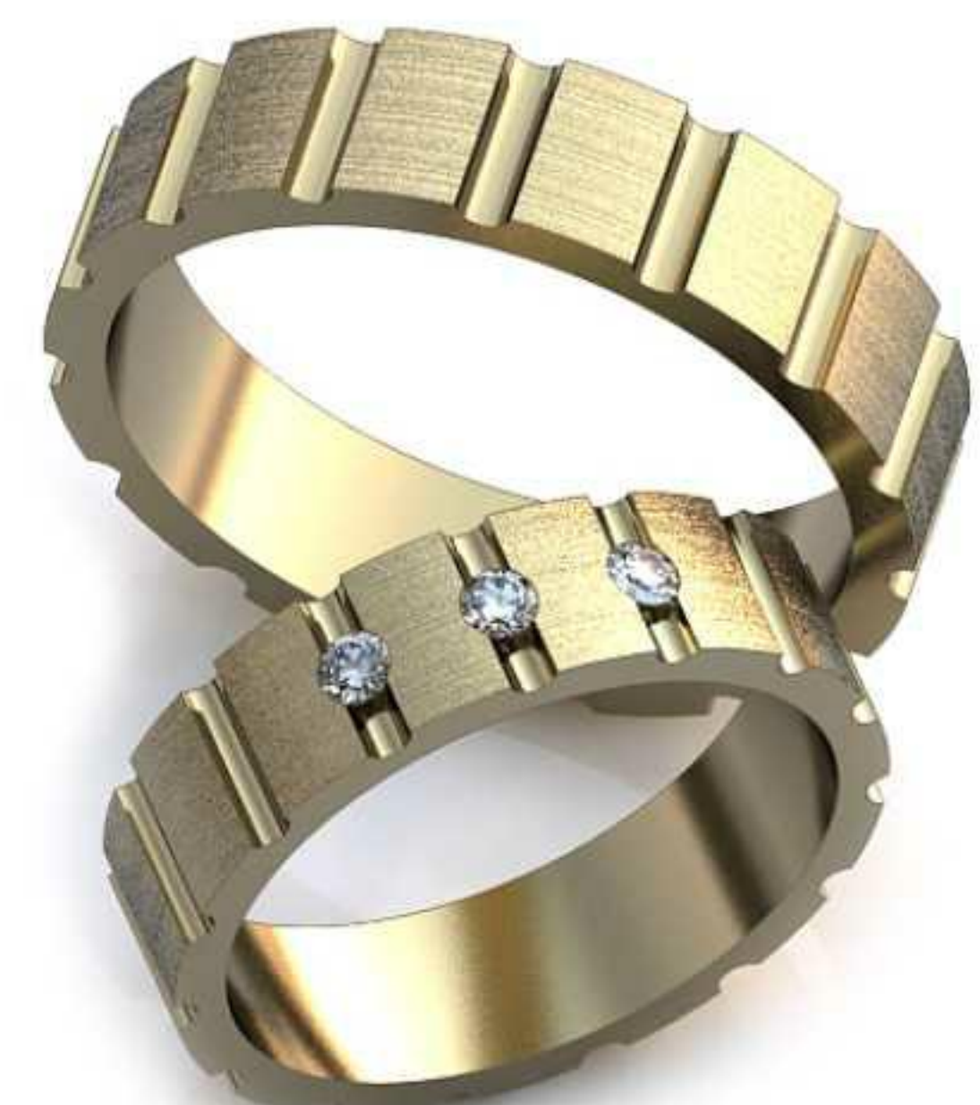
12ж/Р-17,0/Ш-5,0/Т-1,4/Кр 2.0-3-шт./Вес-5,1 12м/Р-20,0/Ш-5,0/Т-1,6/Вес-7,2