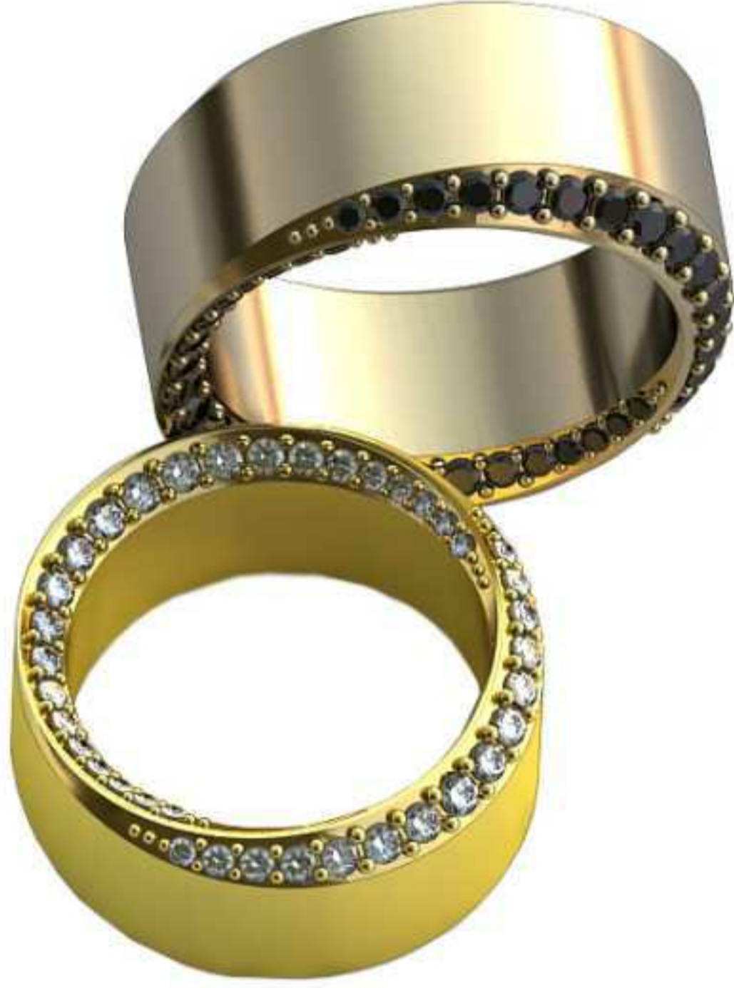
139ж/Р-16,0/Ш-8,0/Т-2,0/Кр 1.0-10,1.1-3,1.2-4,1.3-3, 1.3-2,1.4-3,1.4-3,1.5-3,1.5-5,1.6-1.0-38шт./Вес-10,4 139м/Кр так же как в жен/Р-16,5/Ш-6,0/Т-2,0/Вес-6,9