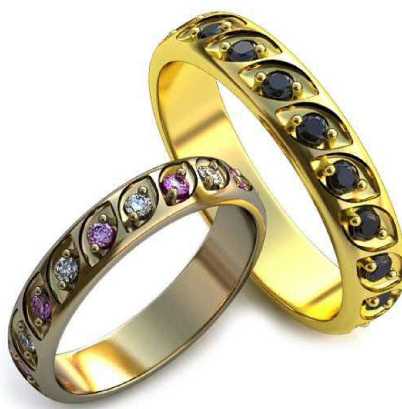
218ж/Р-16,7/Ш-4,0/Т-1,4/Кр 1.7-18шт./Вес-2,6 218м/Р-19,7/Ш-4,7/Т-1,6/Кр 1.7-18шт./Вес-4,3