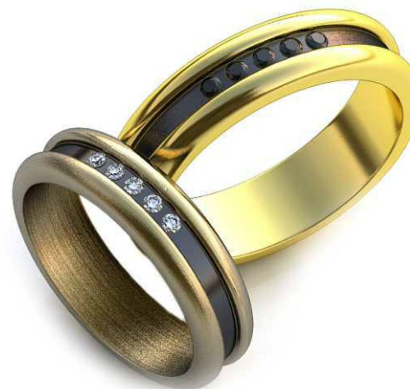
24ж/Р-16,7/Ш-5,0/Т-1,7/Кр 1.4-5шт./Вес-5,1 24м/Р-19,0/Ш-5,7/Т-1,9/Кр 1.4-5шт./Вес-7,5