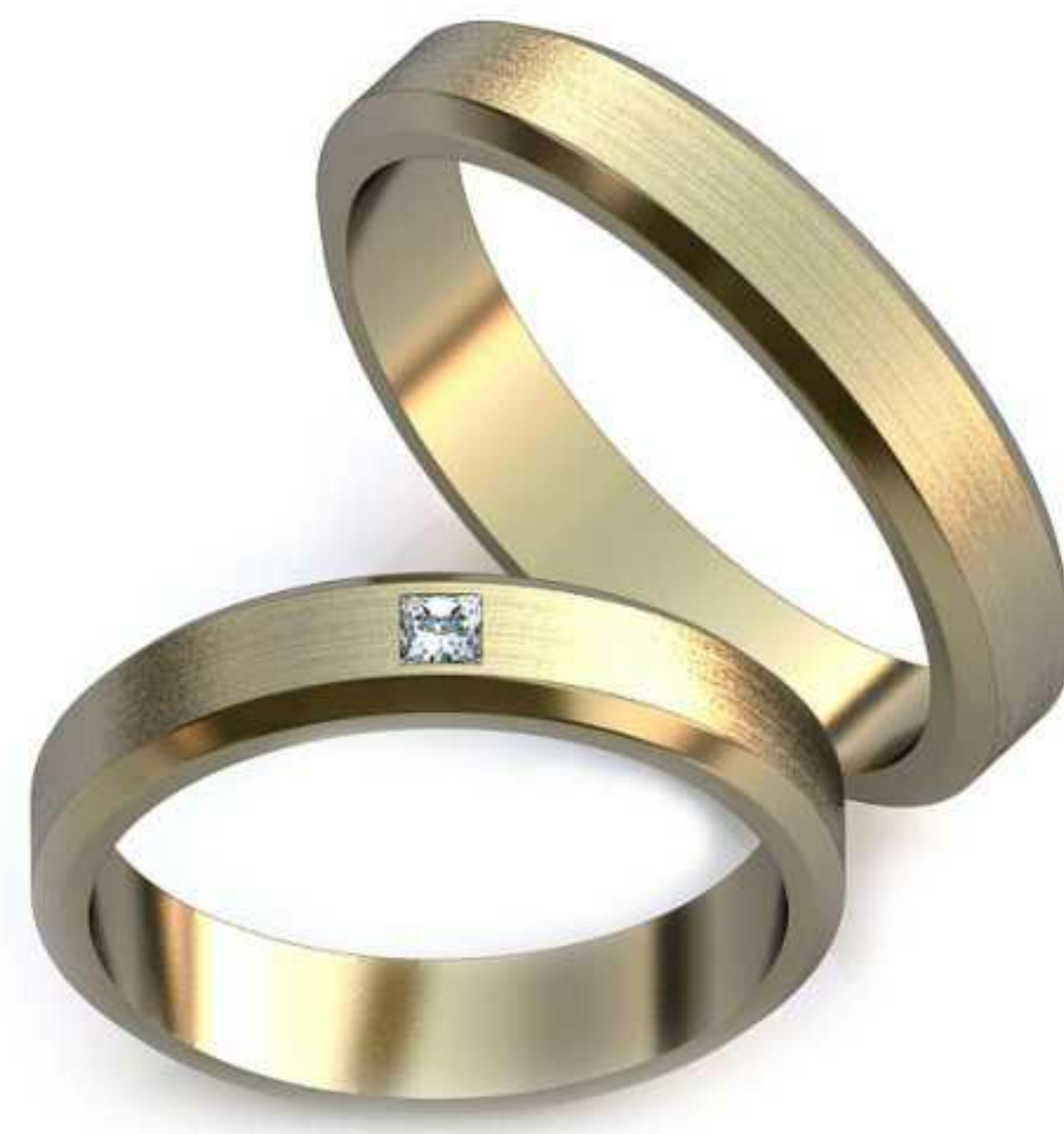
02ж/Р-17,0/Ш-4,0/Т-1,4/Пр 2.0x2.0-1шт./Вес-4,0 02м/Р-19,1/Ш-4,0/Т-1,5/Вес-5,1