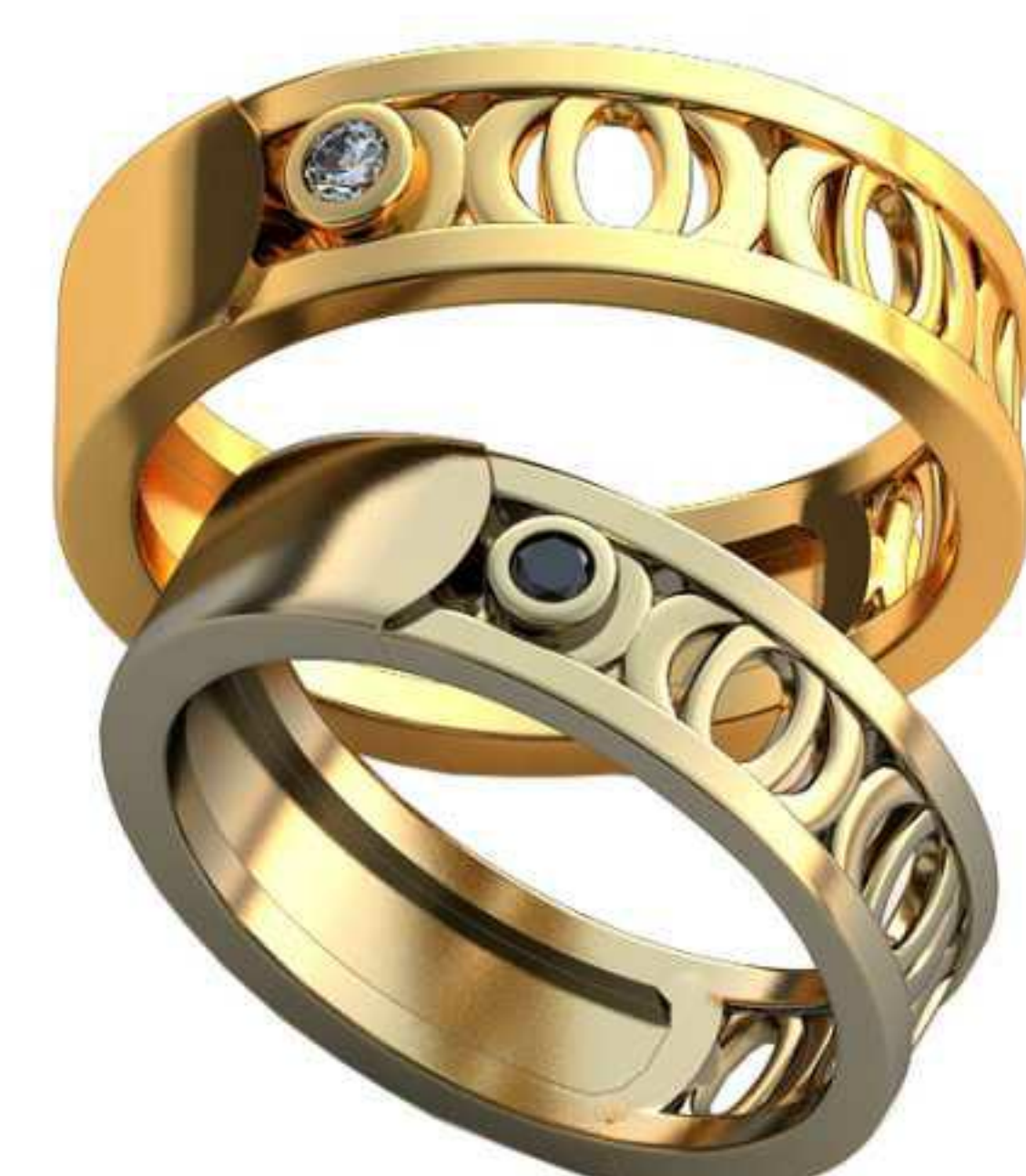
375ж/Р-17,5/Ш-5,7/Т-1,8/Кр 2,4-1шт./Вес-5,5 375м/Р-19,2/Ш-6,3/Т-2,0/Кр 2,6-1шт./Вес-7,2