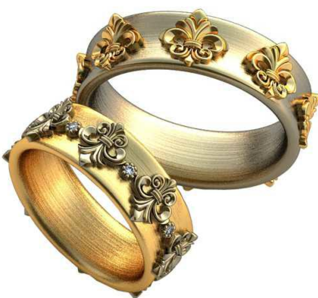
400ж/Р-17,5/Ш-7,0/Т-2,5/Кр 1.2-8шт./Вес-9,3 400м/Р-20,7/Ш-7,0/Т-3,0/Вес-12,7