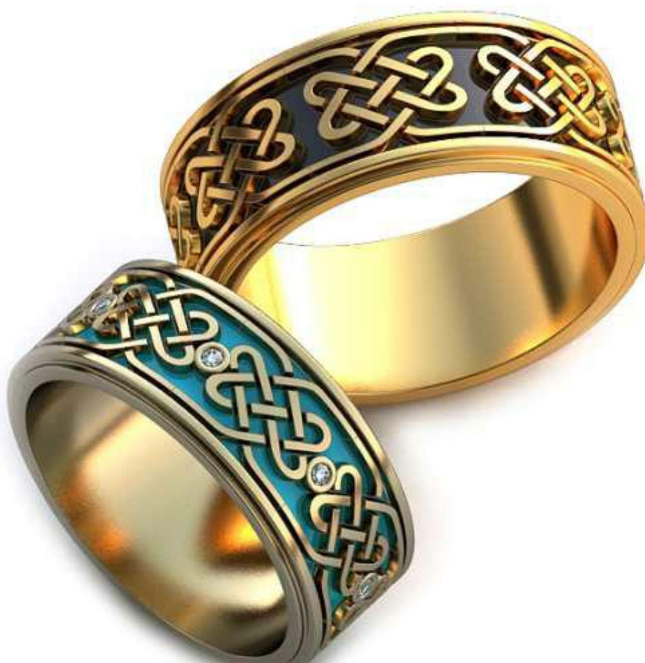
278ж/Р-17,5/Ш-8,0/Кр 1.1-8шт./Вес-1,6 278м/Р-19,5/Ш-8,8/Вес-1,7