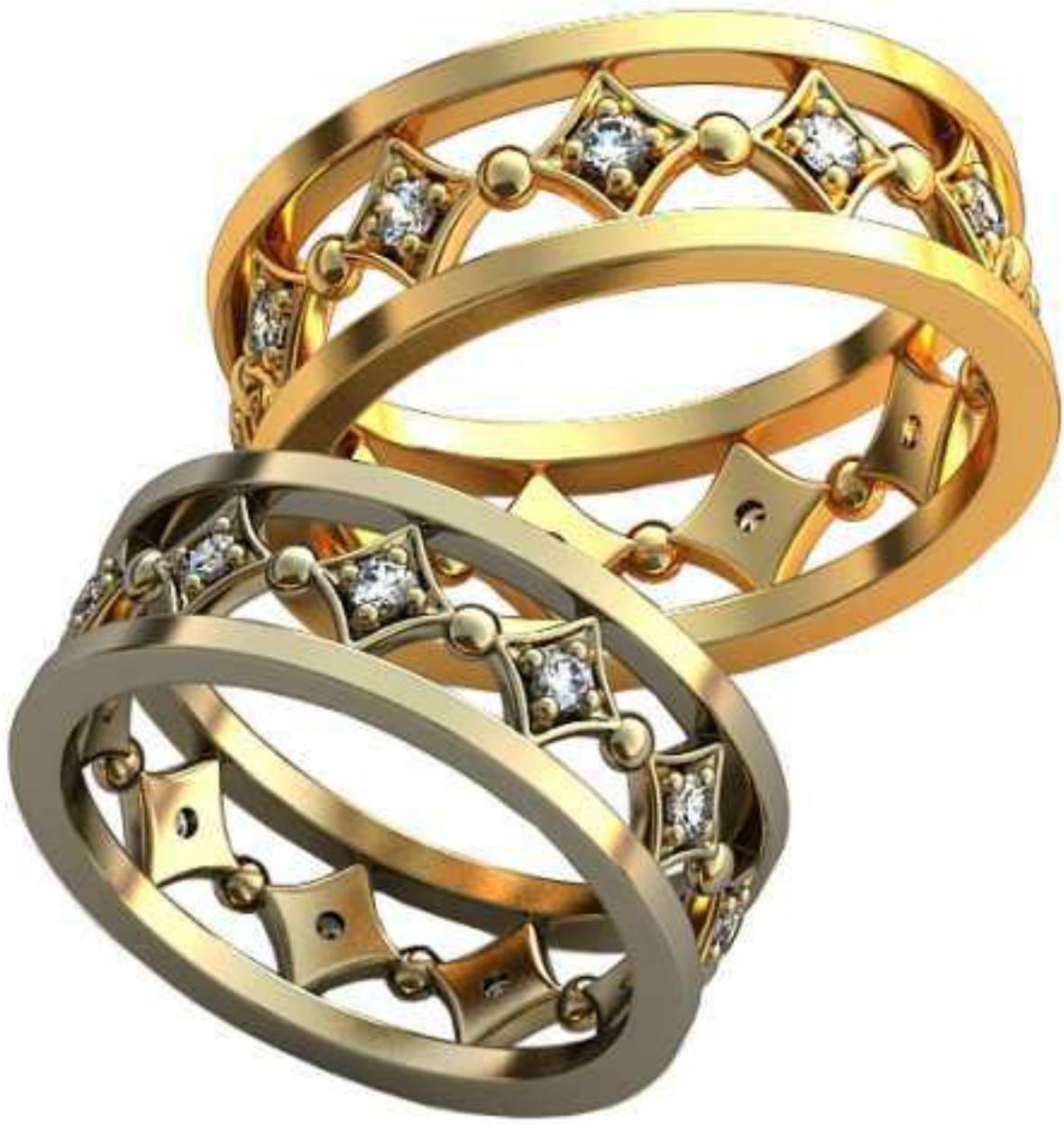
364ж/Р-18,0/Ш-7,5/Т-1,7/Кр 2,0-11шт./Вес-5,4 364м/Р-20,0/Ш-8,2/Т-1,9/Кр 2,0-11шт./Вес-7,4