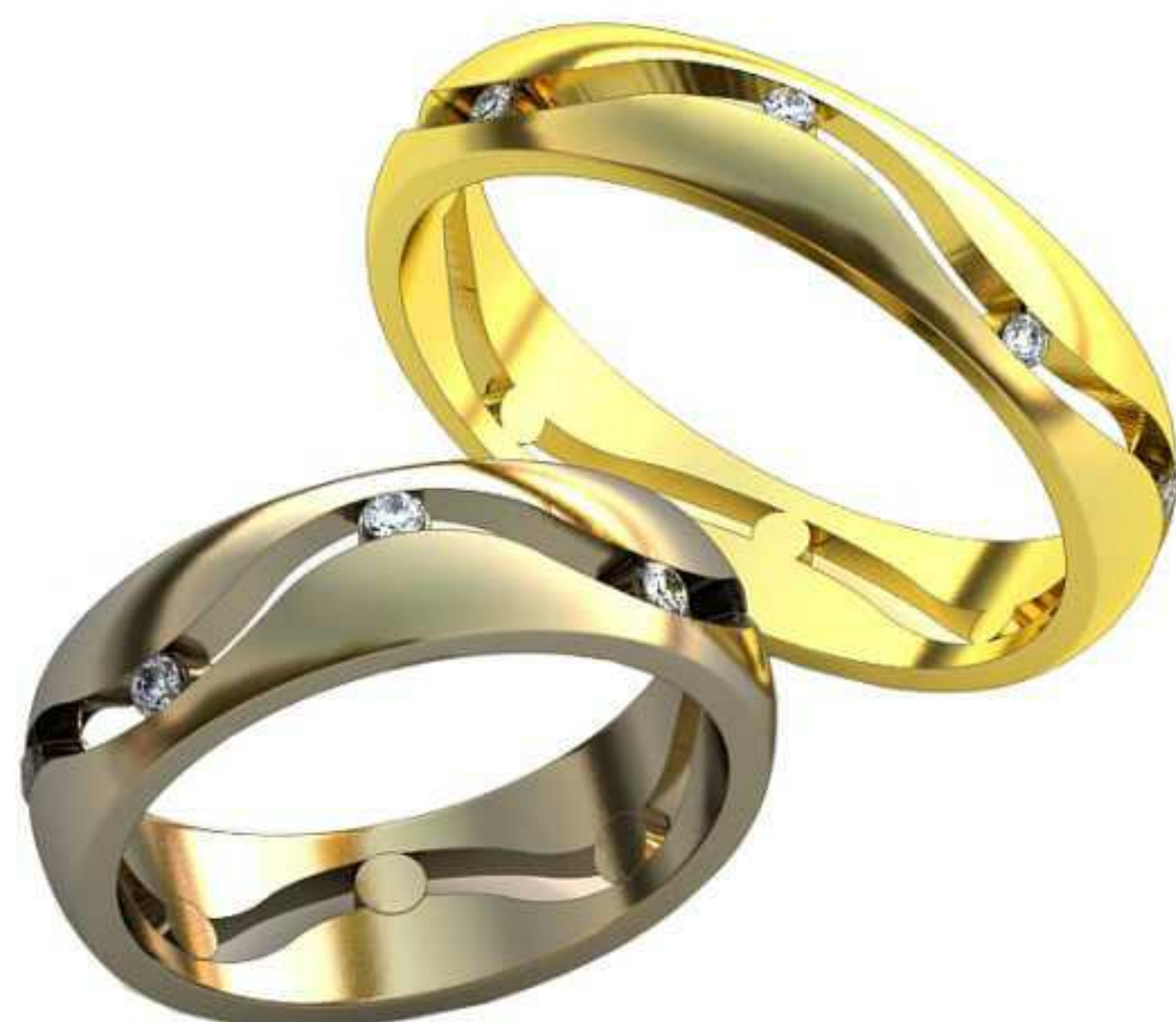
157ж/Р-16,5/Ш-5,5/Т-1,7/Кр 1.6-9шт./Вес-4,8 157м/Р-19,7/Ш-4,5/Т-1,6/Кр 1.4-8шт./Вес-4,2