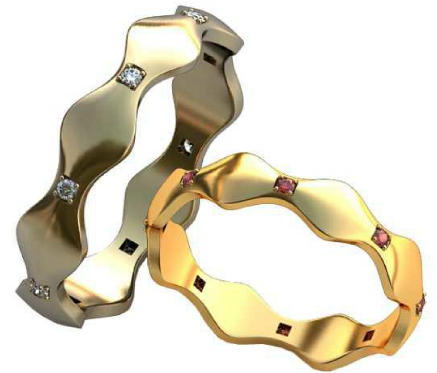
132ж/Р-18,5/Ш-4,6/Т-1,4/Кр 1.3-8шт./Вес-3,1 132м/Р-21,7/Ш-5,4/Т-1,6/Кр 1.3-8шт./Вес-5,1