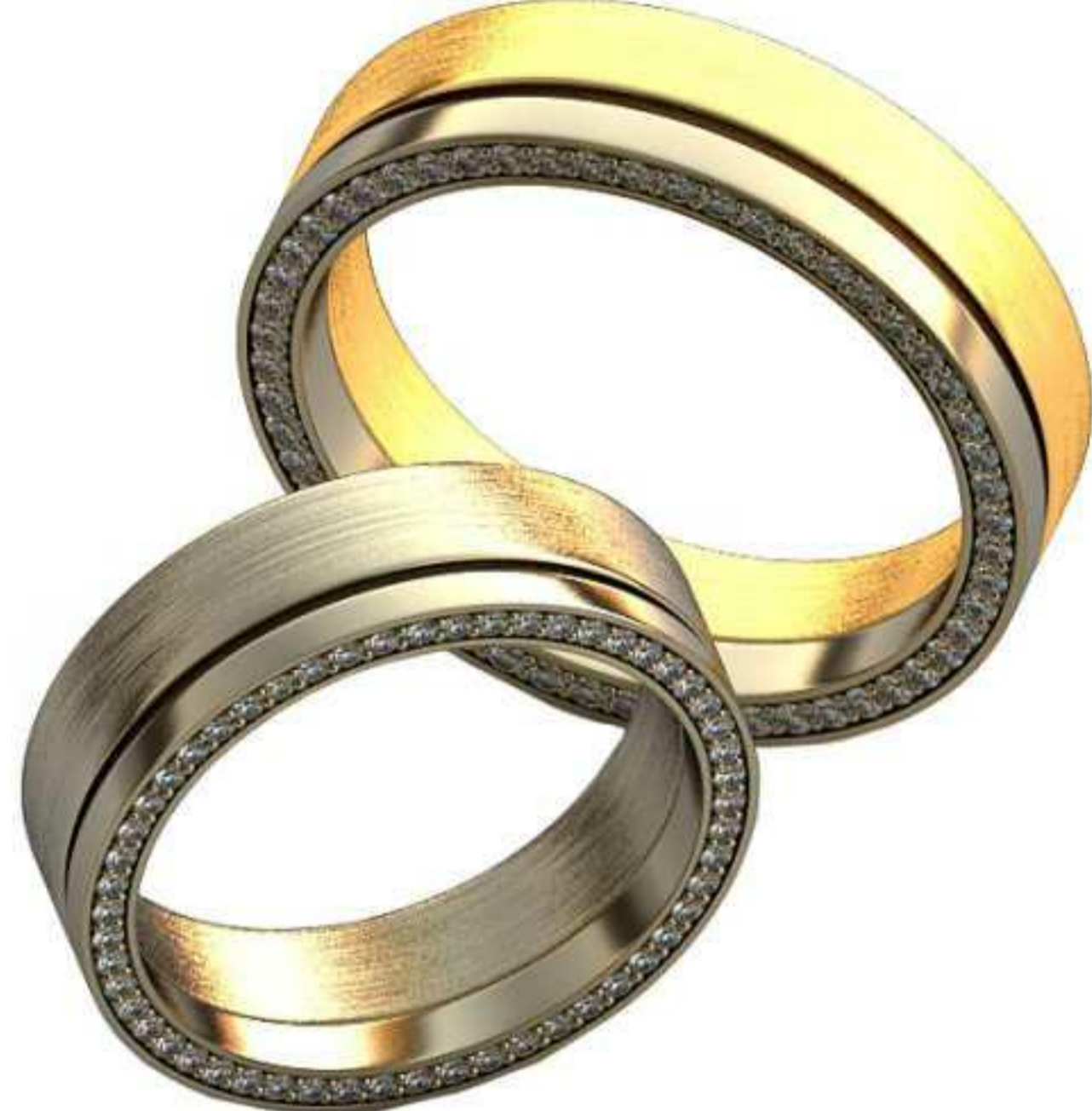
320ж/Р-17,0/Ш-6,0/Т-1,7/Кр 1.0-54шт./Вес-7,2 320м/Р-20,2/Ш-5,9/Т-2,0/Кр 1.0-54шт./Вес-9,6