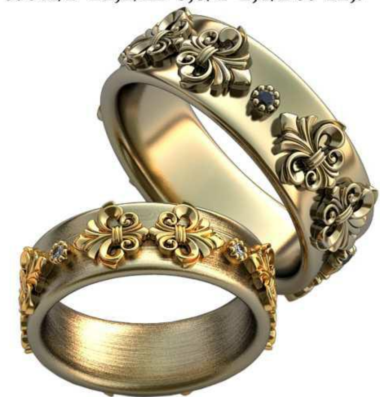
402ж/Р-17,0/Ш-6,8/Т-2,0/Кр 1.4-4шт./Вес-8,4 402м/Р-20,2/Ш-8,0/Т-2,6/Кр 1.7-4шт./Вес-14,0