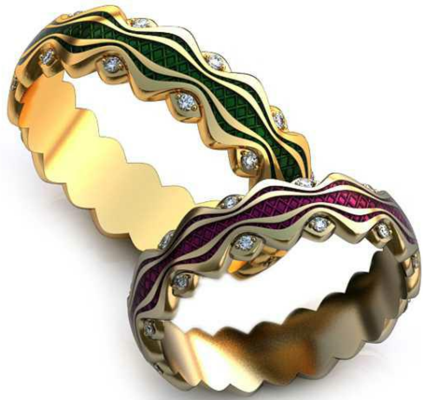
91ж/Р-17,7/Ш-5,5/Т-1,4/Кр 1.1-22шт./Вес-4,1 91м/Р-19,7/Ш-6,0/Т-1,6/Кр 1.1-22шт./Вес-5,7