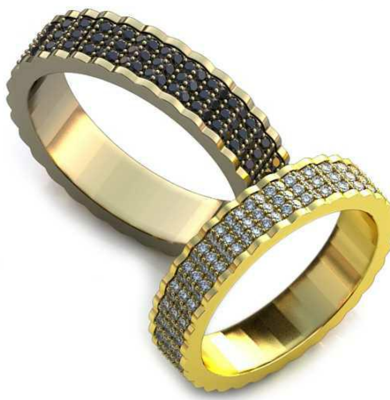
222ж/Р-17/Ш-4,5/Т-1,5/Кр 1.0-192шт./Вес-3,9 222м/Р-19/Ш-5,0/Т-1,7/Кр 1.0-192шт./Вес-5,5