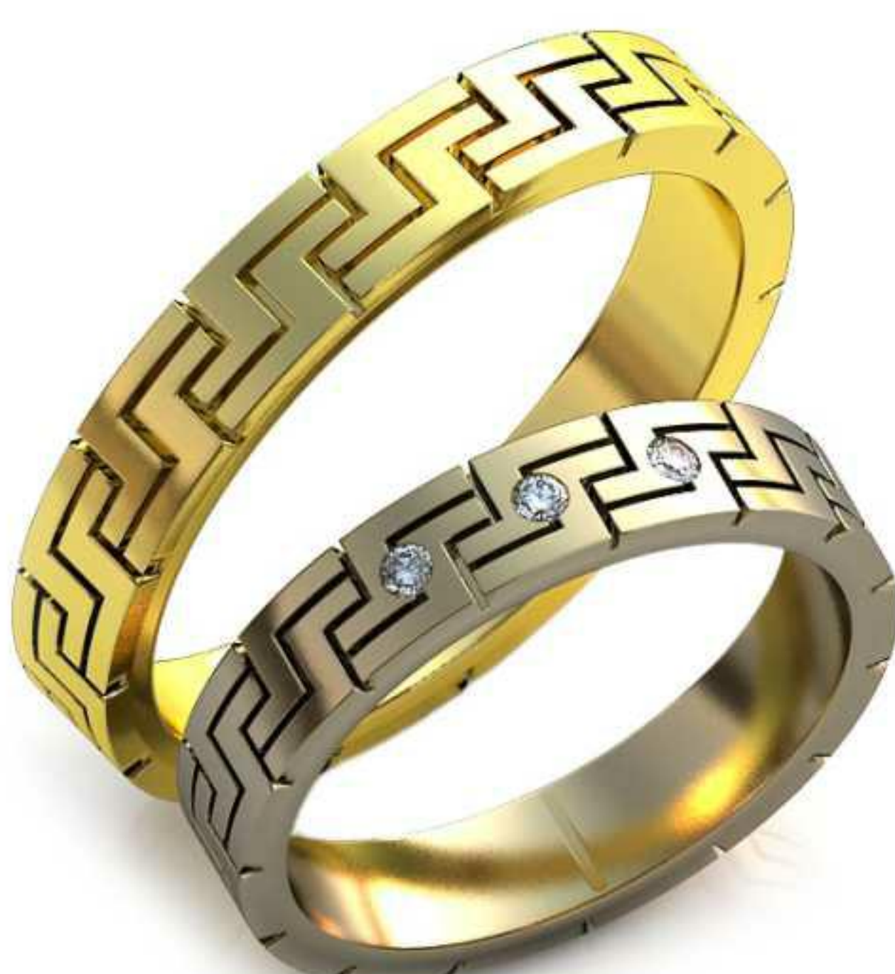
281ж/Р-17,2/Ш-4,0/Т-1,5/Кр 1.6-3шт./Вес-4,2 281м/Р-21,2/Ш-4,0/Т-1,8/Вес-6,3