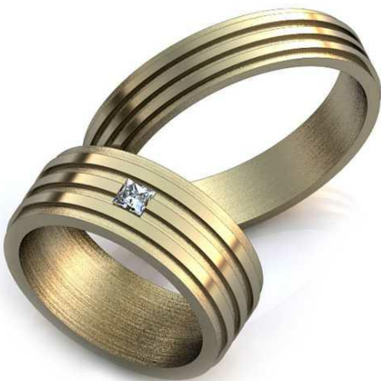
10ж/Р-16,0/Ш-7,0/Т-1,6/Пр 2.4x2.4-1шт./Вес-7,3 10м/Р-20,5/Ш-5,0/Т-1,4/Вес-5,2