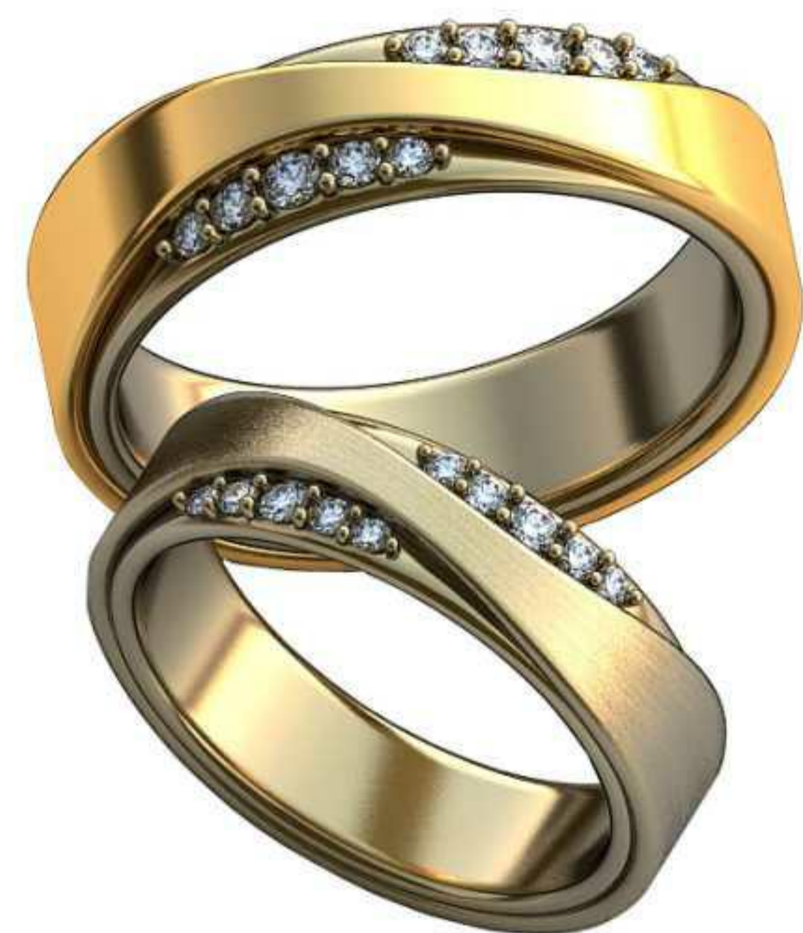
325ж/Р-20,0/Ш-6,0/Т-2,0/Кр 1.4-4,1.6-4,1.9-2/Вес-10,2 325м/Р-23,2/Ш-7,0/Т-2,4/Кр 1.4-4,1.6-4,1.9-2/Вес-16,4