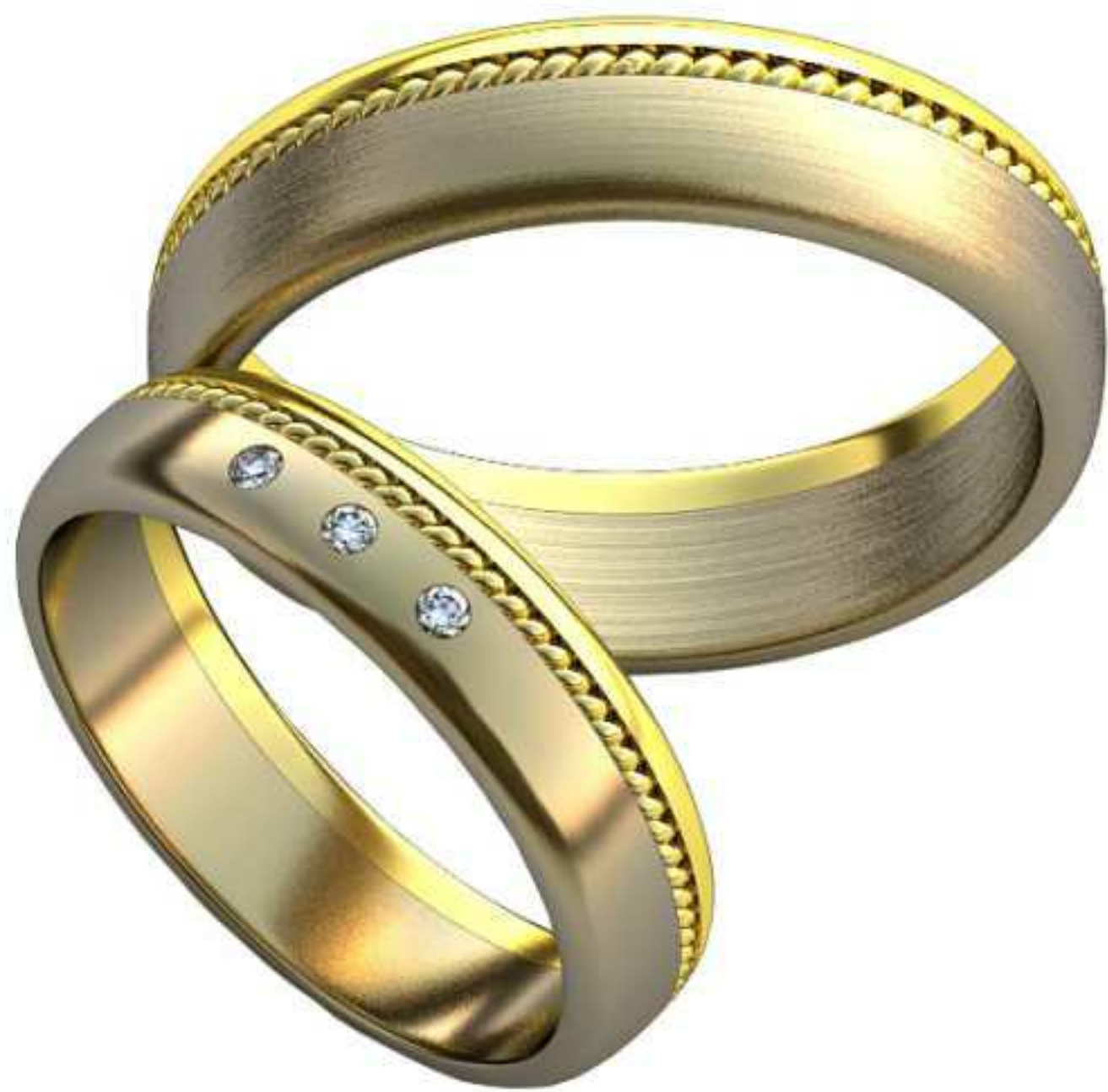
190ж/Р-18,0/Ш-5,0/Кр 1.4-3шт./Т-1,5/Вес-5,2 190м/Р-21,0/Ш-5,7/Т-1,7/Вес-8,3