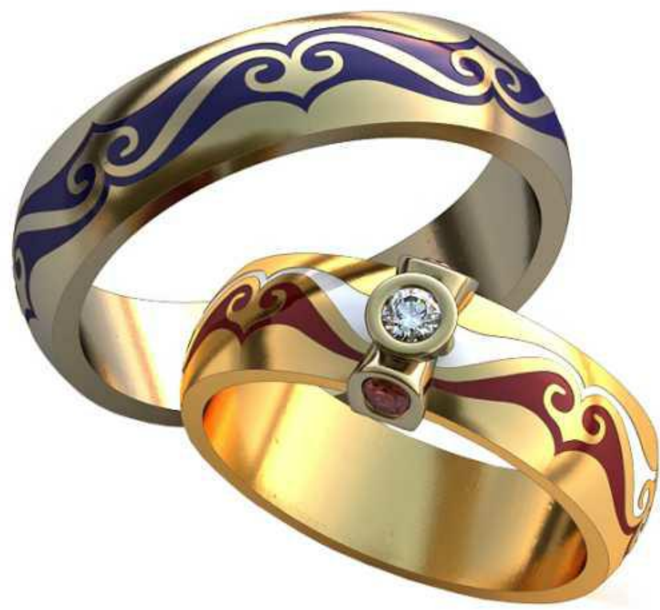
301ж/Р-18,0/Ш-5,9/Т-1,7/Кр 2.6-1шт.,2.-2шт./Вес-7,1 301м/Р-21,0/Ш-5,9/Т-2,0/Вес-8,5