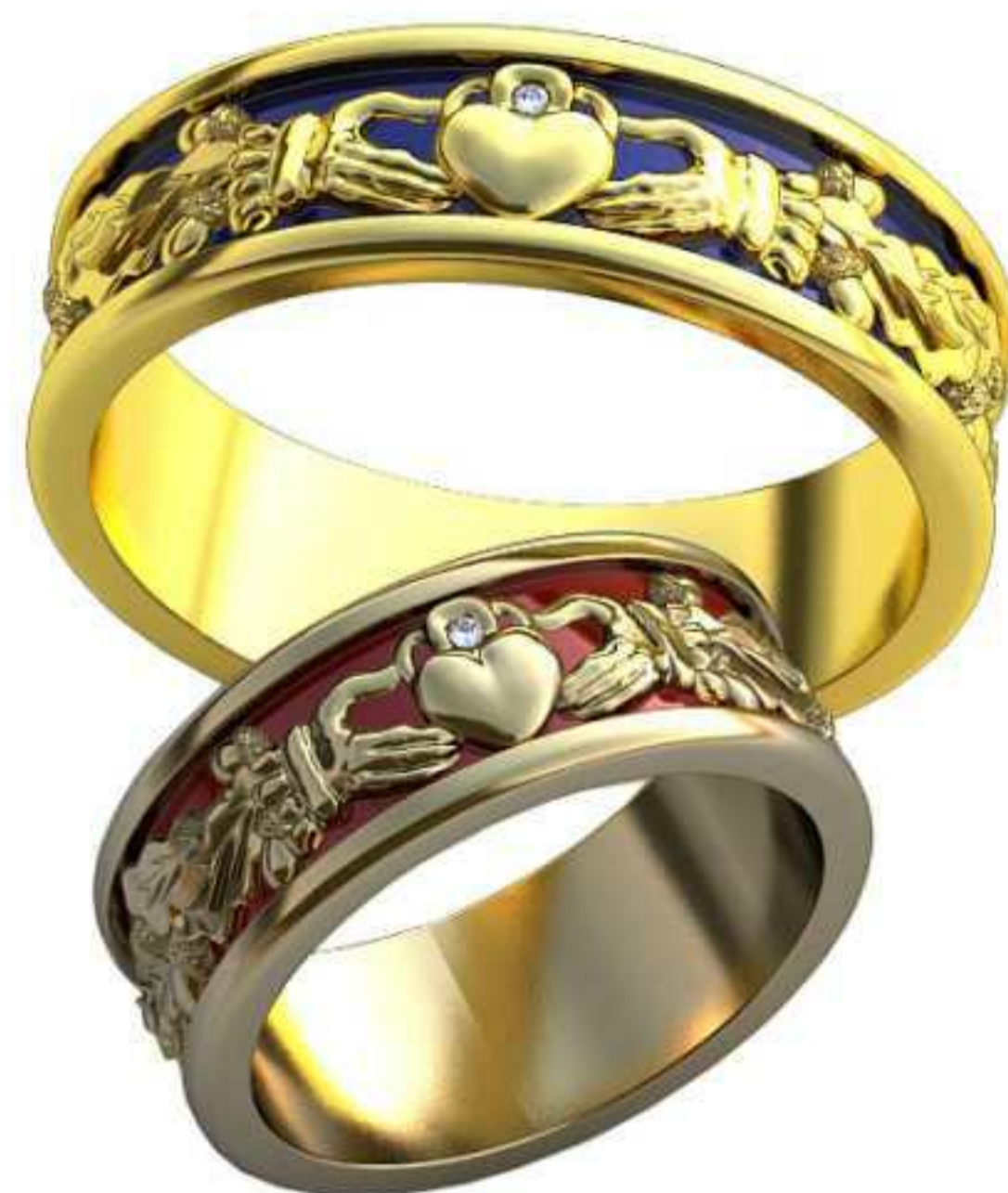
476ж/Р-16/Ш-7/Т-1,5/Кр 1.0-1шт./Вес-6,4 476м/Р-21,5/Ш-7/Т-1,6/Кр 1.0-1шт./Вес-9