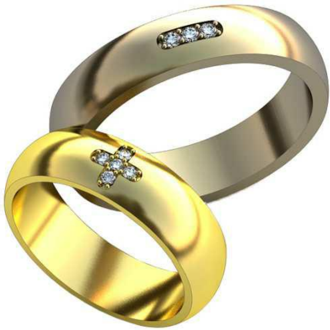
319ж/Р-17,0/Ш-5,6/Т-1,6/Кр 1.3-5шт./Вес-5,5 319м/Р-20,2/Ш-5,1/Т-1,9/Кр 1.5-3шт./Вес-7,9