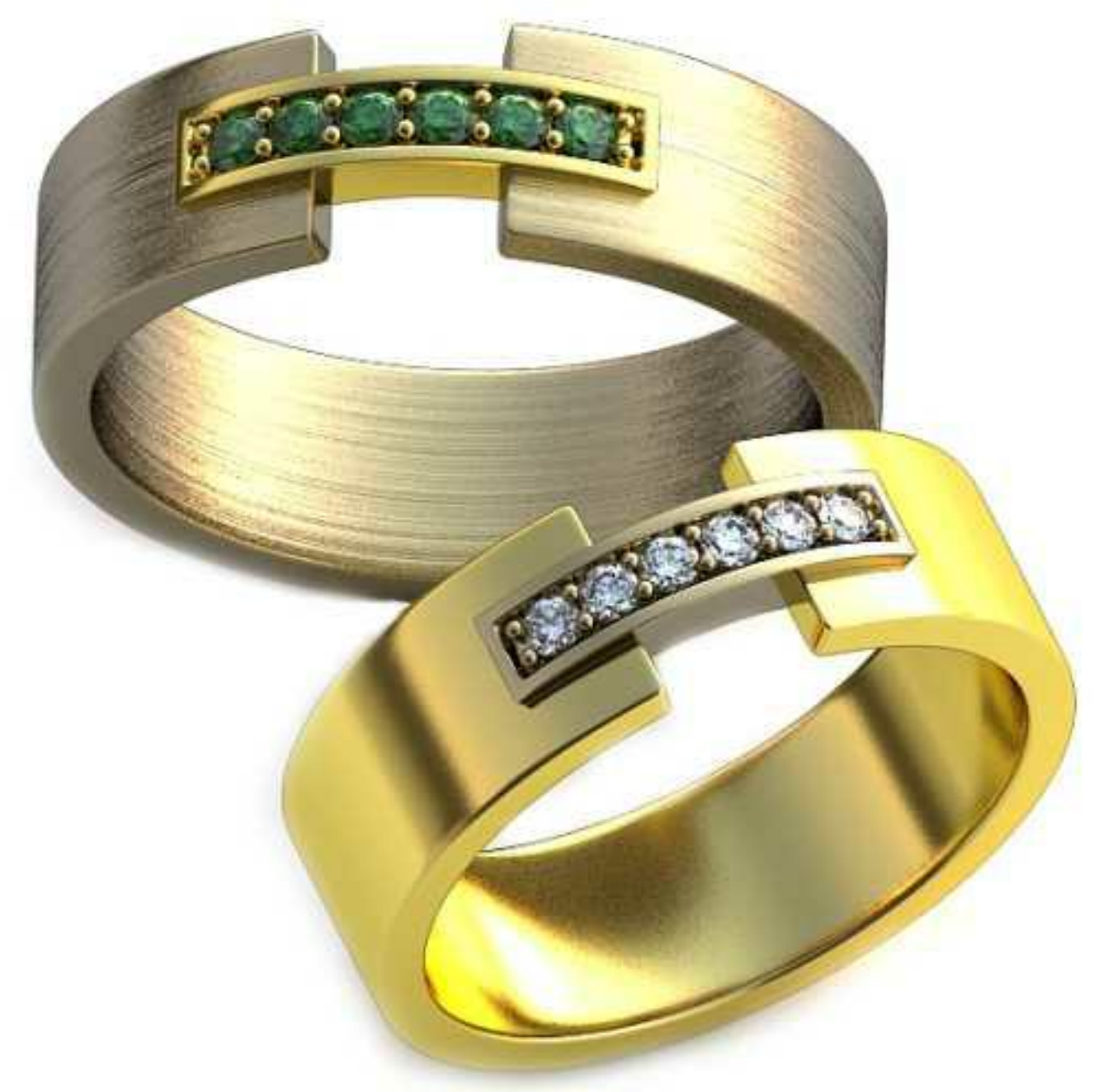
105ж/Р-17,2/Ш-6,0/Т-1,4/Кр 1.4-6шт./Вес-7,0 105м/Р-19,0/Ш-6,0/Т-1,6/Кр 1.4-6шт./Вес-8,5