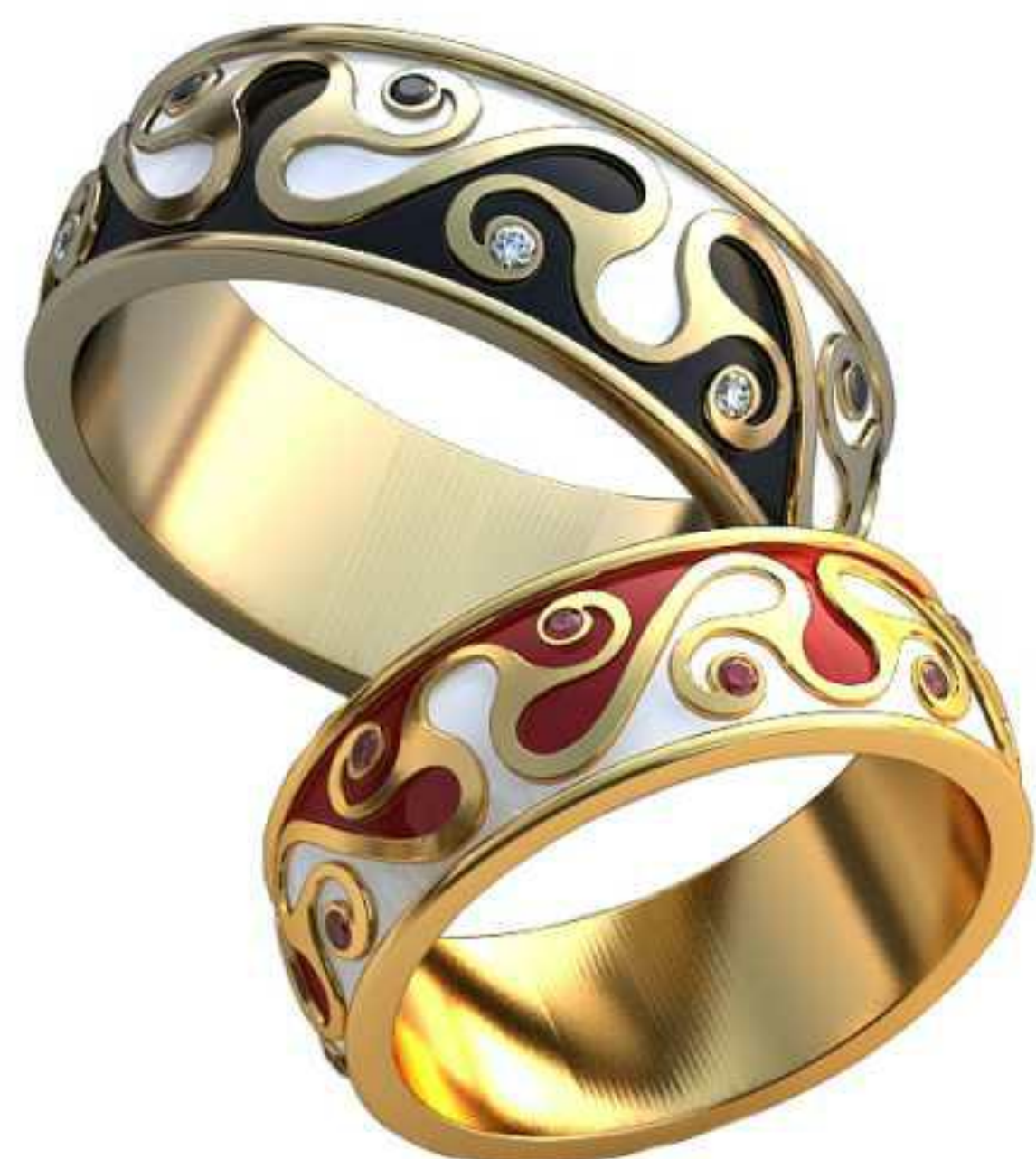
307ж/Р-17,5/Ш-7,0/Т-1,7/Кр 1.1-12шт./Вес-7,2 307м/Р-19,7/Ш-8,0/Т-2/Кр 1.2-12шт./Вес-10,4