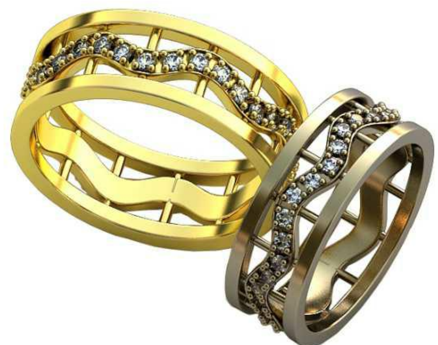
372ж/Р-17,5/Ш-7,0/Т-1,5/Кр 1,5-34шт./Вес-4,8 372м/Р-20,0/Ш-8/Т-1,7/Кр 1,5-34шт./Вес-7,0