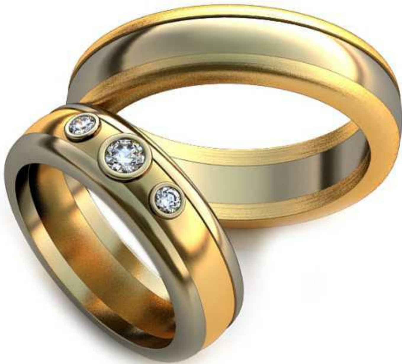
259ж/Р-17,5/Ш-6,0/Т-2/Кр 3.0-1шт.,2.0-2шт./Вес-8,8 259м/Р-20,7/Ш-6,1/Т-2,4/Кр 3.0-1шт.,2.0-2шт./Вес-12,4