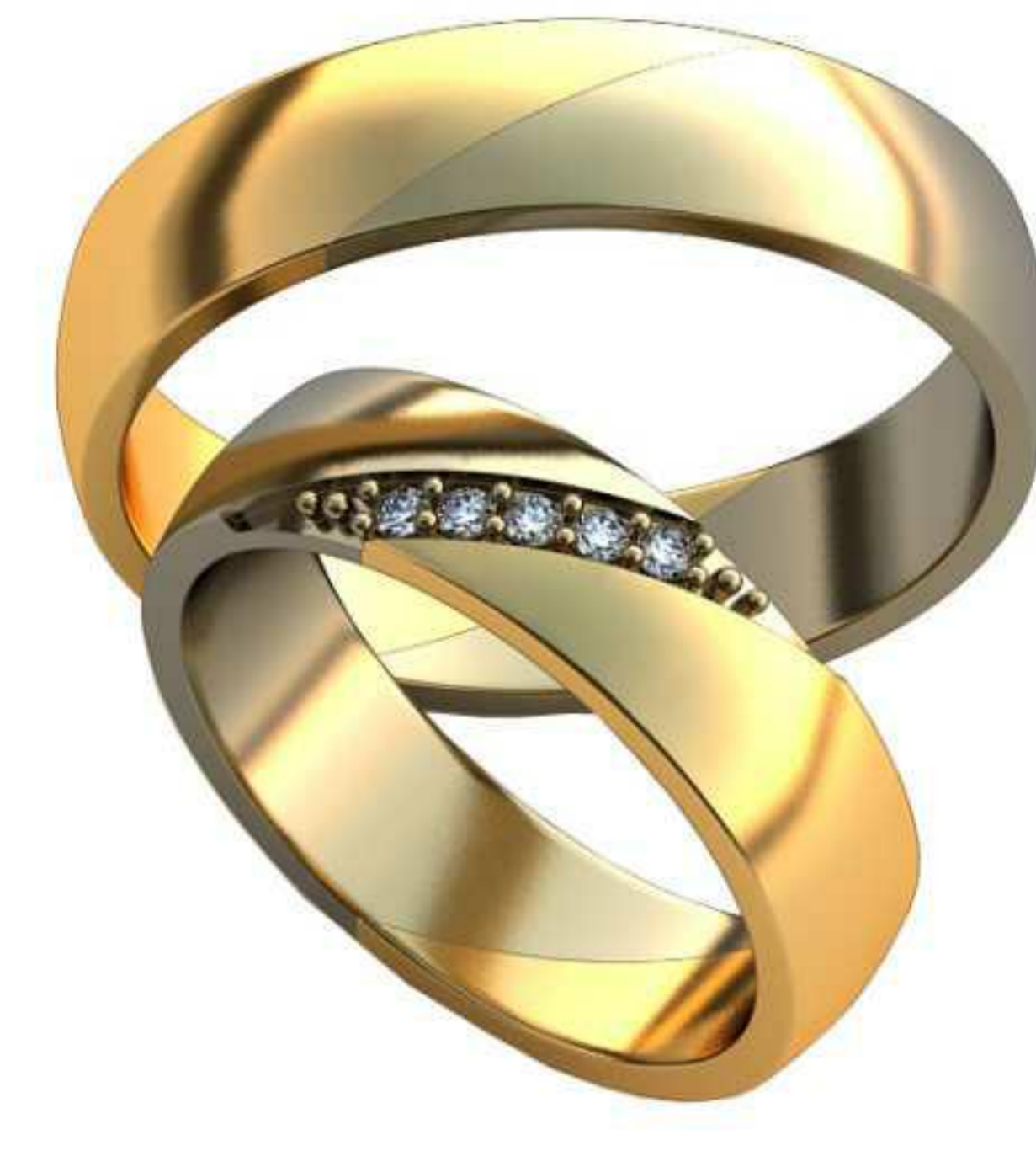
450ж/Р-16,5/Ш-5/Т-1,5/Кр 1.4-5шт./Вес-5,2 450м/Р-20,2/Ш-5,2/Т-1,4/Вес-6,3