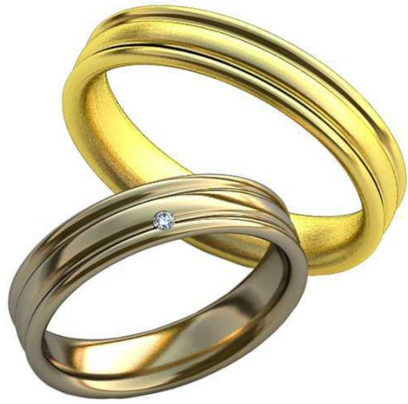
331ж/Р-17,7/Ш-4,9/Т-1,7/Кр 1.6-1шт./Вес-5,4 331м/Р-21,0/Ш-4,9/Т-2,0/Вес-7,6