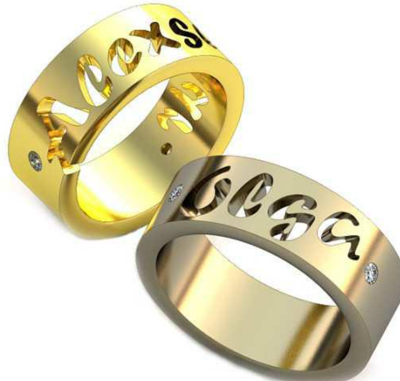
128ж/Р-17,5/Ш-8,1/Т-2,0/Кр 2.0-2шт./Вес-11,1 128м/Р-20,0/Ш-8,1/Т-2,0/Кр 2.0-2шт./Вес-13,8