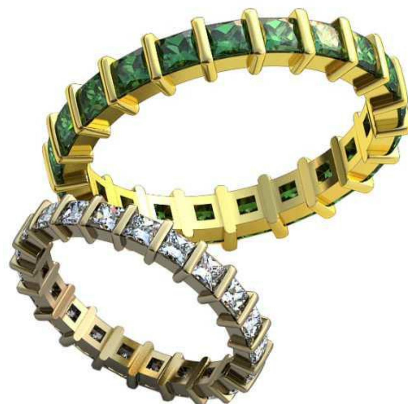
440ж/Р-16,5/Ш-3,2/Т-1,6/Кр 2.2-21шт./Вес-2,3 440м/Р-21,7/Ш-4,1/Т-1,8/Кр 2.9-21шт./Вес-5,3