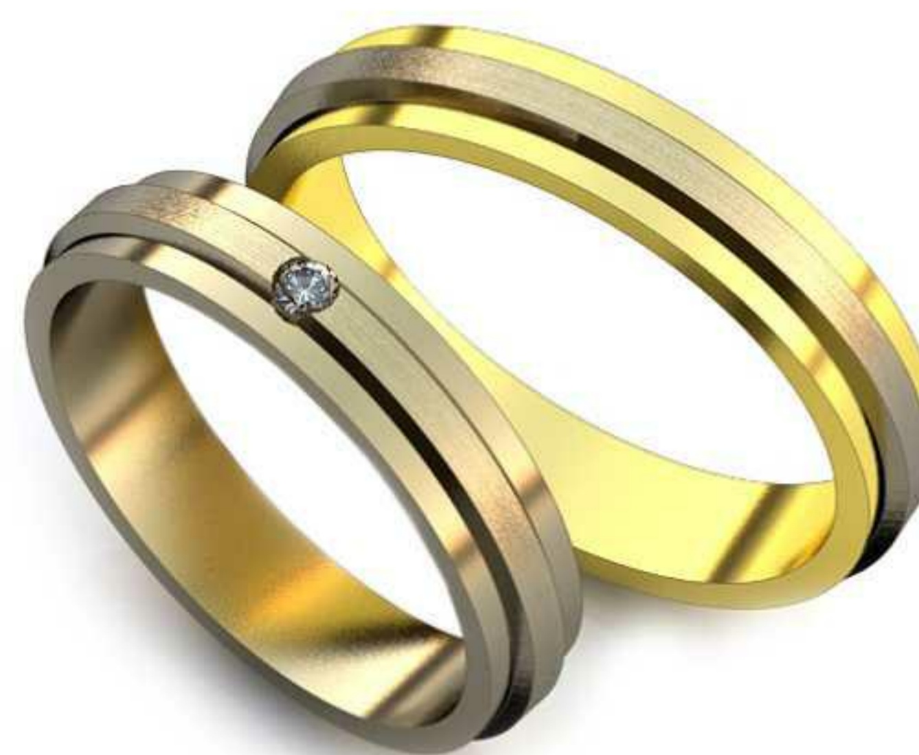
18ж/Р-17,0/Ш-4,0/Т-1,5/Кр 2.0-1шт./Вес-3,7 18м/Р-19,0/Ш-4,0/Т-1,7/Вес-4,8