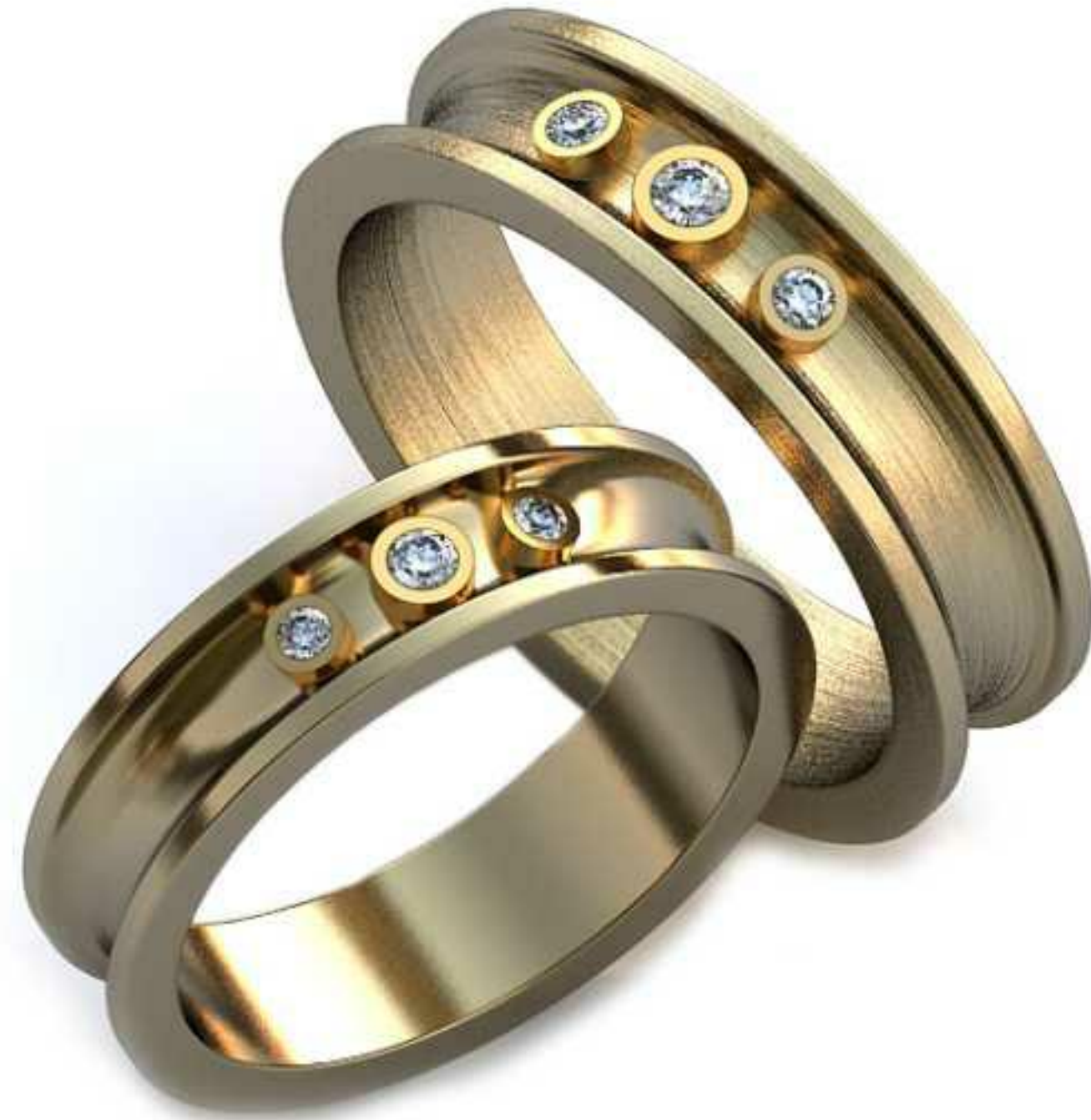
34ж/Р-17,0/Ш-5,0/Т-1,6/Кр 2.0-1шт.,1.5- 2шт./Вес-4,0 34м/Р-19,0/Ш-5,6/Т-1,8/Кр 2.0-1шт.,1.5- 2шт./Вес-5,6