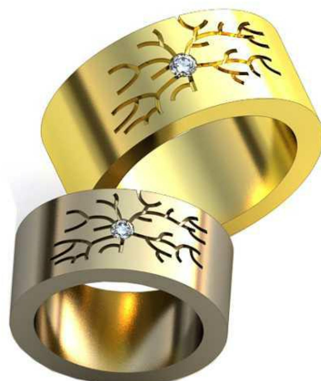
464ж/Р-15,2/Ш-8,4/Т-2,1/Кр 2.0-1шт./Вес-12,7 464м/Р-18/Ш-10/Т-2,5/Кр 2.5-1шт./Вес-21,4