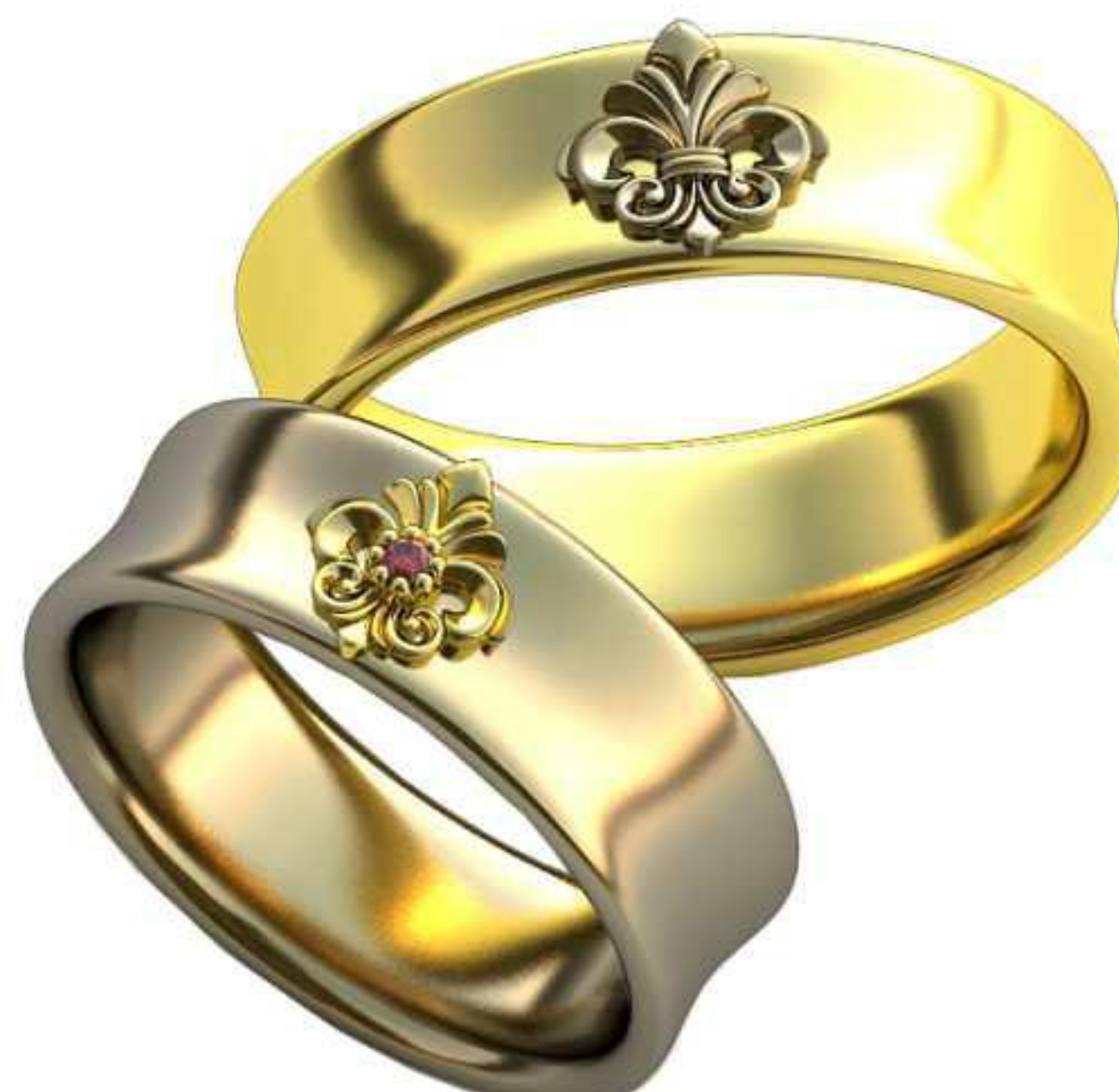
401ж/Р-17,5/Ш-7,0/Т-1,6/Кр 1.5-1шт./Вес-7,7 401м/Р-20,2/Ш-7,0/Т-1,9/Вес-10,2