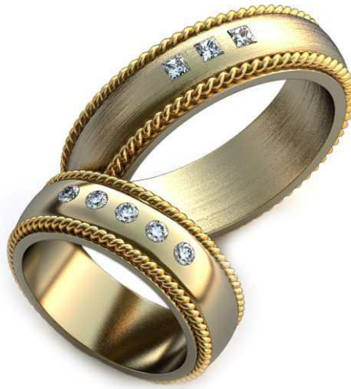
32ж/Р-17,0/Ш-7,2/Т-2,1/Кр 2.0-5шт./Вес-11,0 32м/Р-21,5/Ш-7,2/Т-2,7/Пр 2.0x2.0-3шт./Вес-17,7