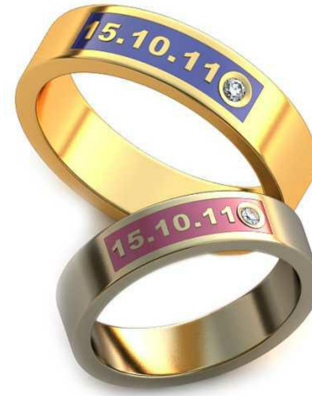
261ж/Р-16,7/Ш-4,7/Т-1,6/Кр 1.4-1шт./Вес-5,5 261м/Р-19,7/Ш-5,5/Т-1,8/Кр 1.4-1шт./Вес-8,9