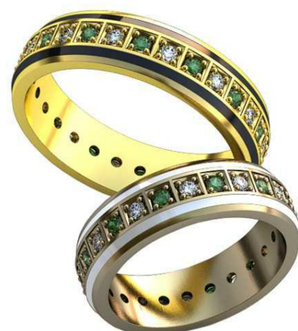
477ж/Р-17,5/Ш-6/Т-1,7/Кр 1.7-28шт./Вес-7,3 477м/Р-21/Ш-6/Т-1,8/Кр 1.7-28шт./Вес-8,7