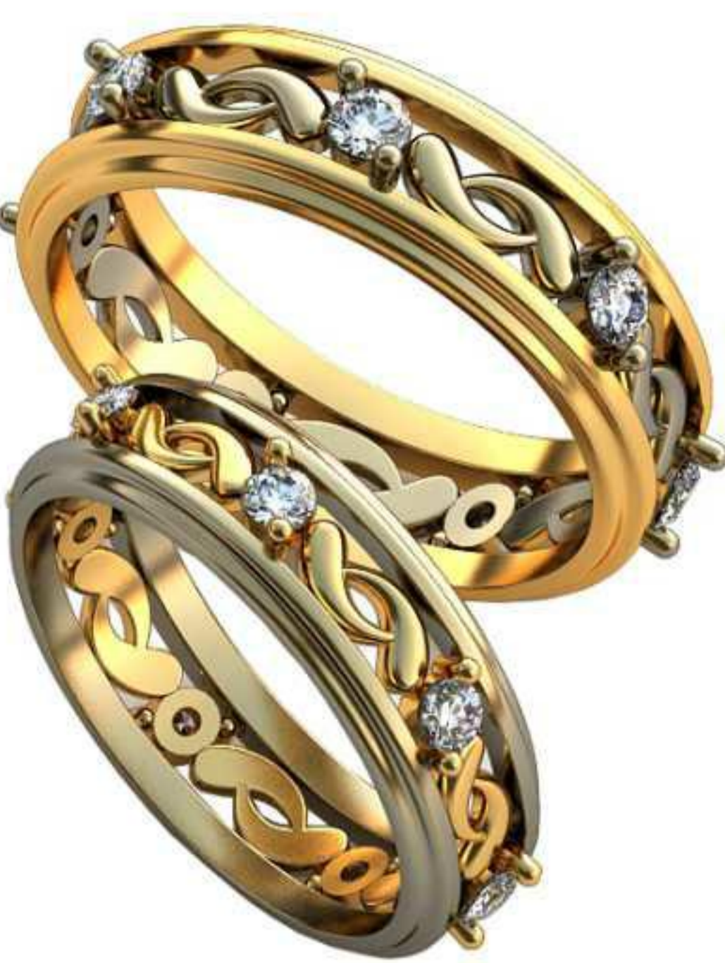
449ж/Р-16,2/Ш-5,3/Т-1,3/Кр 2.2-7шт./Вес-3,1 449м/Р-18,2/Ш-6/Т-1,5/Кр 2.5-7шт./Вес-4,4