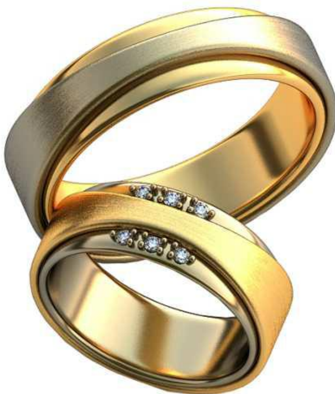
335ж/Р-18,0/Ш-7,3/Т-1,8/Кр 1.5-6шт./Вес-9,4 335м/Р-23,2/Ш-7,3/Т-2,3/Вес-15,8