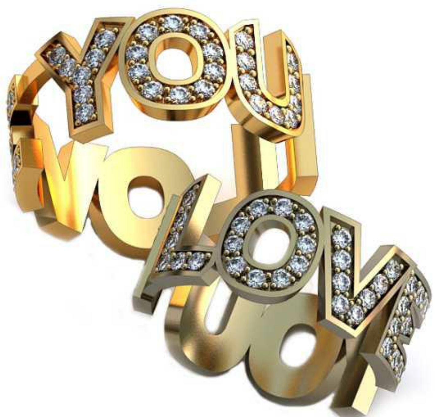
103ж/Р-16,7/Ш-8,0/Т-1,6/Кр 1.5-63шт./Вес-4,2 103м/Р-18,2/Ш-8,0/Т-1,6/Кр 1.5-55шт./Вес-4,1