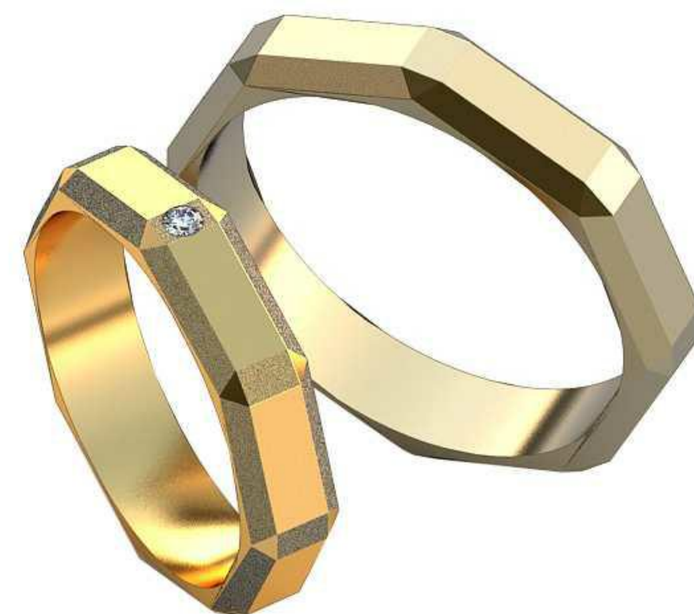
510ж/Р-20/Ш-5/Т-2,1/Кр 2.0-1шт./Вес-6,0 510м/Р-23,5/Ш-5/Т-2,1/Вес-8,4