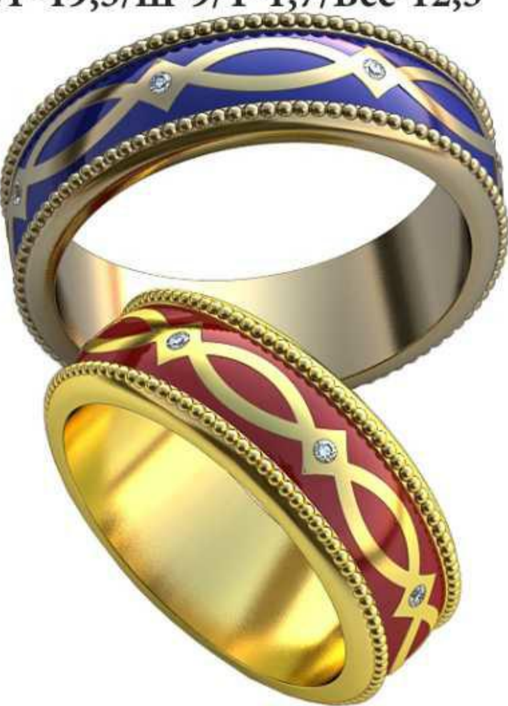
445ж/Р-16,7/Ш-6,7/Т-1,7/Кр 1.1-7шт./Вес-6,7 445м/Р-18,7/Ш-6,7/Т-1,8/Кр 1.1-7шт./Вес-7,8