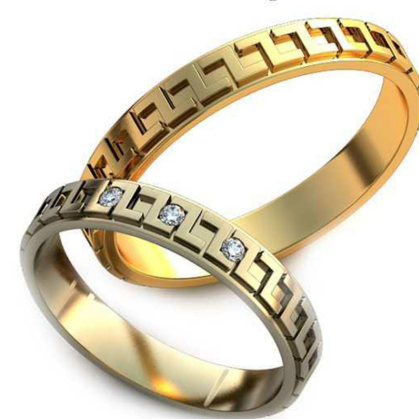
282ж/Р-17,7/Ш-3,7/Т-1,3/Кр 1.6-3шт./Вес-2,9 282м/Р-20,7/Ш-3,6/Т-1,4/Вес-3,9