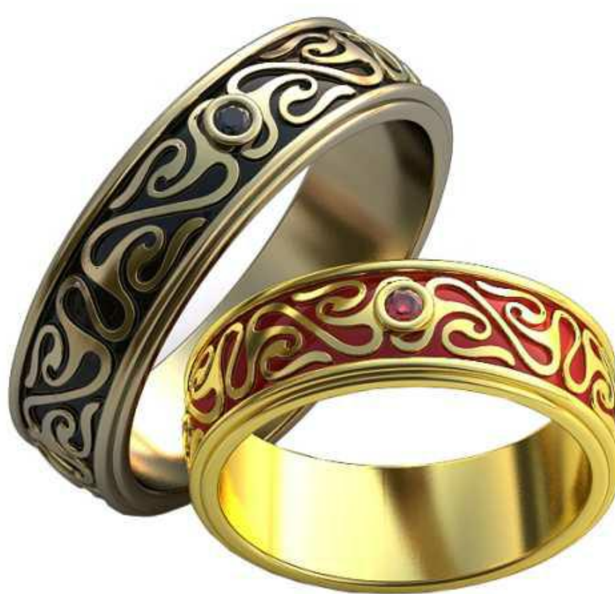
308ж/Р-18,7/Ш-7,2/Т-1,7/Кр 1.9-1шт./Вес-9,3 308м/Р-22,7/Ш-7,3/Т-2/Кр 1.9-1шт./Вес-13,9