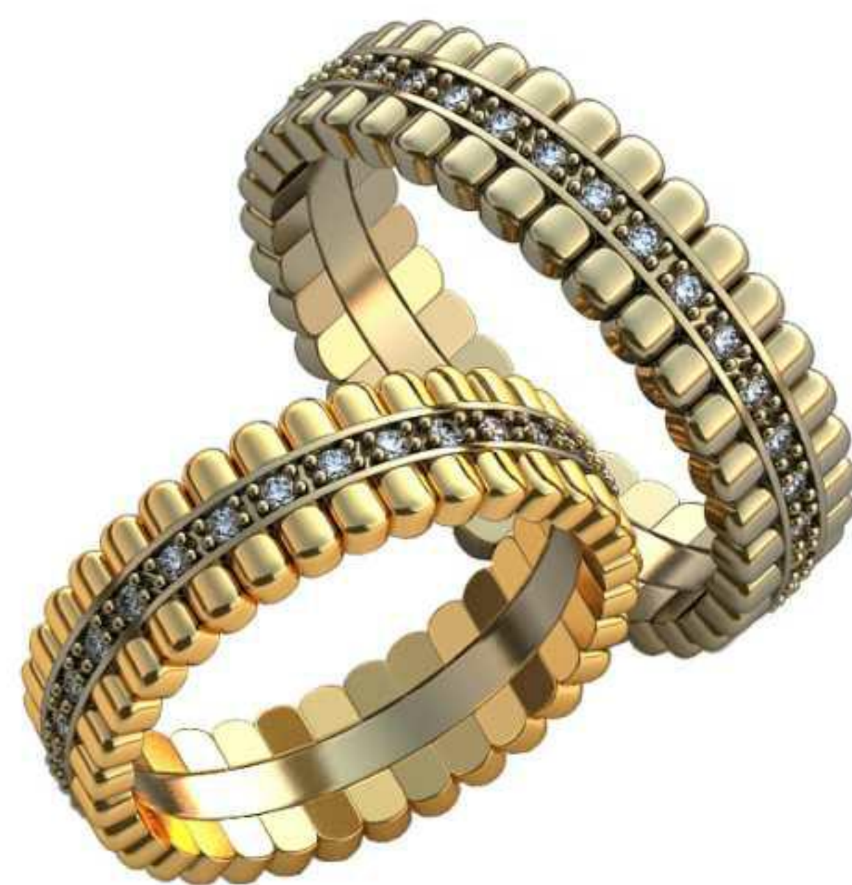
397ж/Р-17,5/Ш-5,7/Т-1,7/Кр 1.2-30шт./Вес-6,1 397м/Р-19,7/Ш-5,7/Т-1,8/Кр 1.2-33шт./Вес-7,4