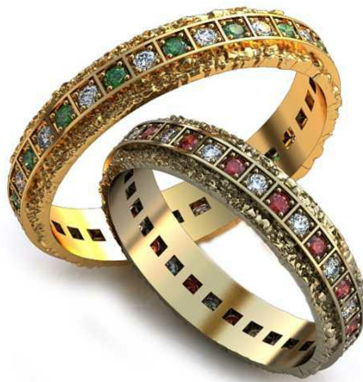
98ж/Р-19,0/Ш-4,9/Т-1,5/Кр 1.6-32шт./Вес-3,4 98м/Р-21,7/Ш-4,9/Т-1,6/Кр 1.8-32шт./Вес-4,4