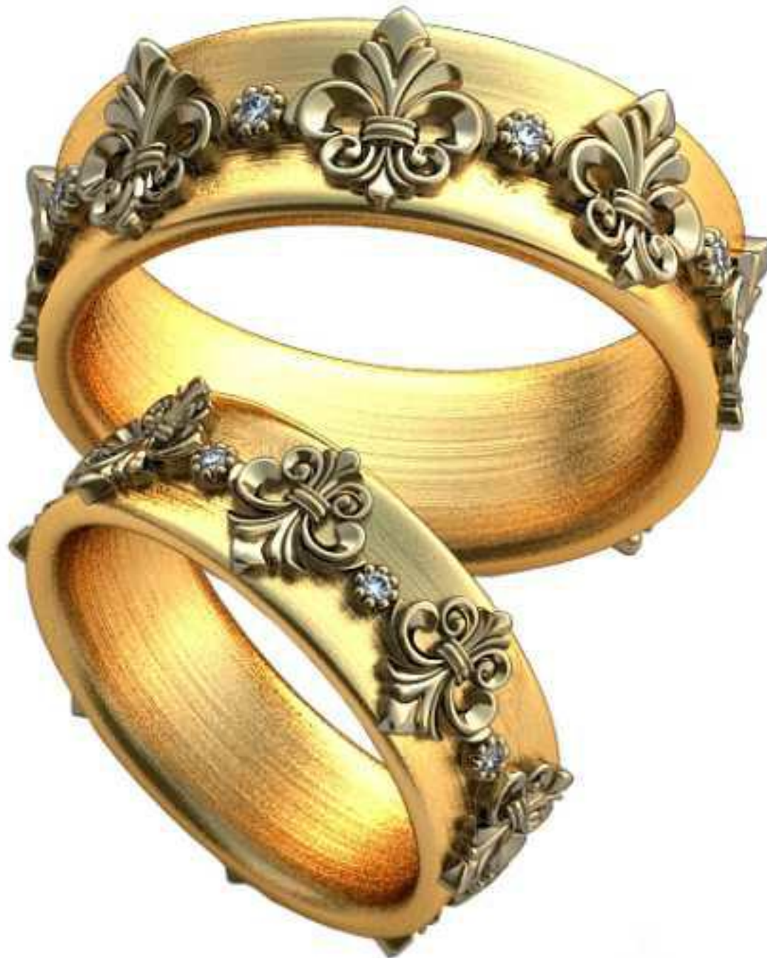
487ж/Р-15,2/Ш-6,1/Т-2,2/Кр 1.1-8шт./Вес-6,1 487м/Р-19/Ш-7,5/Т-2,6/Кр 1.3-8шт./Вес-11,4