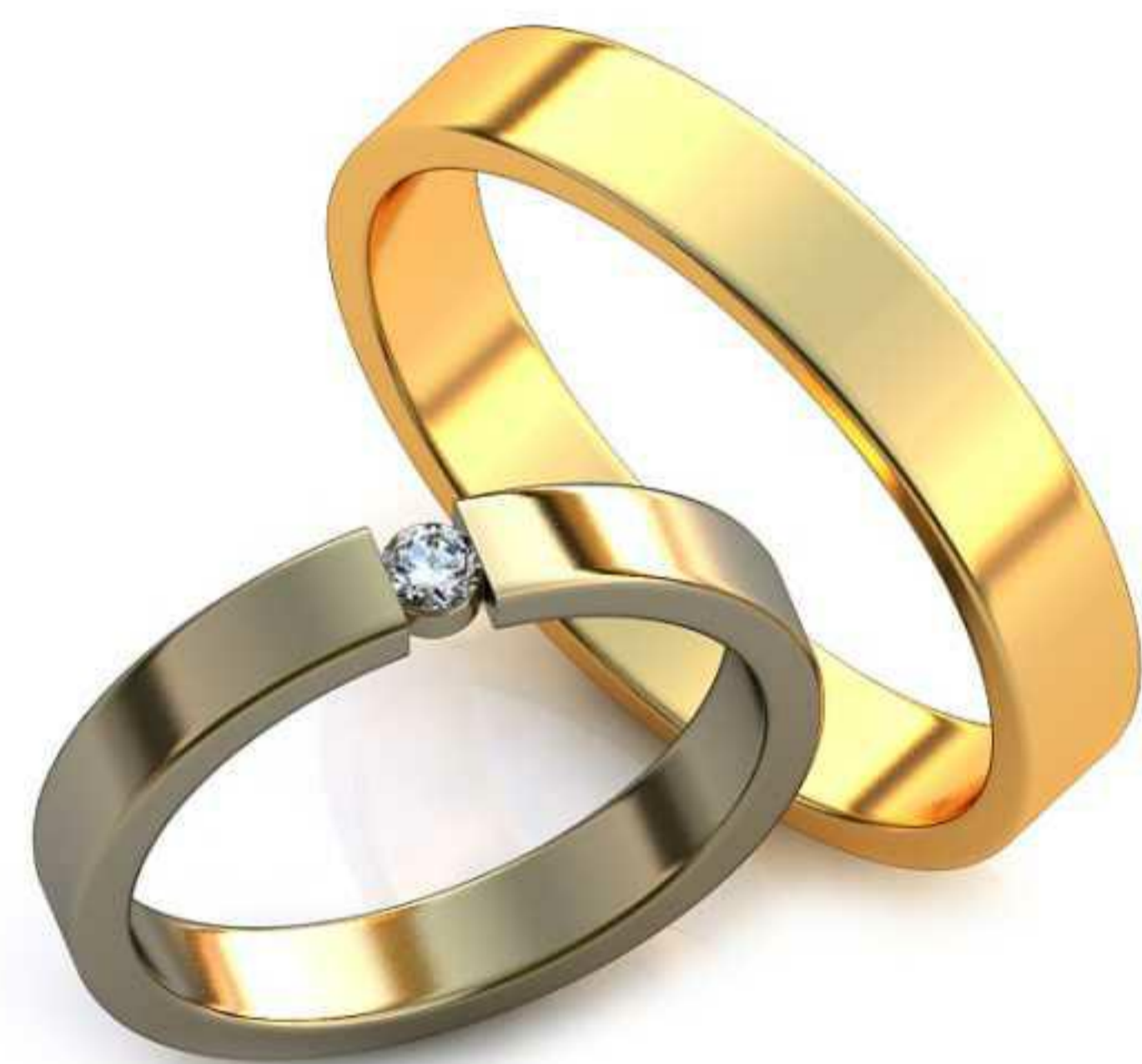
292ж/Р-16,0/Ш-3,0/Т-1,5/Кр 2.4-1шт./Вес-3,2 292м/Р-20,0/Ш-4,0/Т-1,3/Вес-4,6