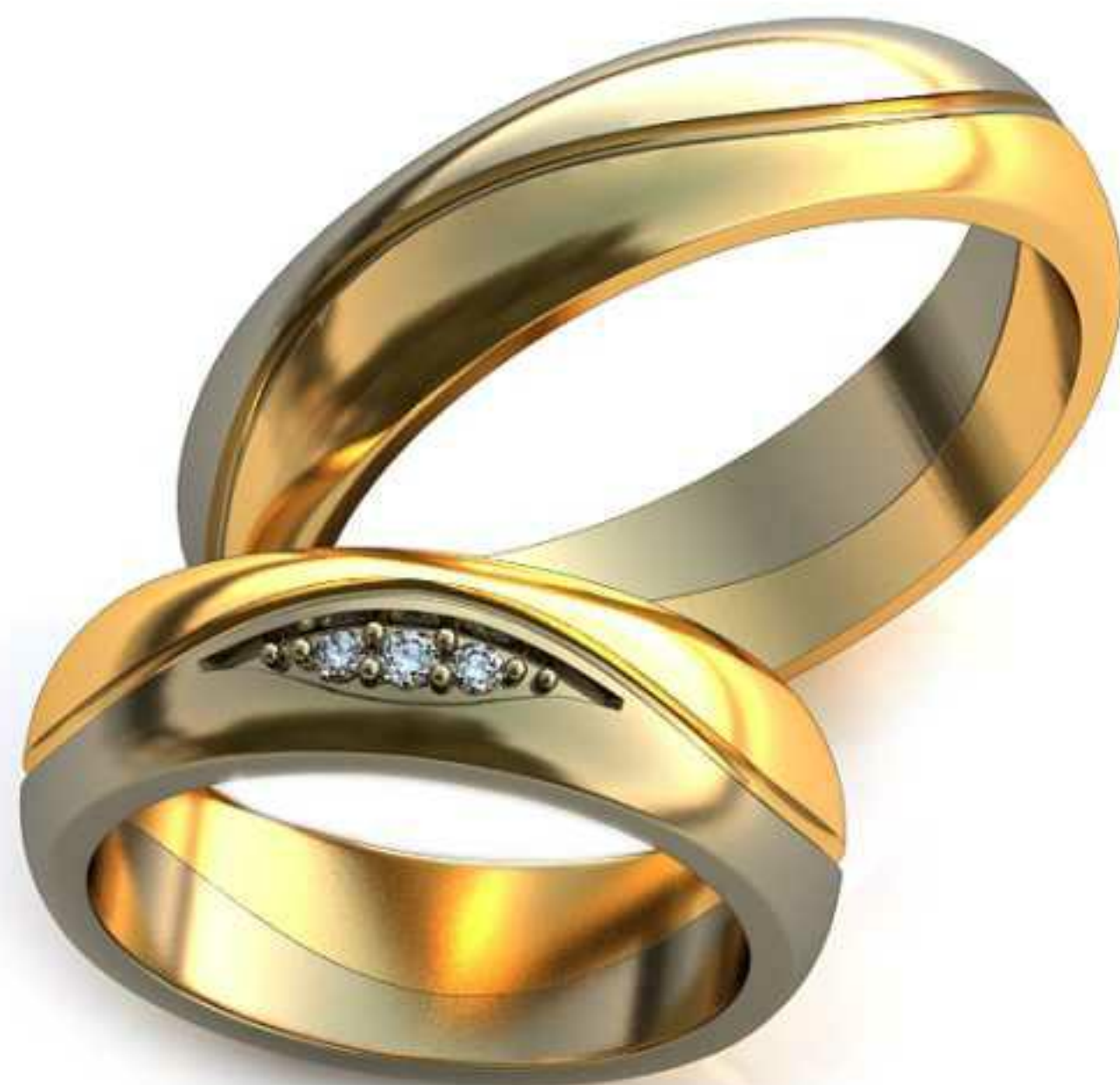
250ж/Р-16,7/Ш-5,8/Т-2,0/Кр 1.6-1шт.,1.4-2шт./Вес-7,7 250м/Р-21,0/Ш-5,8/Т-2,0/Вес-8,6