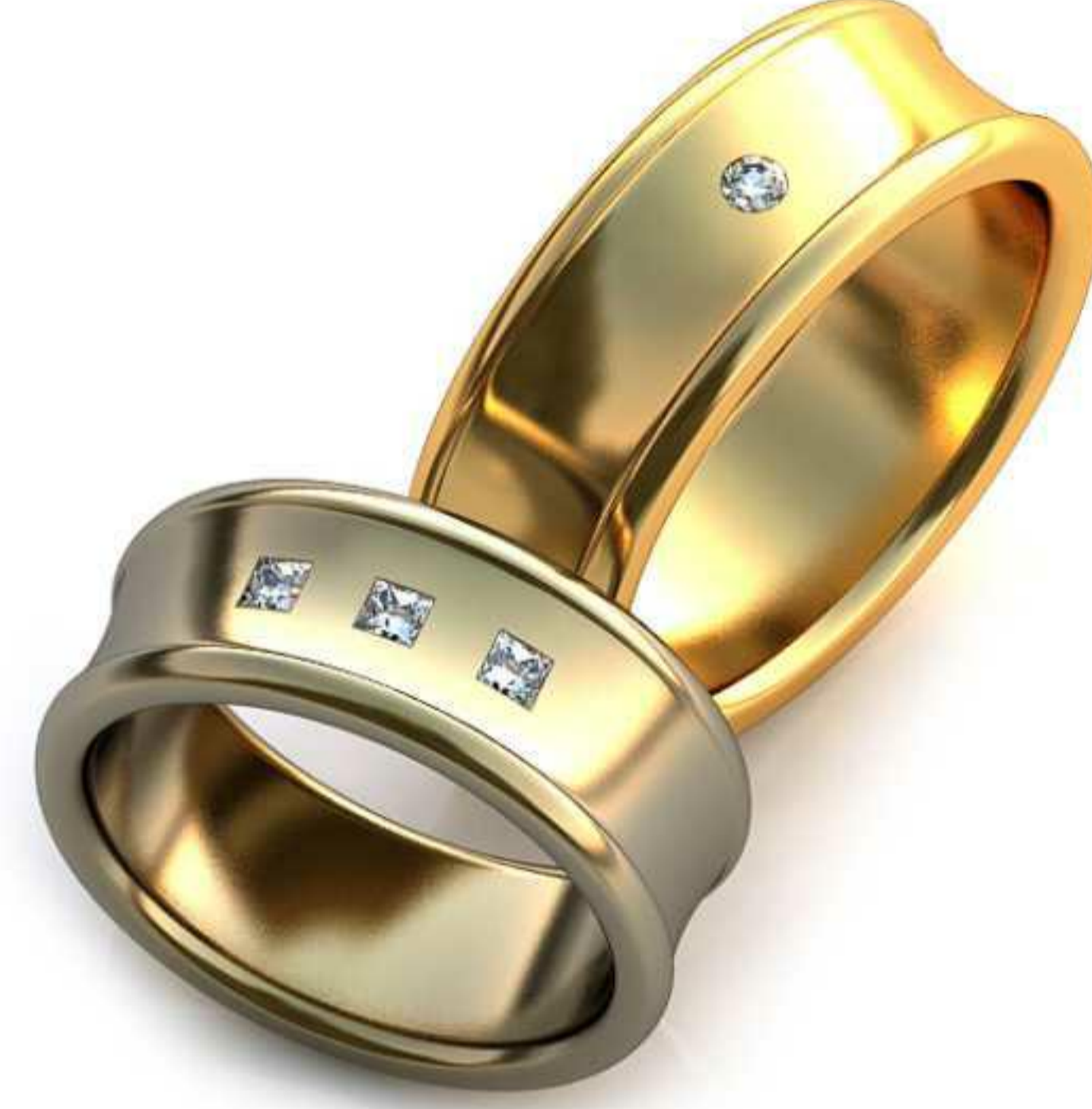
54ж/Р-17,0/Ш-8,0/Т-2,0/Пр 1.89x1.89-3шт./Вес-9,6 54м/Р-19,5/Ш-8,0/Т-2,2/Кр 2.0-1шт./Вес-12,6