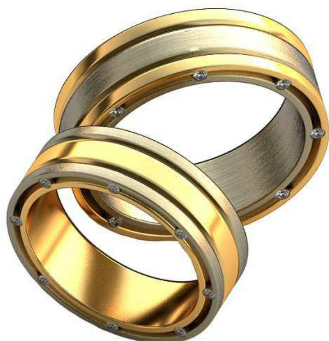
321ж/Р-17,0/Ш-6,0/Т-2,0/Кр 1.1-16шт./Вес-8,3 321м/Р-21,0/Ш-5,0/Т-2,0/Кр 1.1-16шт./Вес-7,6