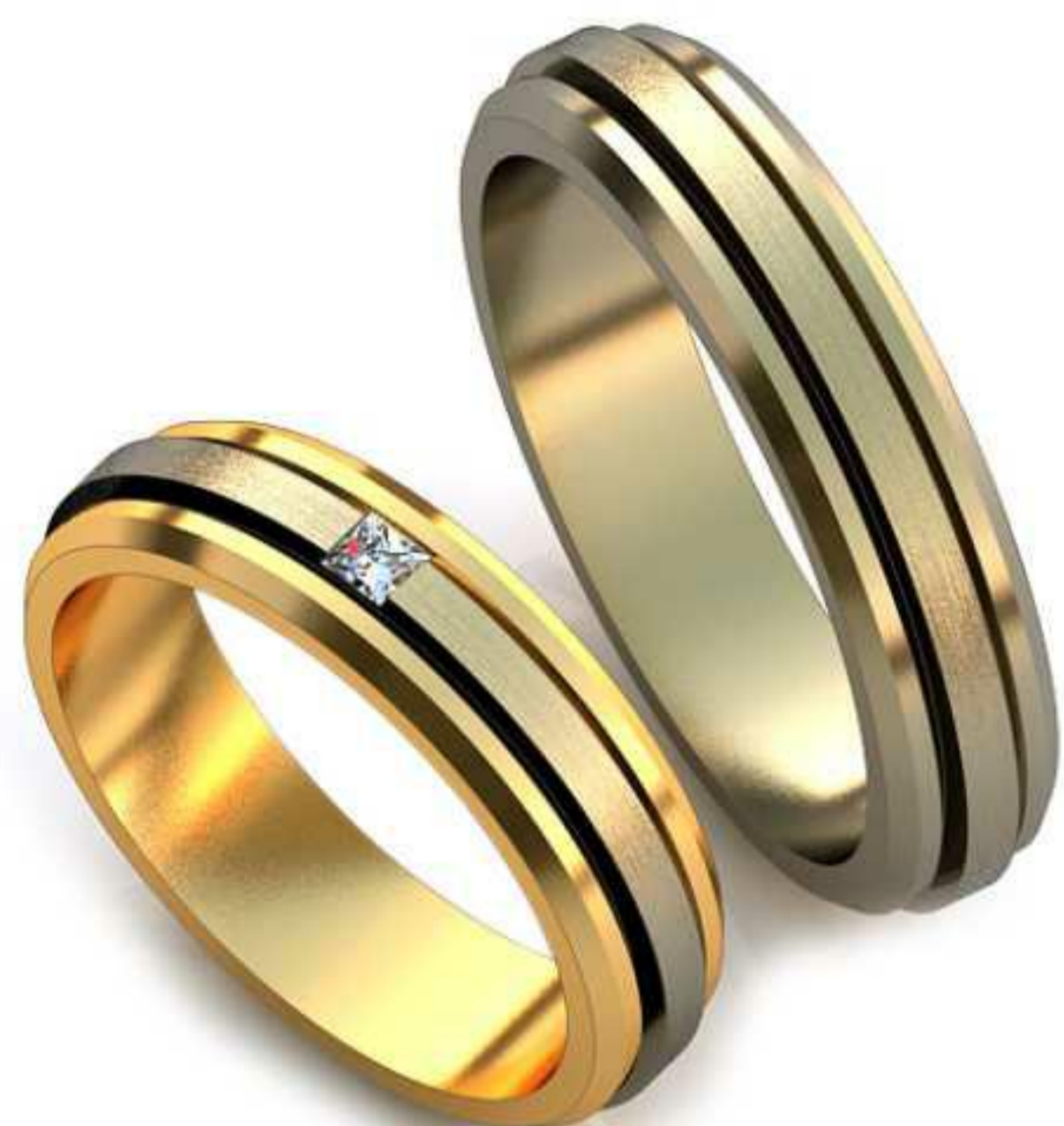
19ж/Р-17,0/Ш-5,0/Т-1,8/Кр 2.5-1 шт./Вес-6,0 19м/Р-19,5/Ш-5,0/Т-2,0/Вес-7,2