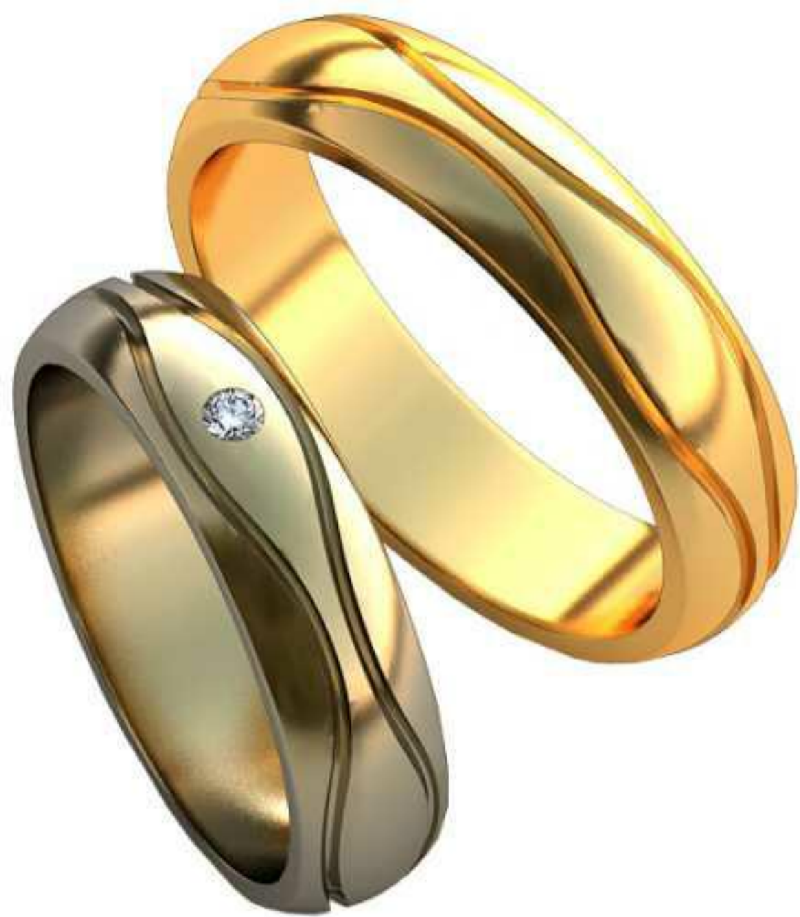
196ж/Р-18,5/Ш-5,4/Т-1,8/Кр 2.0-1шт./Вес-6,5 196м/Р-21,0/Ш-5,4/Т-2,0/Вес-8,2