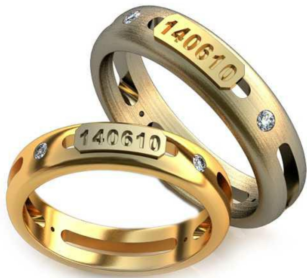
247ж/Р-16,7/Ш-4,6/Т-1,6/Кр 1.7-4шт./Вес-4,1 247м/Р-19,0/Ш-5,3/Т-1,9/Кр 1.7-4шт./Вес-6,0