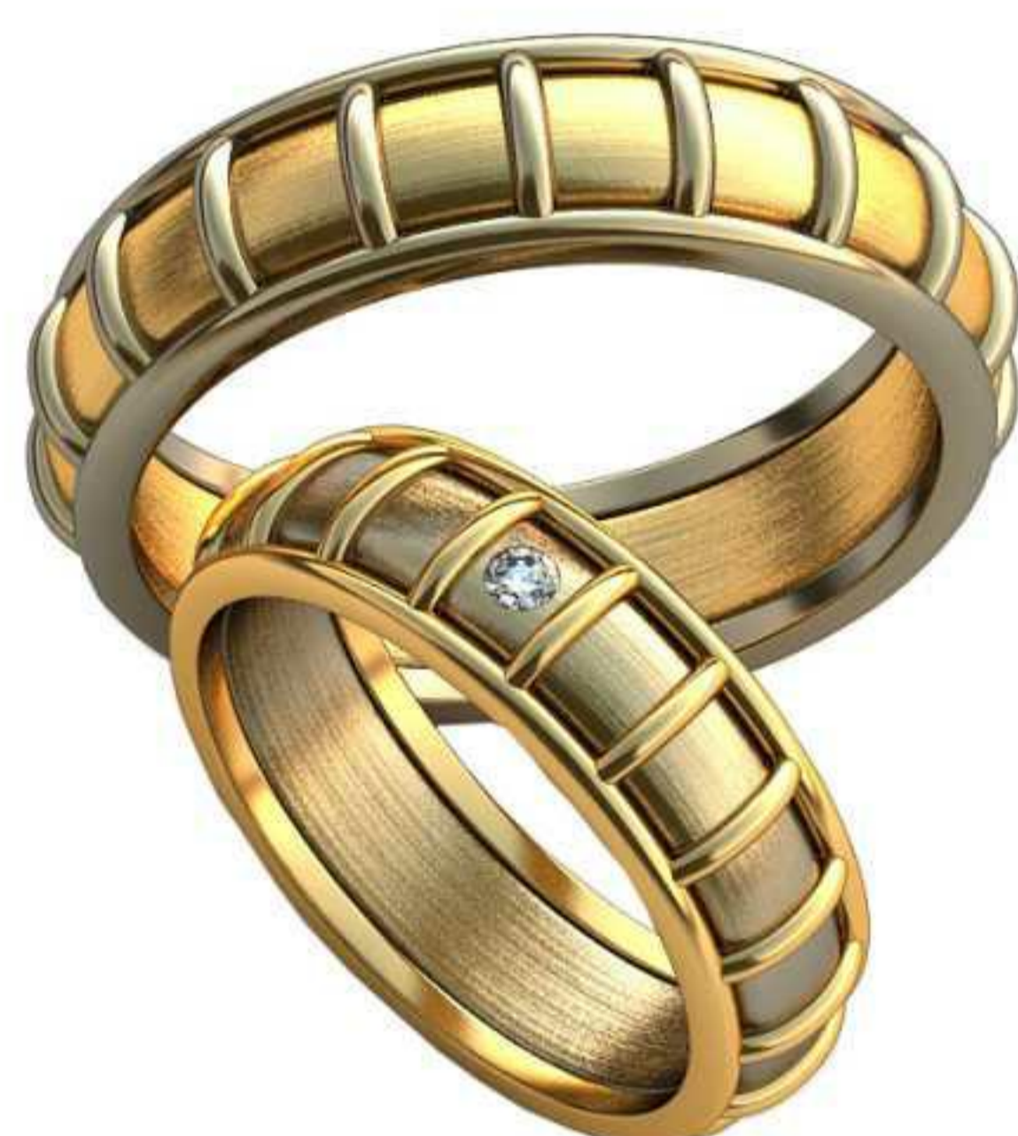
382ж/Р-17,7/Ш-6,2/Т-1,7/Кр 2.0-1шт./Вес-7,5 382м/Р-22,0/Ш-6,6/Т-2,0/Вес-12,2