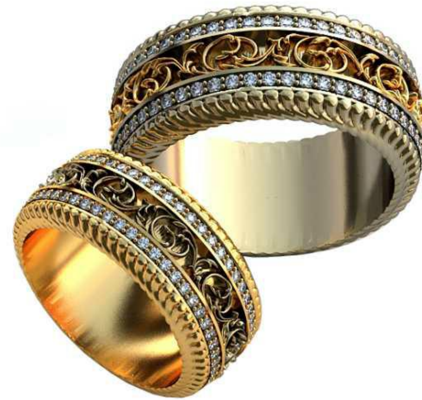
438ж/Р-16/Ш-8,4/Т-2/Кр 1.0-102шт./Вес-9,0 438м/Р-19,2/Ш-10/Т-2,4/Кр 1.0-102шт./Вес-15,8