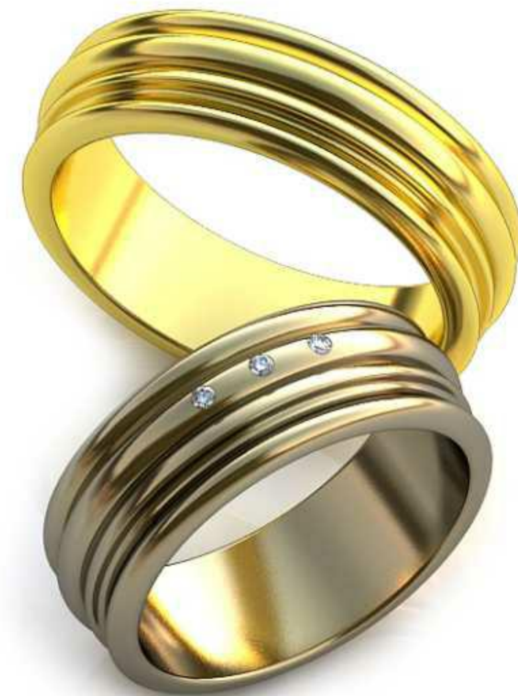
51ж/Р-17/Ш-7,0/Т-1,7/Кр 1.1-3шт./Вес-7,1 51м/Р-19/Ш-6,2/Т-2,0/Кр 1.1-3шт./Вес-8,0