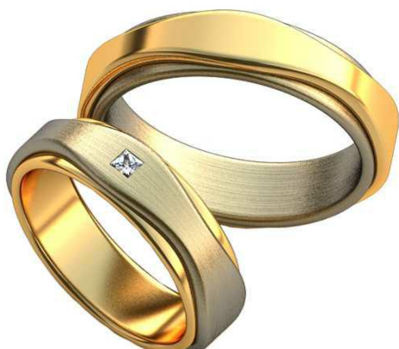
337ж/Р-18,0/Ш-6,0/Т-2,0/Пр 1.9x1.9-1шт./Вес-8,1 337м/Р-21,0/Ш-6,0/Т-2,3/Вес-11,0