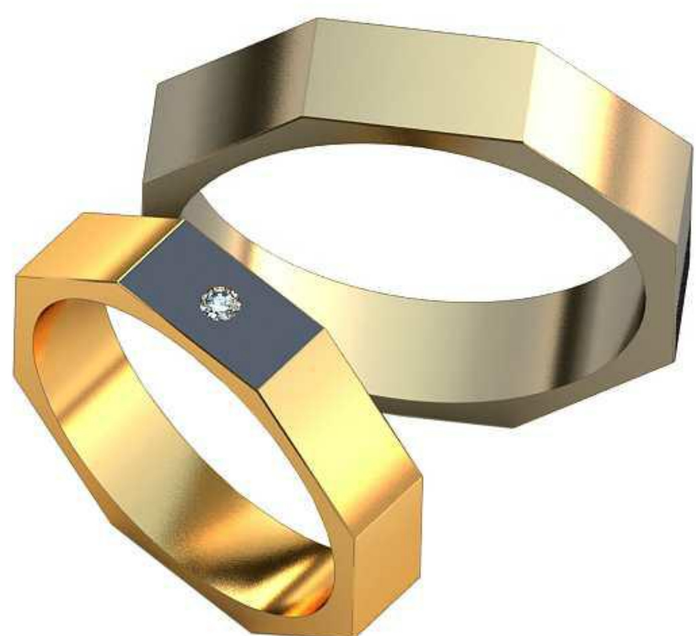
511ж/Р-20/Ш-5/Т-2,0/Кр 2.0-1шт./Вес-7,1 511м/Р-23,5/Ш-5,9/Т-2,4/Вес-11,6