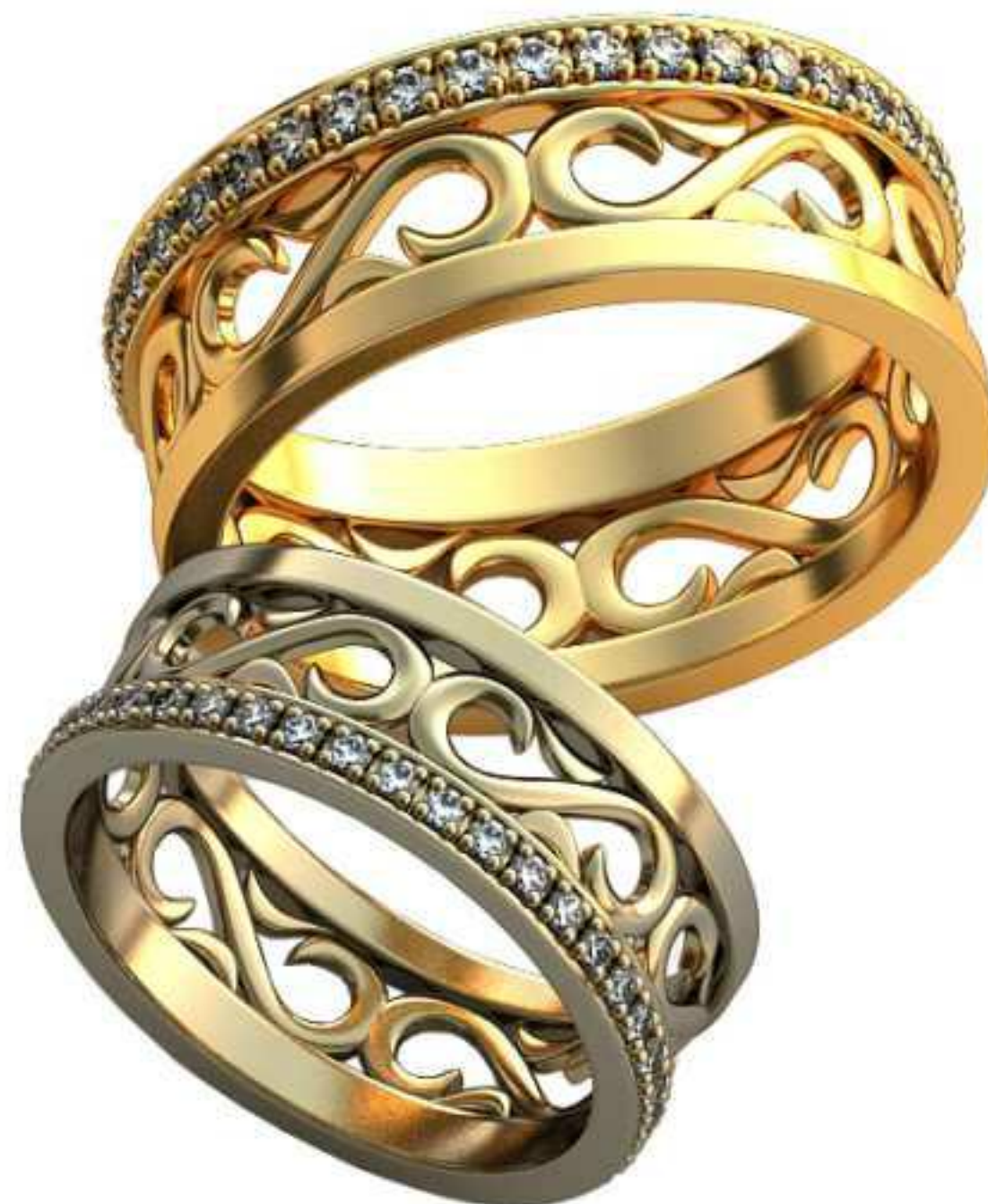
371ж/Р-17,5/Ш-7,4/Т-1,5/Кр 1,3-40шт./Вес-5,4 371м/Р-21,0/Ш-8,9/Т-1,8/Кр 1,3-40шт./Вес-9,5