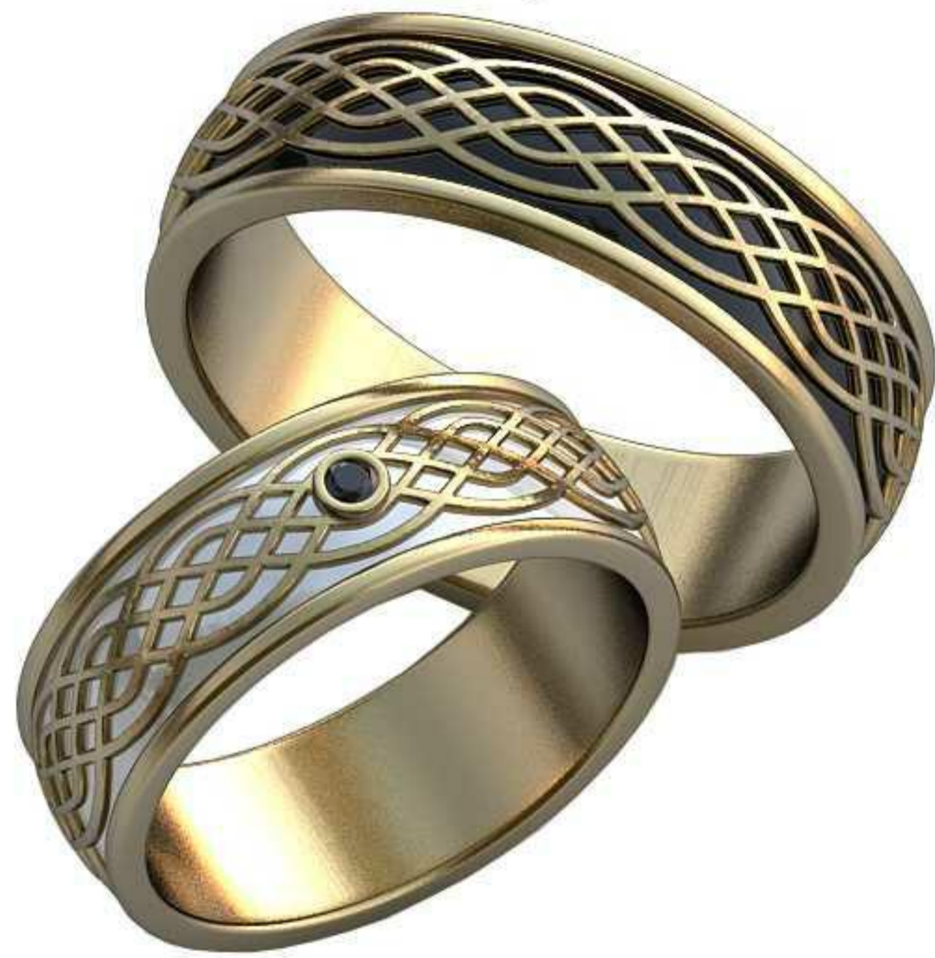
505ж/Р-17,5/Ш-6,8/Т-1,6/Кр 1.75-1шт./Вес-6,6 505м/Р-21/Ш-7/Т-1,9/Вес-9,6