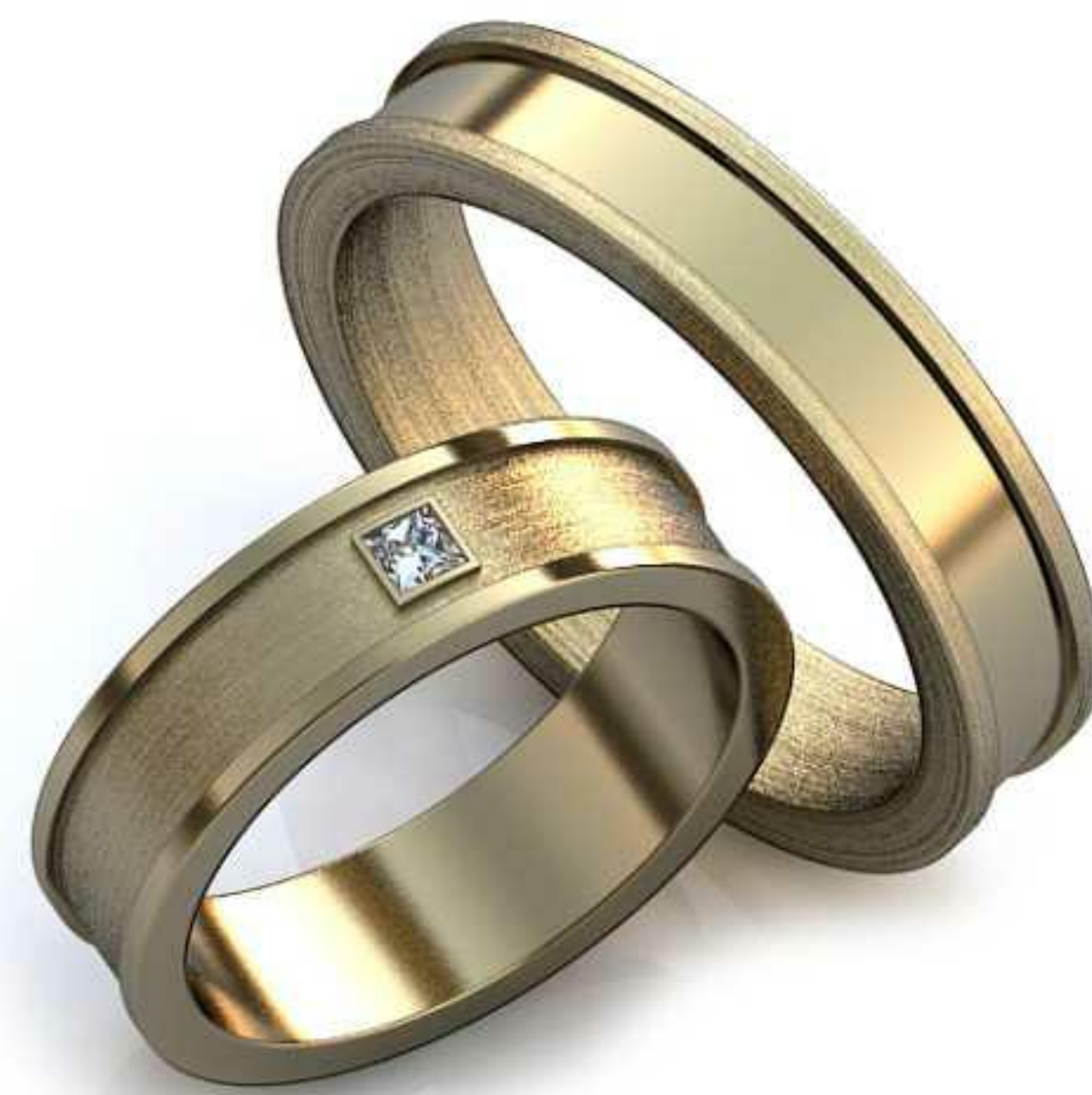
08ж/Р-16,0/Ш-5,0/Т-1,5/Пр 2.0x2.0-1шт./Вес-4,9 08м/Р-19,7/Ш-4,5/Т-1,9/Вес-6,8