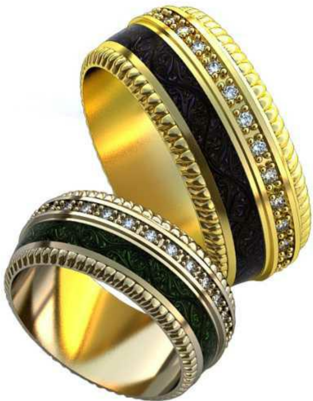
199ж/Р-15,7/Ш-7,7/Т-1,6/Кр 1.1-28шт./Вес-5,5 199м/Р-19,5/Ш-9,5/Т-2,0/Кр 1.1-28шт./Вес-10,4