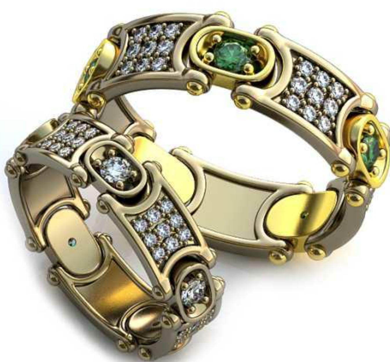
224ж/Р-16,2/Ш-6,2/Т-1,3/Кр 1.1-45шт.,2.3-5шт./Вес-3,9 224м/Р-20/Ш-7,5/Т-1,5/Кр 1.1-45шт.,2.3-5шт./Вес-7,2