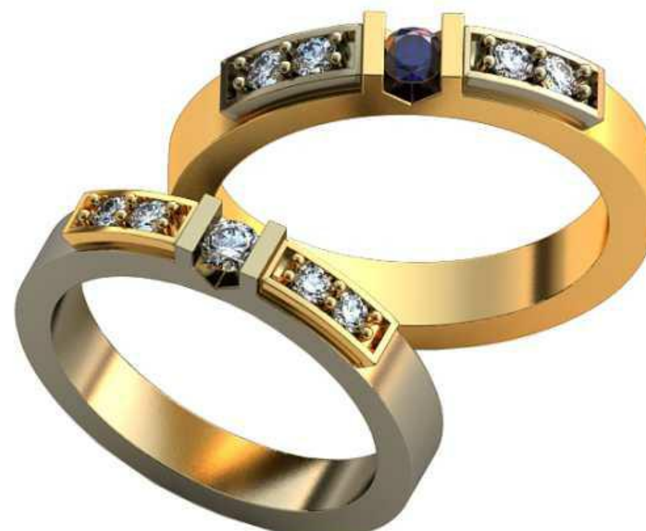
491ж/Р-17,5/Ш-3,3/Т-2,0/Кр 2.9-1шт.,2.0-4шт./Вес-5,9 491м/Р-19,2/Ш-3,6/Т-2,2/Кр 3.2-1шт.,2.25-4шт./Вес-7,8