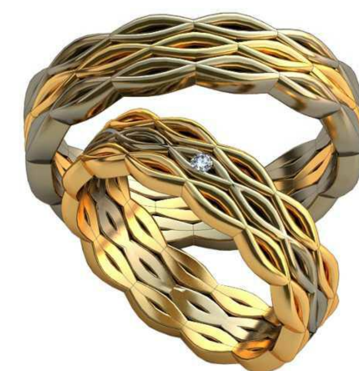
386ж/Р-16,7/Ш-5,6/Т-1,5/Кр 1.5-1шт./Вес-5,7 386м/Р-19,0/Ш-5,6/Т-1,7/Вес-7,8