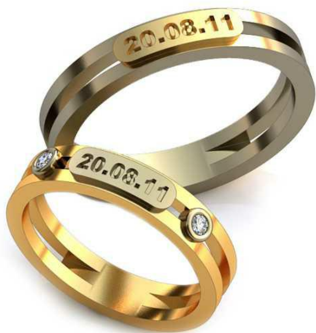
238ж/Р-17,0/Ш-4,0/Т-1,5/Кр 1.8-2шт./Вес-3,5 238м/Р-20,0/Ш-4,0/Т-1,7/Вес-4,9