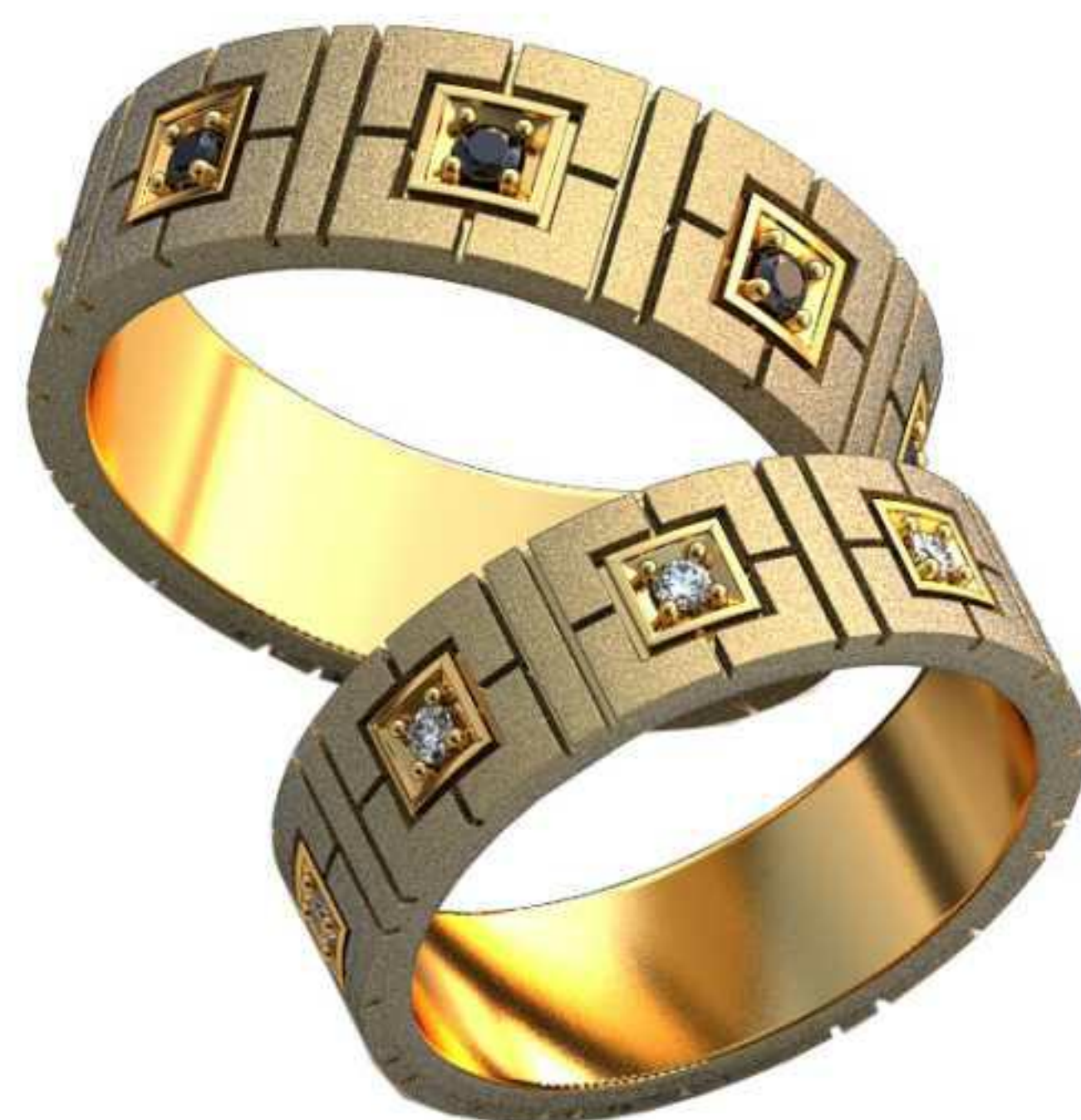
452ж/Р-18,7/Ш-6,3/Т-1,5/Кр 1.6-8шт./Вес-7,2 452м/Р-20,7/Ш-7/Т-1,6/Кр 1.6-8шт./Вес-10