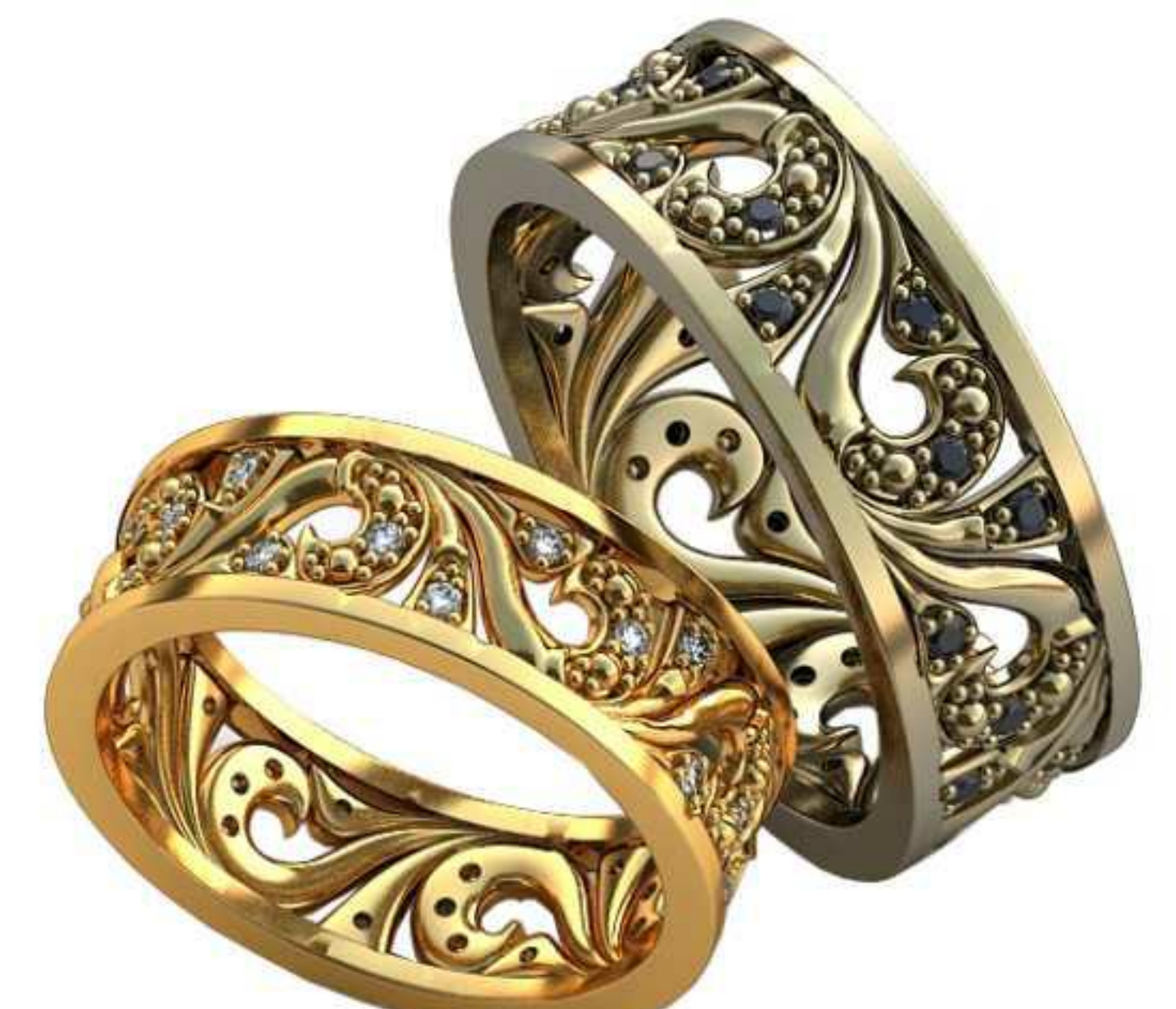
492ж/Р-15,7/Ш-6/Т-1,5/Кр 1.2-24шт./Вес-3,9 492м/Р-18,2/Ш-7/Т-1,7/Кр 1.2-24шт./Вес-6,3