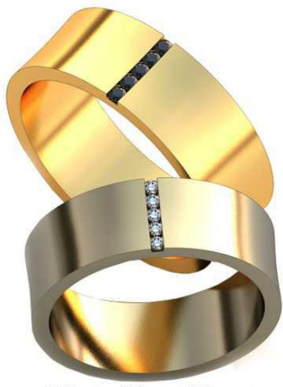
136ж/Р-17,0/Ш-6,5/Т-1,3/Кр 1.3-5шт./Вес-6,1 136м/Р-18,5/Ш-7,1/Т-1,4/Кр 1.4-5шт./Вес-7,9