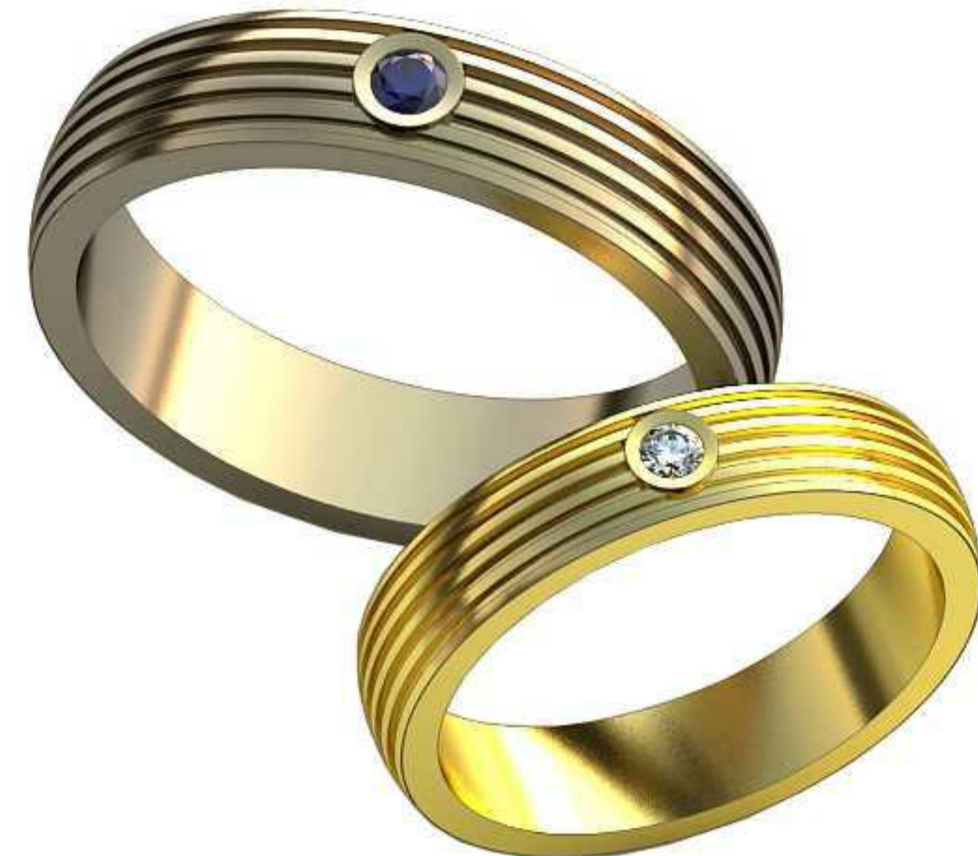
474ж/Р-16,2/Ш-4/Т-1,5/Кр 2.0-1шт./Вес-10,0 474м/Р-19,2/Ш-4,8/Т-1,8/Кр 2.3-1шт./Вес-6,7