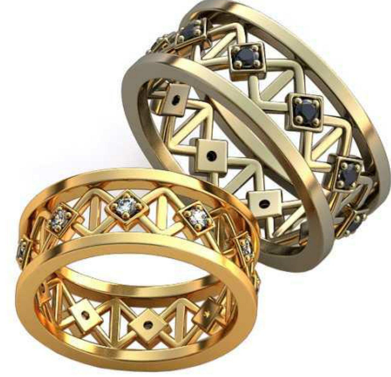
366ж/Р-18,0/Ш-8,0/Т-1,7/Кр 1,9-10шт./Вес-6,0 366м/Р-20,2/Ш-9,0/Т-1,9/Кр 1,9-10шт./Вес-8,6