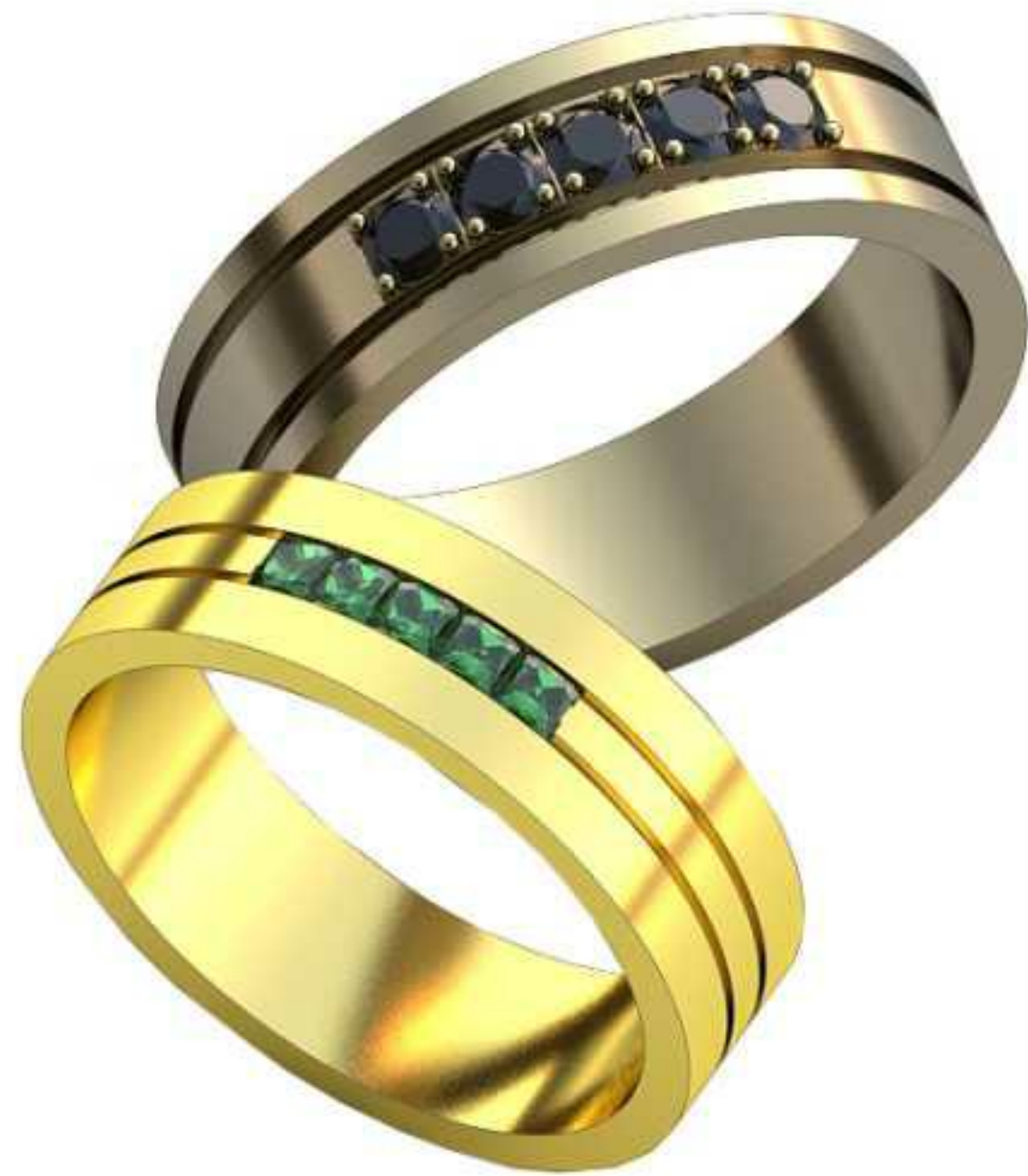
133ж/Р-18,5/Ш-6/Т-1,4/Кр 2.0-5шт./Вес-6,8 133м/Р-20,0/Ш-6,45/Т-1,5/Кр 2,8-5шт./Вес-8,1