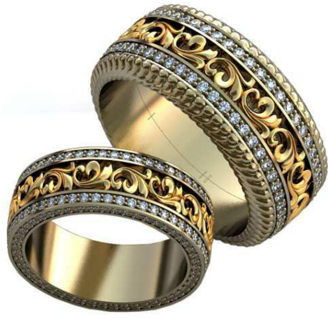
467ж/Р-17/Ш-7,3/Т-2,1/Кр 1.1-204шт./Вес-8,2 467м/Р-21/Ш-11/Т-2,5/Кр 1.3-102шт./Вес-19,7