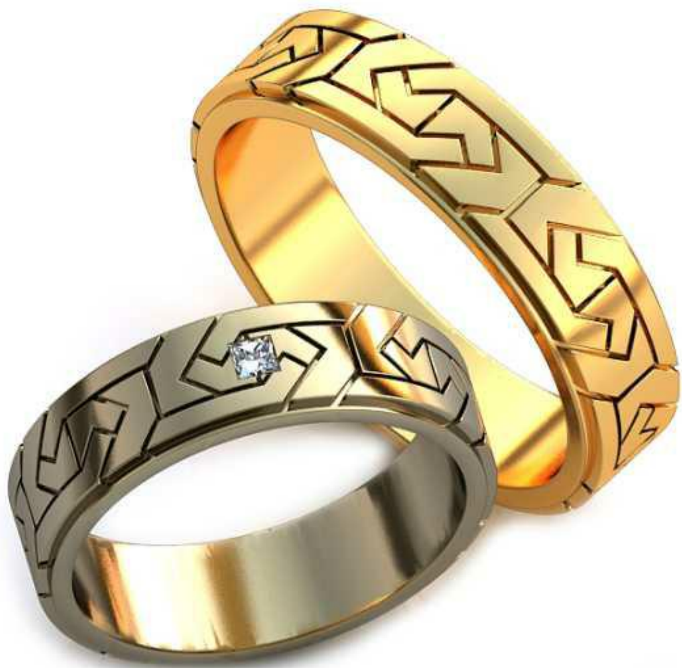
286ж/Р-18,2/Ш-6,0/Т-1,6/Пр 2.0x2.0-1шт./Вес-6,9 286м/Р-21,2/Ш-6/Т-1,8/Вес-9,5