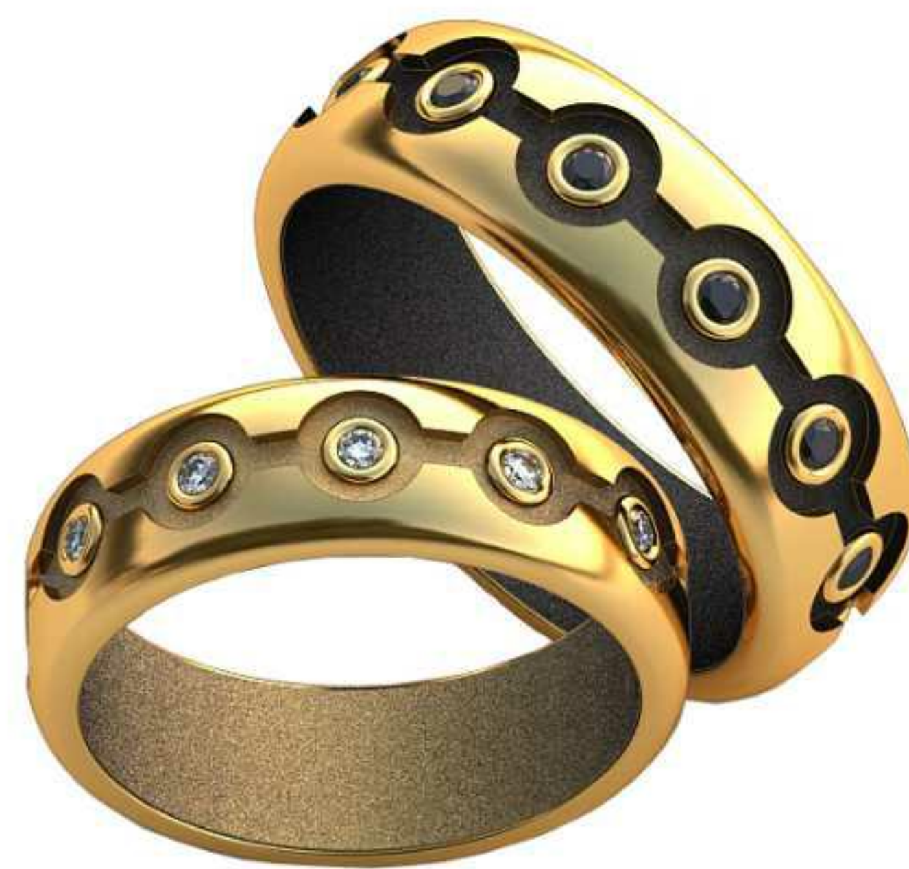
336ж/Р-16,5/Ш-6,0/Т-1,7/Кр 1.5-12шт./Вес-8,1 336м/Р-18,5/Ш-6,7/Т-1,7/Кр 1.5-12шт./Вес-11,3