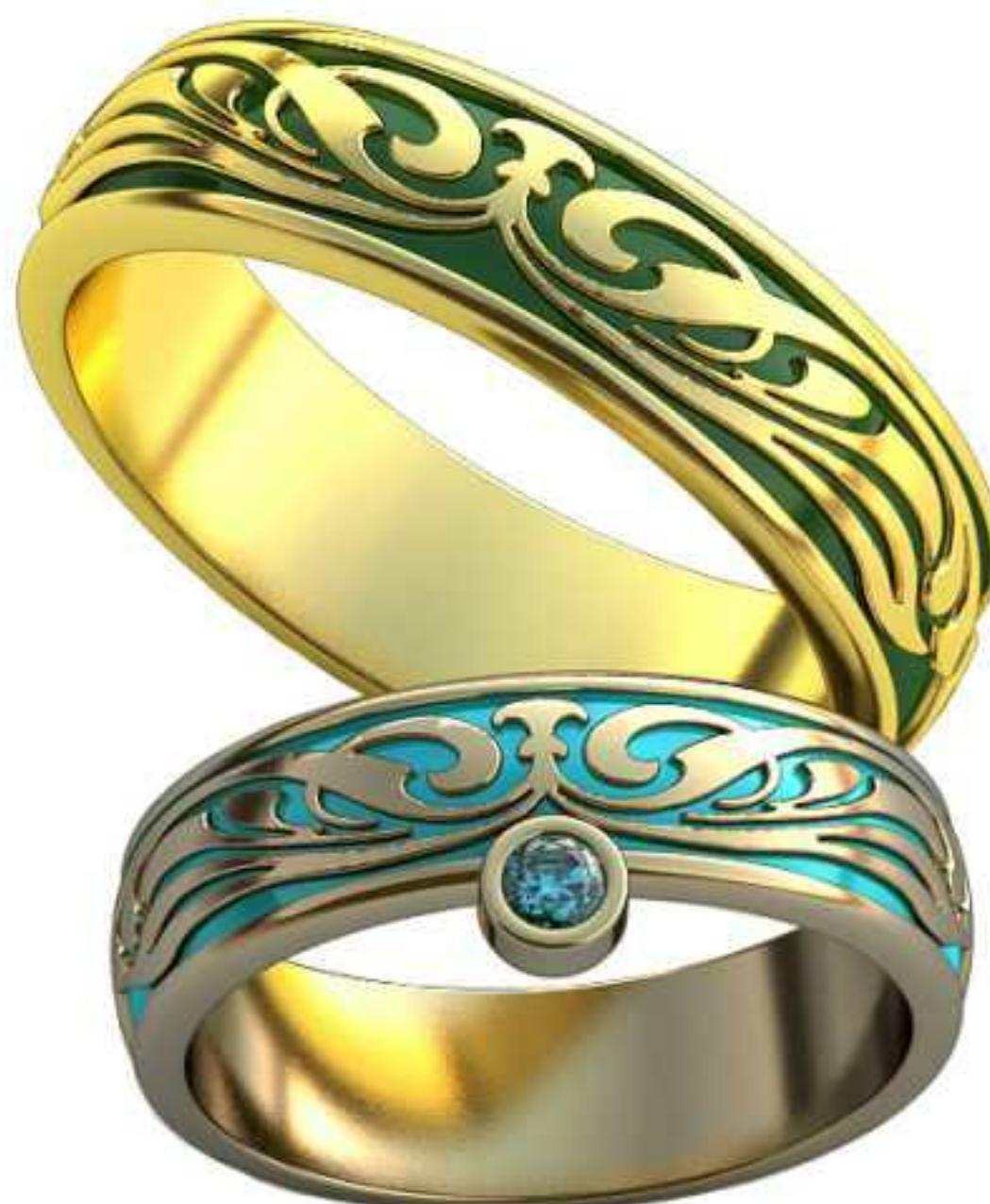
305ж/Р-19,0/Ш-6,2/Т-1,8/Кр 2.6-1шт./Вес-8,6 305м/Р-23,0/Ш-6,9/Т-2,1/Вес-13,5