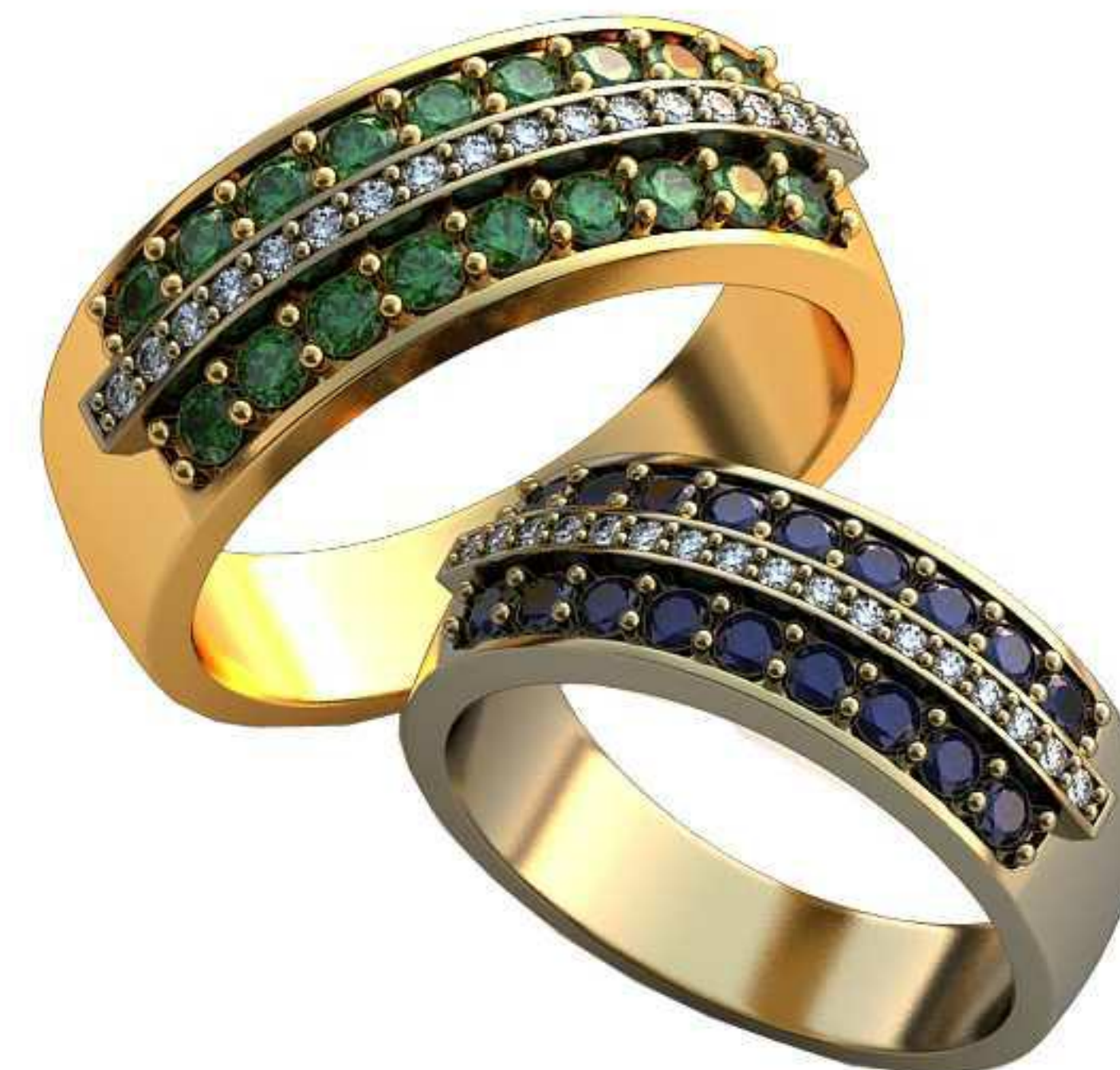
462ж/Р-17/Ш-7/Т-1,6/Кр 1.9-18шт., 1-17шт./Вес-6,9 462м/Р-19,5/Ш-8/Т-1,8/Кр 2.25-18шт., 1.25-17шт./Вес-10,6