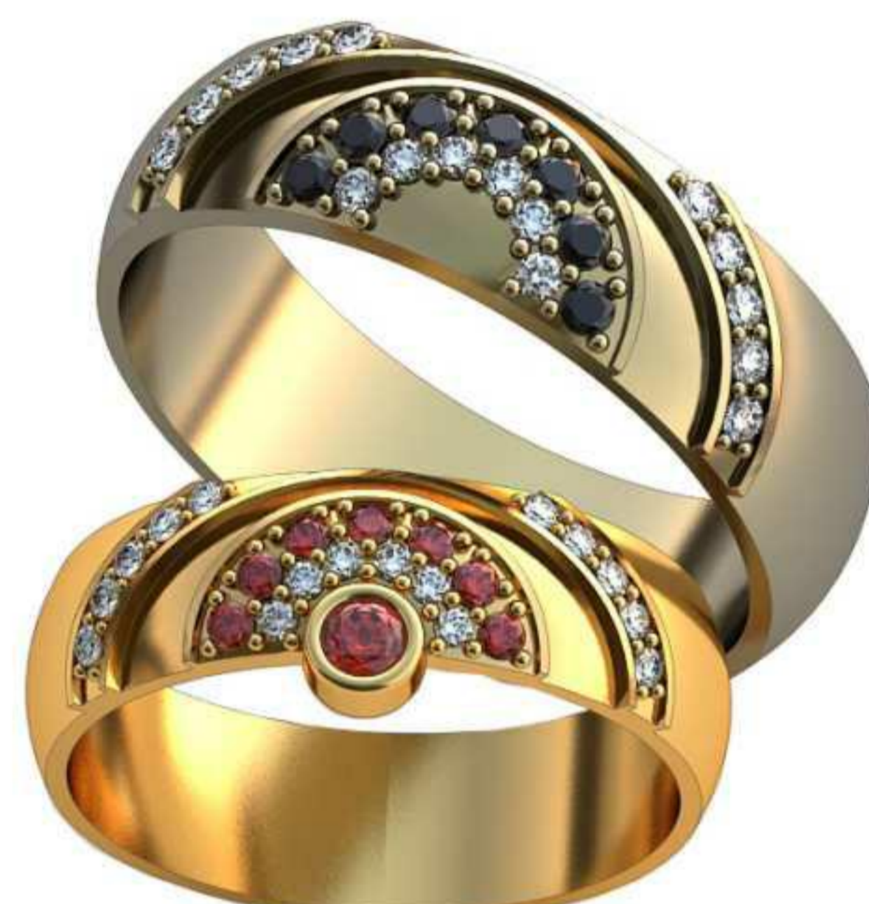
354ж/Р-18,7/Ш-6,0/Т-1,4/Кр 2.6-1,1.5-7,1.2-16шт./Вес-6,2 354м/Р-22,0/Ш-7,0/Т-1,6/Кр 1.5-7,1.2-16шт./Вес-9,5