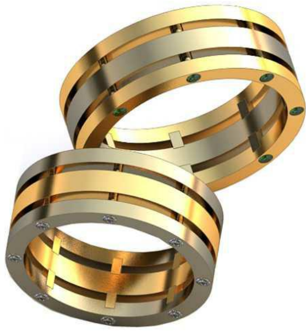
466ж/Р-18,2/Ш-7,1/Т-1,7/Кр 1.4-16шт./Вес-7,9 466м/Р-16/Ш-7,1/Т-1,7/Кр 1.4-16шт./Вес-6,9