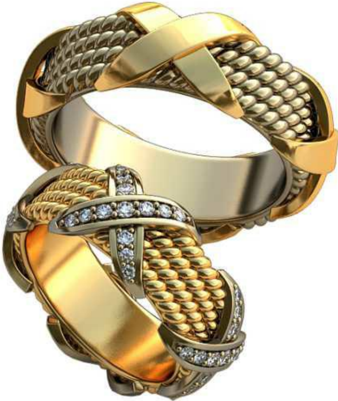
439ж/Р-17,2/Ш-9/Т-3/Кр 1.3-32;1.45-16;1.65-4/Вес-13,1 439м/Р-20,2/Ш-8,7/Т-3,7/Вес-20,0