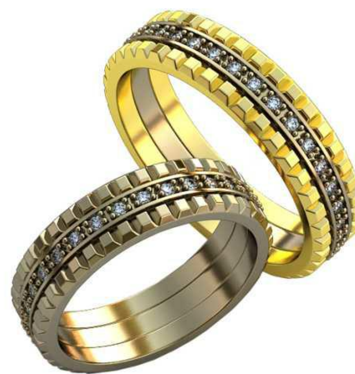
398ж/Р-17,5/Ш-5,5/Т-1,5/Кр 1.2-30шт./Вес-6,0 398м/Р-20,0/Ш-5,6/Т-1,8/Кр 1.2-33шт./Вес-7,3