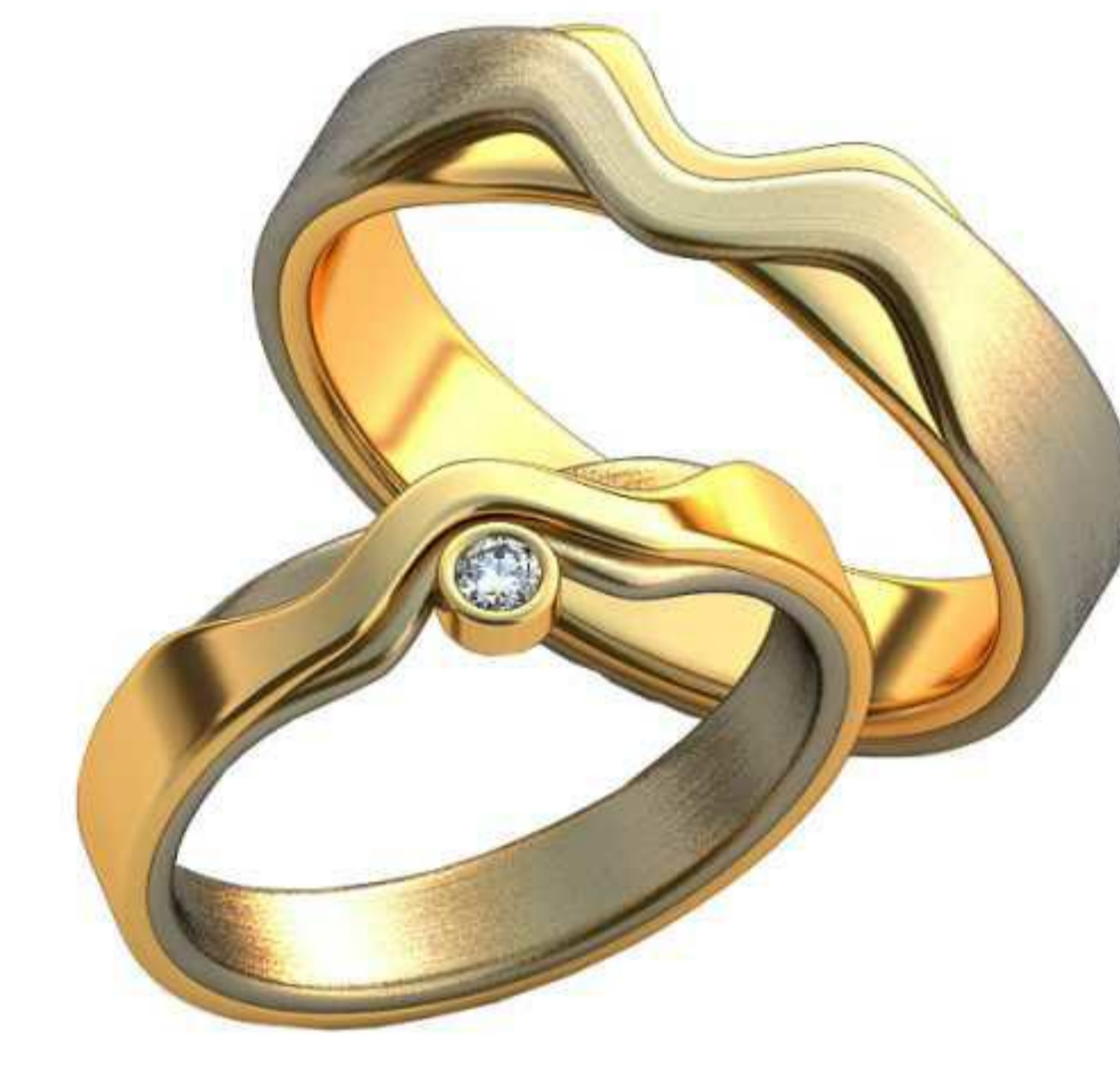
324ж/Р-18,0/Ш-3,8/Т-1,6/Кр 2.3-1шт./Вес-5,5 324м/Р-20,2/Ш-5,2/Т-1,8/Вес-9,4