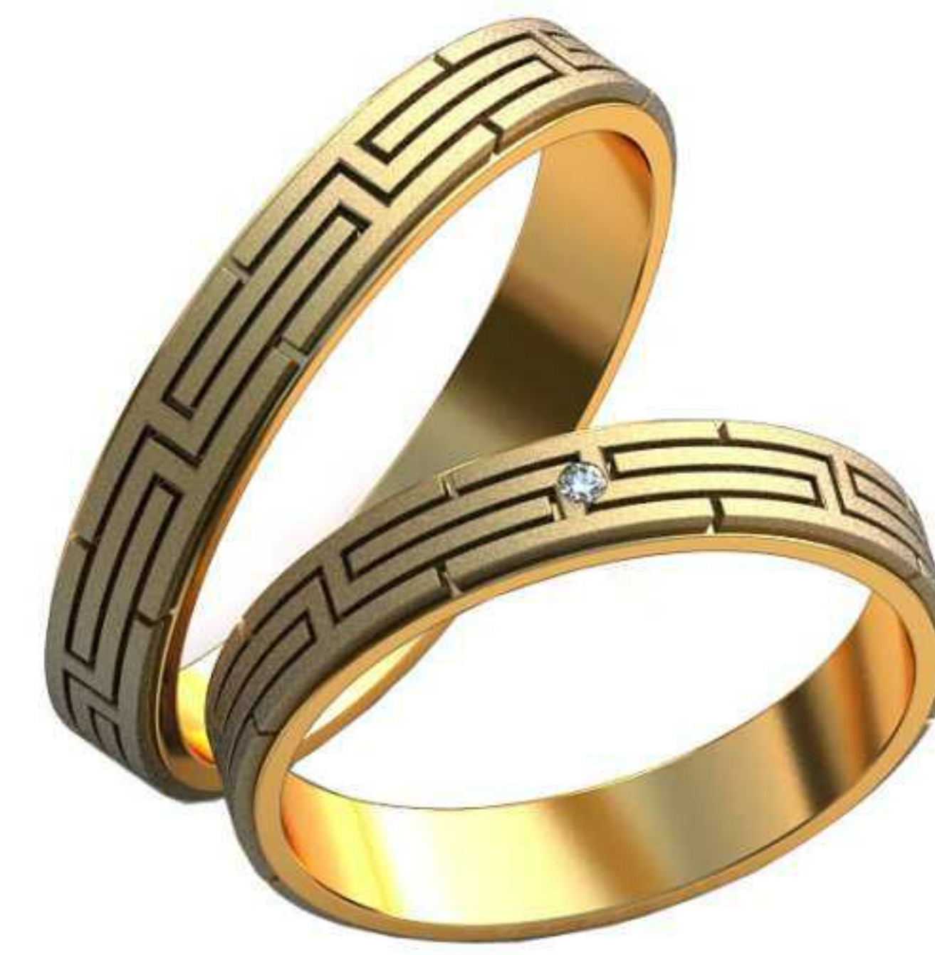
453ж/Р-23,7/Ш-5,2/Т-1,6/Кр 1.7-1шт./Вес-7,8 453м/Р-27,2/Ш-5,2/Т-1,9/Вес-10,3