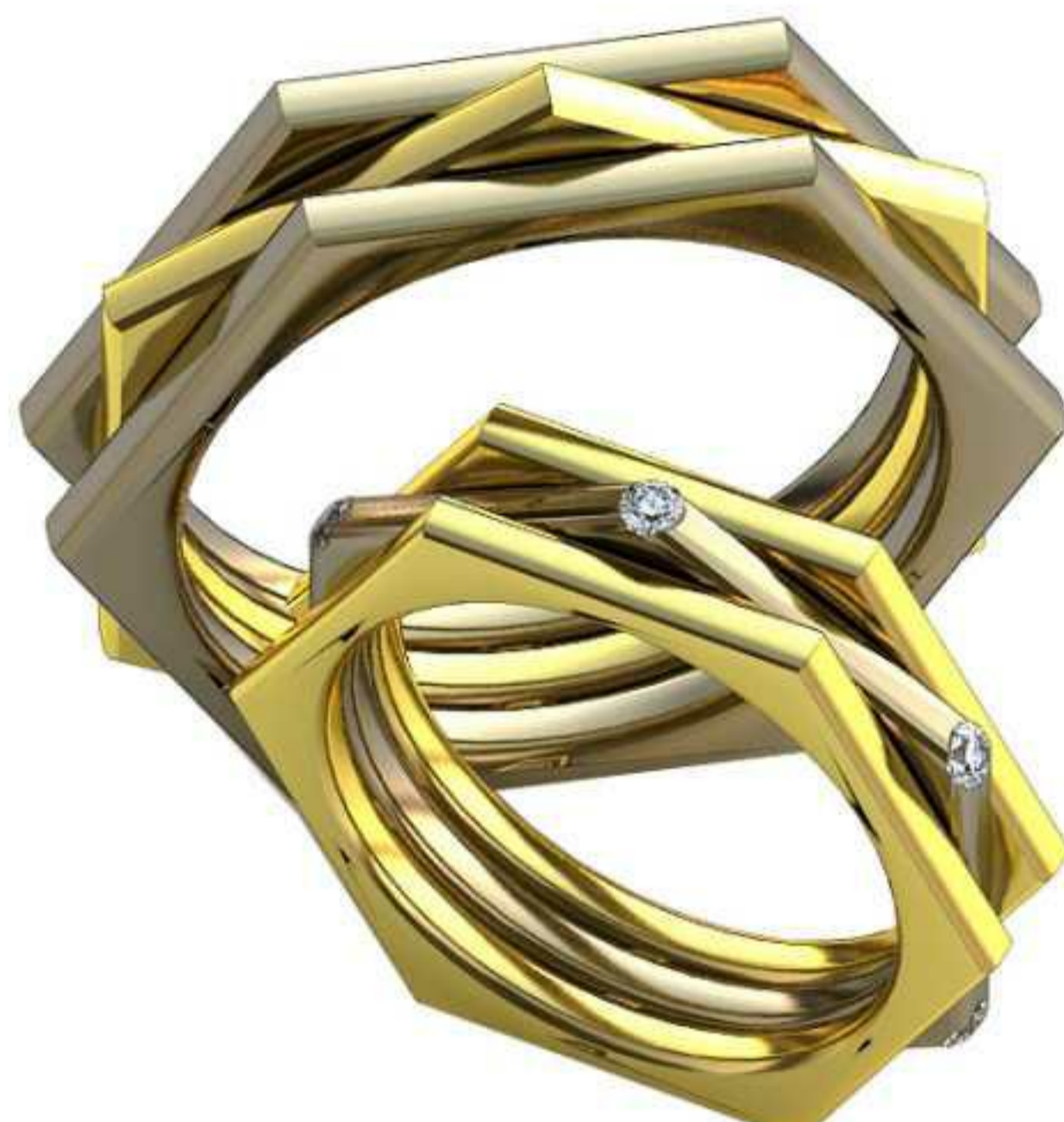
443ж/Р-11,2/Ш-3,6/Т-2/Кр 1.2-6шт./Вес-2,1 443м/Р-13,7/Ш-4/Т-2,4/Вес-3,6