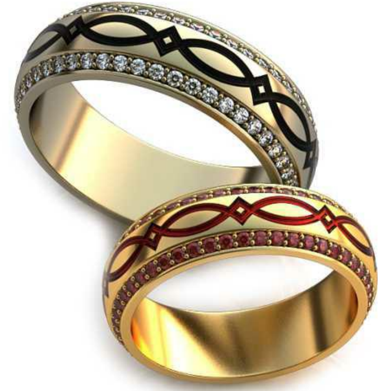
81ж/Р-16,5/Ш-5,7/Т-1,7/Кр 1.4-94шт./Вес-5,0 81м/Р-19,0/Ш-6,5/Т-1,9/Кр 1.4-94шт./Вес-7,4