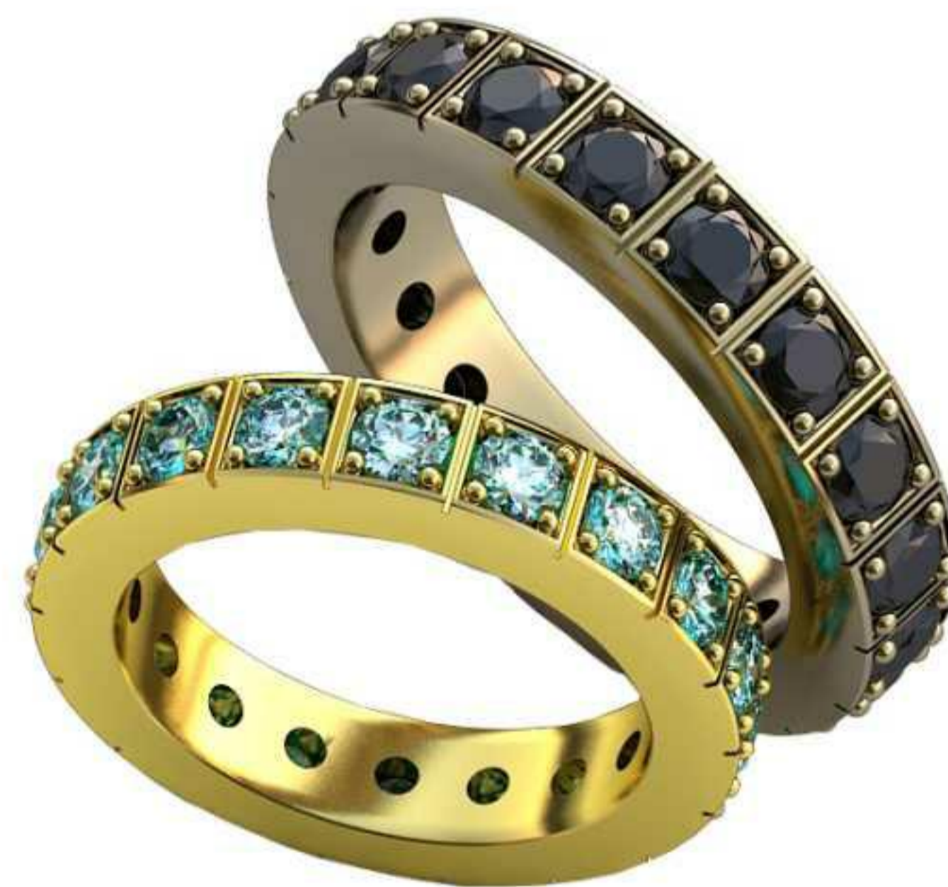
176ж/Р-16,5/Ш-4,2/Т-2,5/Кр 3.0-18шт./Вес-6,7 176м/Р-18,5/Ш-4,7/Т-2,8/Кр 3.0-18шт./Вес-9,4