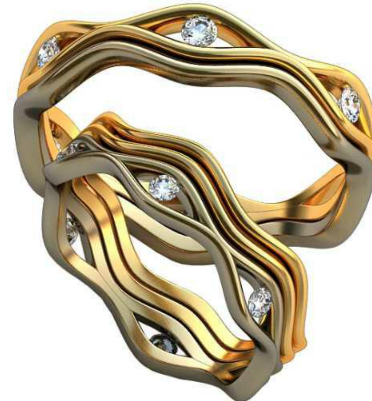
389ж/Р-16,7/Ш-5,8/Т-1,5/Кр 1.9-6шт./Вес-3,9 389м/Р-19,7/Ш-5,5/Т-1,7/Кр 2.3-6шт./Вес-4,9