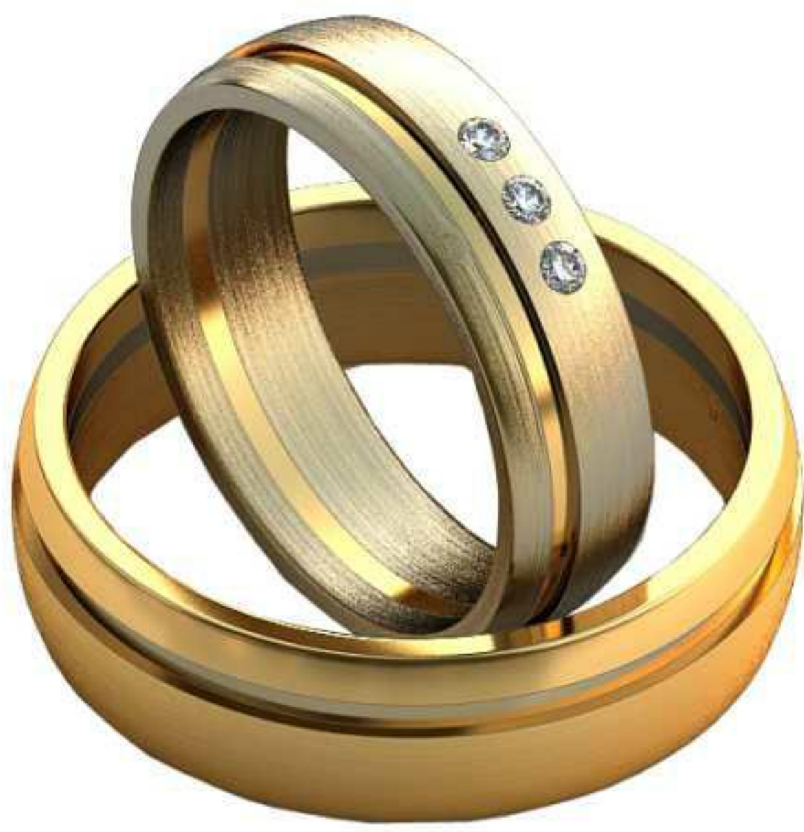
332ж/Р-16,0/Ш-5,0/Т-1,3/Кр 1.5-3шт./Вес-3,6 332м/Р-19,2/Ш-6,0/Т-1,5/Вес-6,3