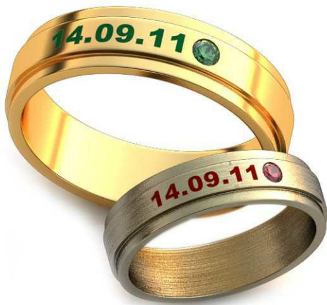
262ж/Р-17,0/Ш-5,0/Т-1,3/Кр 2.0-1шт./Вес-4,3 262м/Р-21,7/Ш-6,4/Т-1,7/Кр 2.6-1шт./Вес-9,2