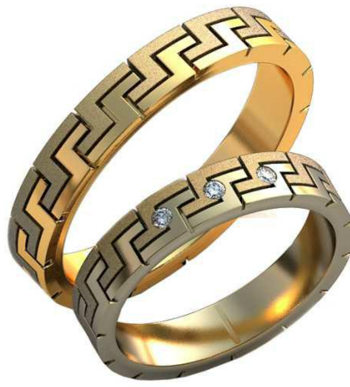
455ж/Р-17,2/Ш-4/Т-1,5/Кр 1.6-3шт./Вес-4,2 455м/Р-21,2/Ш-4/Т-1,8/Вес-6,3