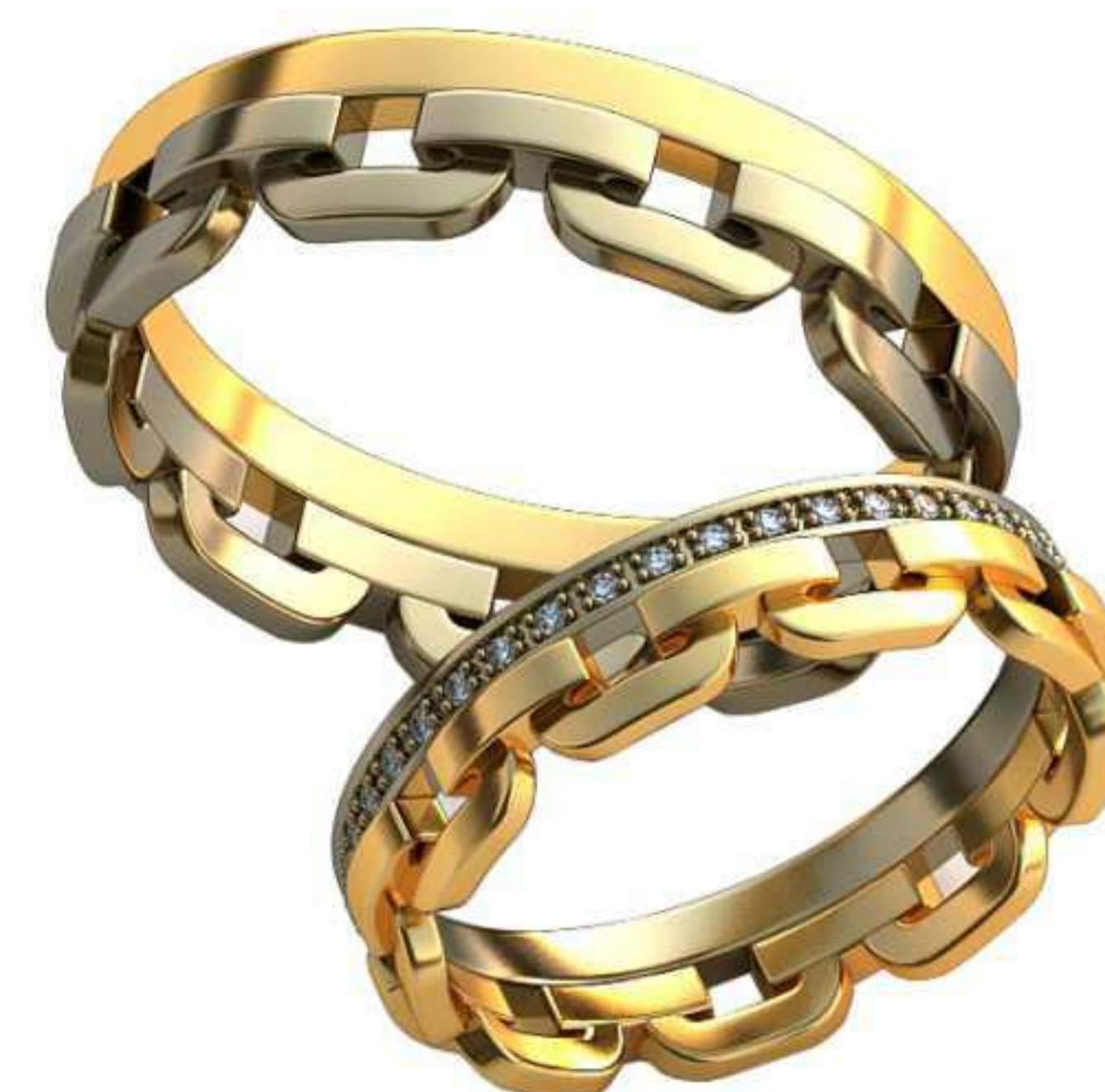
418ж/Р-17,2/Ш-4/Т-1,5/Кр 1.5-1шт./Вес-3,7 419ж/Р-16,5/Ш-4/Т-1,6/Кр 3.0-1шт./Вес-5,6 420ж/Р-19,7/Ш-5,4/Т-2,0/Кр 1.0-40шт./Вес-6,1 418м/Р-21/Ш-5/Т-1,7/Вес-7,0 419м/Р-18,7/Ш-5,8/Т-1,7/Вес-8,5 420м/Р-23,5/Ш-6,2/Т-2,4/Вес-13,7