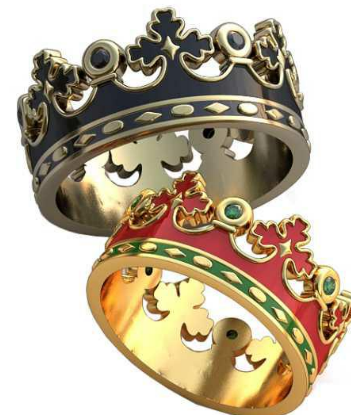
429ж/Р-14,5/Ш-7,7/Т-1,2/Кр 1.25-6шт./Вес-3,6 429м/Р-16,2/Ш-8,6/Т-1,6/Кр 1.4-6шт./Вес-5,0