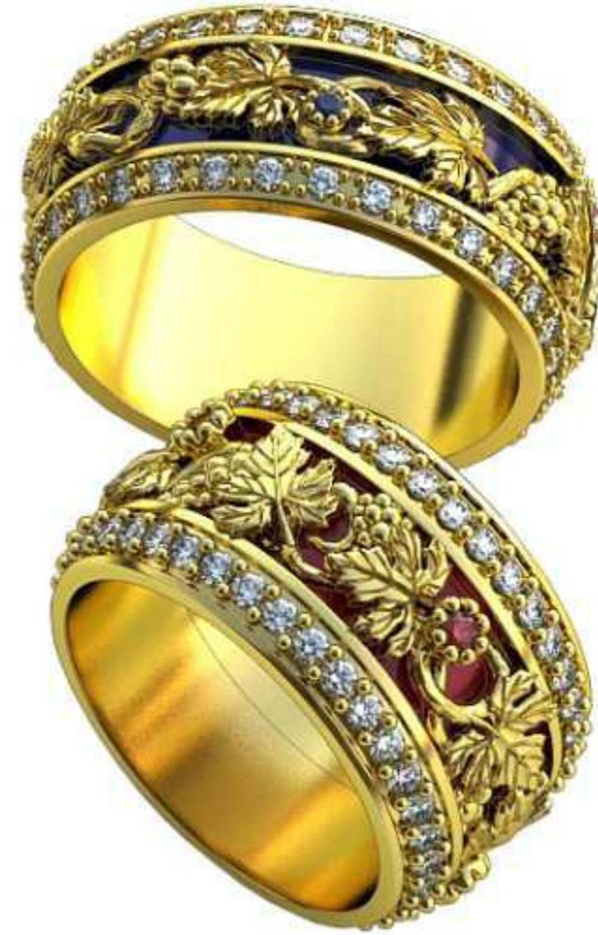
482ж/Р-18/Ш-12,5/Т-1,8/Кр 1.65-77шт./Вес-13,9 482м/Р-20/Ш-10/Т-2,5/Кр 1.45-67шт./Вес-12,4