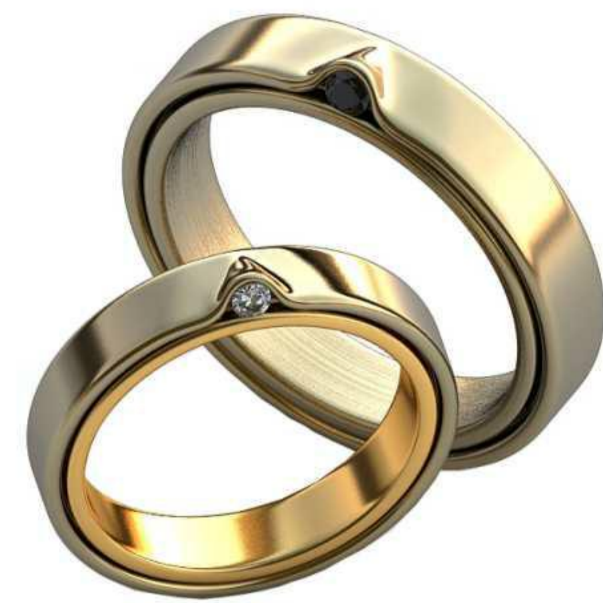
323ж/Р-17,0/Ш-4,0/Т-2,1/Кр 2.0-1шт./Вес-6,3 323м/Р-20,5/Ш-4,7/Т-2,5/Кр 2.4-1шт./Вес-11,0