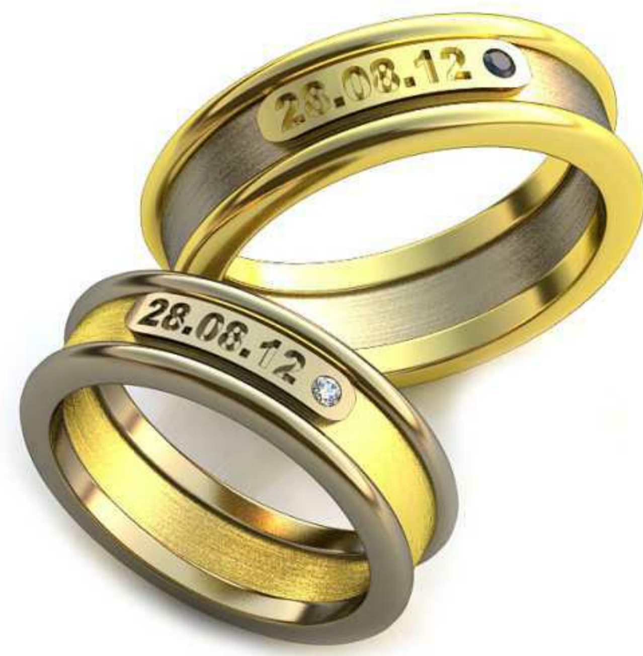
239ж/Р-17,0/Ш-6,0/Т-1,9/Кр 1.5-1шт./Вес-6,6 239м/Р-19,0/Ш-6,7/Т-2/Кр 1.7-1шт./Вес-9,2