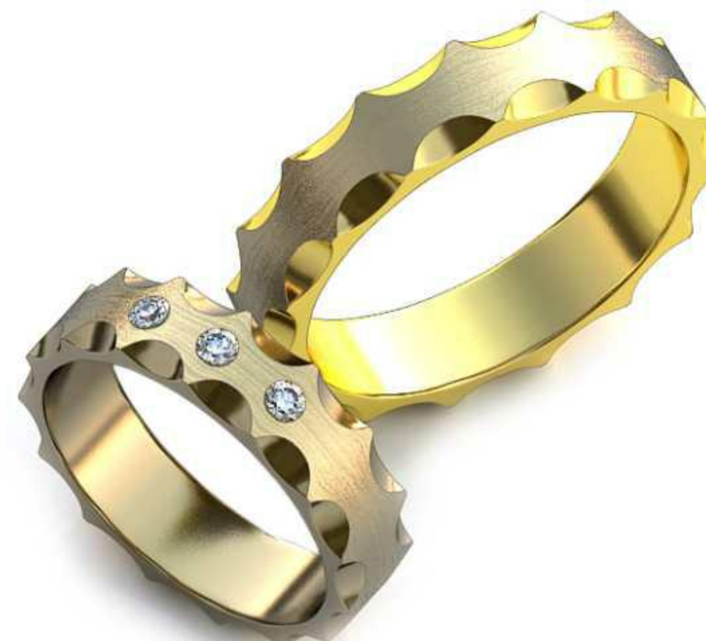
21ж/Р-17,0/Ш-5,0/Т-1,5/Кр 2.0-3шт./Вес-5,5 21м/Р-20,5/Ш-5,0/Т-1,8/Вес-7,8