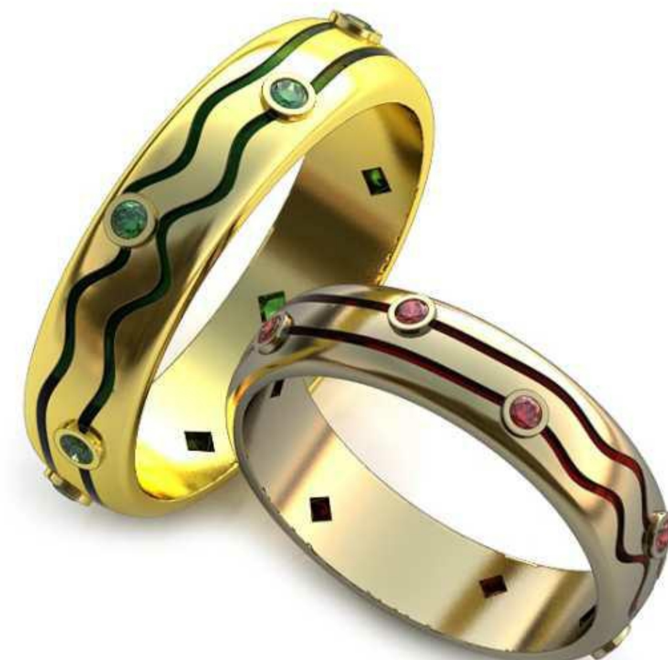
87ж/Р-17,7/Ш-5,0/Т-1,7/Кр 1.6-8шт./Вес-4,3 87м/Р-20,2/Ш-5,6/Т-2,0/Кр 1.6-8шт./Вес-6,4