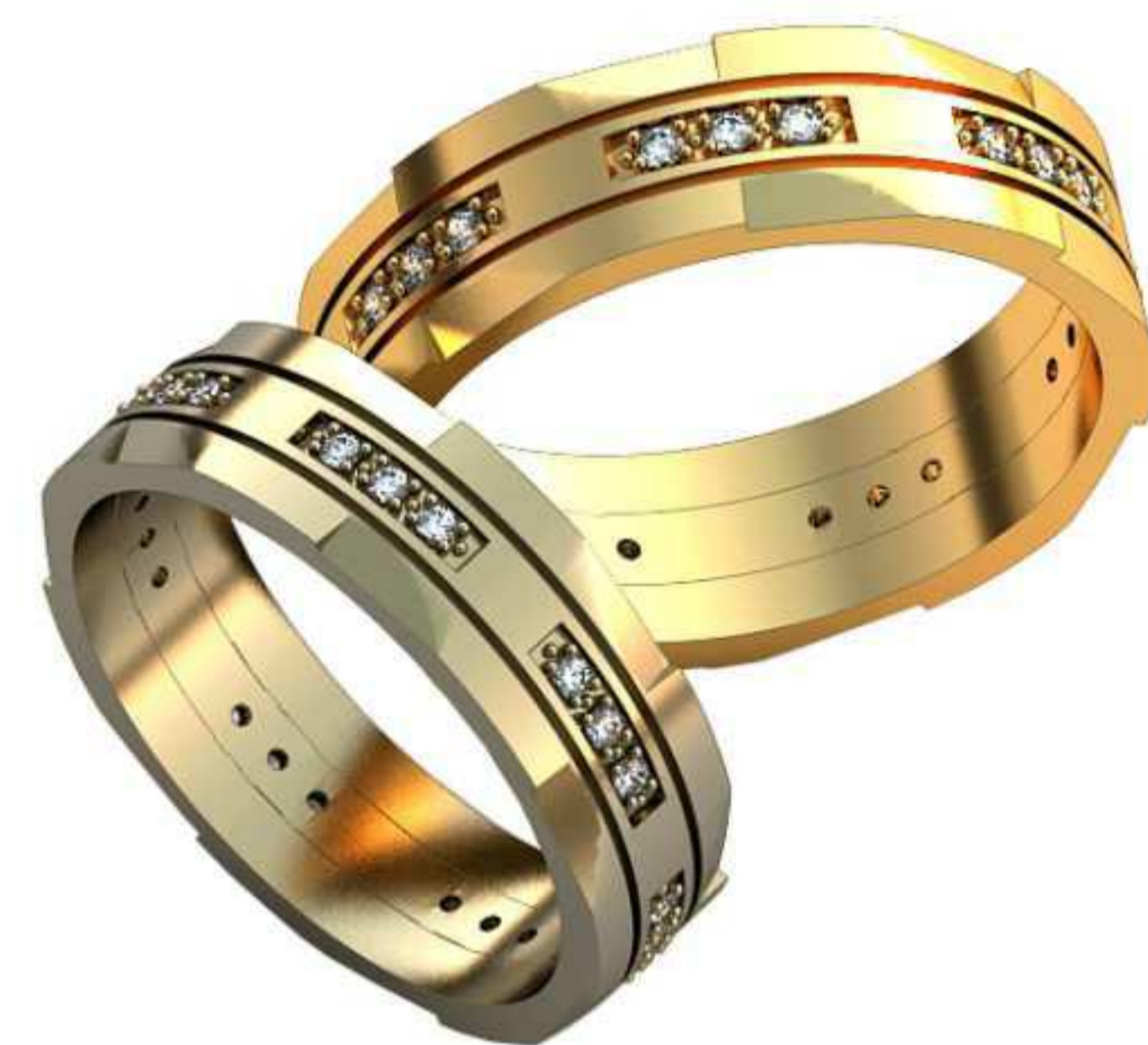
144ж/Р-18,5/Ш-5,7/Т-1,5/Кр 1.5-21шт./Вес-5,8 144м/Р-19,2/Ш-6,3/Т-1,7/Кр 1.2-21шт./Вес-7,5