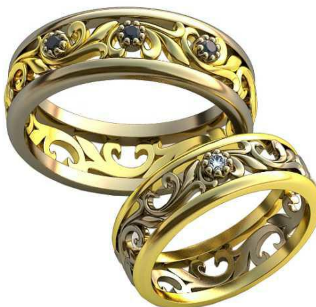
509ж/Р-17/Ш-6,4/Т-1,6/Кр 2.0-1шт./Вес-4,3 509м/Р-20,2/Ш-7,6/Т-2,0/Кр 2.0-3шт./Вес-7,3