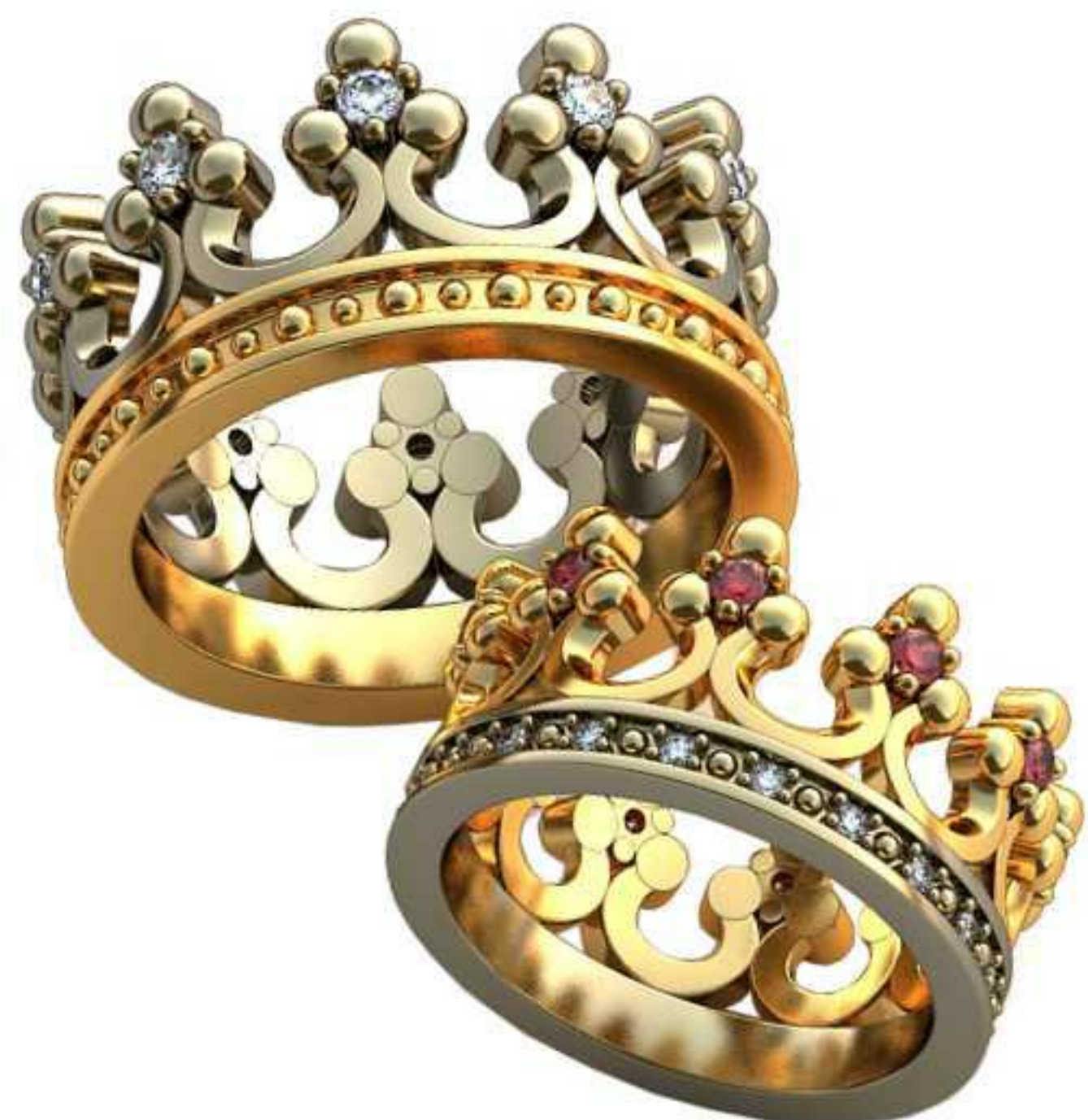
427ж/Р-16/Ш-10/Т-1,8/Кр 1.9-10шт.,1.2-20шт./Вес-7,8 427м/Р-18,5/Ш-11,7/Т-2,15/Кр 2.2-10шт./Вес-12,5