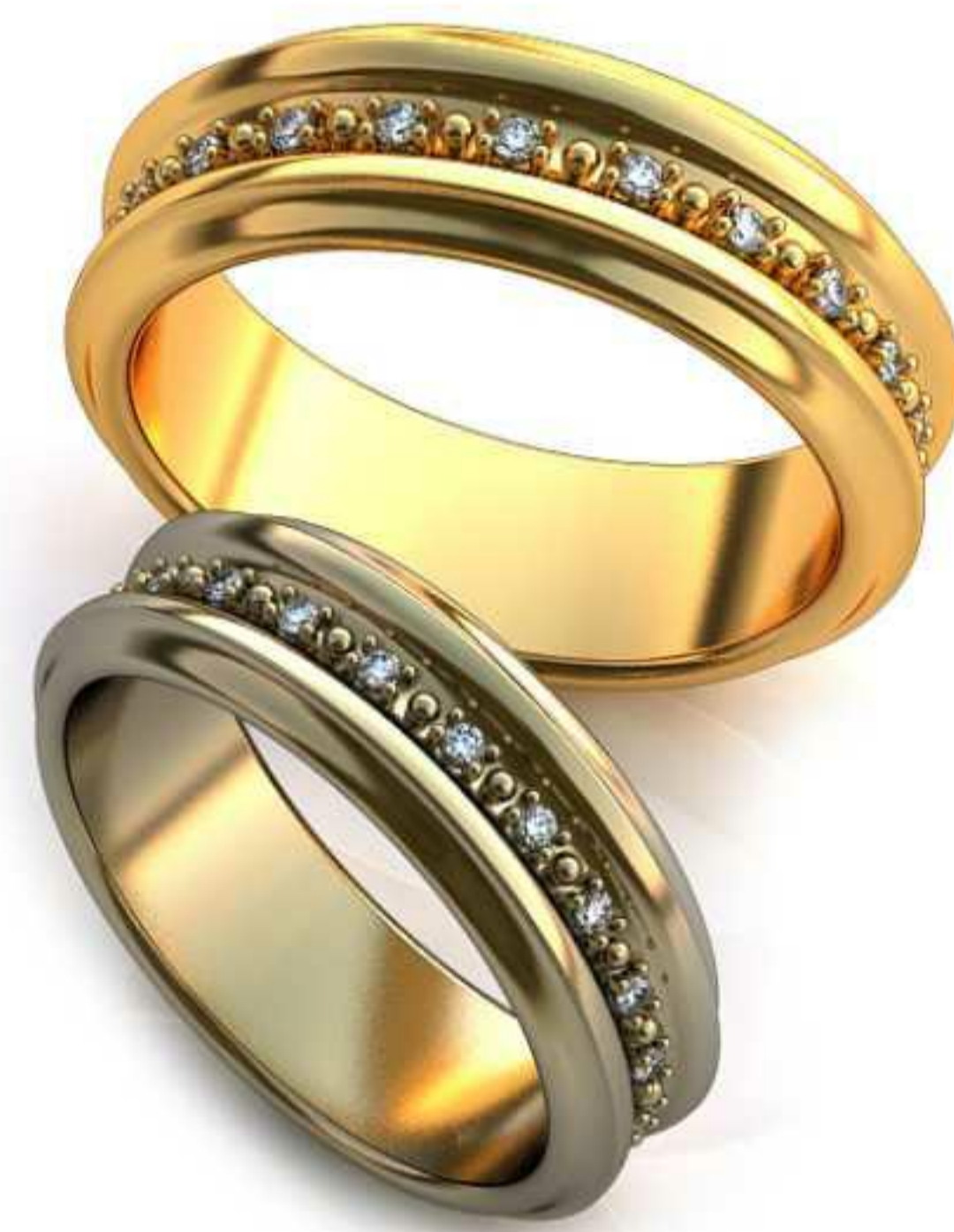
53ж/Р-19,0/Ш-7/Т-2,0/Кр 1.3-21шт./Вес-8,8 53м/Р-21,5/Ш-7,7/Т-2,3/Кр 1.5-21шт./Вес-12,3