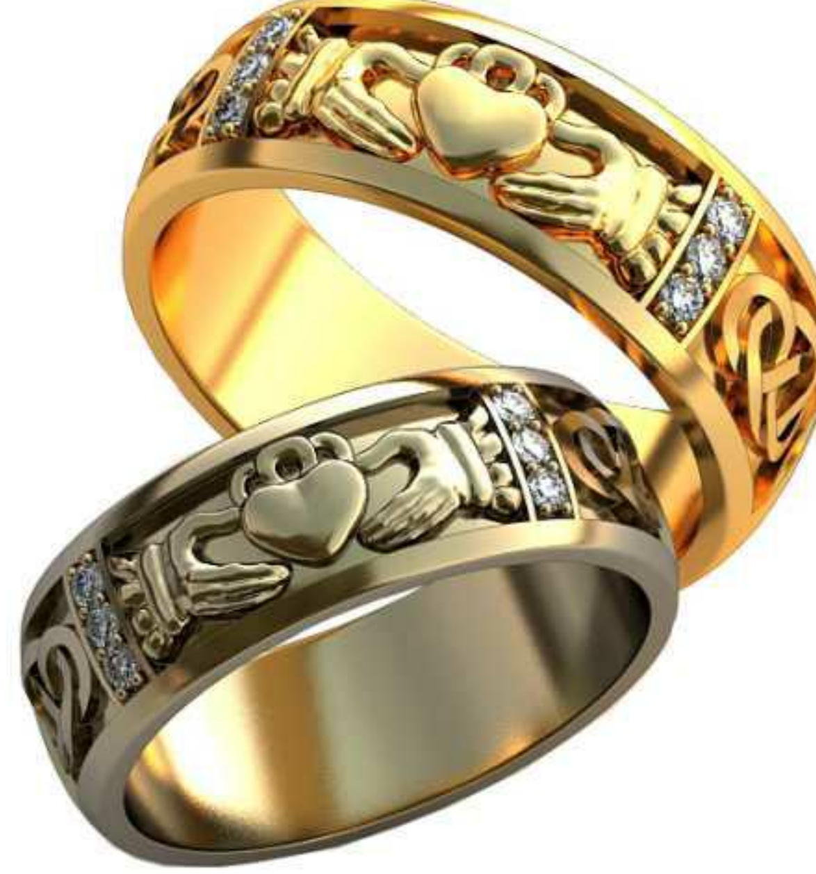
125ж/Р-18,5/Ш-7,0/Т-1,6/Кр 1.6-6шт./Вес-7,4 125м/Р-20,0/Ш-7,6/Т-1,8/Кр 1.6-6шт./Вес-9,5