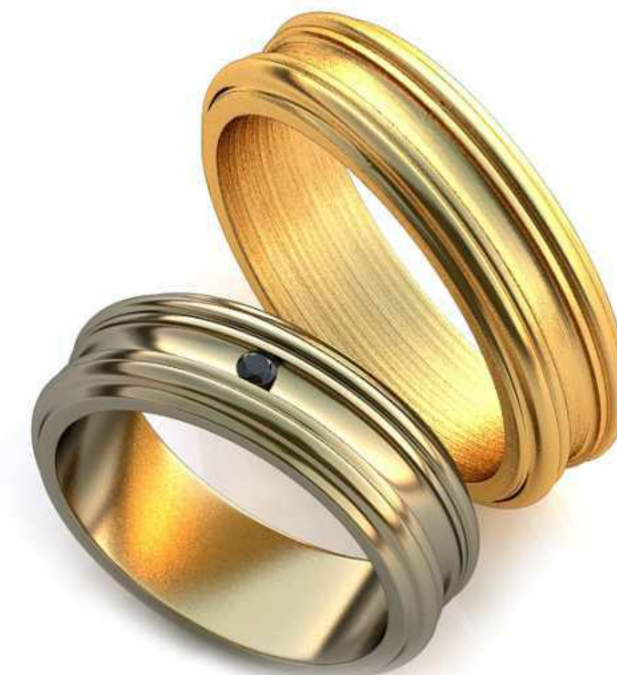
267ж/Р-16,0/Ш-6,0/Т-1,7/Кр 1.75-1шт./Вес-5,8 267м/Р-18,5/Ш-6,0/Т-2,0/Вес-7,9