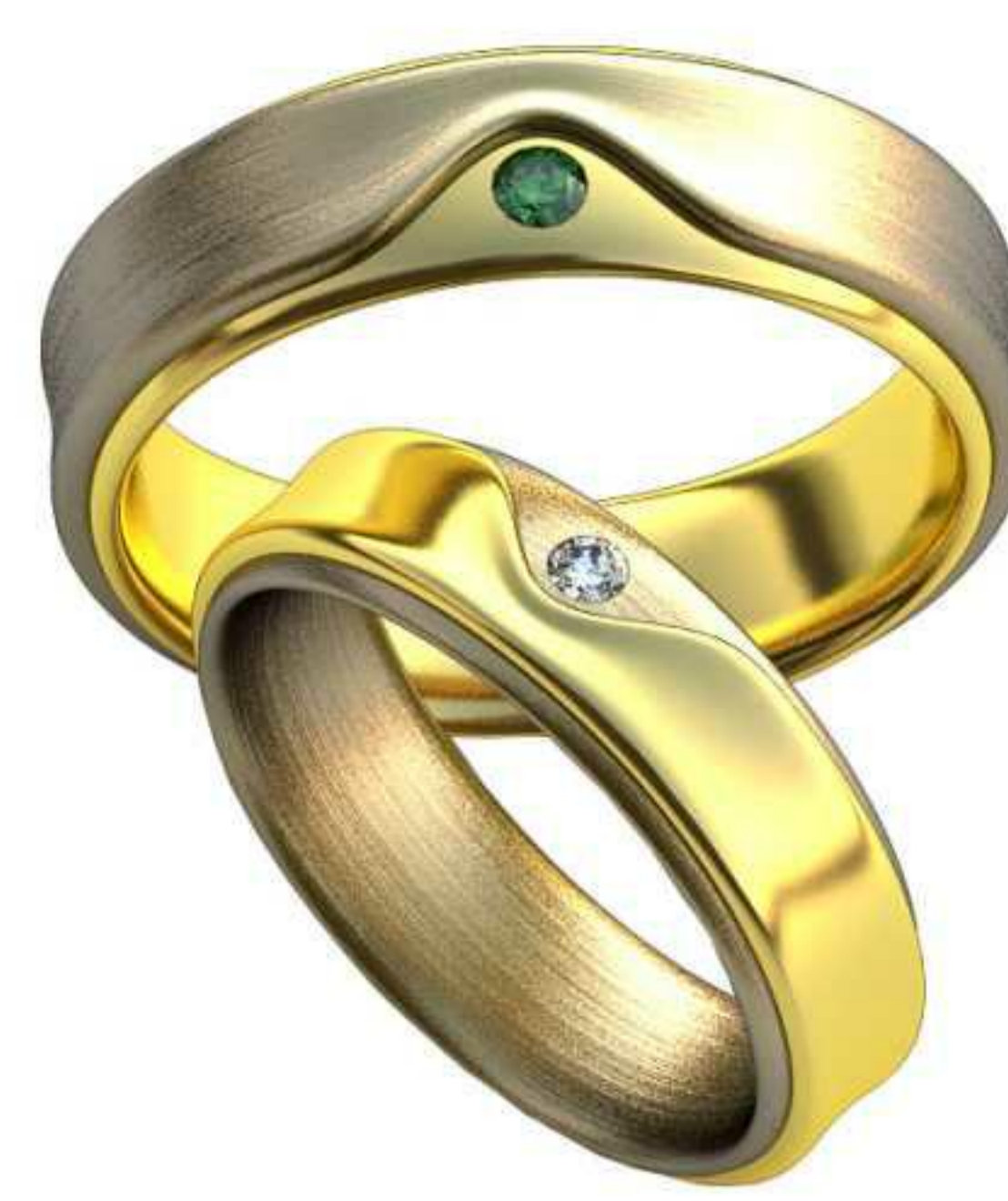
348ж/Р-17,2/Ш-5,7/Т-1,8/Кр 2.0-1шт./Вес-9,1 348м/Р-19,2/Ш-6,6/Т-2,1/Кр 2.3-1шт./Вес-14,1