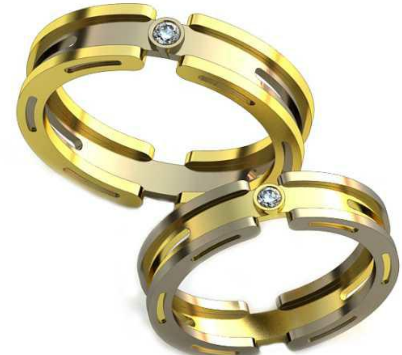
129ж/Р-19,2/Ш-5,1/Т-2,1/Кр 2.4-1шт./Вес-5,8 129м/Р-22,0/Ш-5,8/Т-2,5/Кр 2.7-1шт./Вес-8,6