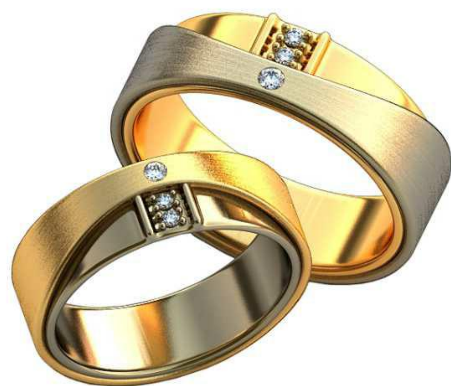
328ж/Р-17,0/Ш-6,0/Т-1,6/Кр 1.6-1шт.,1.3-2шт./Вес-6,6 328м/Р-19,5/Ш-6,8/Т-1,8/Кр 1.6-1шт.,1.3-2шт./Вес-10,0