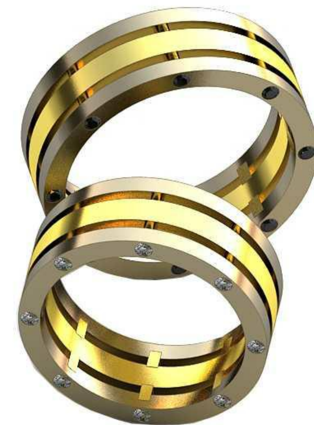
447ж/Р-16/Ш-7,1/Т-1,6/Кр 1.4-15шт./Вес-6,9 447м/Р-18,2/Ш-7,1/Т-1,8/Кр 1.4-16шт./Вес-7,9