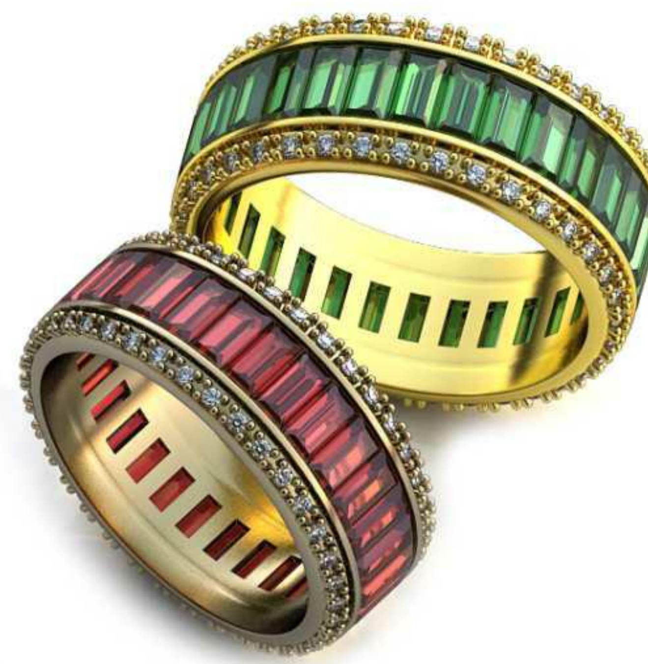
237ж/Р-17,5/Ш-7,8/Т-1,8/Кр 1.0-72шт./Вес-6,2 237м/Р-19,2/Ш-8,4/Т-2,0/Кр 1.0-72шт./Вес-8,0