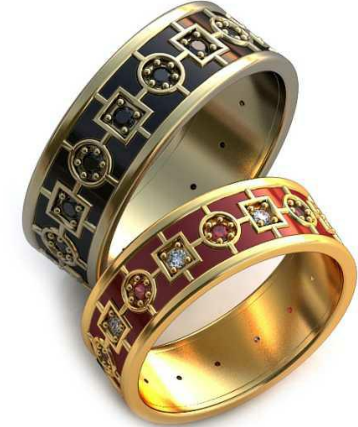
300ж/Р-18,5/Ш-7,0/Т-1,3/Кр 1.6-16шт./Вес-5,7 300м/Р-20,7/Ш-8,0/Т-1,4/Кр 1.8-16шт./Вес-8,2