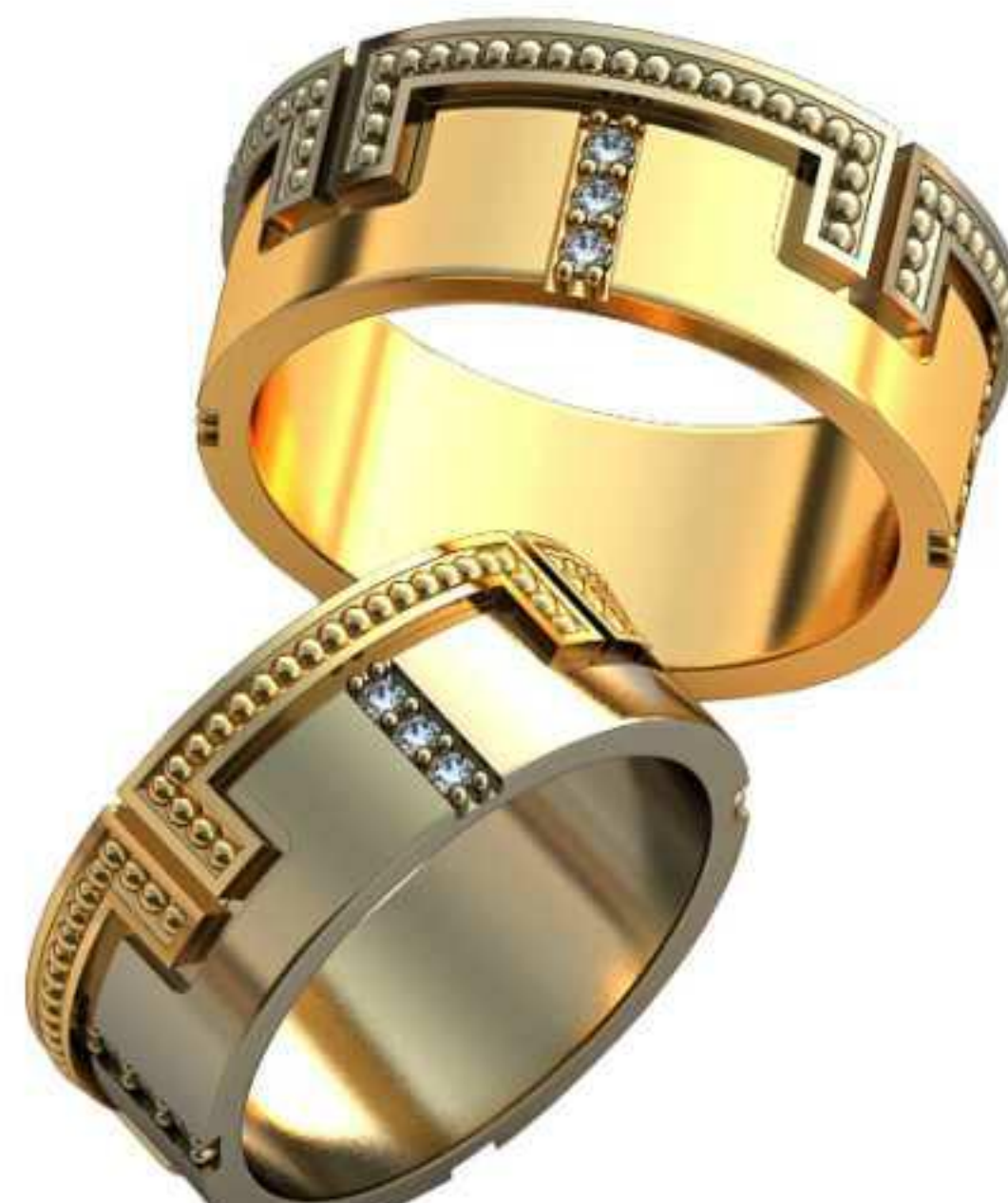
494ж/Р-15/Ш-6,8/Т-1,7/Кр 1.25-12шт./Вес-5,9 494м/Р-16,5/Ш-7,5/Т-1,8/Кр 1.4-12шт./Вес-8,0