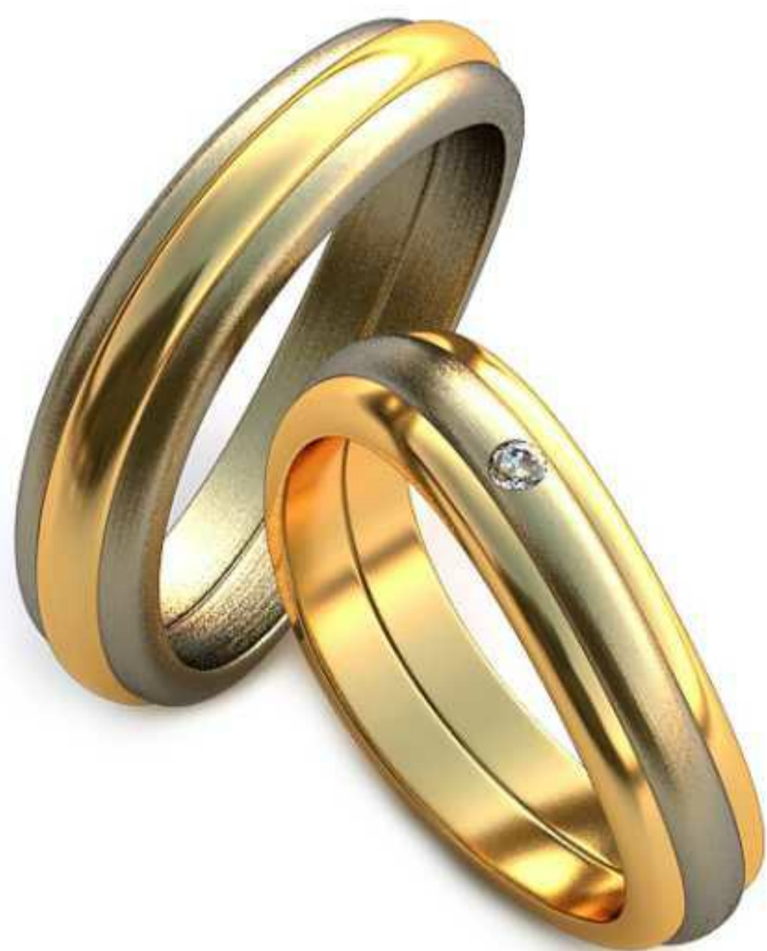
25ж/Р-17,0/Ш-4,6/Т-1,9/Кр 1.8-1шт./Вес-6,9 25м/Р-19,0/Ш-4,9/Т-2,1/Вес-8,4