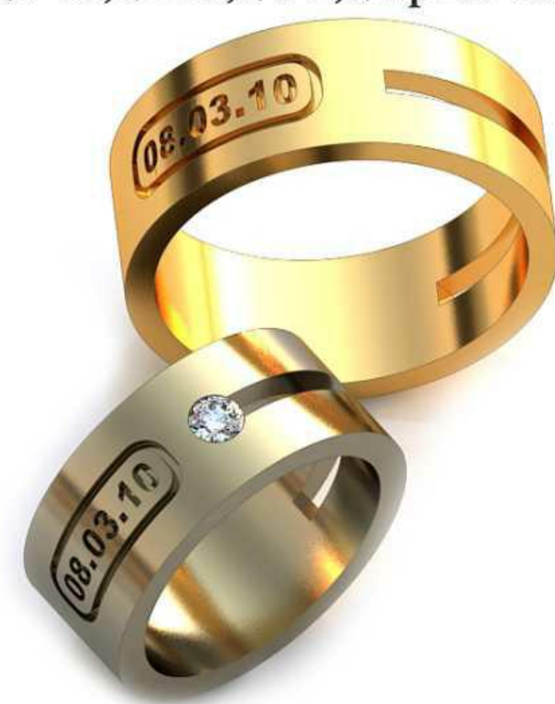
236ж/Р-15,5/Ш-8,0/Т-1,7/Кр 2.9-1шт./Вес-8,8 236м/Р-19,5/Ш-8,0/Т-1,5/Вес-9,8