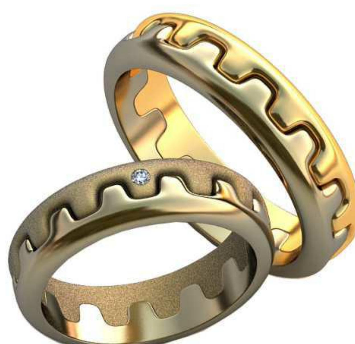
381ж/Р-17,0/Ш-5,5/Т-1,7/Кр 1.5-1шт./Вес-6,3 381м/Р-19,5/Ш-5,5/Т-2,0/Вес-8,4