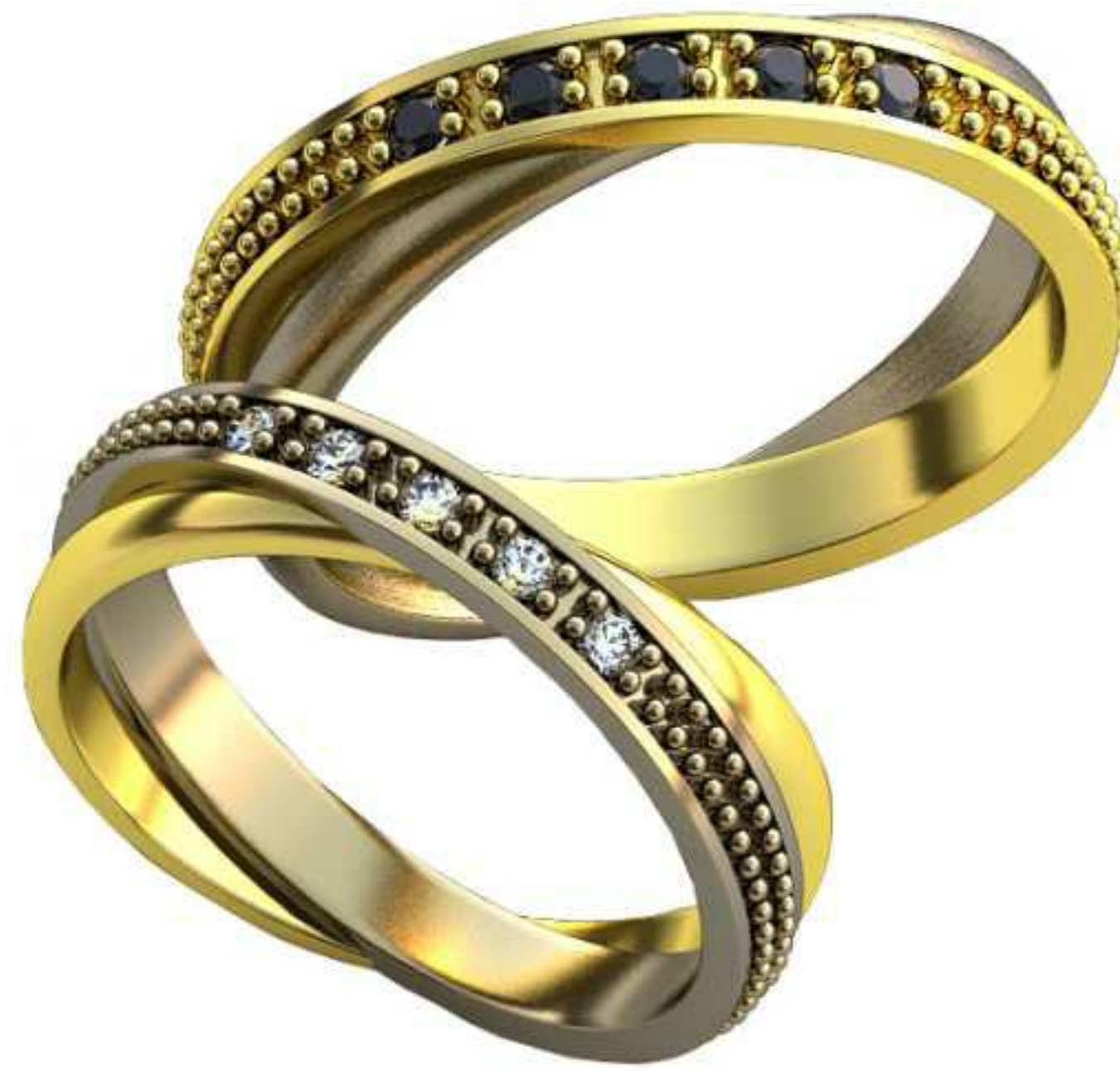
182ж/Р-15,0/Ш-7,5/Т-1,8/Кр 1.5-5шт./Вес-3,2 182м/Р-16,5/Ш-8,45/Т-2,1/Кр 1.7-5шт./Вес-4,3