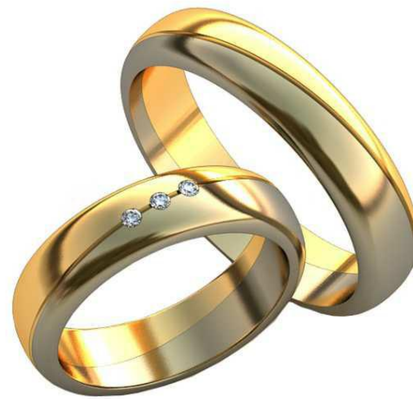
150ж/Р-16,2/Ш-5,0/Т-1,7/Кр 1.4-3шт./Вес-5,4 150м/Р-20,0/Ш-5,0/Т-1,6/Вес-6,2