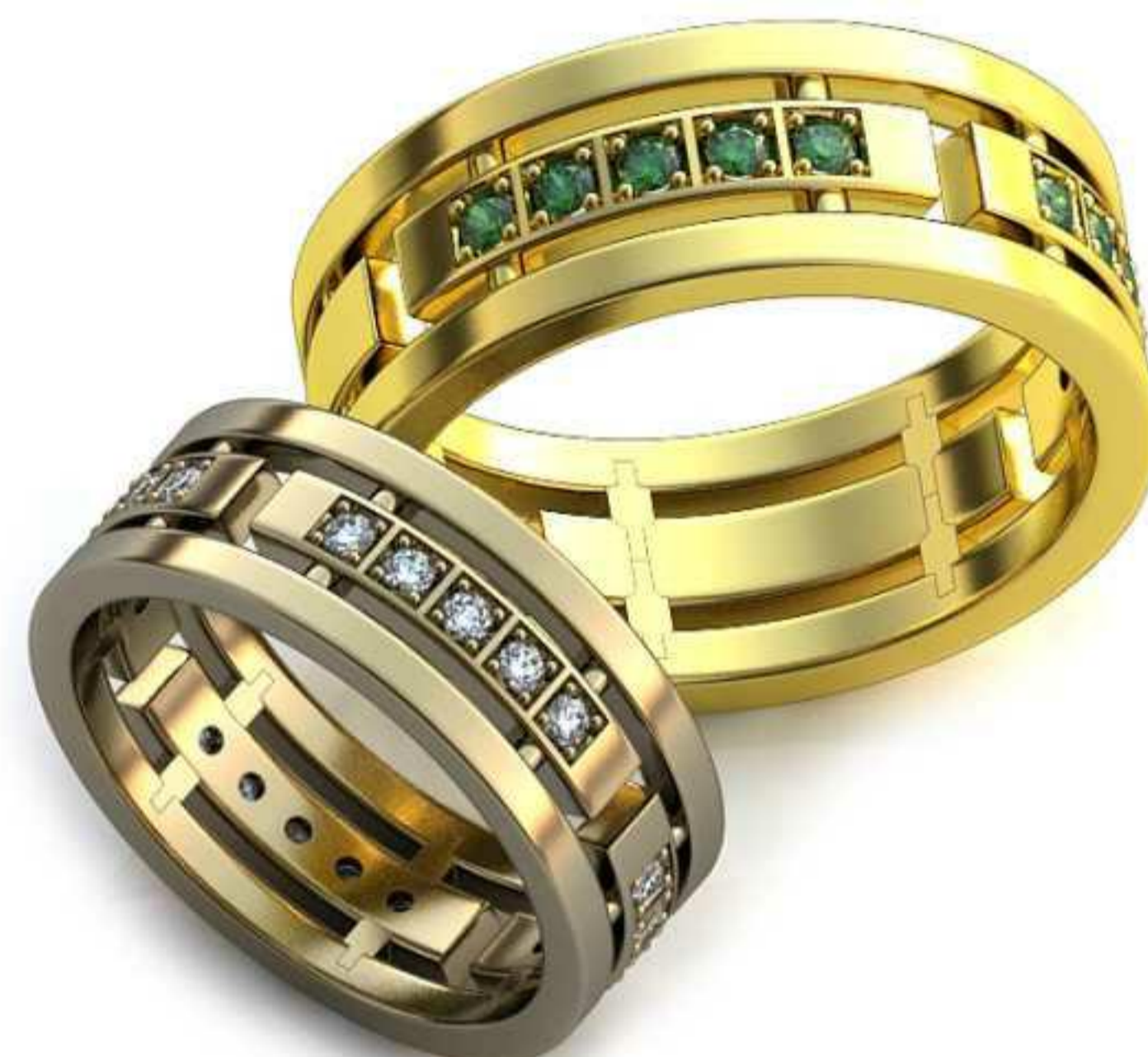
233ж/Р-18,0/Ш-7,4/Т-1,6/Кр 1.5-20шт./Вес-4,4 233м/Р-22,0/Ш-9,0/Т-2,0/Кр 2.0-10шт./Вес-5,4