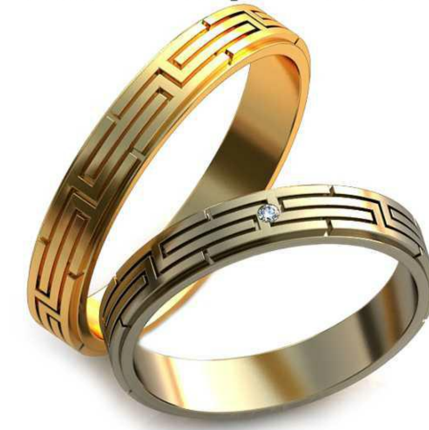
297ж/Р-23,7/Ш-5,2/Т-1,6/Кр 1.75-1шт./Вес-7,8 297м/Р-27,2/Ш-5,2/Т-1,9/Вес-10,3