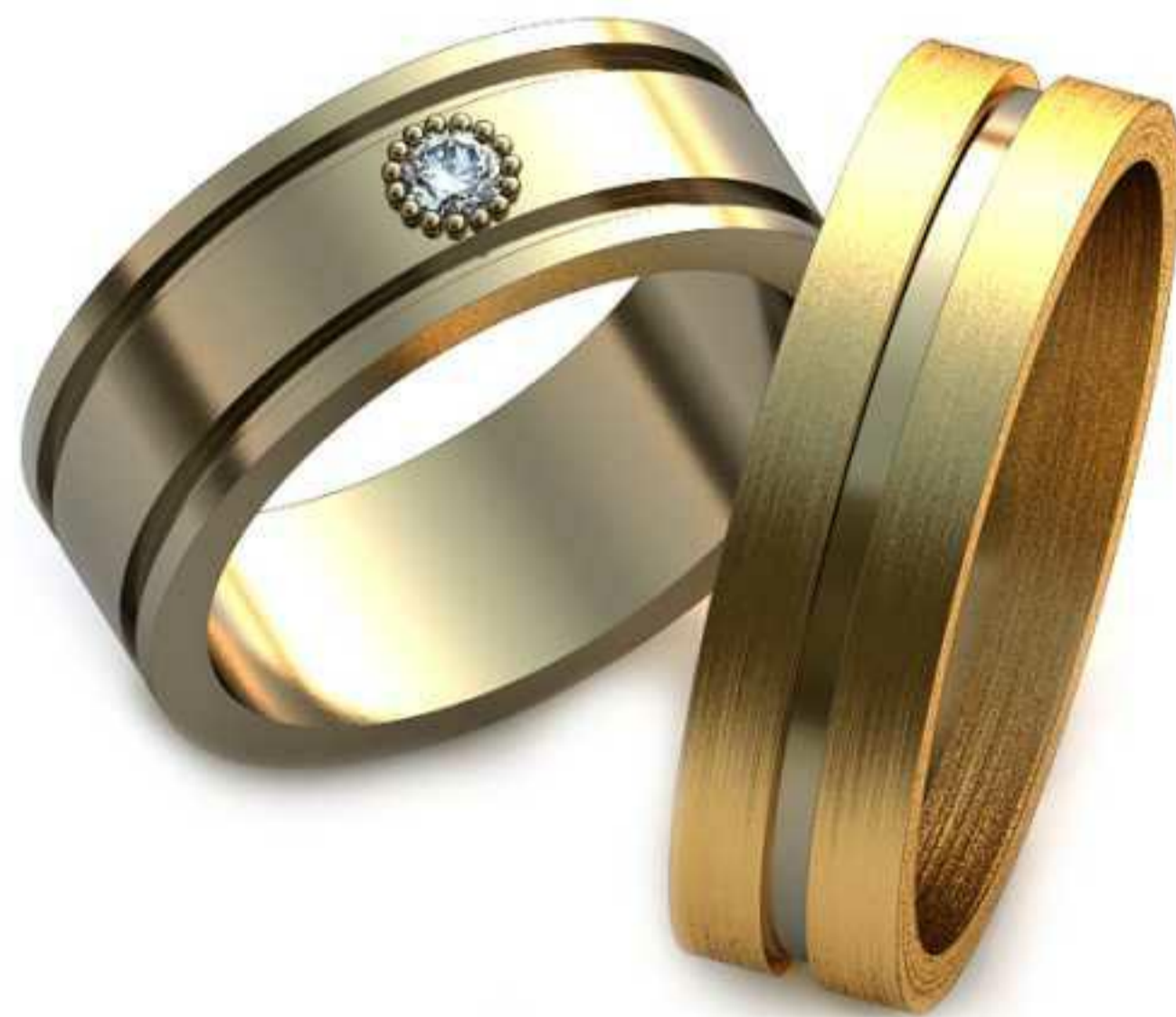
260ж/Р-16,0/Ш-6,4/Т-1,4/Кр 2.4-1шт./Вес-6,1 260м/Р-19,0/Ш-5,5/Т-1,4/Вес-6,0