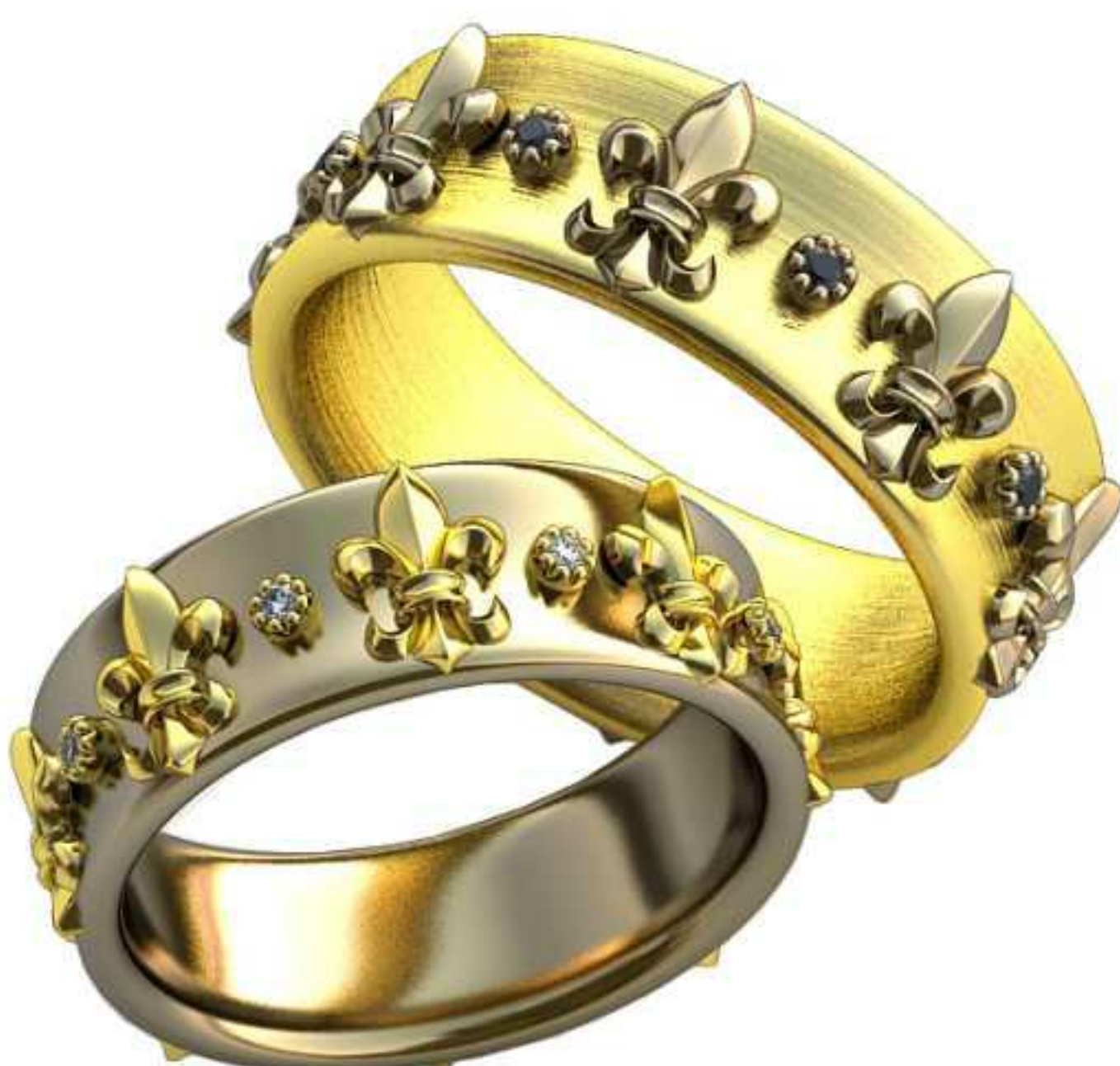
403ж/Р-17,7/Ш-7,0/Т-2,3/Кр 1.2-4шт./Вес-9,2 403м/Р-19,7/Ш-7,8/Т-2,5/Кр 1.4-8шт./Вес-12,8