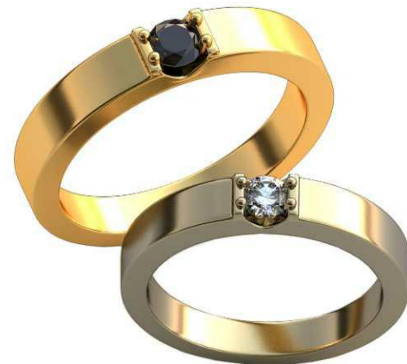
471ж/Р-17/Ш-3,7/Т-2/Кр 3.6-1шт./Вес-5,1 471м/Р-19,2/Ш-4,2/Т-2,2/Кр 4.0-1шт./Вес-7,3