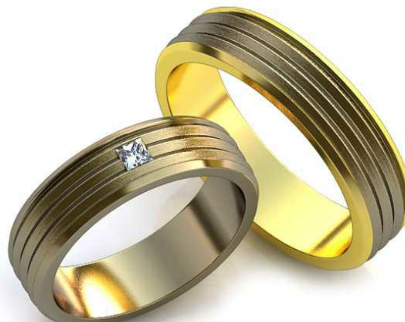
11ж/Р-17/Ш-5,3/Т-1,5/Пр 2.3x2.3-1шт./Вес-5,5 11м/Р-19,5/Ш-5,5/Т-1,8/Вес-7,5