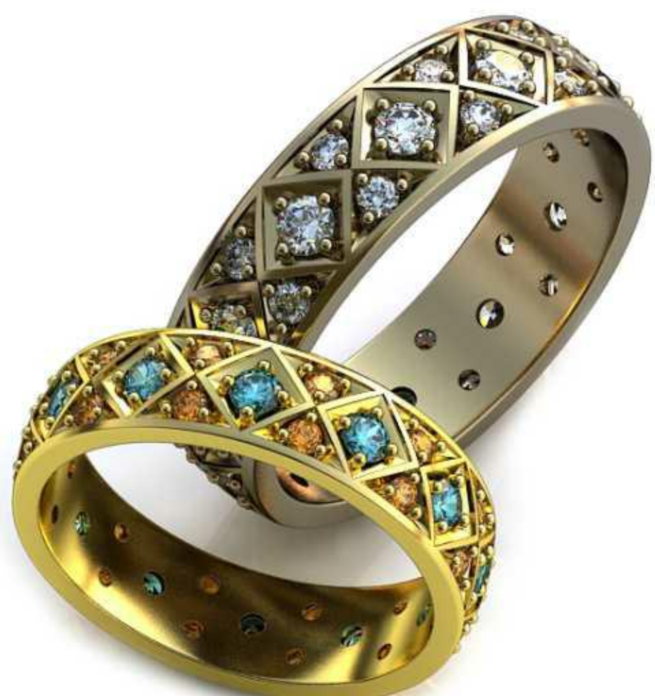
217ж/Р-19,5/Ш-5,8/Т-1,7/Кр 2.5-12шт.,1.7-24шт./Вес-5,6 217м/Р-16,5/Ш-5,0/Т-1,5/Кр 2.5-12шт.,1.7-24шт./Вес-3,5