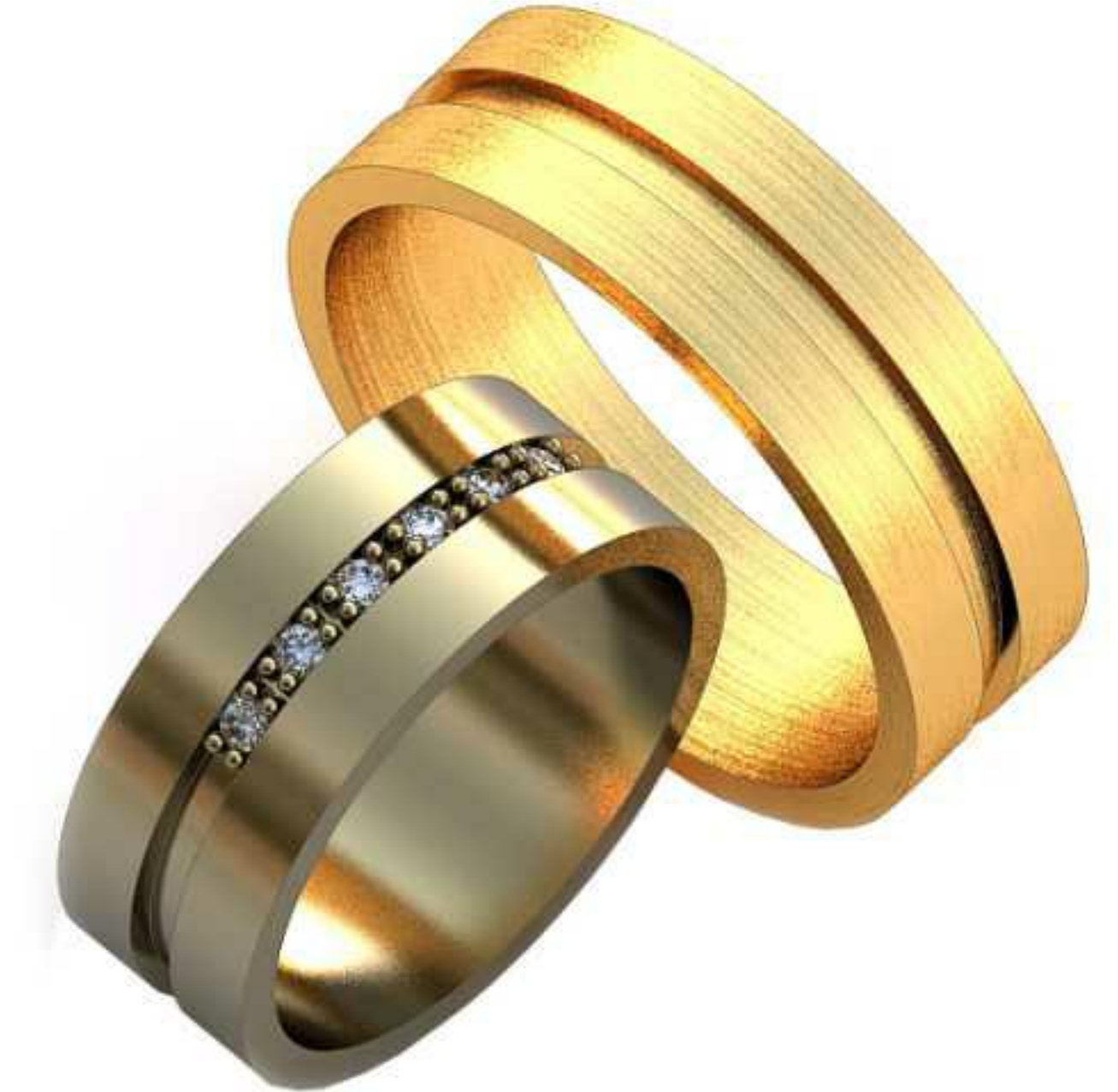
135ж/Р-16,5/Ш-7,0/Т-1,3/Кр 1.5-6шт./Вес-6,0 135м/Р-20,5/Ш-7,0/Т-1,4/Вес-8,0