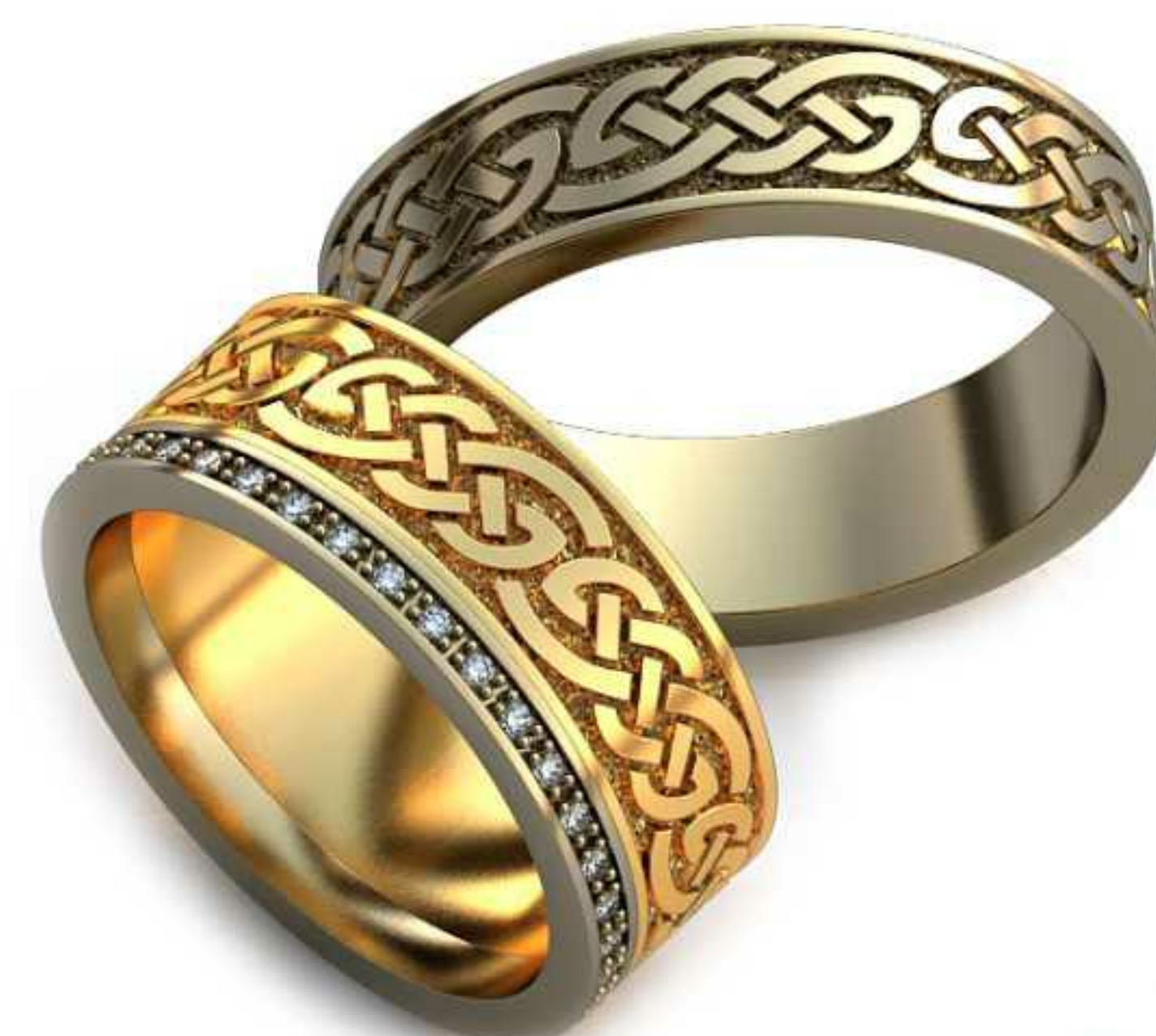
276ж/Р-18,0/Ш-7,9/Т-1,7/Кр 1.0-36шт./Вес-11,6 276м/Р-20,0/Ш-6,0/Т-1,8/Вес-11,6