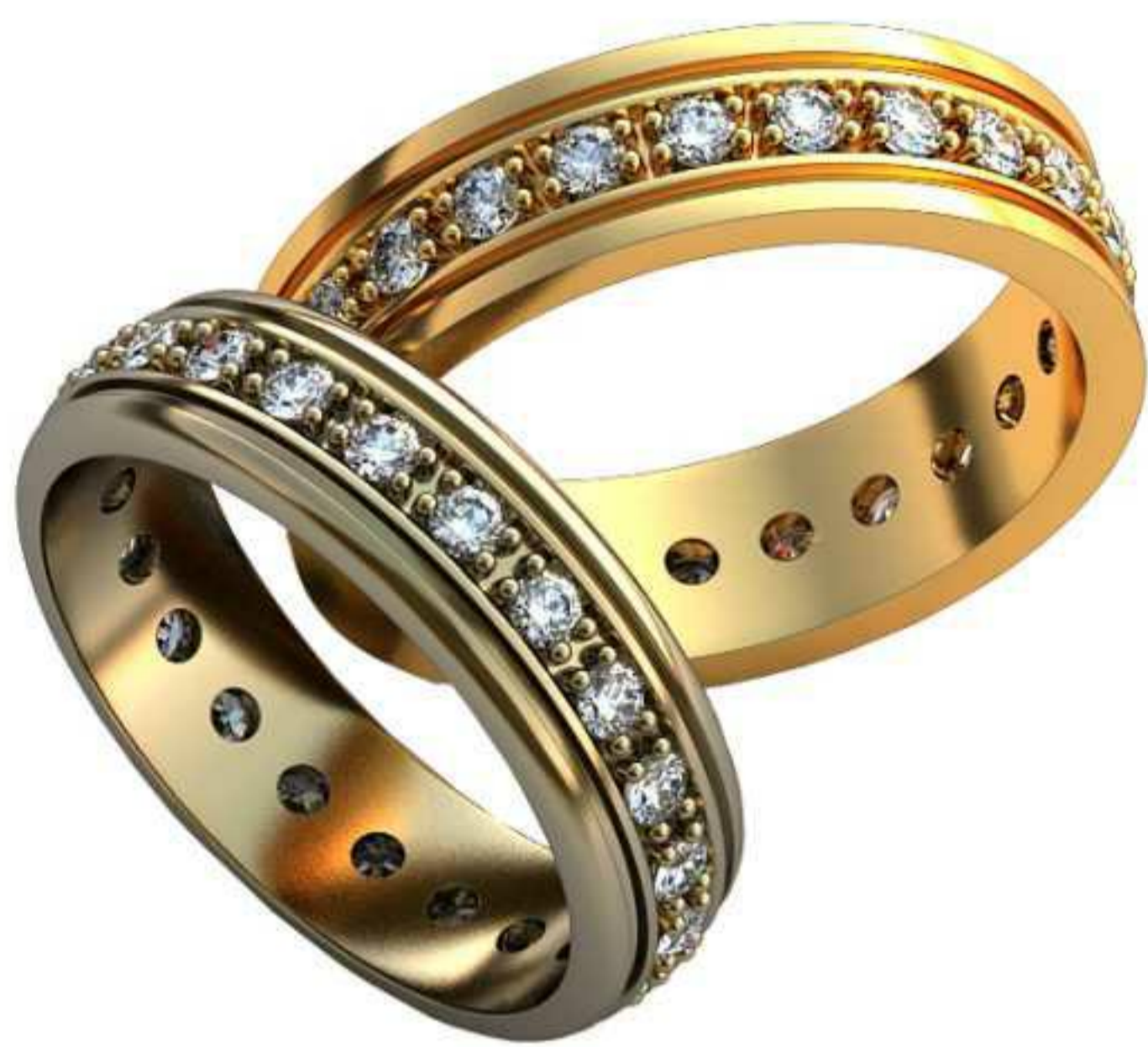
145ж/Р-17,2/Ш-5,4/Т-1,5/Кр 1.2-22шт./Вес-4,2 145м/Р-18,2/Ш-5,4/Т-1,5/Кр 2.0-24шт./Вес-5,4