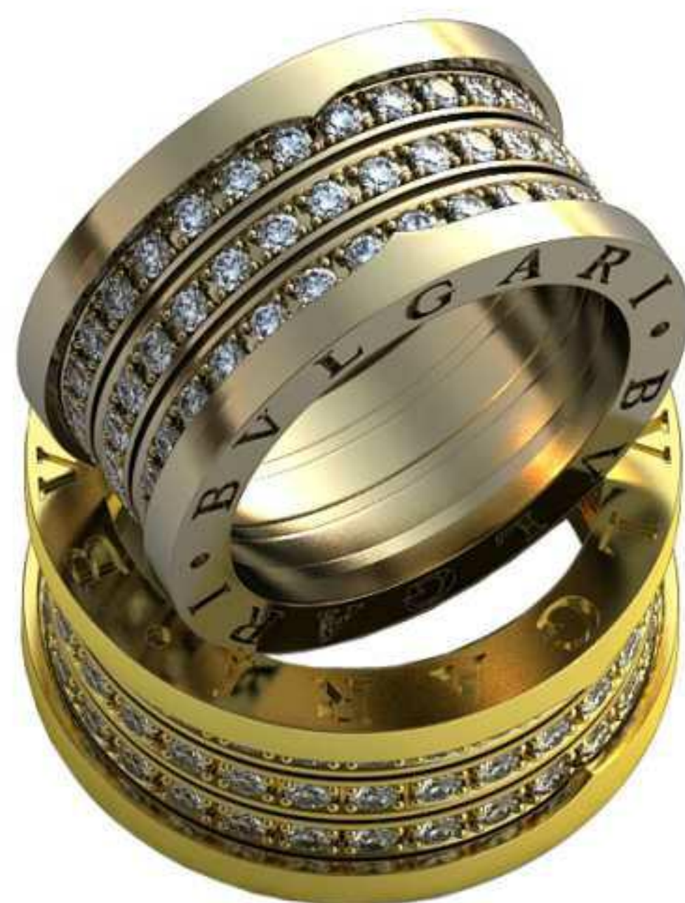
193ж/Р-18,7/Ш-12,1/Т-2,9/Кр 1.8-87шт./Вес-14,2 193м/Р-17,5/Ш-11,2/Т-2,6/Кр 1.8-87шт./Вес-18,1