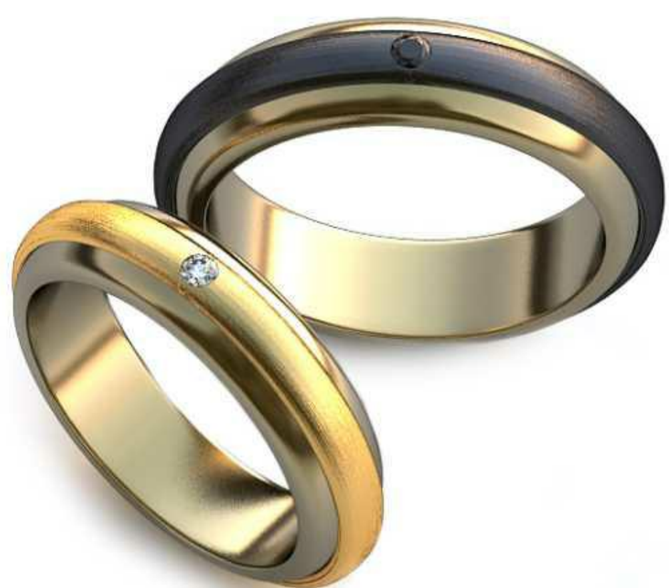
22ж/Р-17,0/Ш-5,0/Т-2,3/Кр 1.75-1шт./Вес-2,9 22м/Р-19,0/Ш-5,5/Т-2,6/Кр 1.75-1шт./Вес-3,7