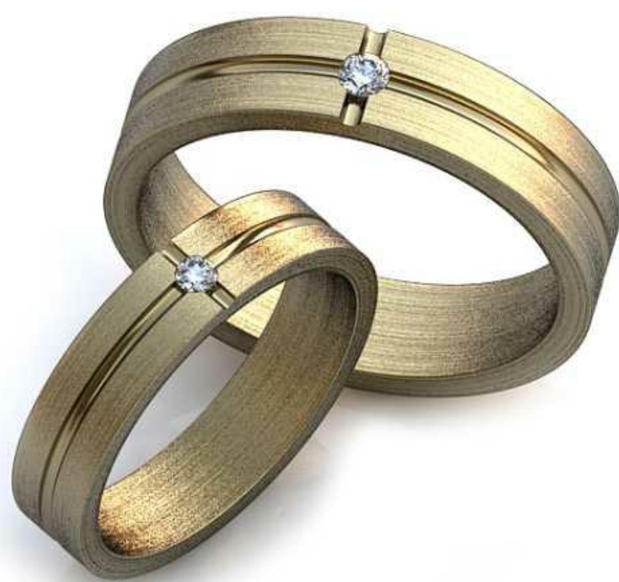
07ж/Р-16,2/Ш-4,3/Т-1,3/Кр 1.9-1шт./Вес-3,8 07м/Р-19,5/Ш-5,0/Т-1,5/Кр 2.3-1шт./Вес-6,6