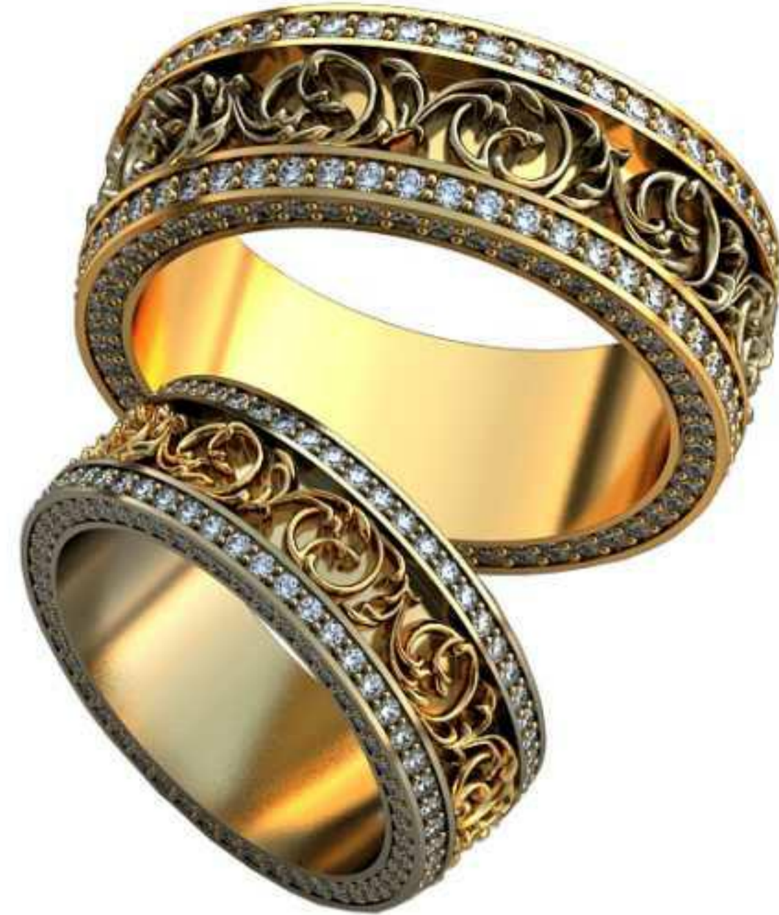
437ж/Р-17/Ш-7,3/Т-2,1/Кр 1,1-206шт./Вес-8,6 437м/Р-21/Ш-9/Т-2,6/Кр 1,35-204шт./Вес-16,5