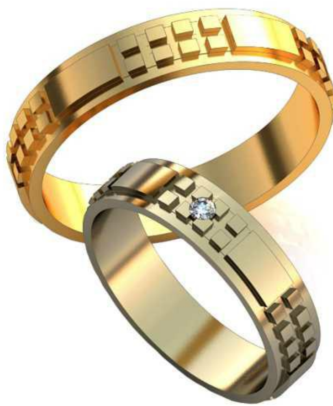
191ж/Р-18,5/Ш-5,0/Т-1,4/Кр 2.0-1шт./Вес-4,3 191м/Р-22,5/Ш-5,0/Т-1,6/Вес-6,4