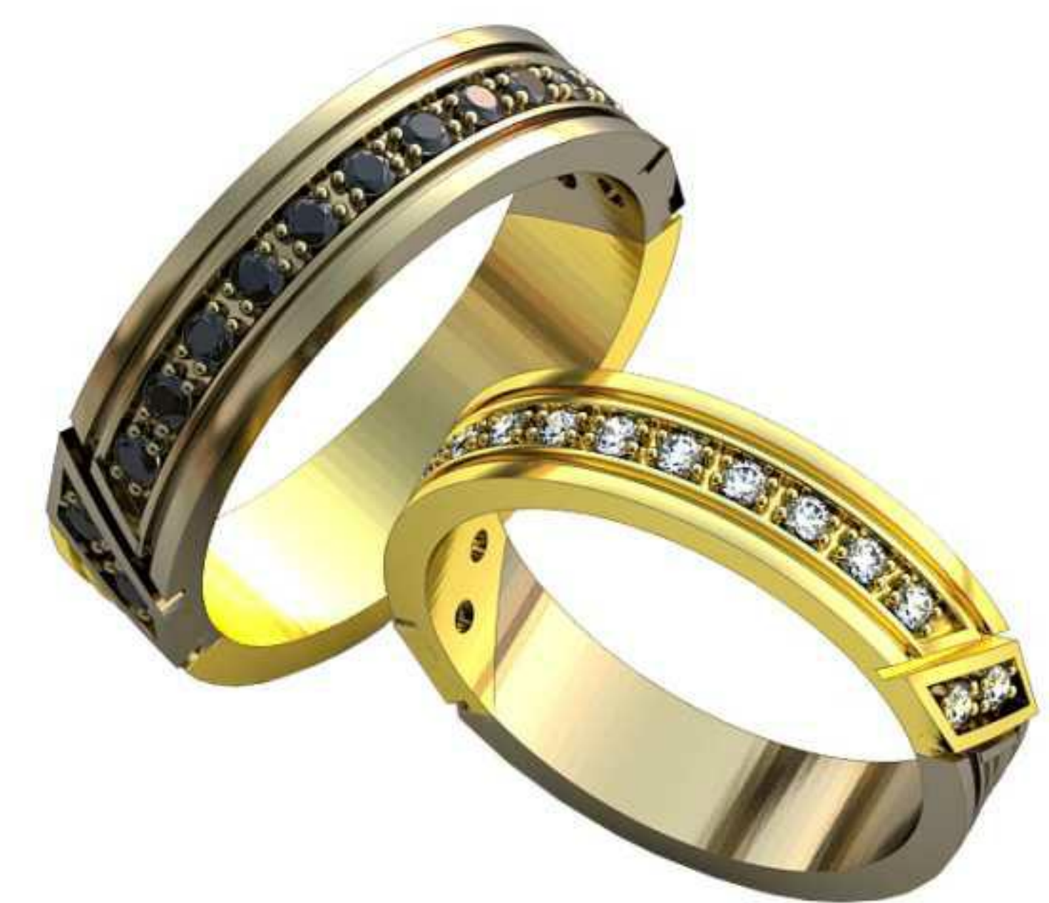
162ж/Р-19,2/Ш-5,0/Т-2,0/Кр 1.7-15шт./Вес-5,9 162м/Р-21,0/Ш-6,0/Т-2,0/Кр 1.7-15шт./Вес-8,2