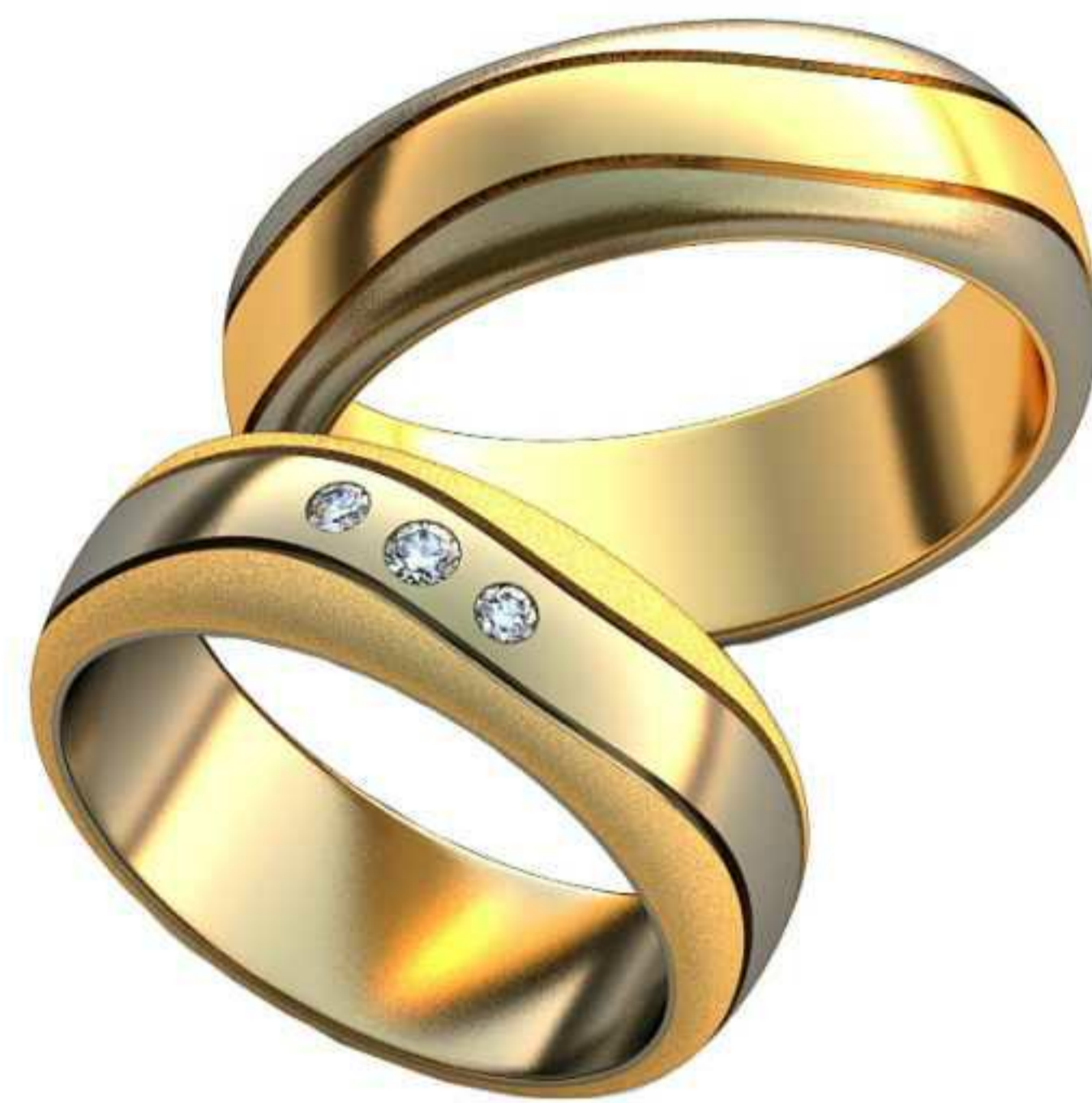
327ж/Р-18,0/Ш-6,6/Т-1,6/Кр 2.0-1шт.,1.7-2шт./Вес-8,9 327м/Р-19,5/Ш-6,5/Т-1,8/Вес-10,7