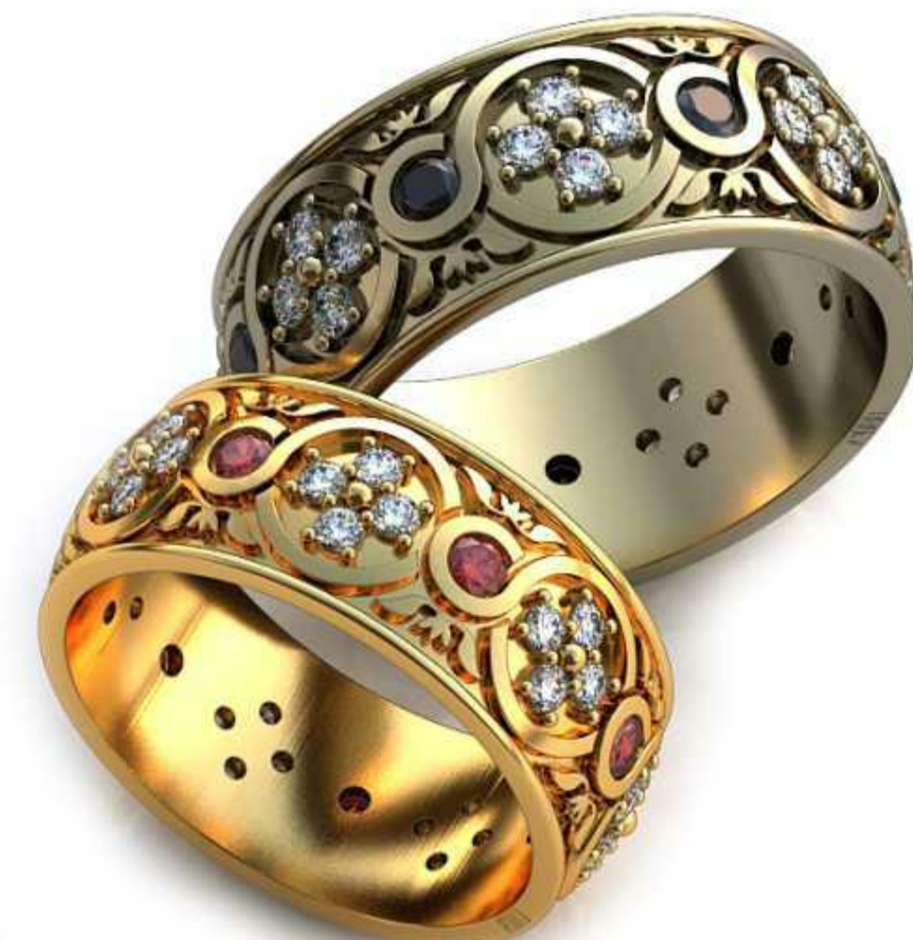
294ж/Р-19,2/Ш-8,7/Т-2,0/Кр 2.4-8шт.,1.7-32шт./Вес-9,2 294м/Р-21,2/Ш-9,7/Т-2,1/Кр 2.7-7шт.,2.0-28шт./Вес-12,4