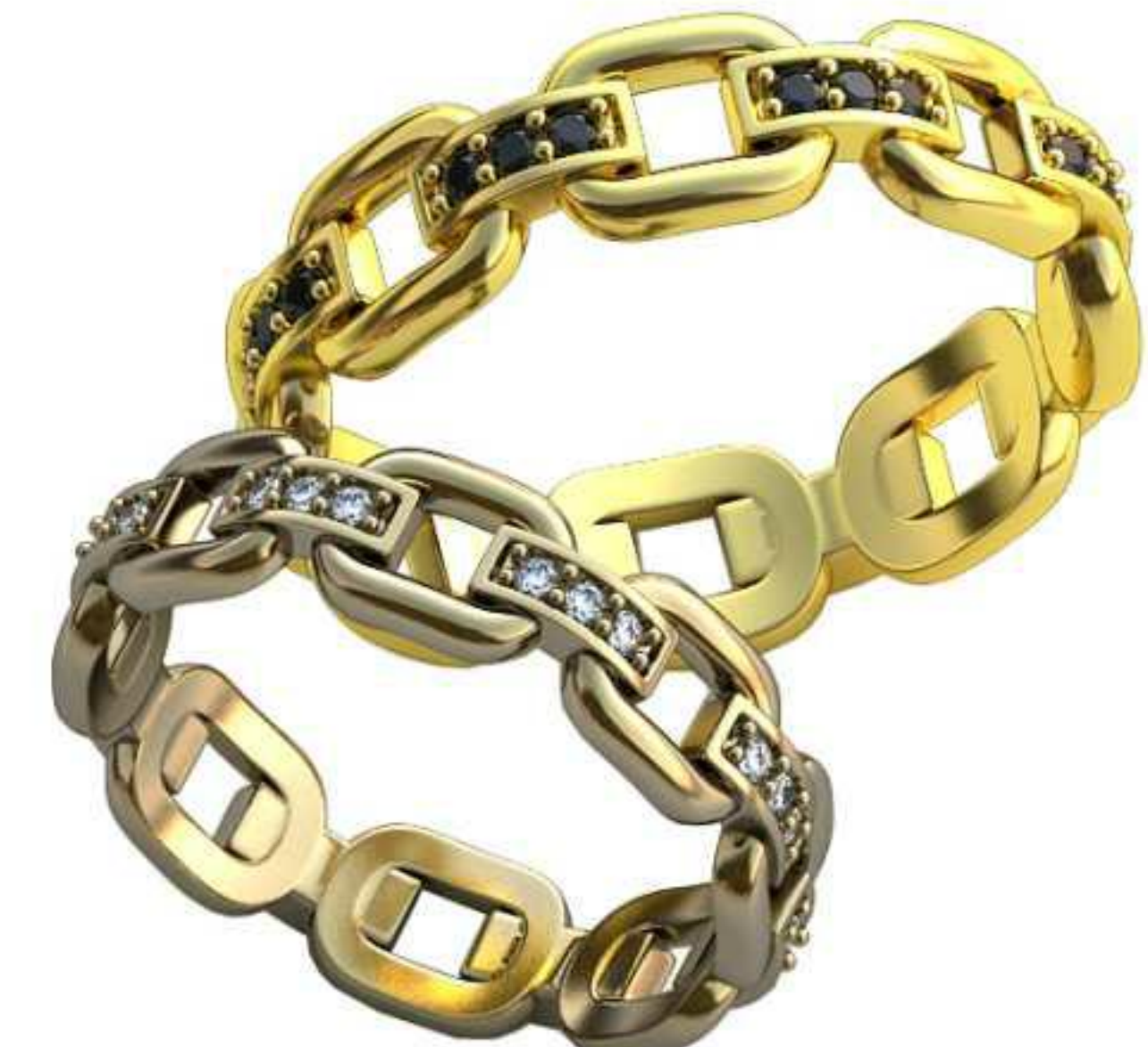
396ж/Р-17,5/Ш-5,1/Т-1,2/Кр 1.2-24шт./Вес-3,2 396м/Р-20,0/Ш-5,8/Т-1,4/Кр 1.2-24шт./Вес-4,8