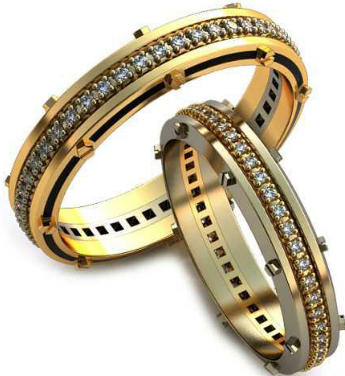
94ж/Р-19,5/Ш-4,8/Т-1,8/Кр 1.1-45шт./Вес-5,0 94м/Р-22,0/Ш-5,3/Т-2,0/Кр 1.1-45шт./Вес-7,2