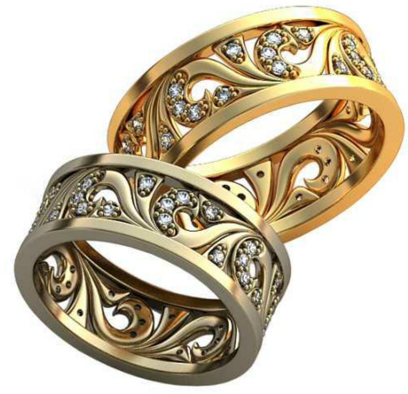
363ж/Р-18,5/Ш-8,0/Т-1,7/Кр 1,2-40шт./Вес-7,0 363м/Р-20,0/Ш-8,7/Т-1,8/Кр 1,2-40шт./Вес-8,8