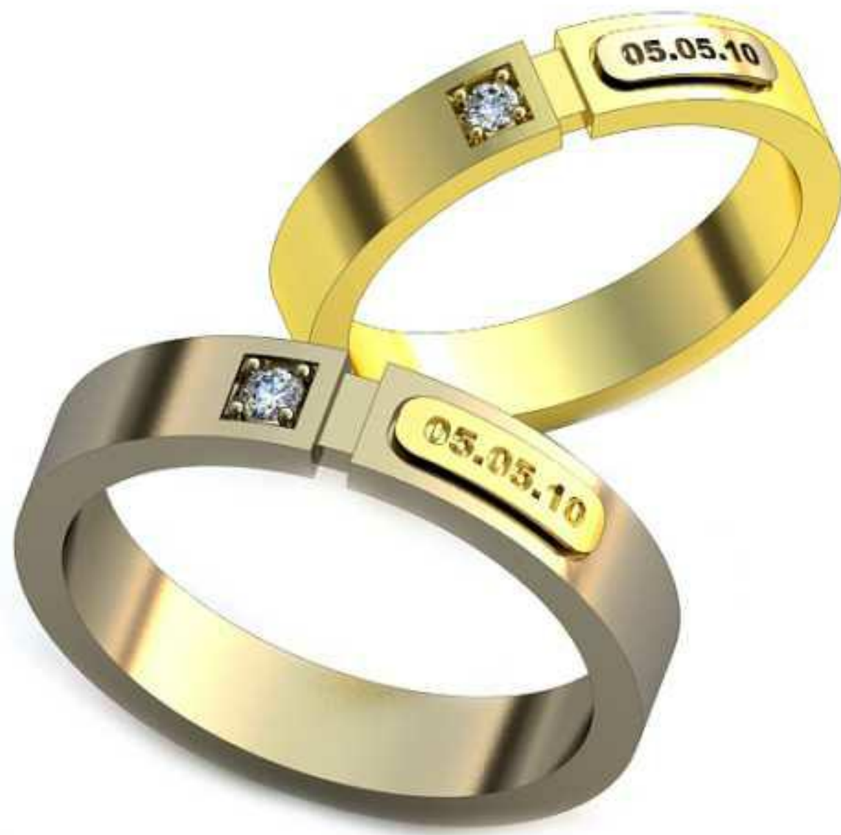
130ж/Р-19,5/Ш-4,3/Т-1,7/Кр 2.1-1шт./Вес-6,6 130м/Р-22,5/Ш-5,0/Т-2,0/Кр 2.6-1шт./Вес-10,1