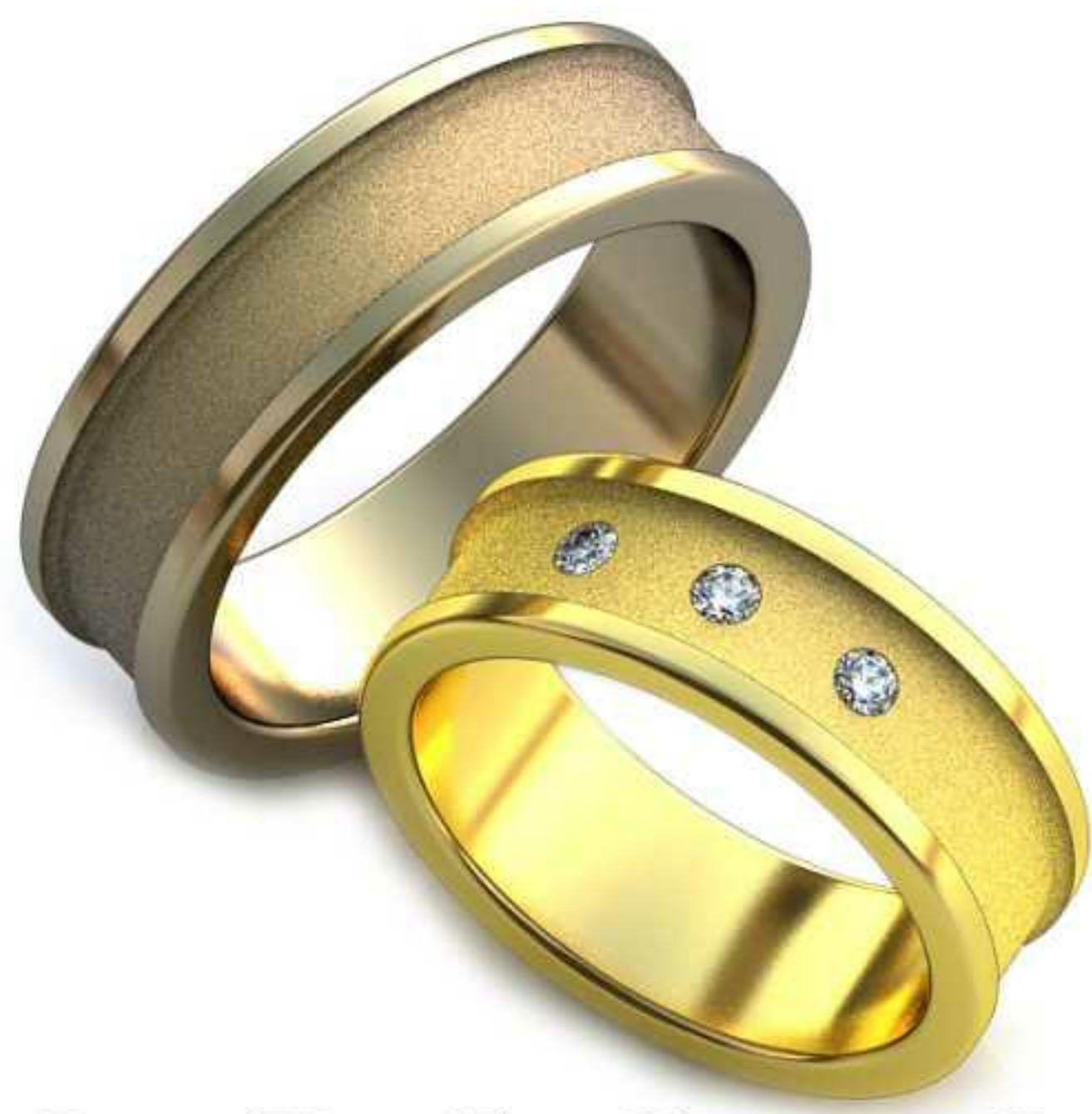
61ж/Р-17,0/Ш-7,0/Т-1,8/Кр 2.0-3шт./Вес-7,9 61м/Р-19,5/Ш-7,0/Т-2,0/Вес-10,6