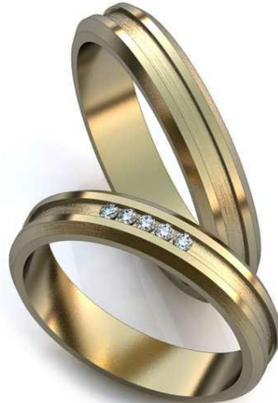
05ж/Р-17,0/Ш-4,0/Т-1,4/Кр 1.15-5шт./Вес-3,5 05м/Р-18,1/Ш-4,0/Т-1,5/Вес-4,3